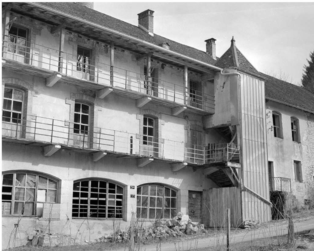
Façade de l'atelier de fabrication avec escalier hors oeuvre.

39, Clairvaux-les-Lacs, lieudit : la Vieille Foule