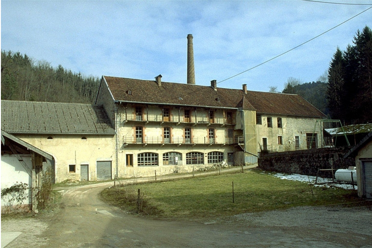
Au second plan de gauche à droite : parties agricoles, atelier de fabrication et logement, remise à automobile.

39, Clairvaux-les-Lacs, lieudit : la Vieille Foule