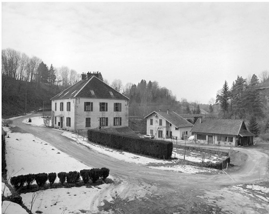
Vue depuis le sud-est. De gauche à droite : logement patronal, logement et entrepôt industriel. 39, Clairvaux-les-Lacs, lieudit : la Vieille Foule