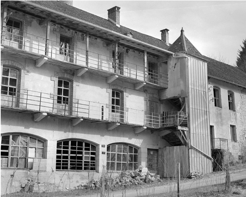
Façade de l'atelier de fabrication avec escalier hors oeuvre.

39, Clairvaux-les-Lacs, lieudit : la Vieille Foule