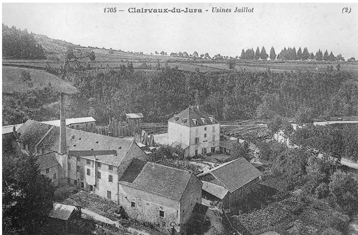
Clairvaux-du-Jura - Usines Jaillot.

39, Clairvaux-les-Lacs, lieudit : la Vieille Foule