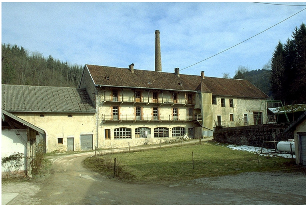
Au second plan de gauche à droite : parties agricoles, atelier de fabrication et logement, remise à automobile. 39, Clairvaux-les-Lacs, lieudit : la Vieille Foule