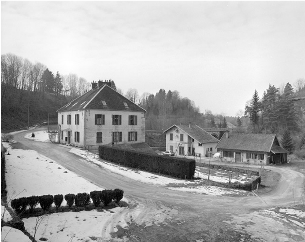
Vue depuis le sud-est. De gauche à droite : logement patronal, logement et entrepôt industriel.

39, Clairvaux-les-Lacs, lieudit : la Vieille Foule