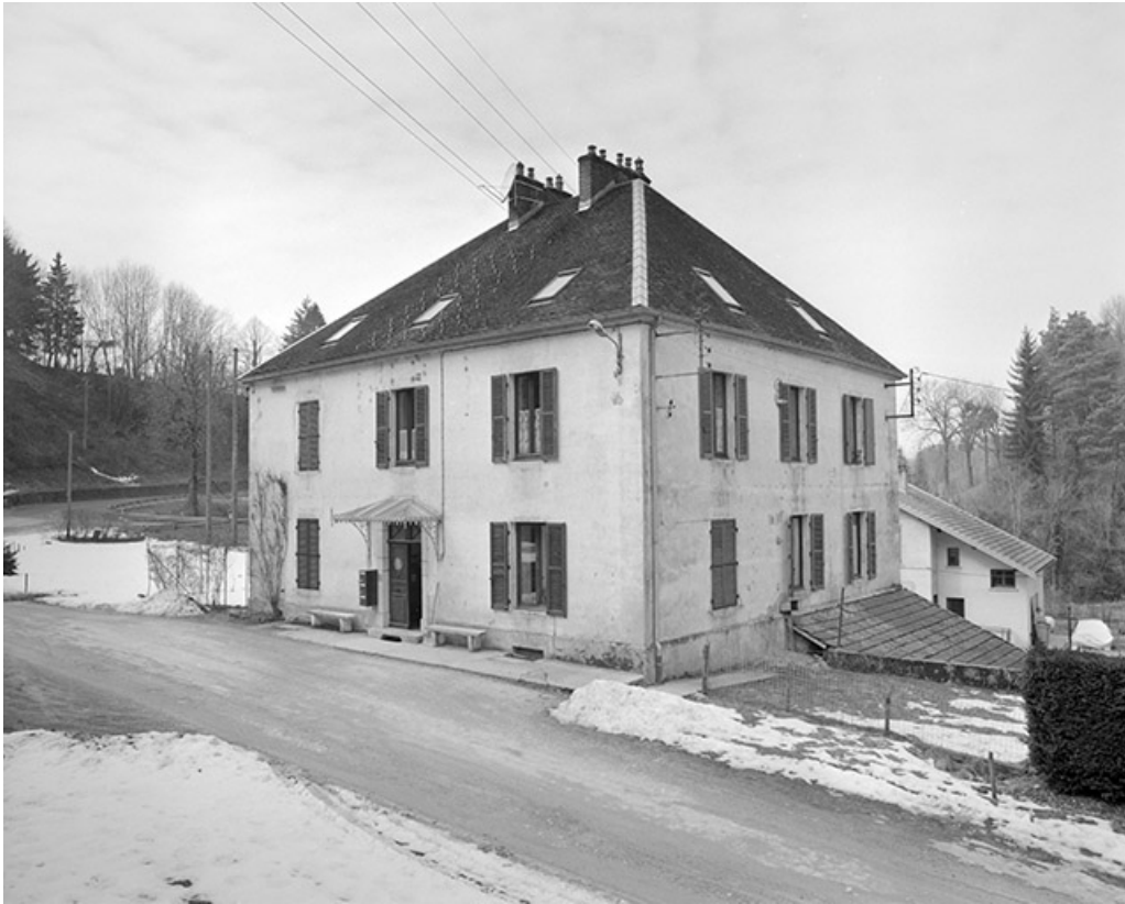
Logement patronal vu de trois quarts droit.

39, Clairvaux-les-Lacs, lieudit : la Vieille Foule