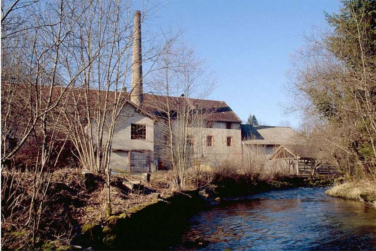
Façades postérieures de l'usine depuis l'est.

39, Clairvaux-les-Lacs, lieudit : la Vieille Foule