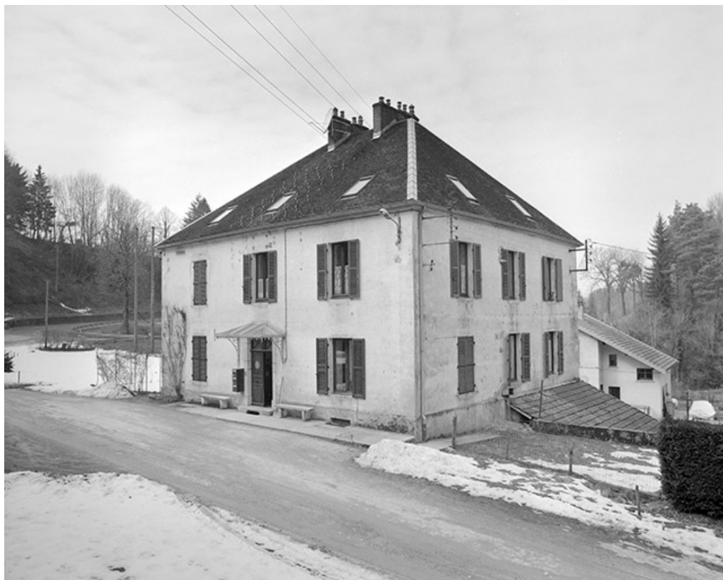
Logement patronal vu de trois quarts droit. 39, Clairvaux-les-Lacs, lieudit : la Vieille Foule