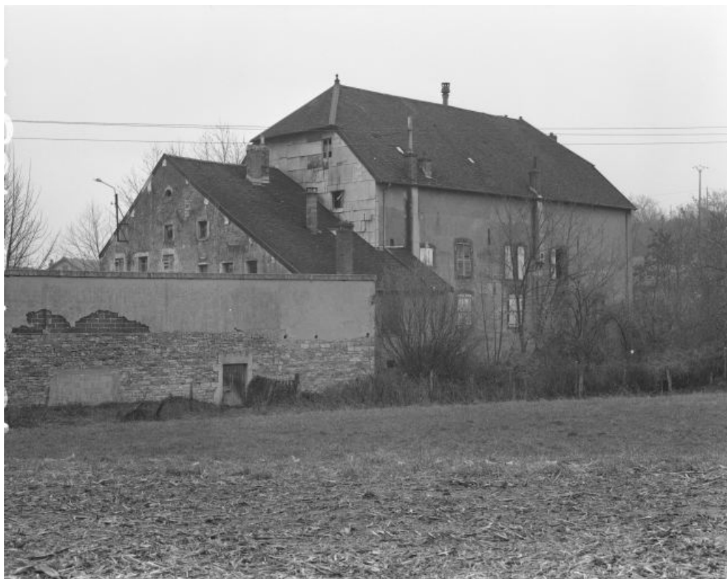
Vue du moulin depuis le sud-ouest.