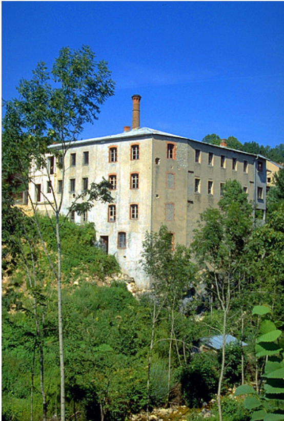
Partie ancienne (atelier de fabrication et bureau). 39, Villards-d'Héria