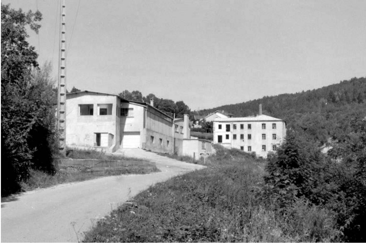
Partie récente (magasin industriel et atelier de fabrication).