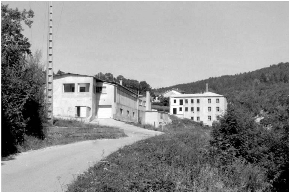
Partie récente (magasin industriel et atelier de fabrication).