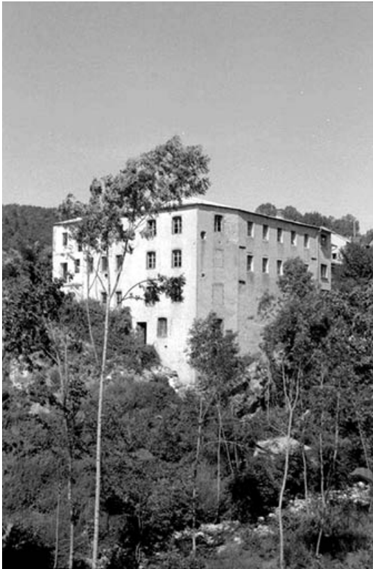
Partie ancienne (atelier de fabrication et bureau). 39, Villards-d'Héria