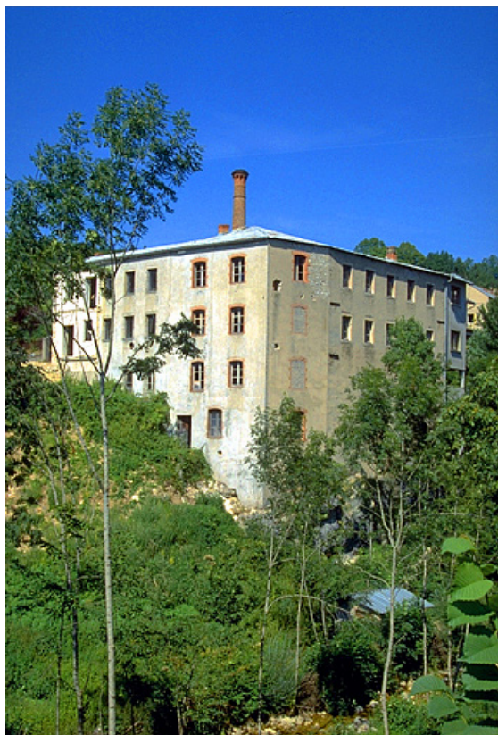
Partie ancienne (atelier de fabrication et bureau). 39, Villards-d'Héria