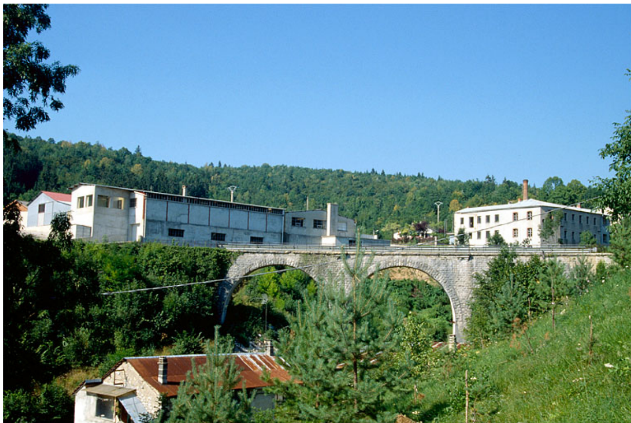
Vue d'ensemble depuis le sud. 39, Villards-d'Héria