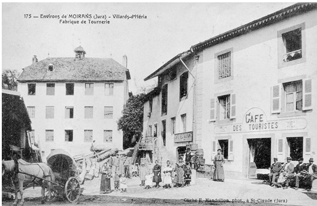
Environs de Moirans (Jura) - Villards-d'Héria. Fabrique de Tournerie.