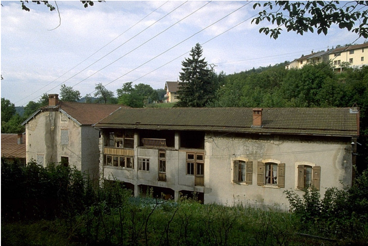
Ancienne tournerie, atelier de fabrication et logement.