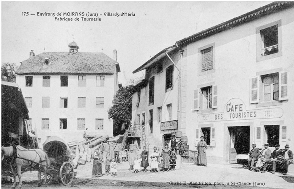
Environs de Moirans (Jura) - Villards-d'Héria. Fabrique de Tournerie. 39, Villards-d'Héria rue du Viaduc