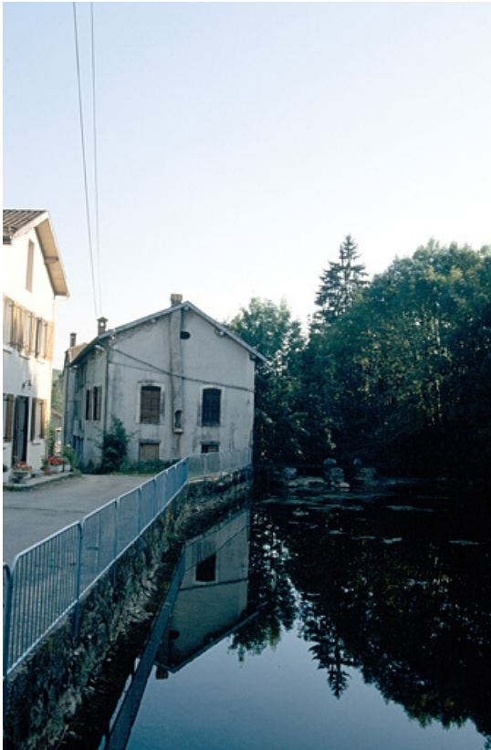
Logement vu du nord.