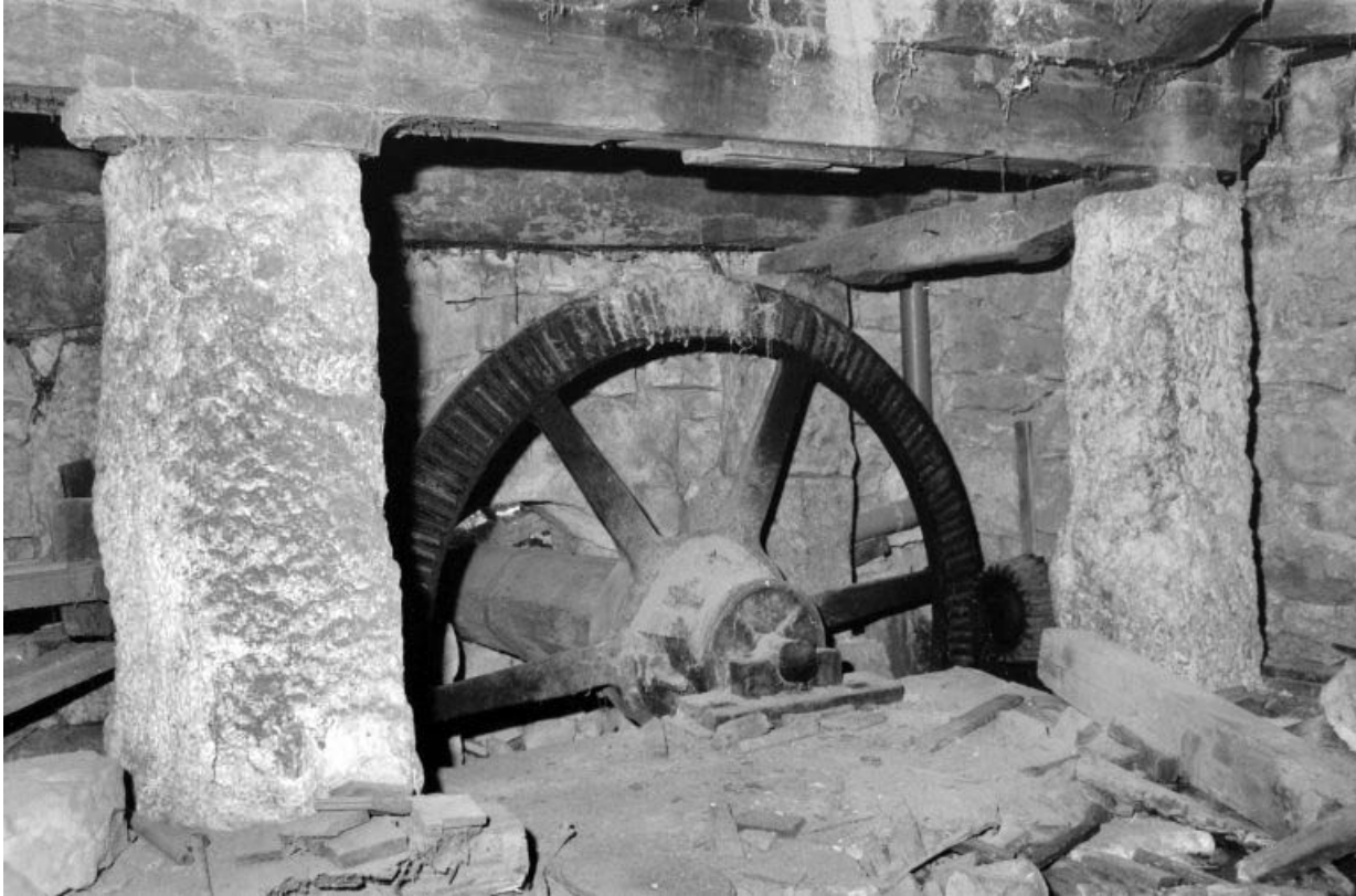
Transmission d'une roue hydraulique (2e étage de soubassement). 39, Villards-d'Héria