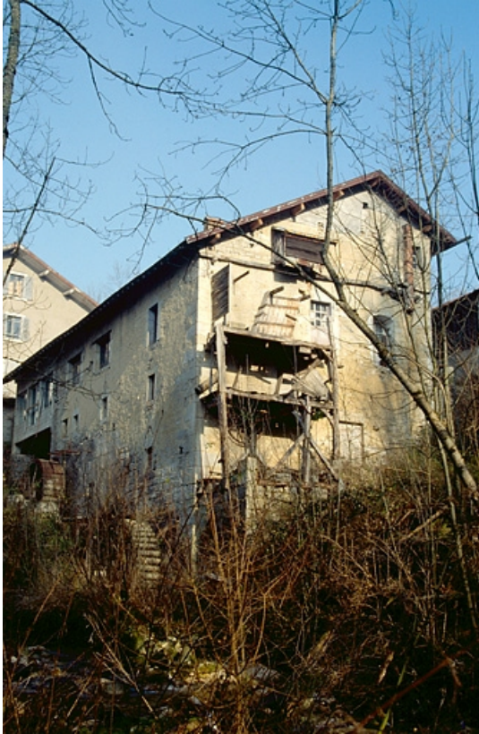
Façades postérieure et latérale gauche des ateliers de fabrication (cadrage vertical). 39, Villards-d'Héria