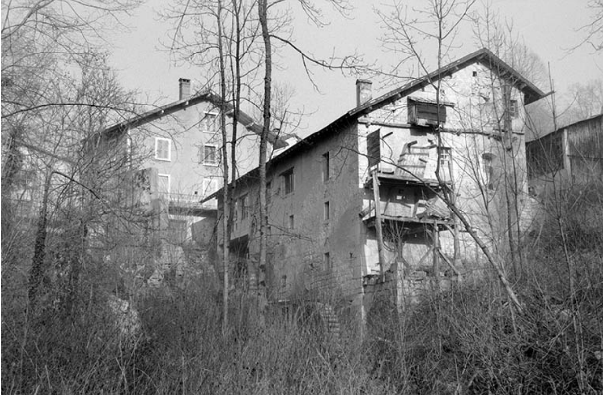
Façades postérieure et latérale gauche des ateliers de fabrication.