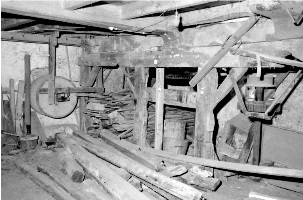
Tonneau de polissage et transmission (2e étage de soubassement). 39, Villards-d'Héria