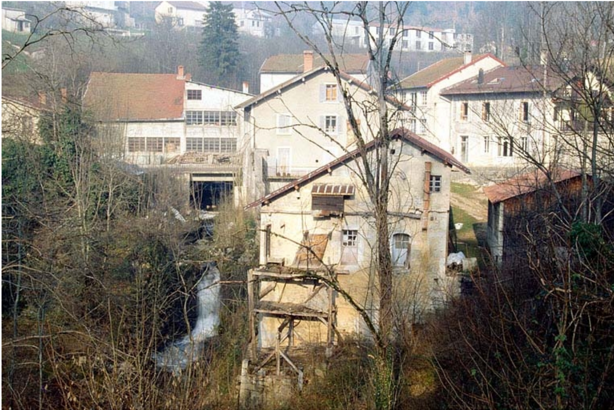
Vue d'ensemble depuis l'aval.