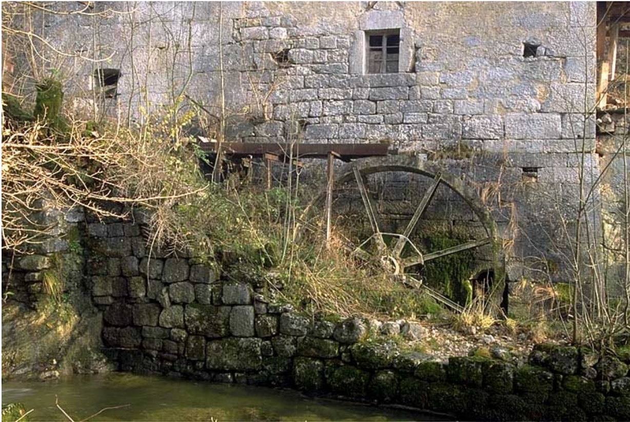
Roue hydraulique verticale aval.