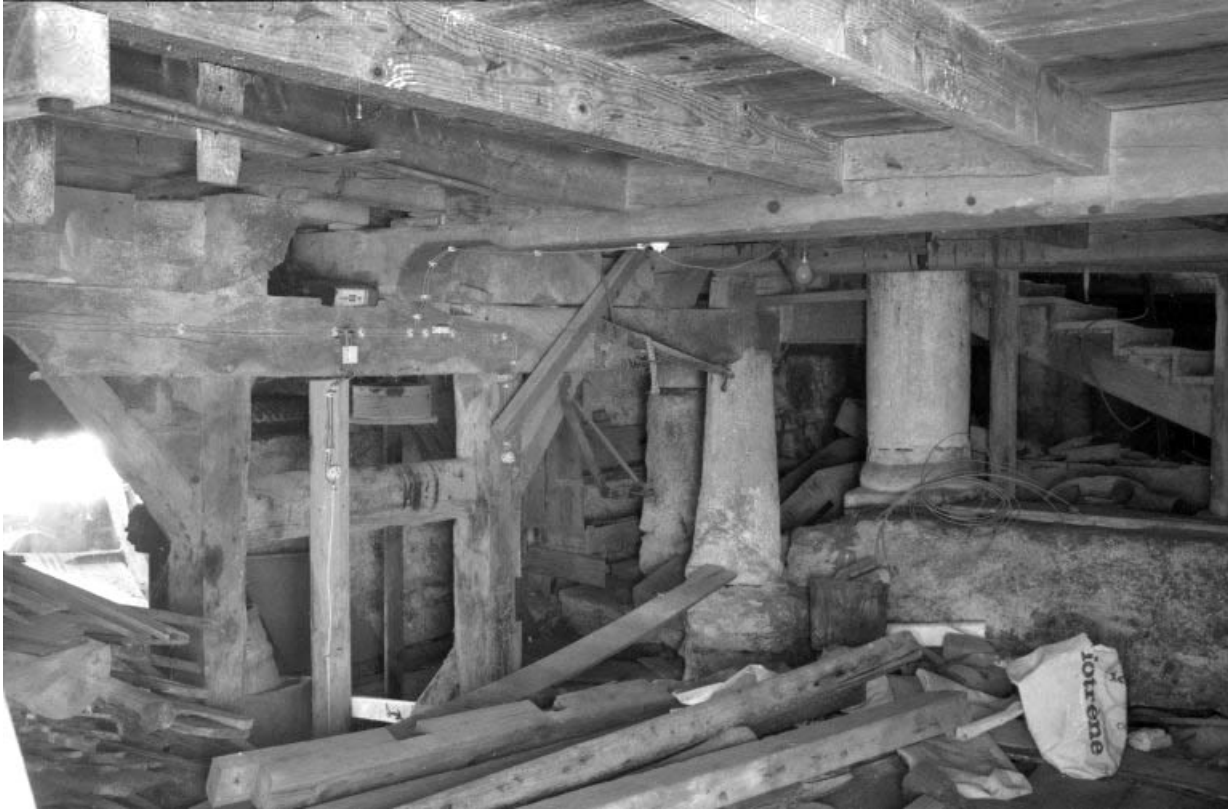
Transmission, support des meules et colonnes (2e étage de soubassement). 39, Villards-d'Héria