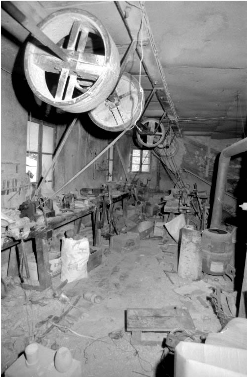
Intérieur de l'atelier de tournerie (étage en surcroît). 39, Villards-d'Héria