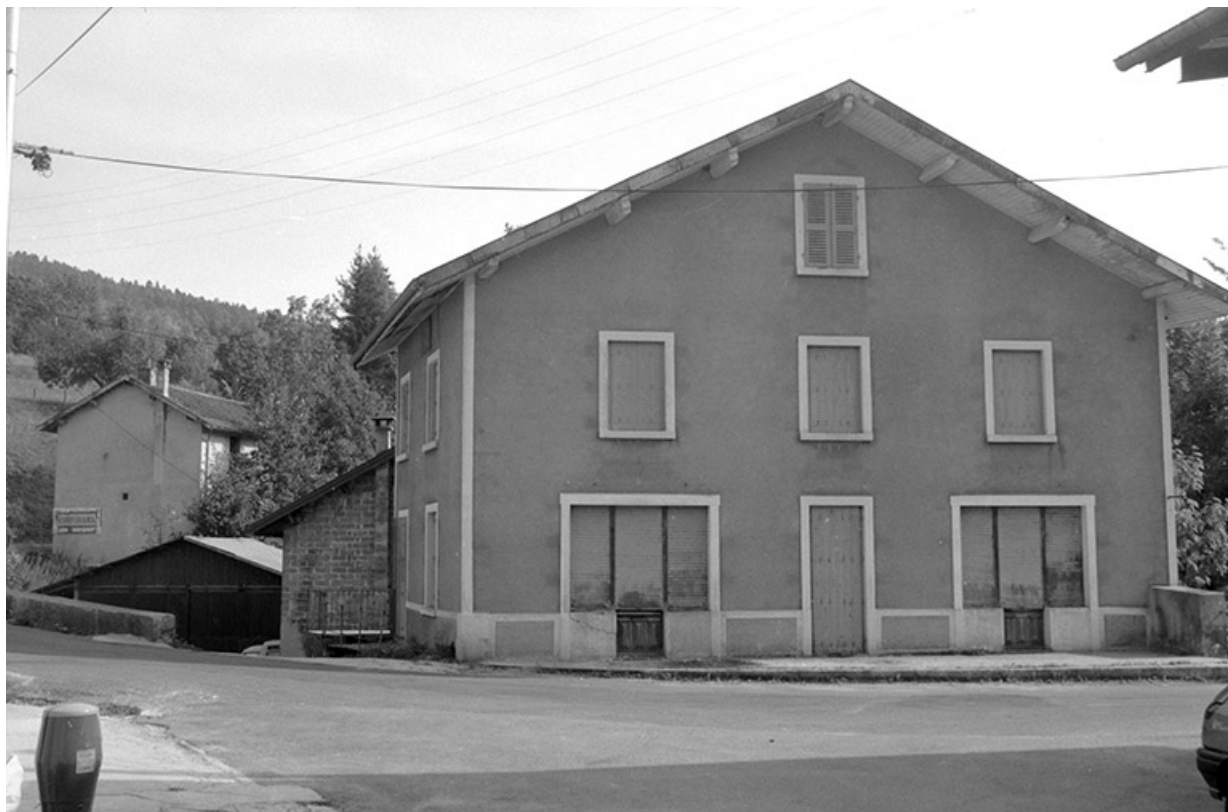
Façade antérieure du logement.