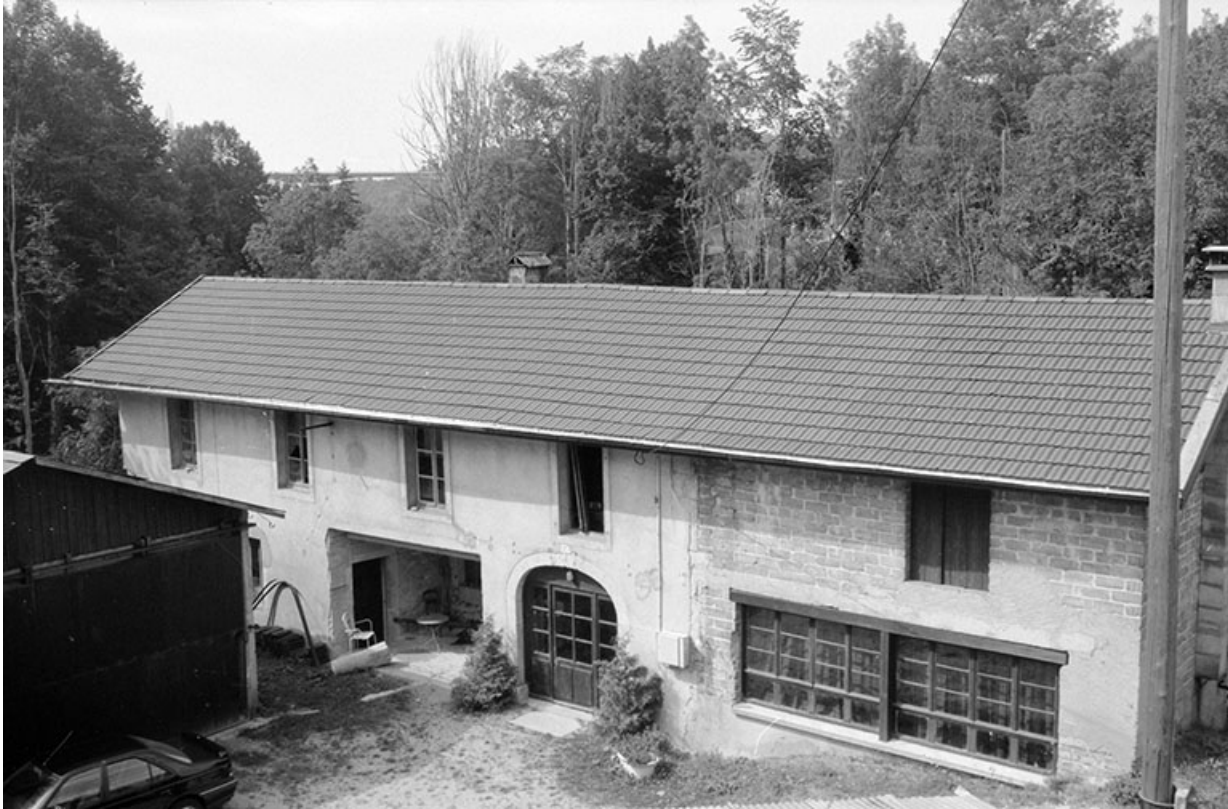
Façade antérieure des ateliers de fabrication.