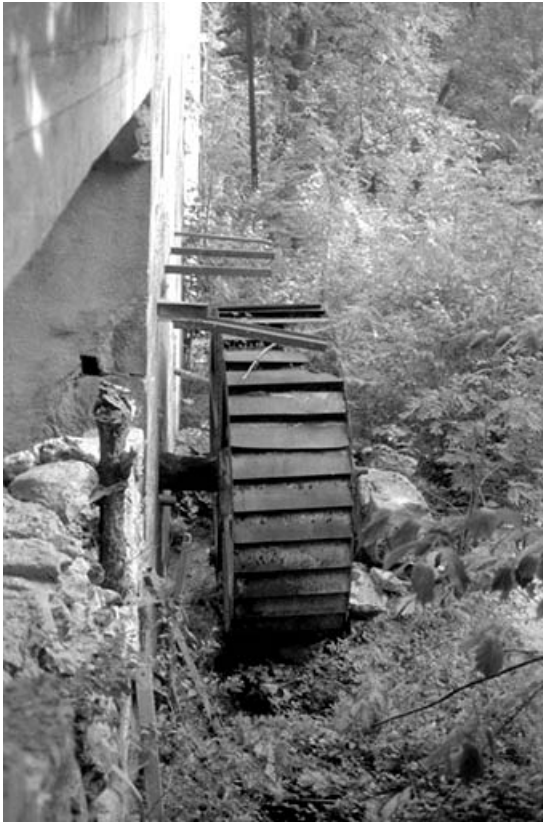
Roue hydraulique verticale amont.