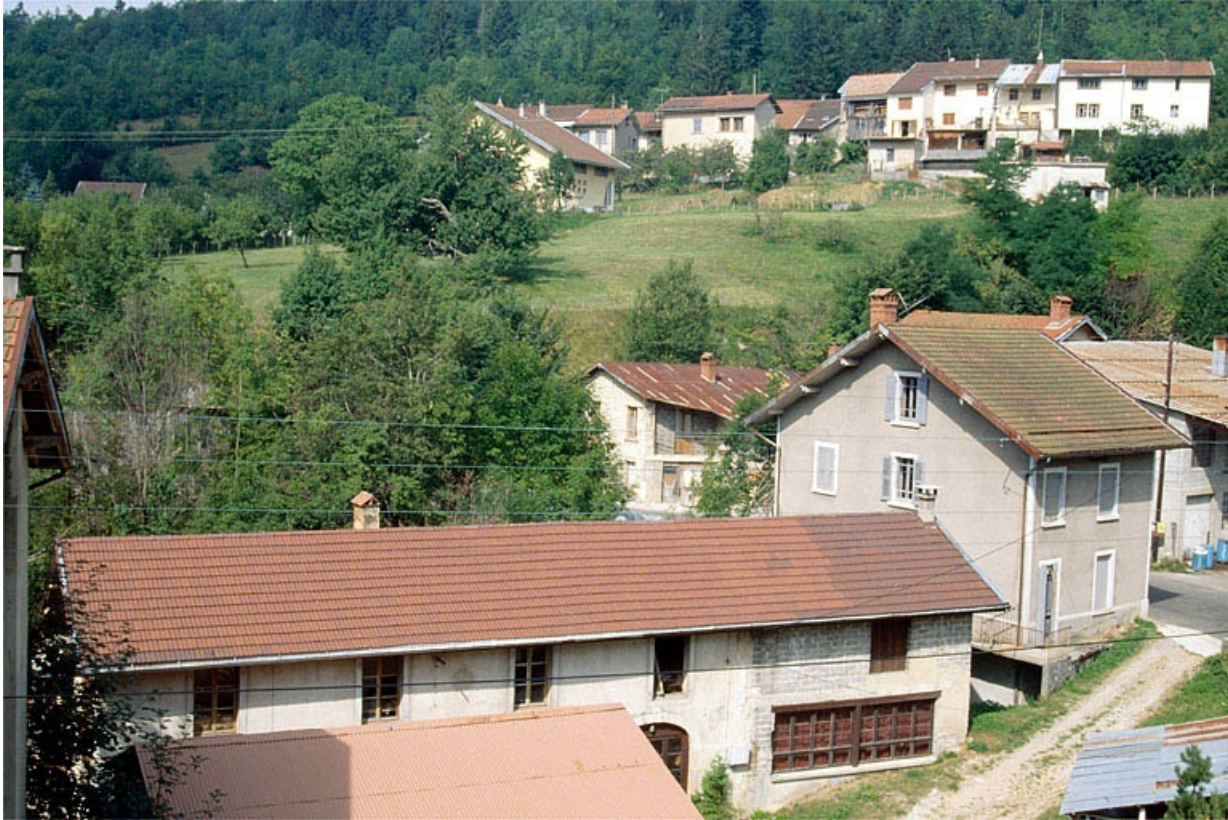
Ateliers de fabrication et logement.