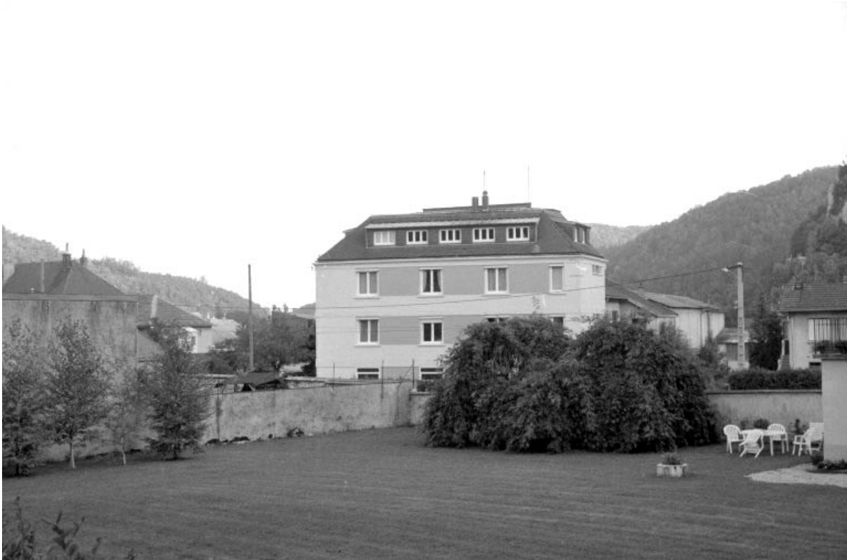
Façade latérale droite du bureau.

39, Moirans-en-Montagne, 4, 6 rue des Sports