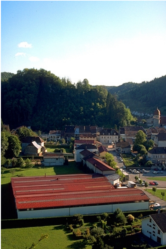
Vue d'ensemble plongeante depuis le nord.

39, Moirans-en-Montagne, 4, 6 rue des Sports