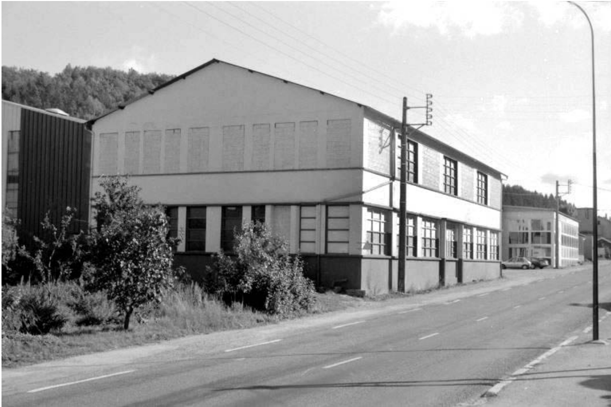
Magasin industriel (ancien atelier de fabrication).

39, Moirans-en-Montagne, 59 avenue de Saint-Claude