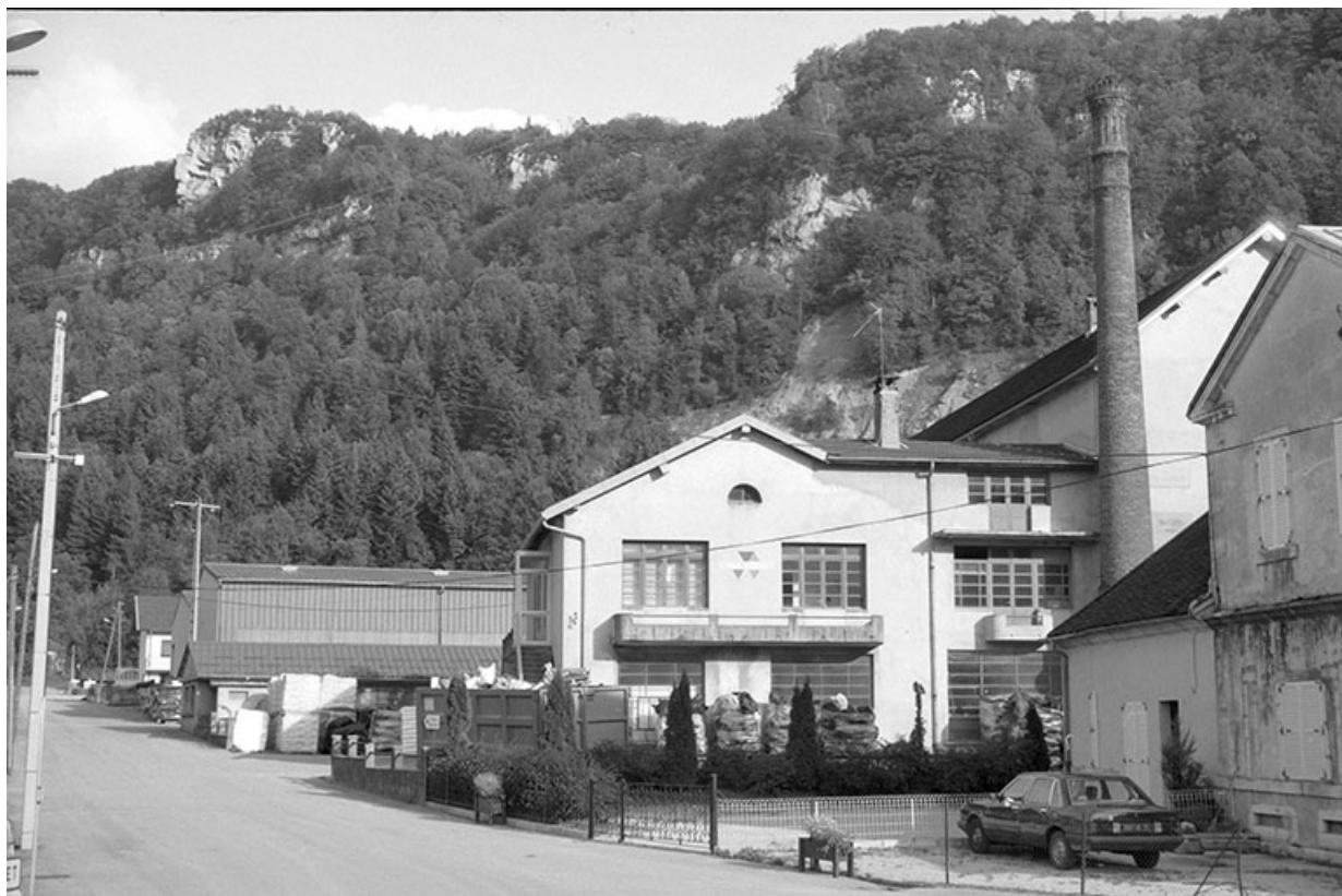
Bureau, entrepôt industriel et cheminée d'usine.

39, Moirans-en-Montagne, 2 rue du Moulin