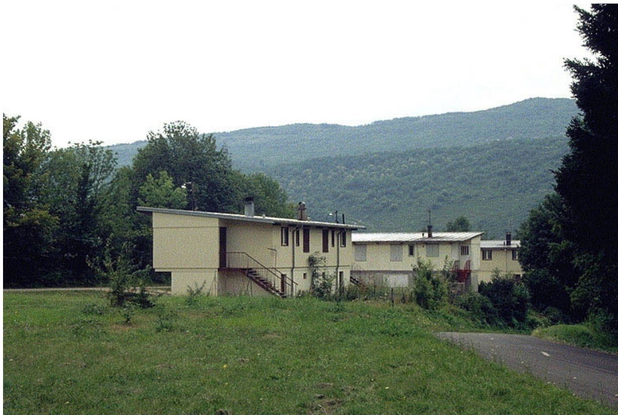
Vue d'ensemble depuis le nord-est.