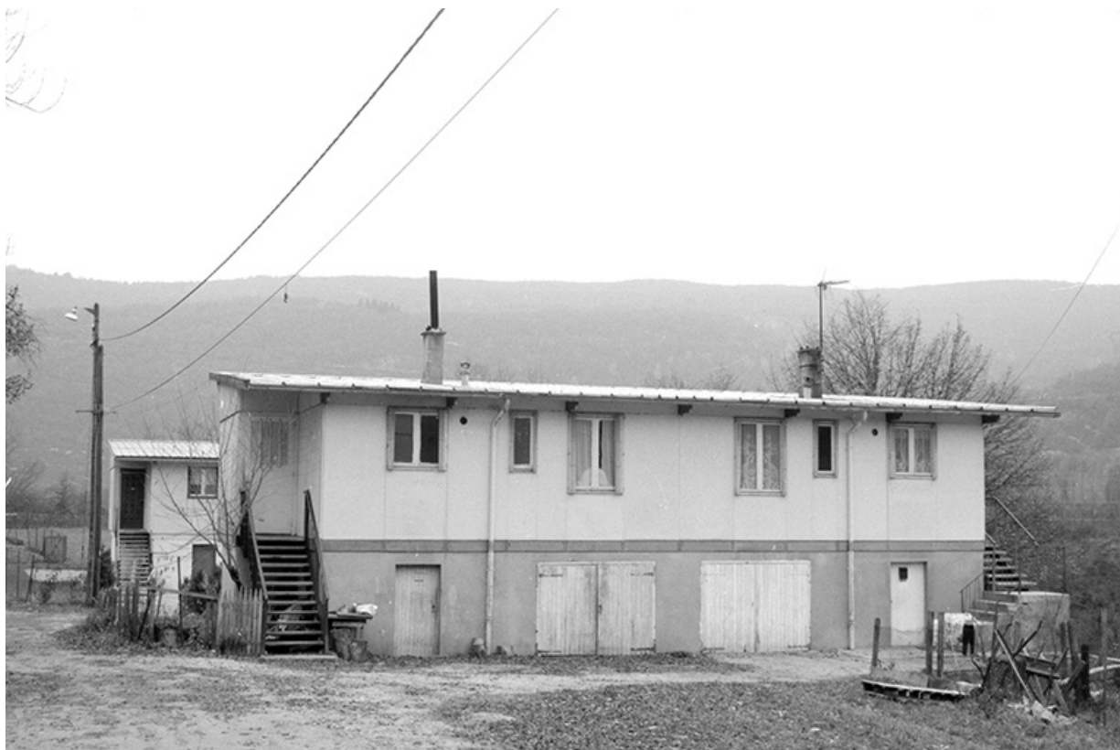
Façade antérieure d'une autre maison de la série. Maison cadastrée 1985 AN 122.