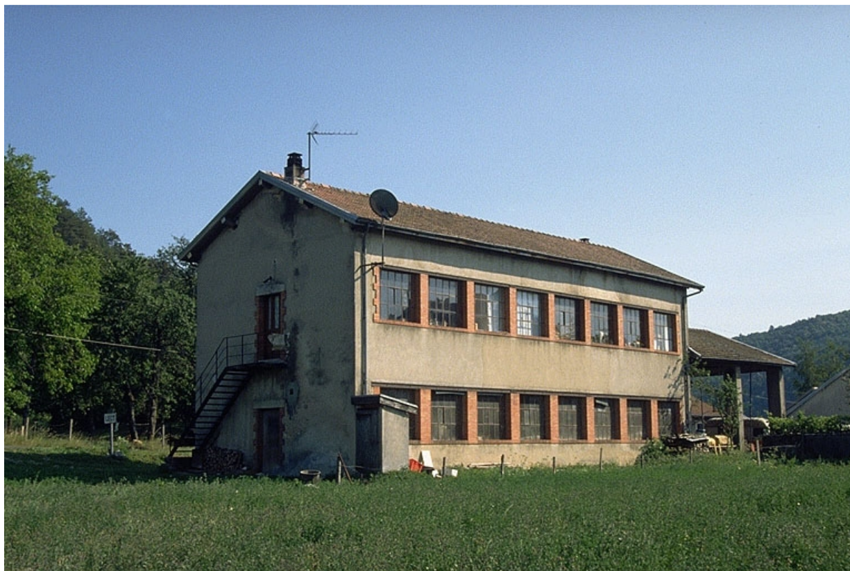
Façade postérieure vue de trois quarts. 39, Lect