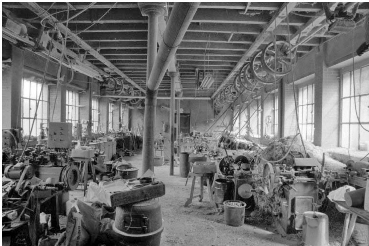
Intérieur de l'atelier de fabrication.