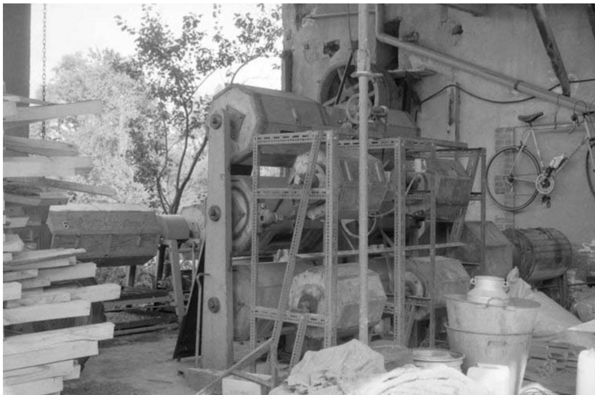
Tonneaux de polissage.