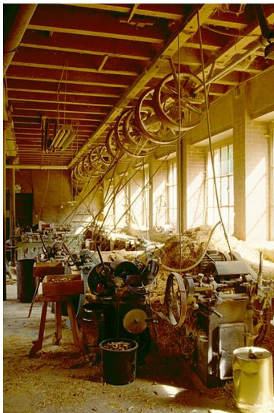
Intérieur de l'atelier de fabrication : tour à bois Monneret (Moirans-en-Montagne) et transmissions.