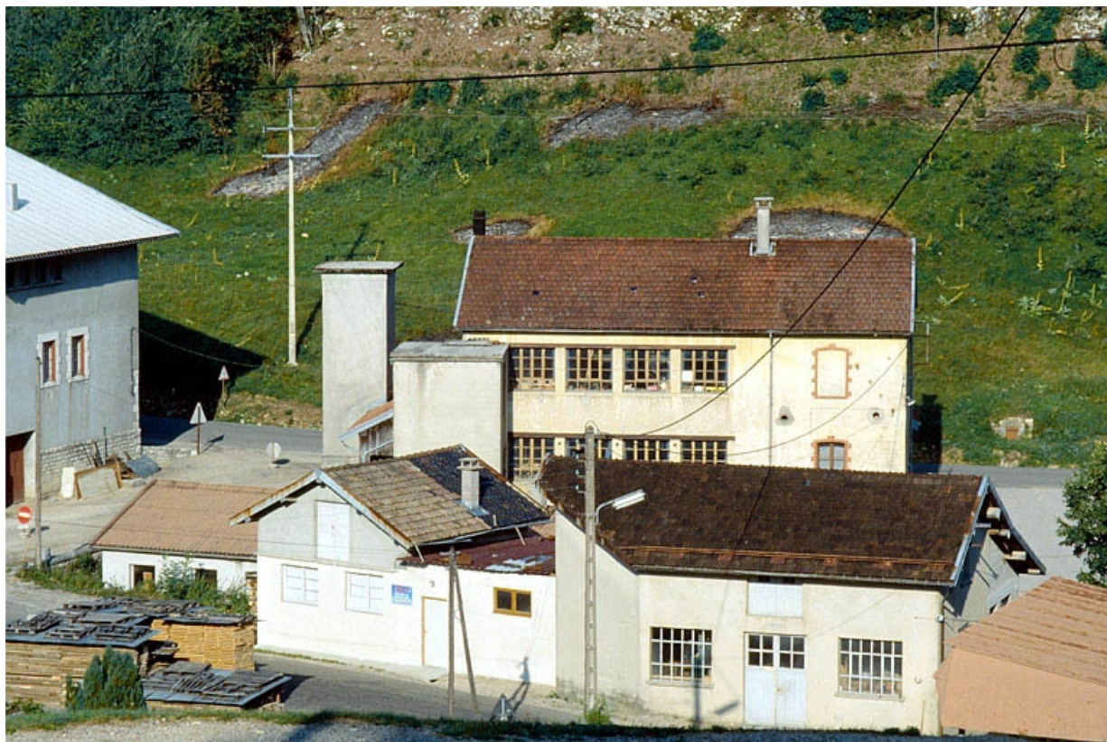
Façade postérieure vue de trois quarts droite. 39, Les Crozets