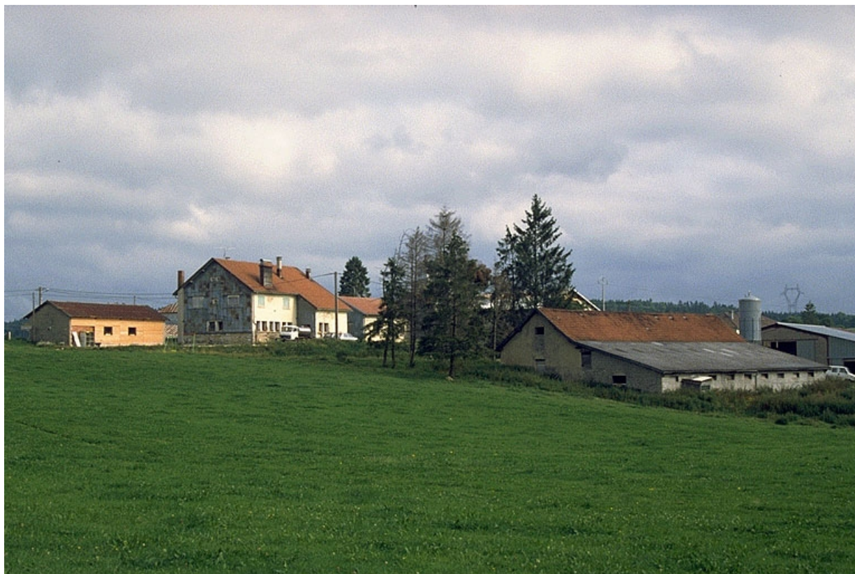
Vue d'ensemble depuis le sud. Porcherie à droite.