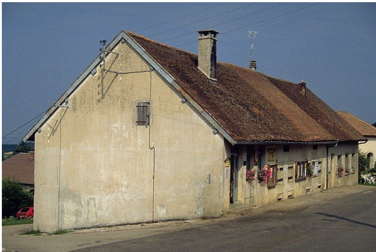
Façade antérieure vue de trois quarts gauche.