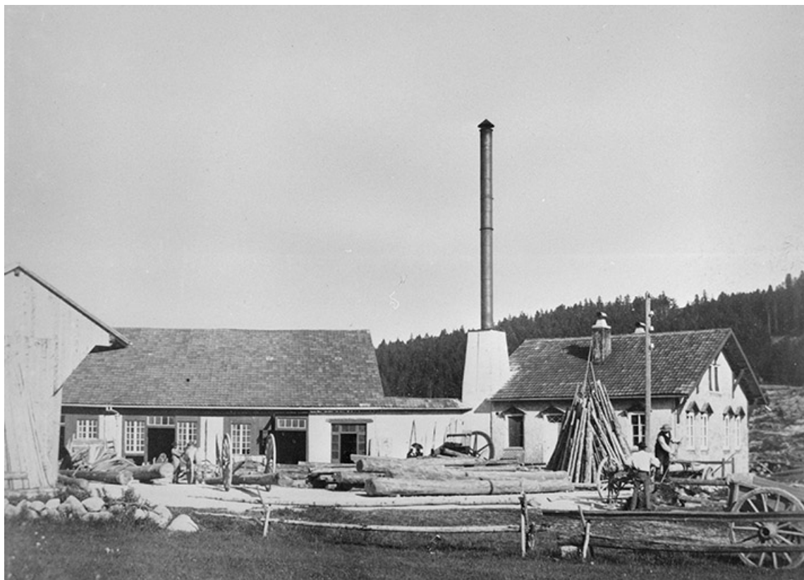
St Laurent. Scierie de la Savine Désiré Paget.

Photographie, 1892, par Paget, Luc (industriel). Lieu de conservation : Archives de la société Luc Paget et Fils, Morbier