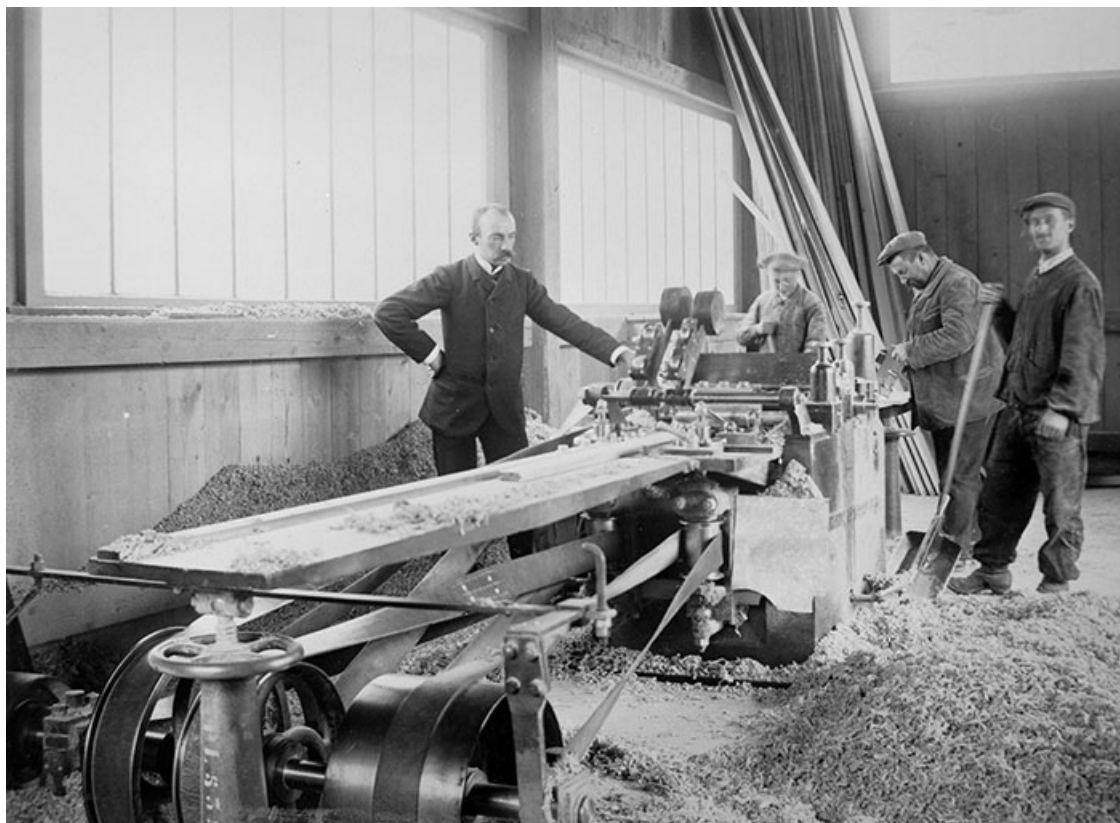
La parqueteuse pendant l'arrêt.

Photographie, s.d. [1er quart 20e siècle, vers 1905], par Paget, Luc (industriel). Lieu de conservation : Archives de la société Luc Paget et Fils, Morbier