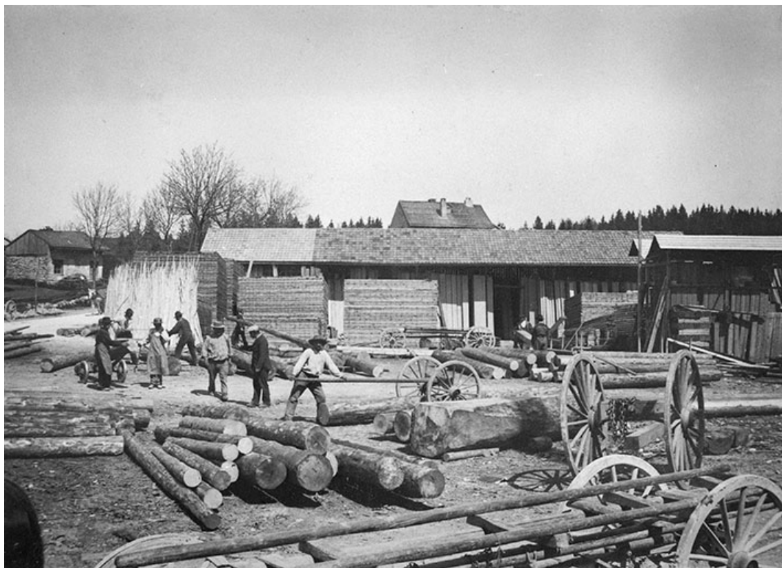
St Laurent. La scierie (chantier devant l'usine).