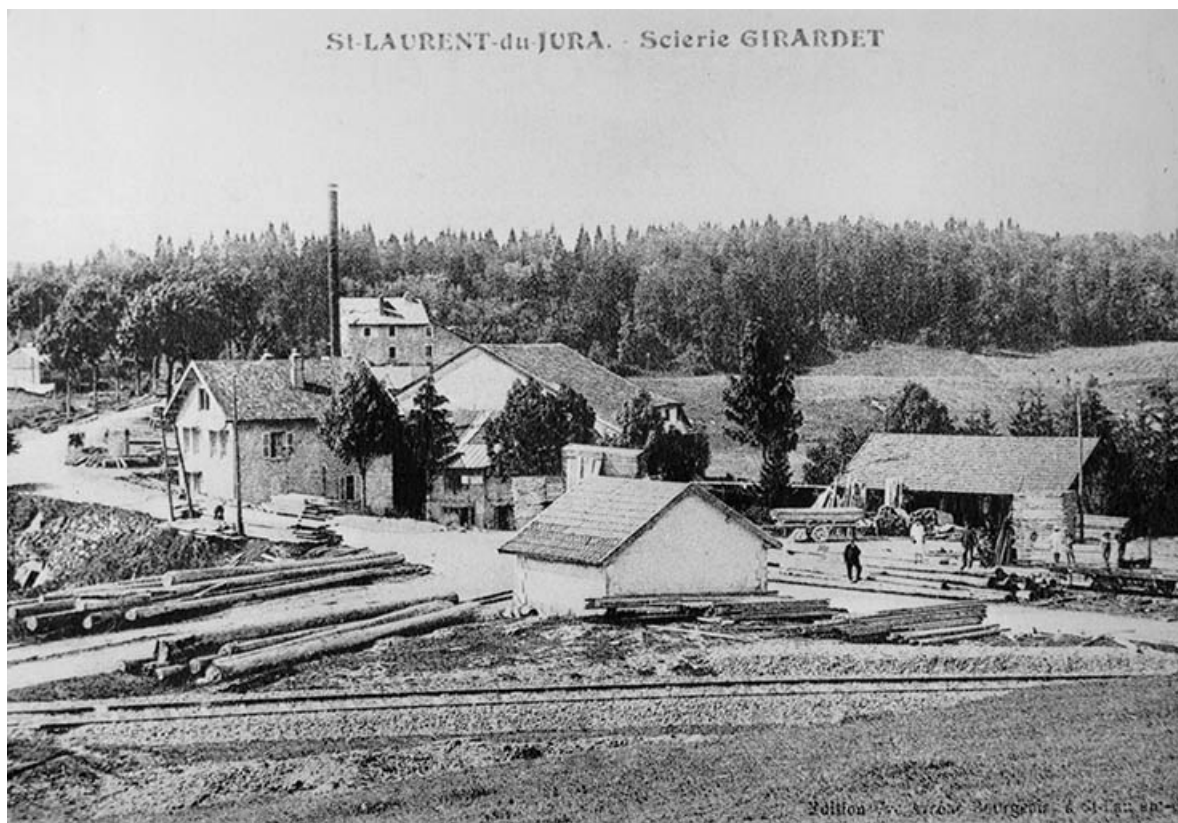
St-Laurent-du-Jura. - Scierie Girardet.

39, Saint-Laurent-en-Grandvaux, lieudit : la Savine