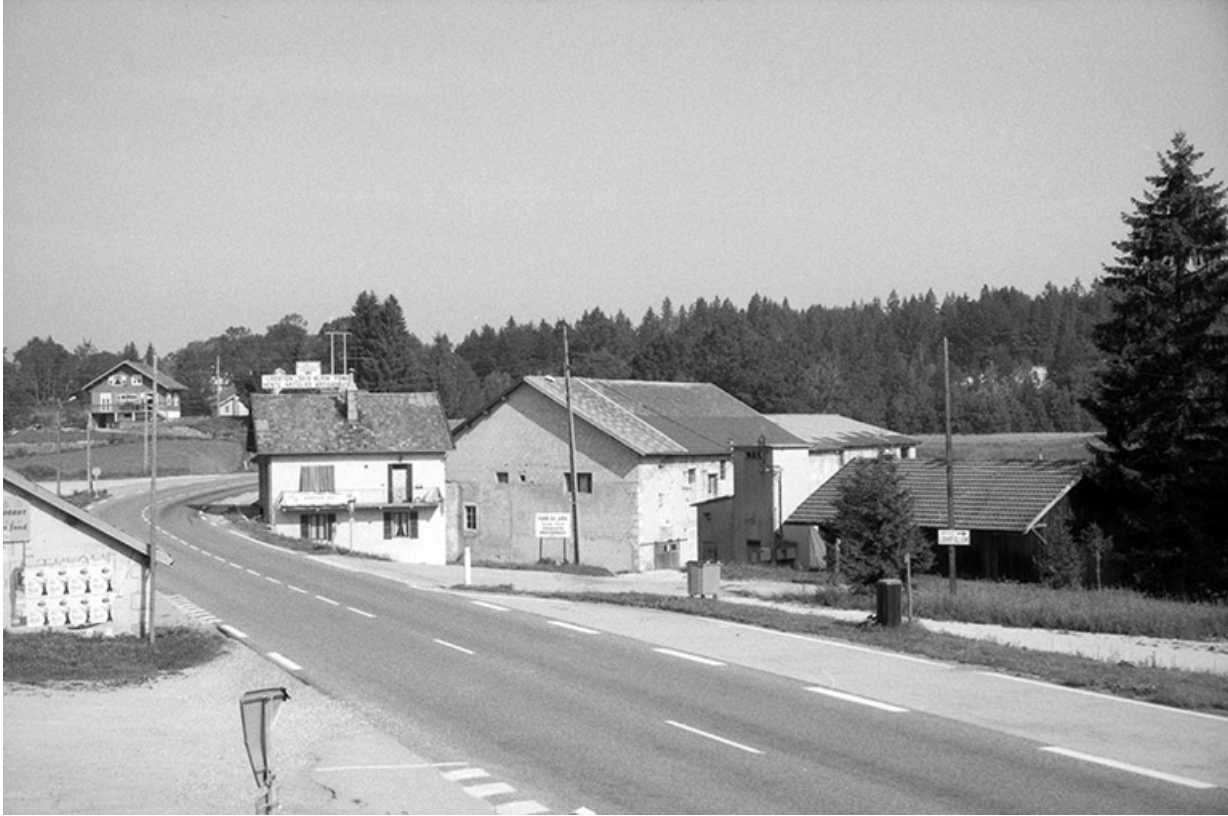
Logement patronal, ateliers de fabrication et transformateur. Ancienne parqueterie à droite. 39, Saint-Laurent-en-Grandvaux, lieudit : la Savine