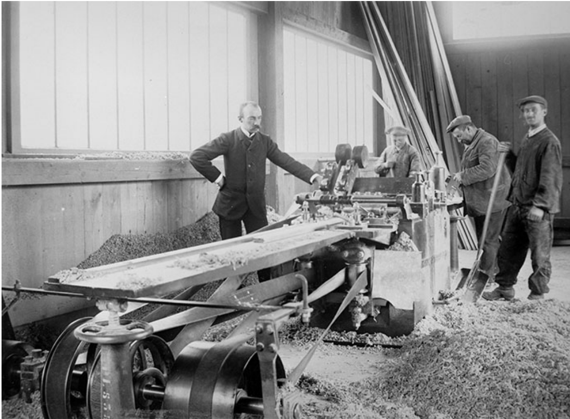
La parqueteuse pendant l'arrêt.