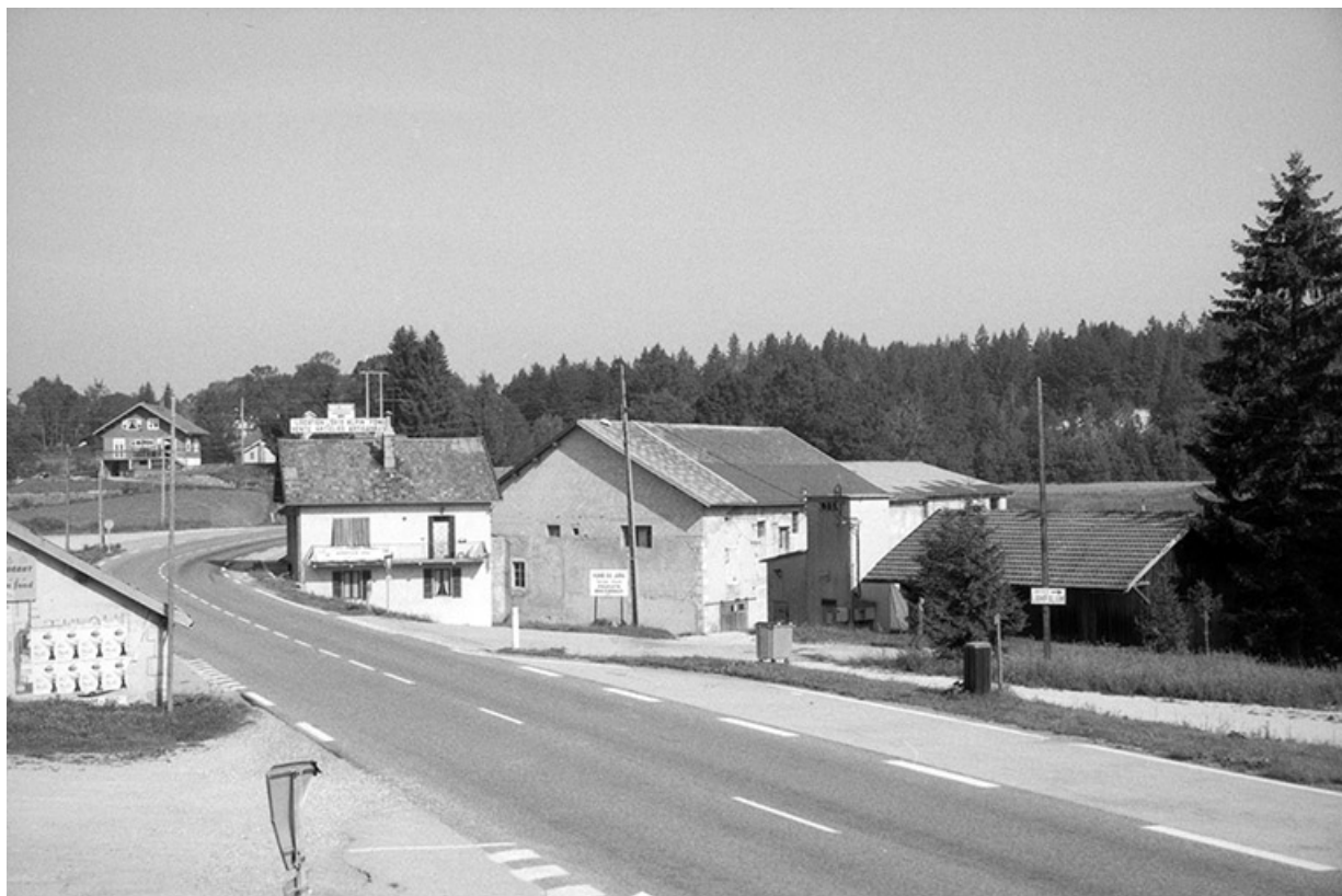
Logement patronal, ateliers de fabrication et transformateur. Ancienne parqueterie à droite.

39, Saint-Laurent-en-Grandvaux, lieudit : la Savine