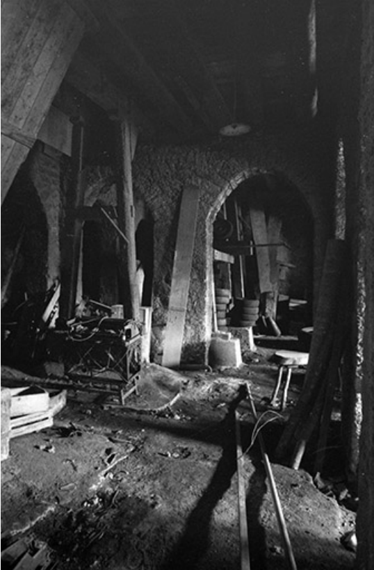
Etage de soubassement des ateliers de fabrication.

39, Saint-Laurent-en-Grandvaux, lieudit : la Savine