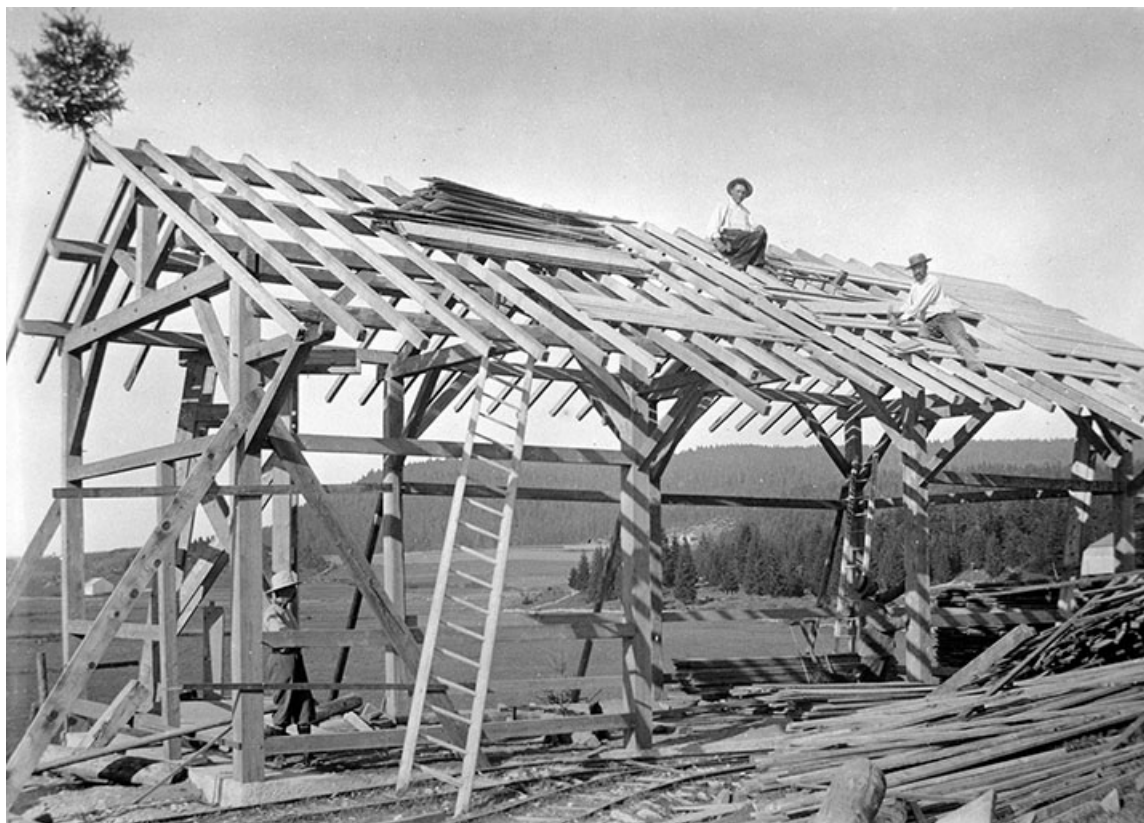
Construction du bâtiment de la parqueteuse.