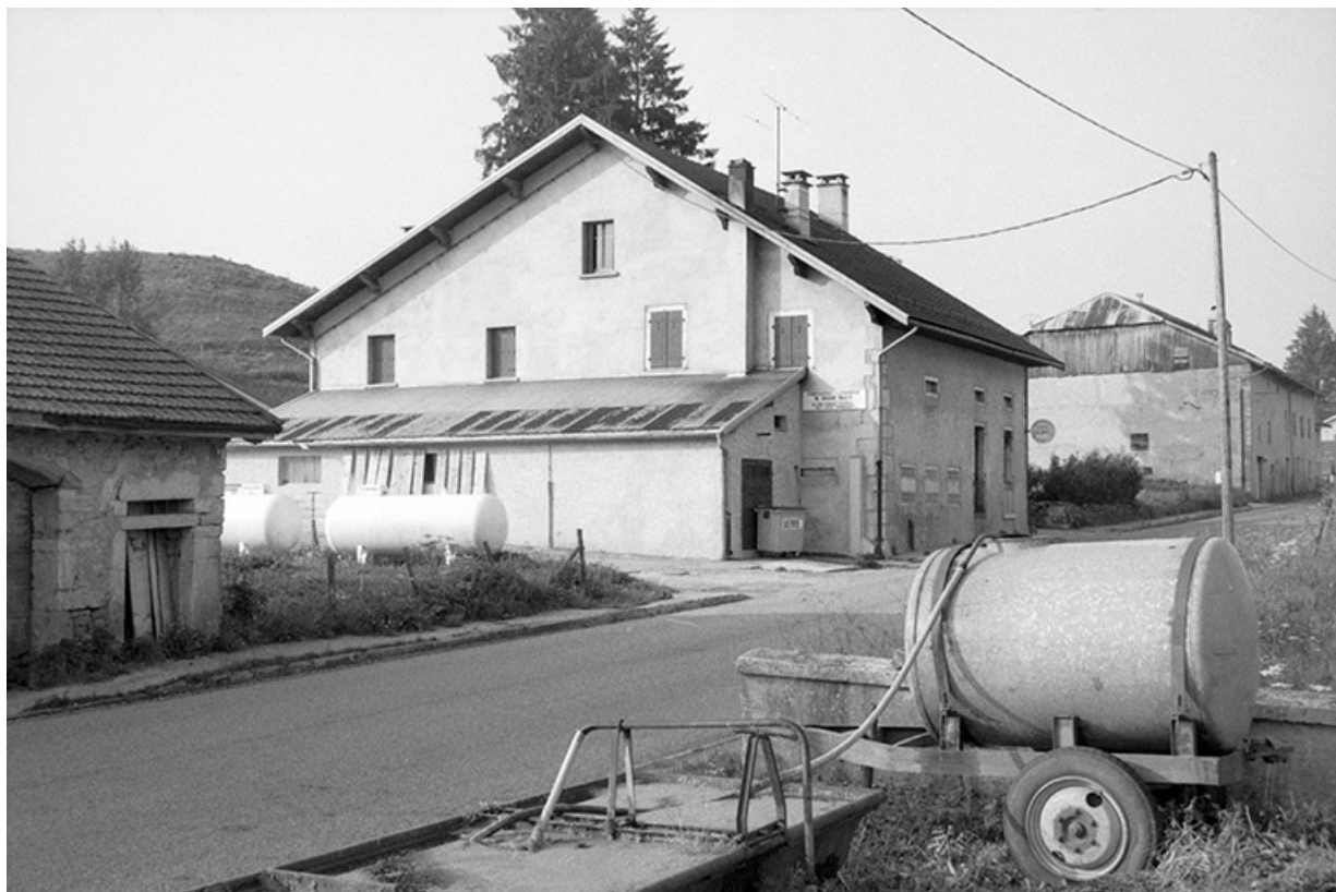
Fromagerie vue de trois quarts gauche.

39, Grande-Rivière, lieudit : les Chauvins