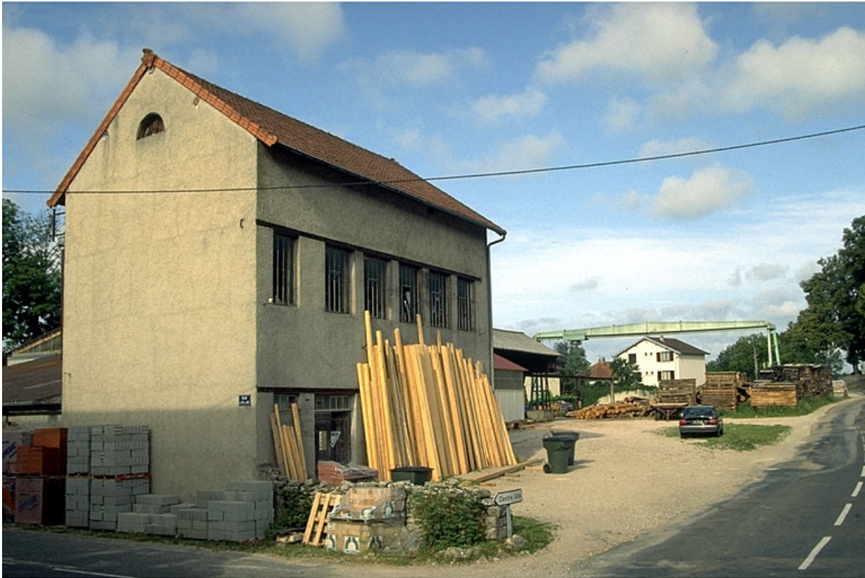
Magasin industriel, atelier de fabrication et poste de chargement.