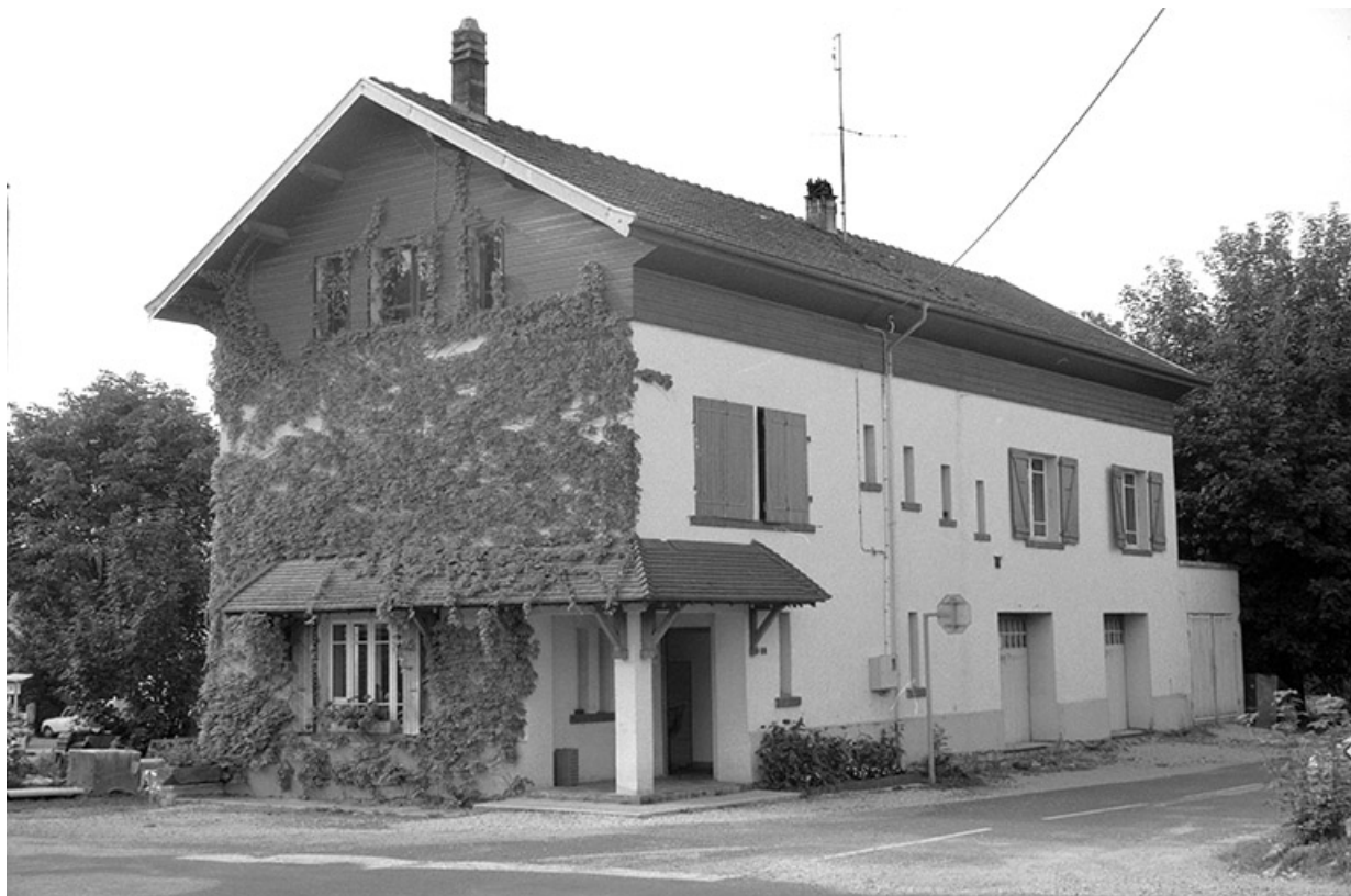
Logement, bureau, remise à automobile.