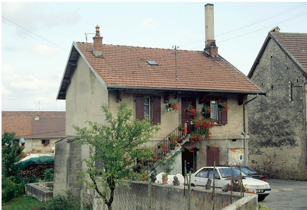
Façade antérieure vue de trois quarts gauche. 39, Onoz