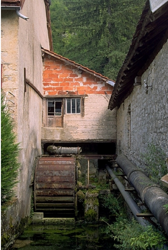
Roue en dessus.