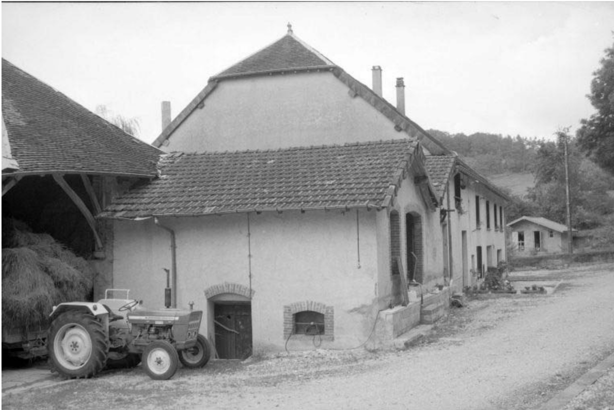
Bâtiment d'eau et atelier de fabrication.