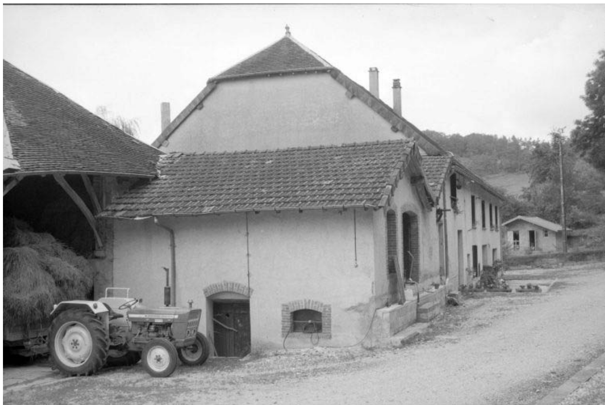
Bâtiment d'eau et atelier de fabrication.