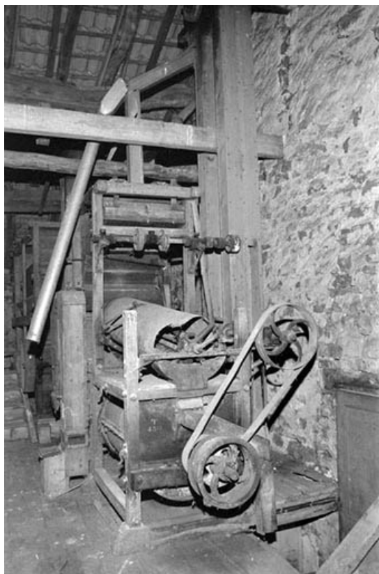
Trieur à grains (étage en surcroît).

39, Villechantria chemin du Moulin du Pont Neuf