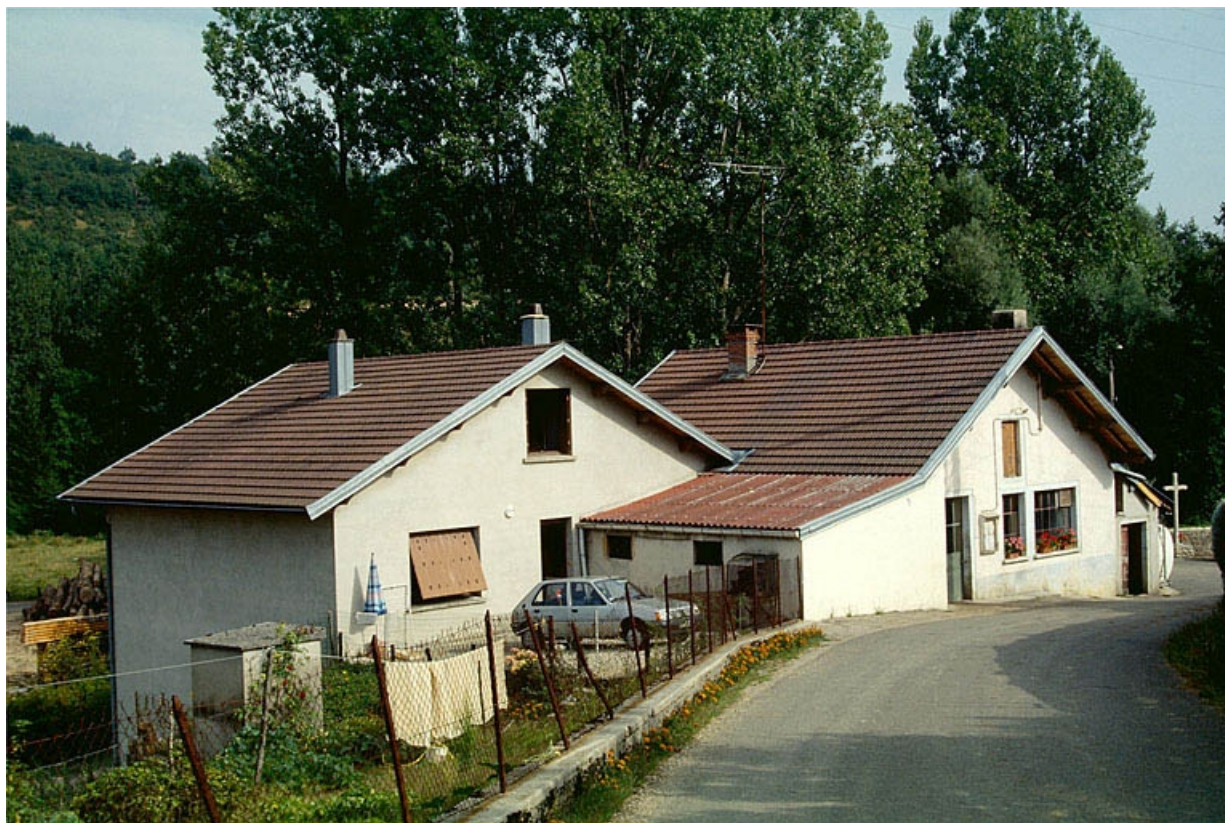
Façade antérieure de trois quarts gauche. 39, Montagna-le-Templier