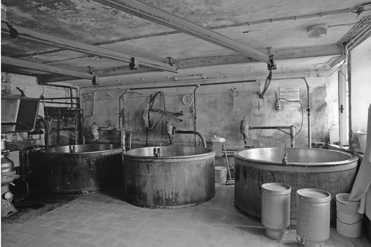
Atelier de fabrication ouest.