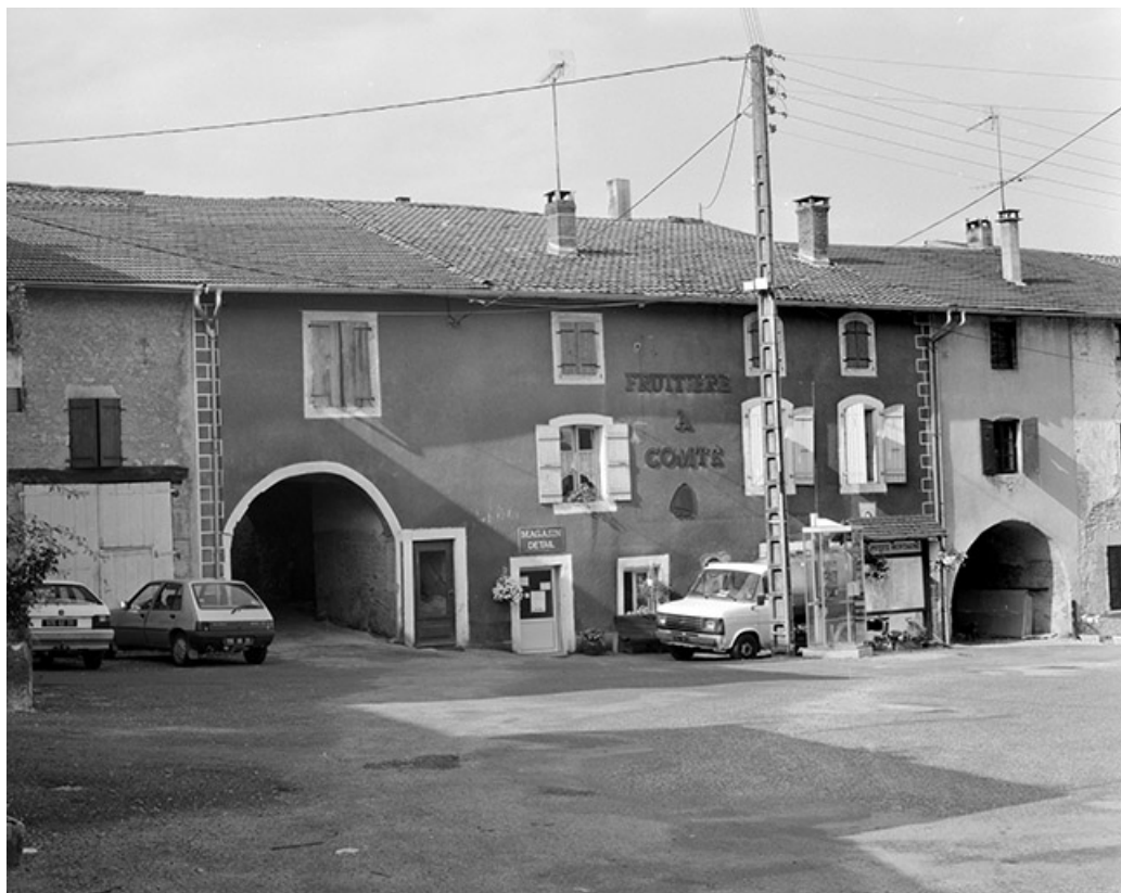
Vue d'ensemble de la façade antérieure.