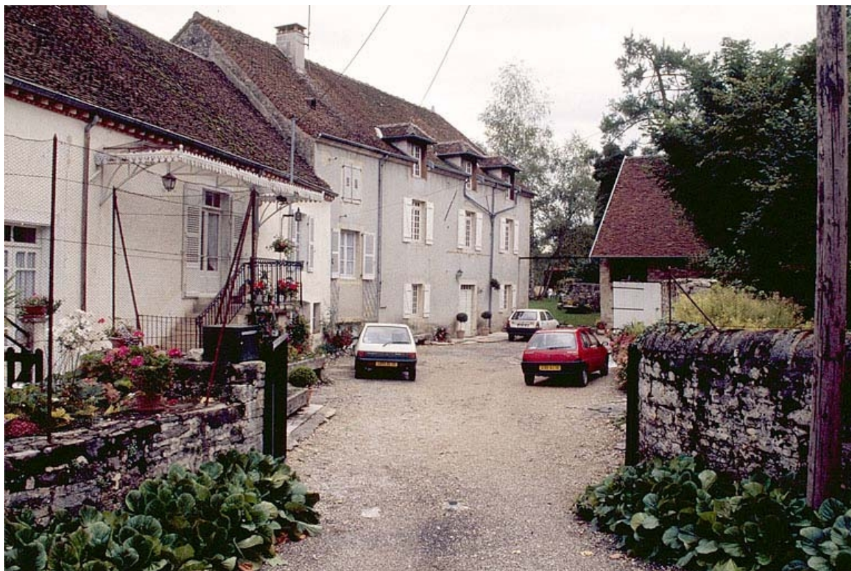
Façade antérieure de trois quarts gauche. 39, Arlay rue Abry d'Arcier