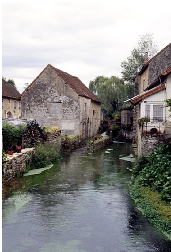
Ancienne huilerie et façade postérieure.