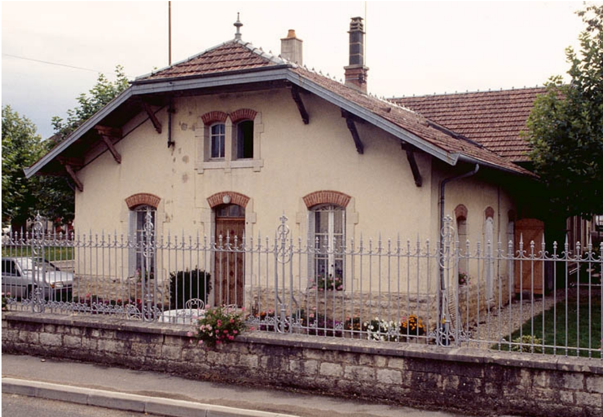
Mur-pignon et façade postérieure depuis l'ouest.