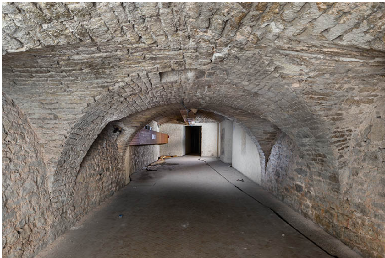
Sous-sol : anciennes caves transformées en couloir pour desservir les salles du cinéma.