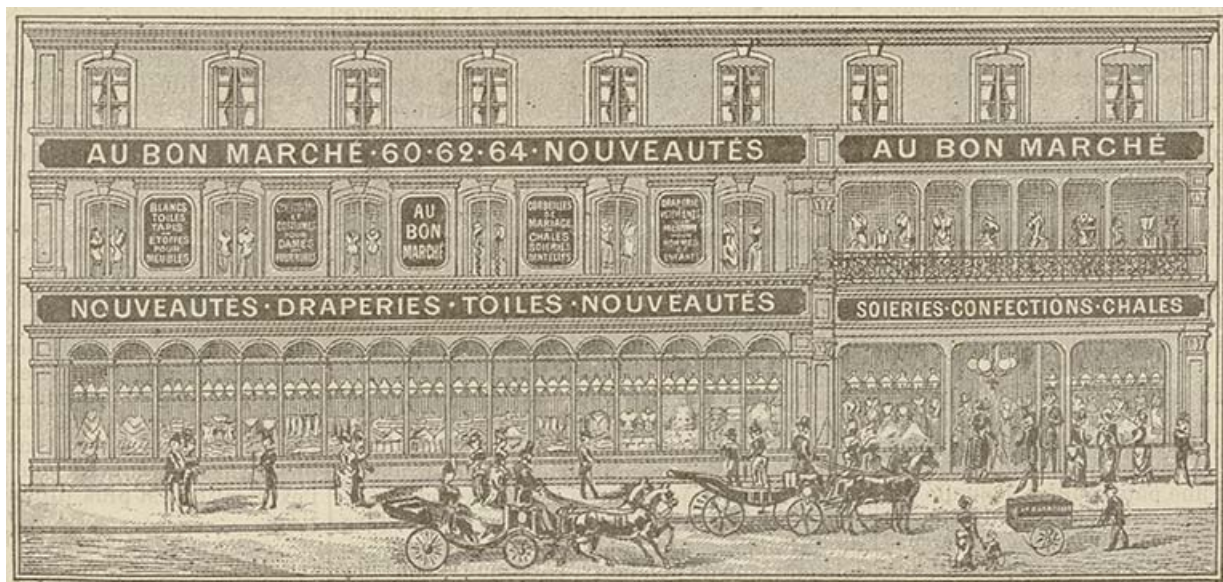
Vue extérieure des magasins du "Bon Marché" à Besançon. S.d. [1895].