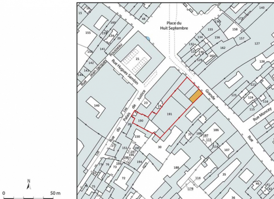
Plan-masse et de situation. Extrait du plan cadastral, 2023, AB, 1/500 réduit à 1/1 000. 25, Besançon, 62 Grande Rue