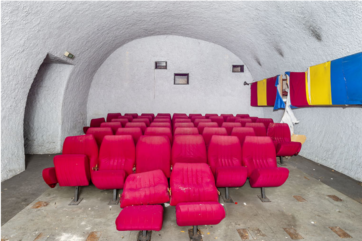
Ancienne salle de cinéma au sous-sol.