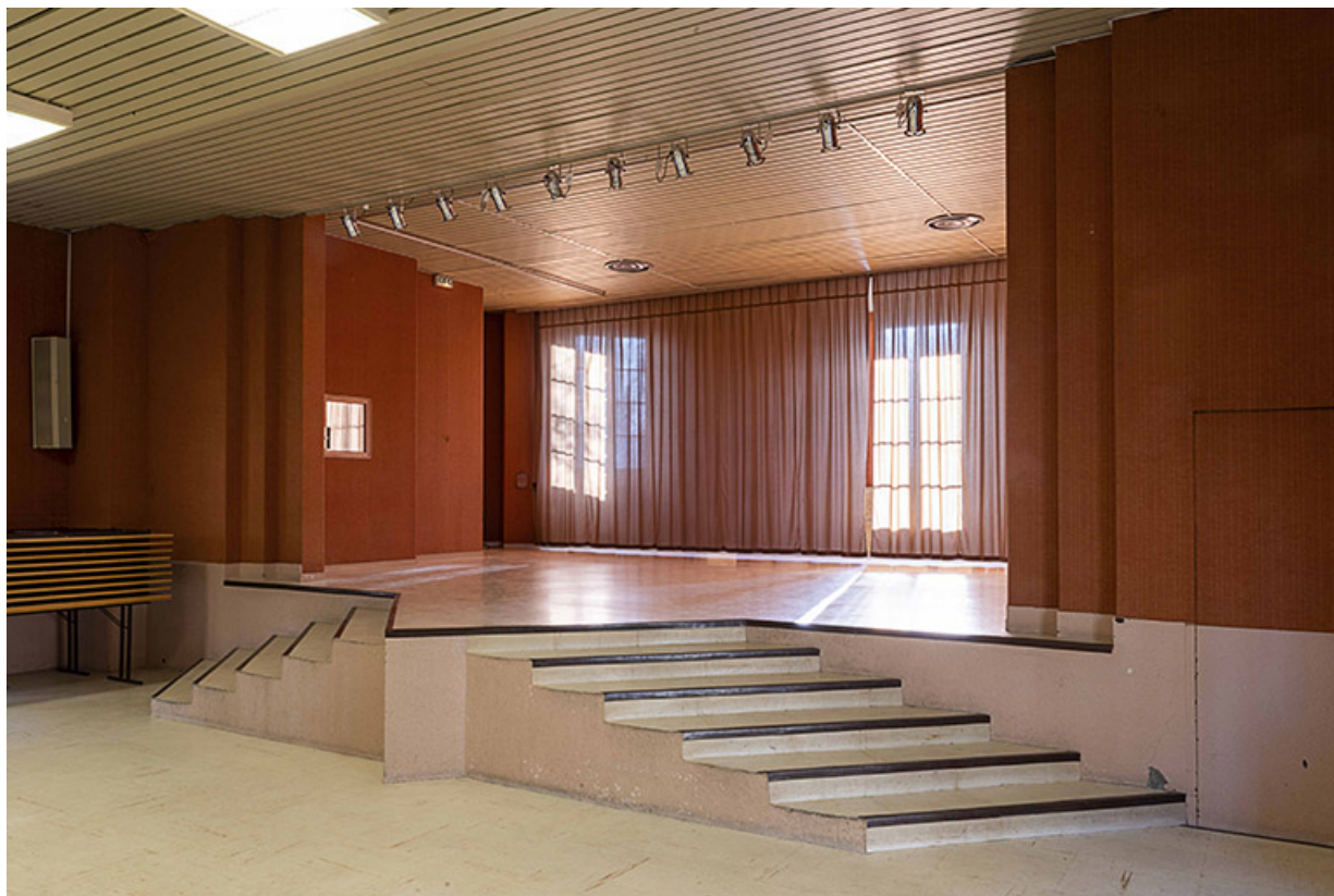
Scène de l'ancienne salle de cinéma vue de trois-quarts.