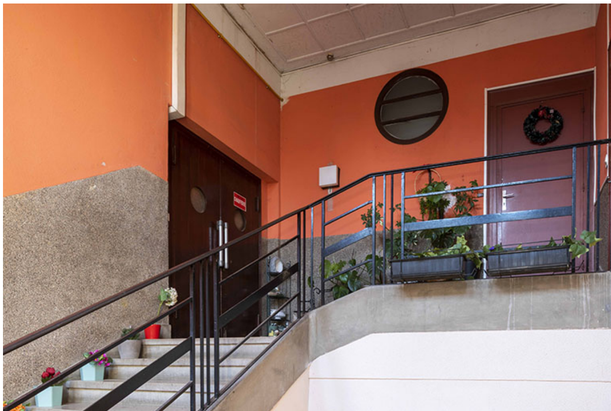
Vue de la partie supérieure de l'escalier de la maison des œuvres. A gauche, la double-porte donne accès à la tribune du cinéma. 25, Besançon, 18 avenue Villarceau