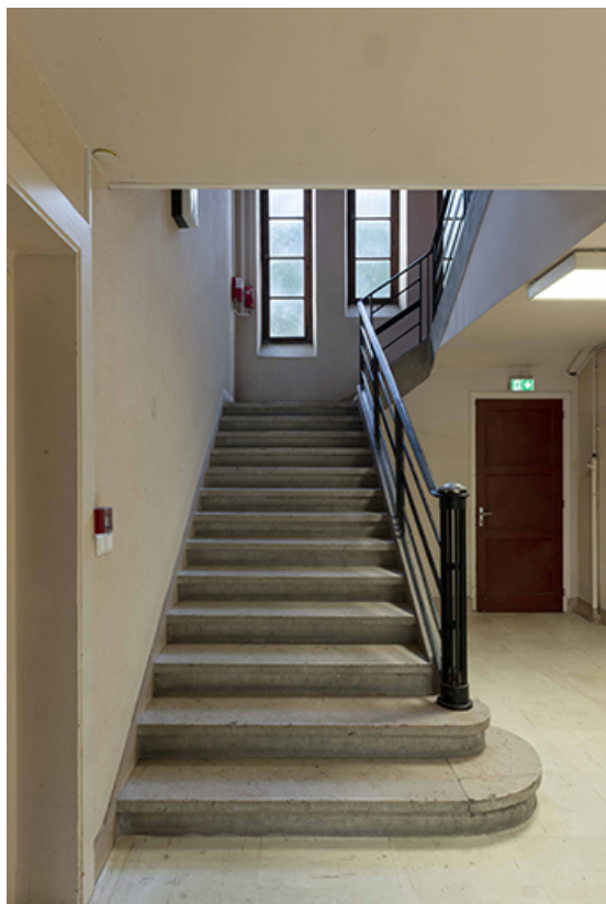
Vue de l'escalier central de la maison des œuvres depuis le hall d'entrée.