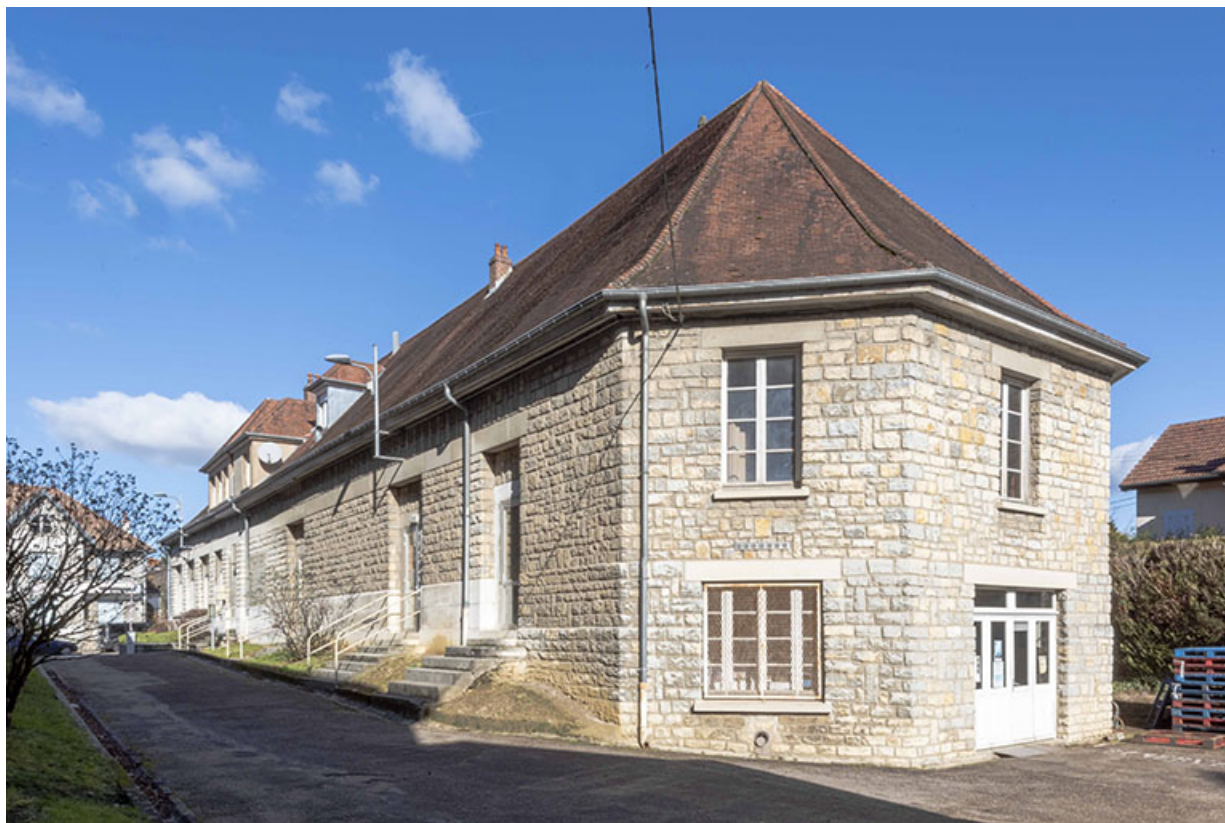
Façades ouest et sud de la maison des œuvres - Cinéma Villarceau, vue de trois-quarts. 25, Besançon, 18 avenue Villarceau