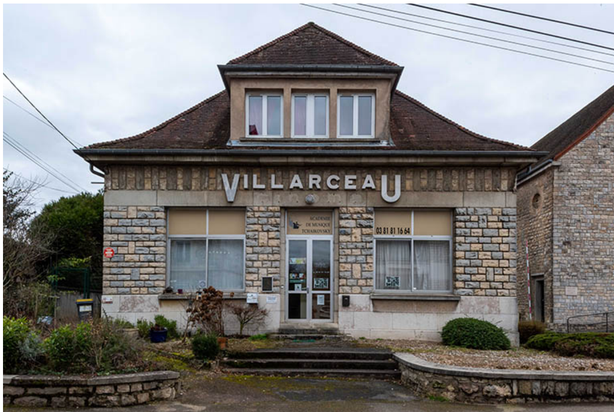
Façade nord de la maison des œuvres - Cinéma Villarceau.