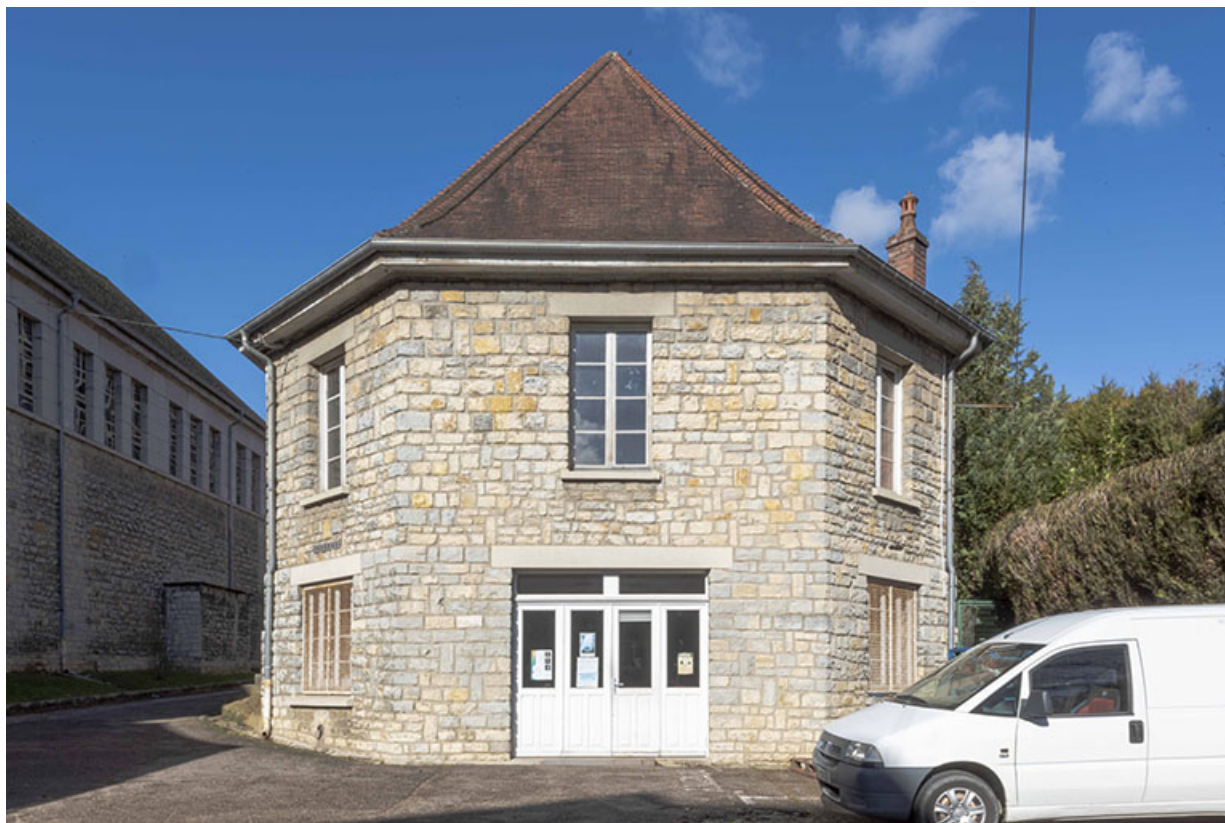
Façade sud de la maison des œuvres - Cinéma Villarceau.