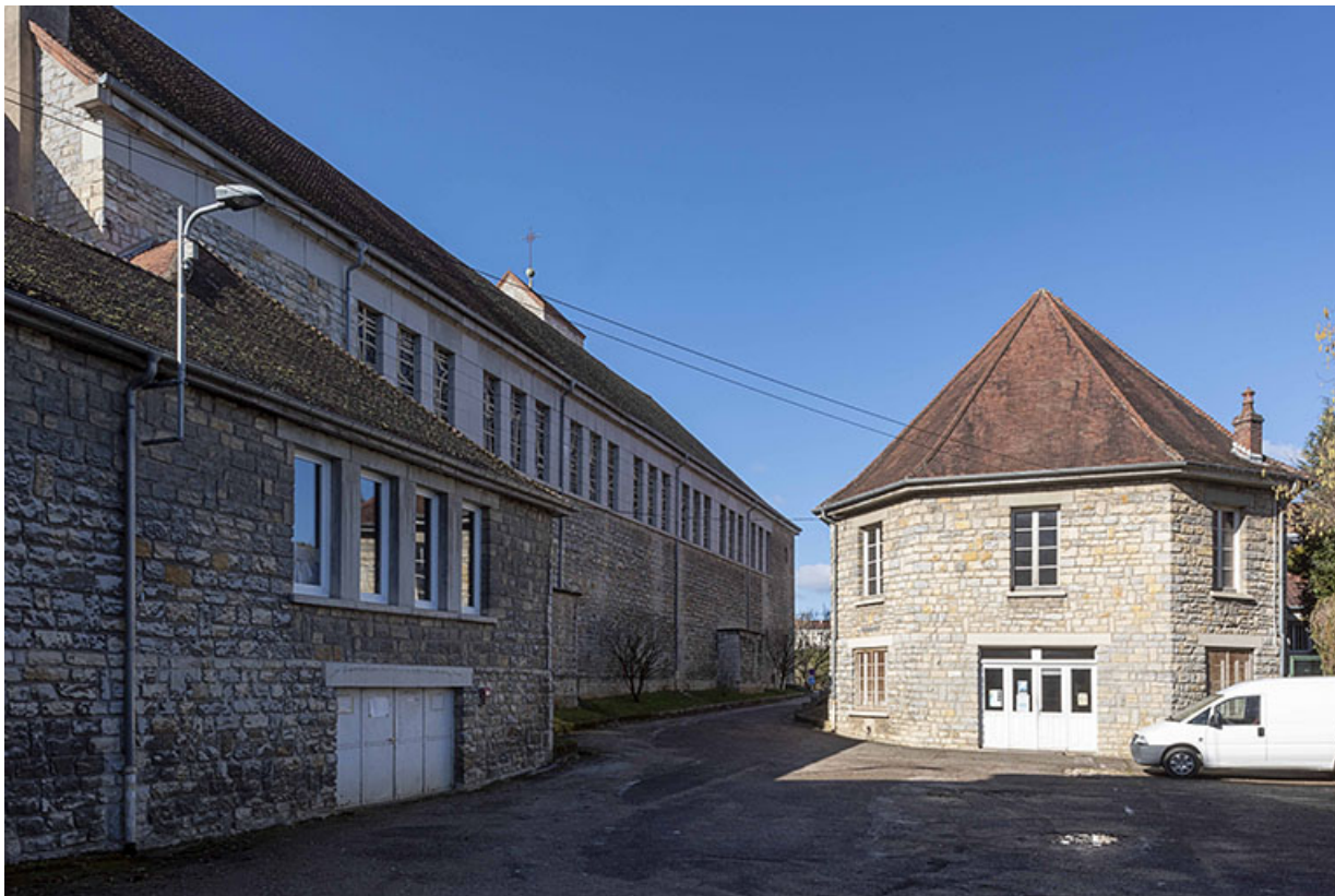
De gauche à droite : sacristie, église et maison des œuvres - cinéma Villarceau. 25, Besançon, 18 avenue Villarceau