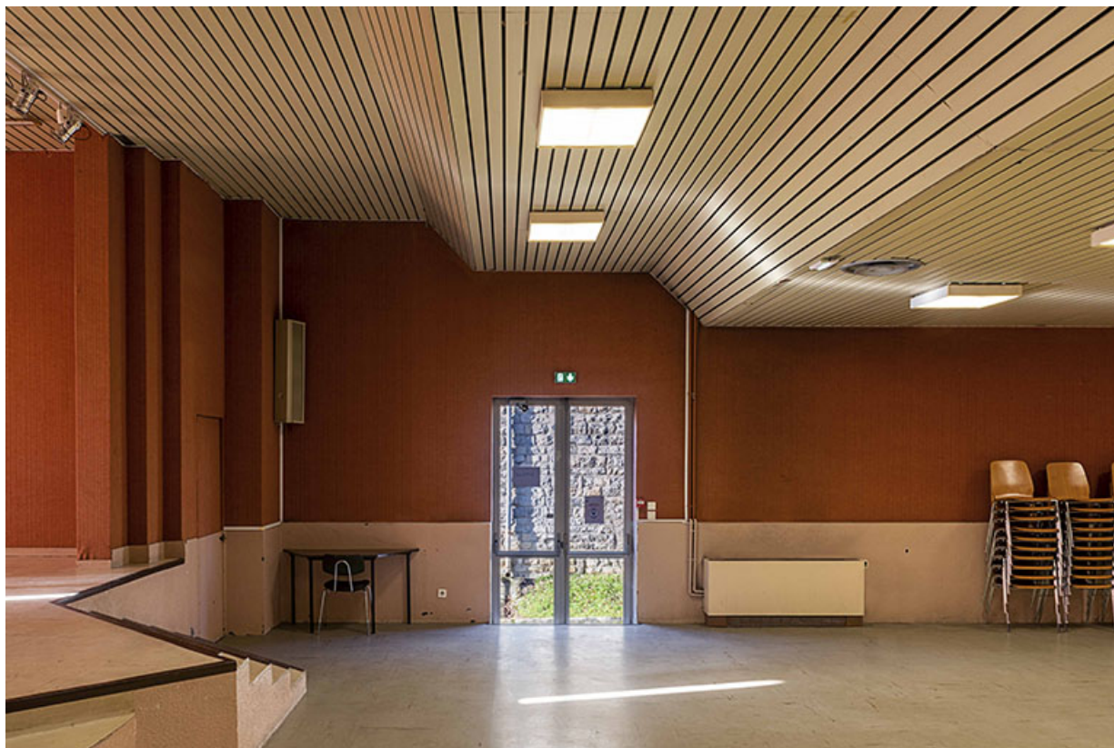
Vue intérieure de l'ancienne salle de cinéma en direction du mur ouest.