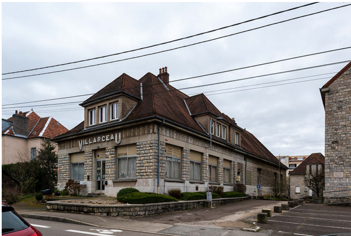
Façades nord et ouest de la maison des œuvres - Cinéma Villarceau, de trois-quarts. 25, Besançon, 18 avenue Villarceau