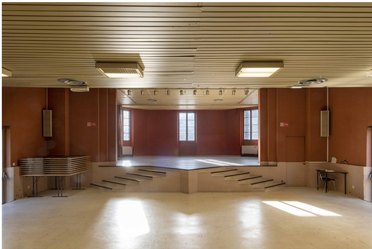
Vue intérieure de l'ancienne salle de cinéma, depuis la cloison mobile en direction de la scène.