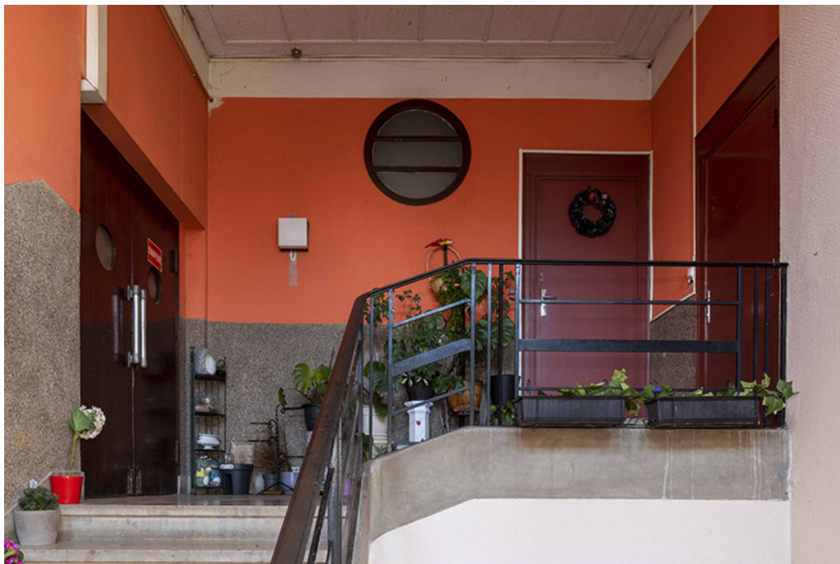
Vue du palier supérieur de l'escalier de la maison des œuvres desservant la tribune du cinéma, les salles paroissiales et le logement.