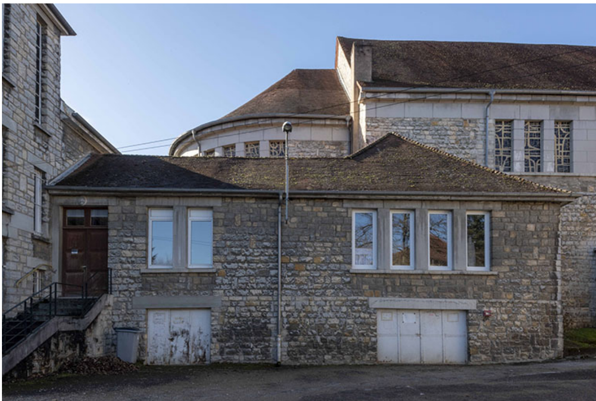
Façade de la sacristie et de la chapelle. En arrière-plan, l'église.