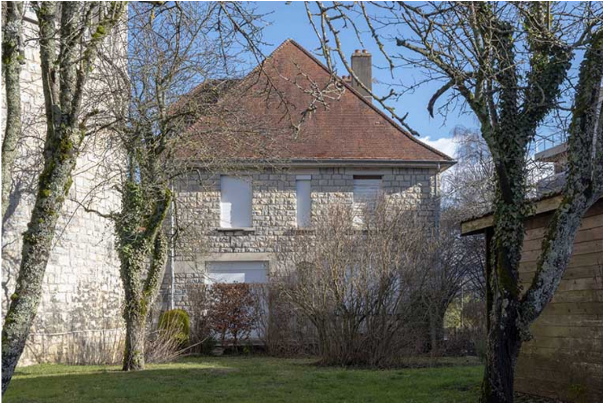
Façade ouest du presbytère vue depuis le jardin.