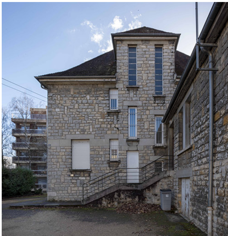
Façade nord du presbytère et bâtiment abritant la chapelle, la sacristie et la chaufferie de l'église. 25, Besançon, 18 avenue Villarceau