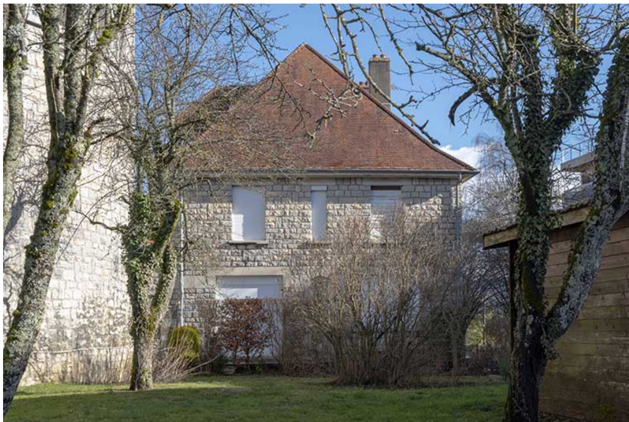
Façade ouest du presbytère vue depuis le jardin.