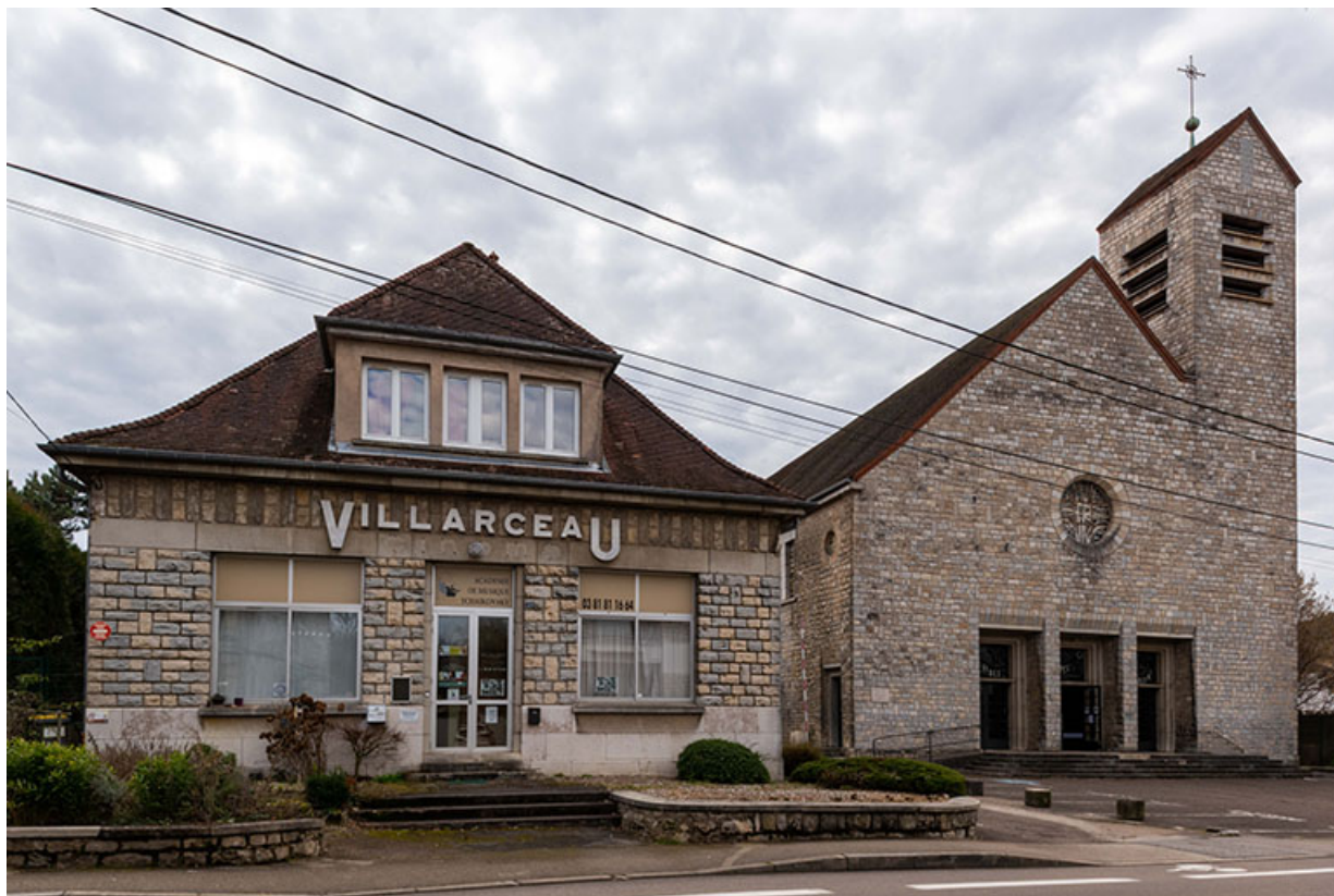
Façades nord de la maison des œuvres - cinéma Villarceau et de l'église Saint-Joseph.