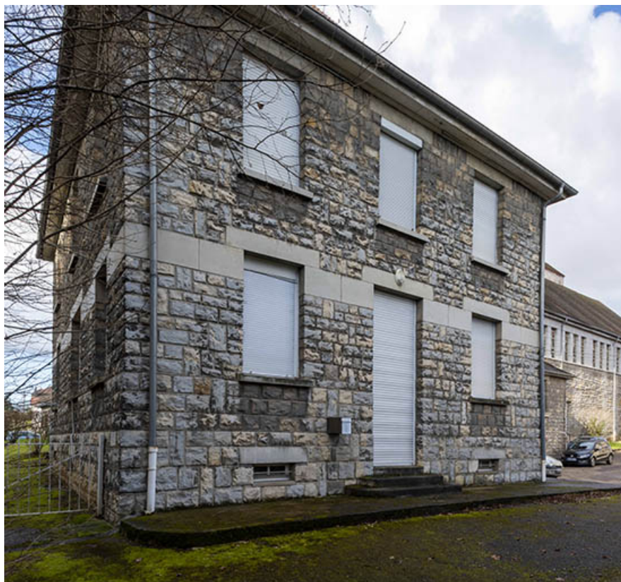
Façades sud et est du presbytère vues de trois quarts.