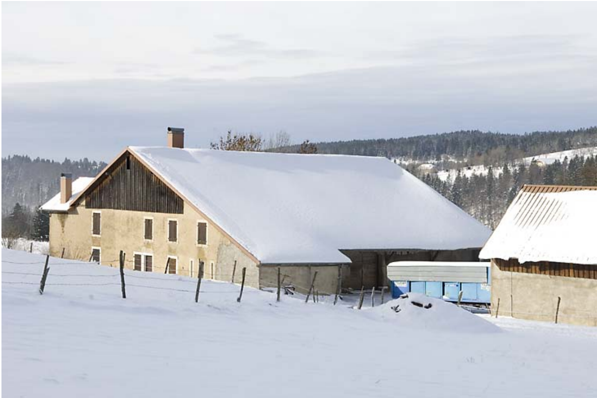
Façades postérieure et latérale droite, en hiver.