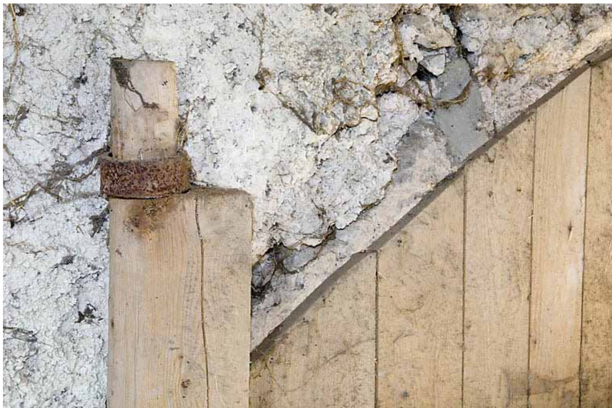
Façade postérieure, porte de grange : gond supérieur du vantail de droite. 25, Jougne, lieudit : Palzard