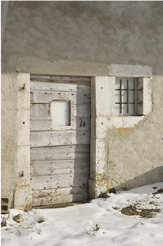
Façade antérieure : porte d'étable.