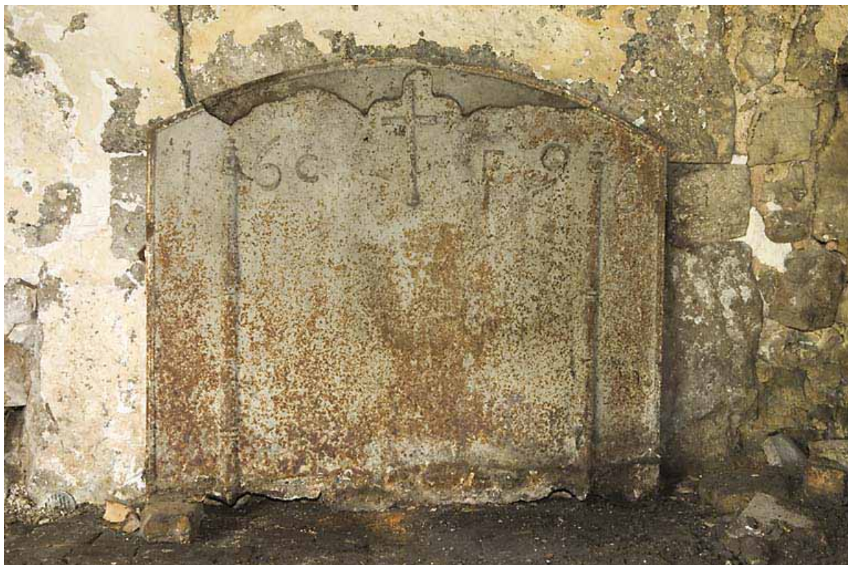
Plaque de cheminée portant la date 1696.