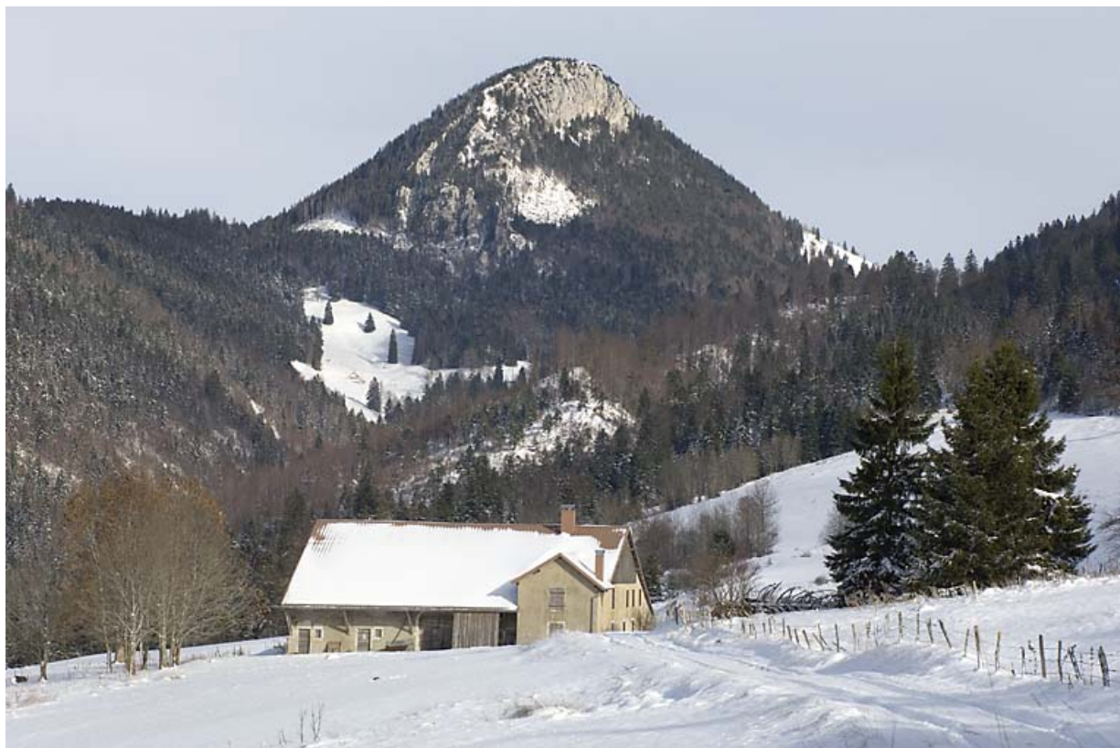
Vue d'ensemble depuis le sud-ouest, en hiver.