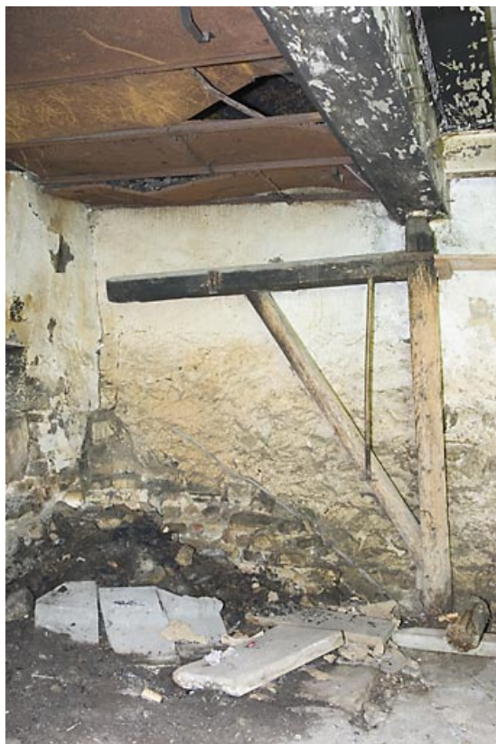
Potence de la fromagerie.