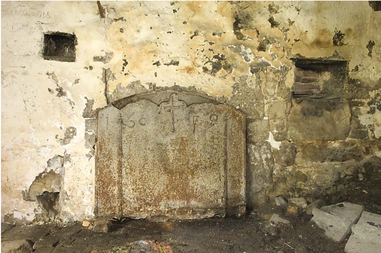
Foyer avec plaque de cheminée.