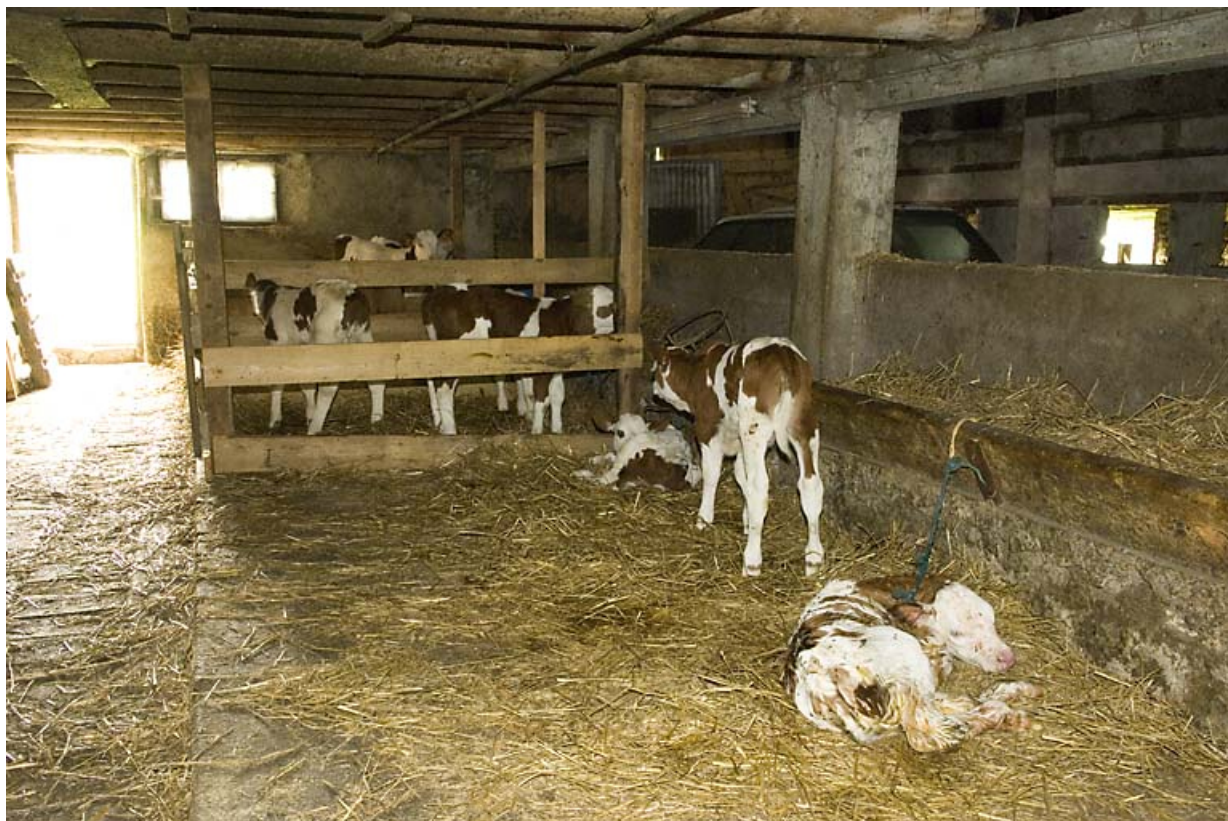
Etable, avec veaux.