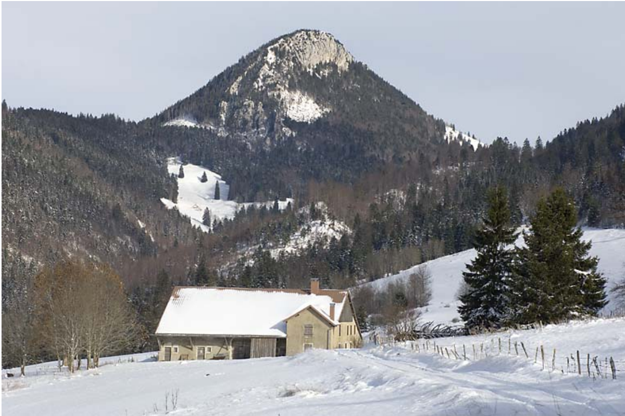
Vue d'ensemble depuis le sud-ouest, en hiver.