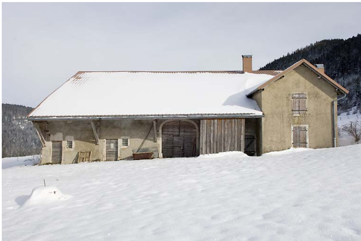
Façade antérieure, en hiver.