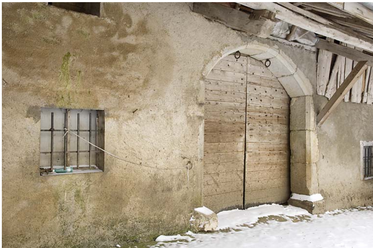
Façade postérieure : porte de grange, de trois quarts gauche. 25, Jougne, lieudit : Palzard