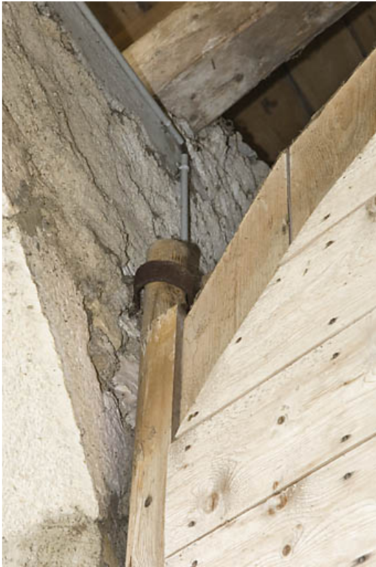
Façade postérieure, porte de grange : gond supérieur du vantail de gauche. 25, Jougne, lieudit : Palzard