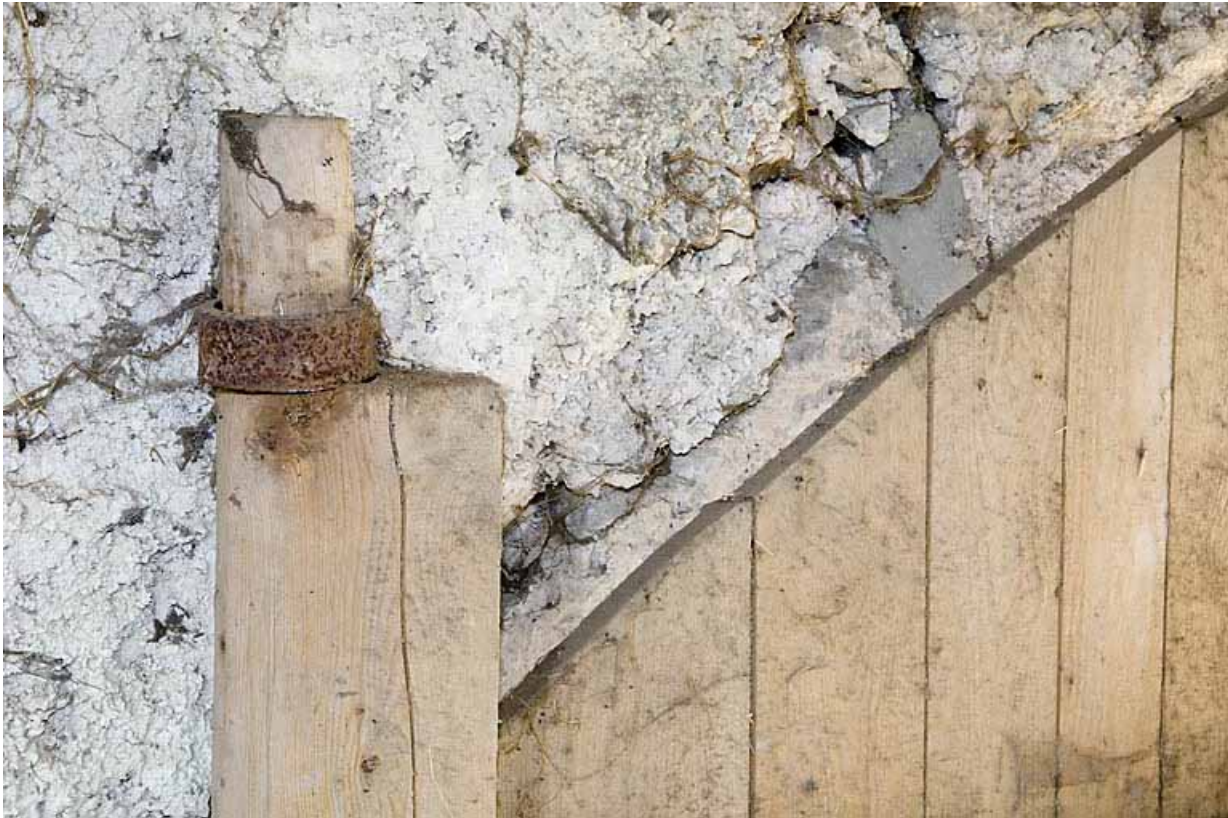
Façade postérieure, porte de grange : gond supérieur du vantail de droite. 25, Jougne, lieudit : Palzard