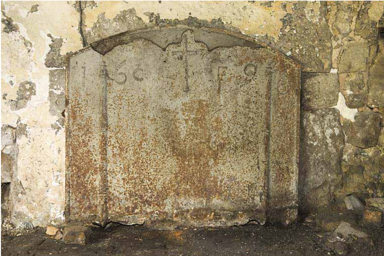
Plaque de cheminée portant la date 1696.