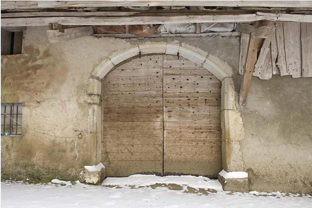
Façade postérieure : porte de grange.