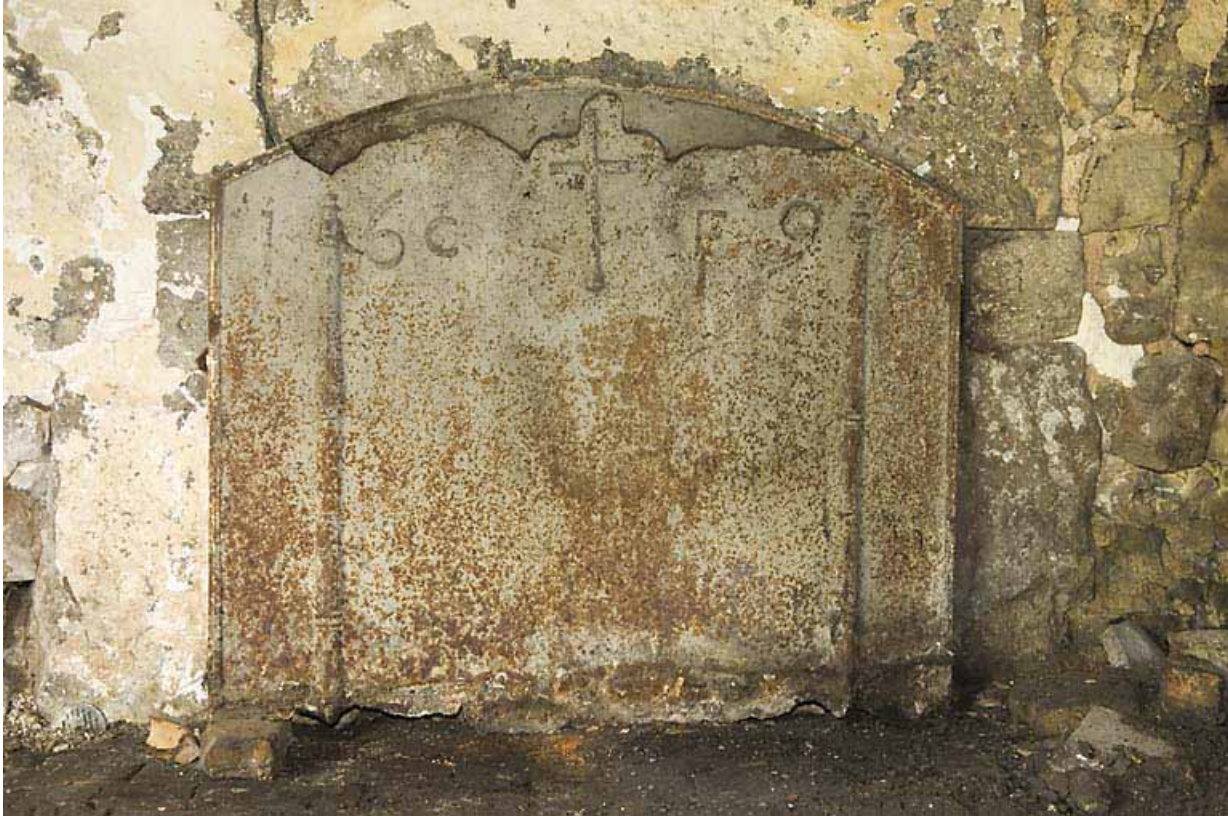
Plaque de cheminée portant la date 1696.