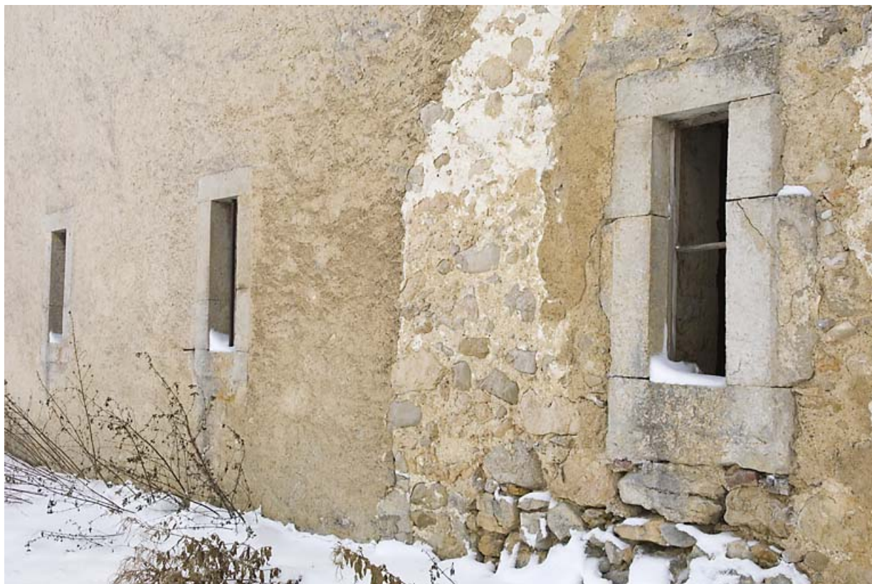
Façade latérale gauche : baies fromagères. 25, Jougne, lieudit : Palzard