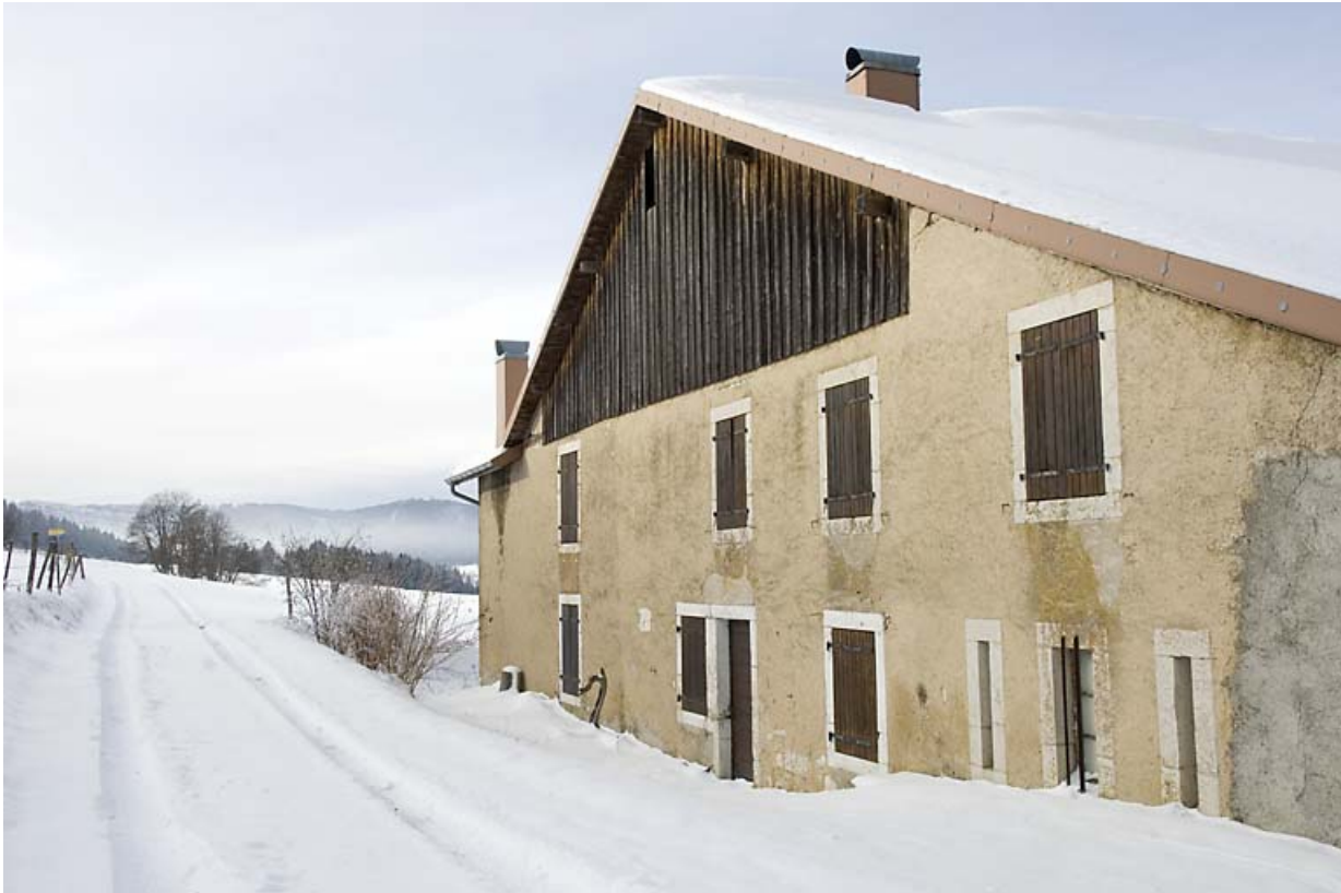
Façade latérale droite, en hiver.