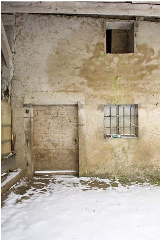
Façade postérieure : porte.