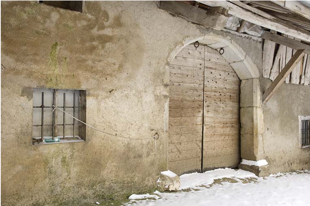
Façade postérieure : porte de grange, de trois quarts gauche. 25, Jougne, lieudit : Palzard