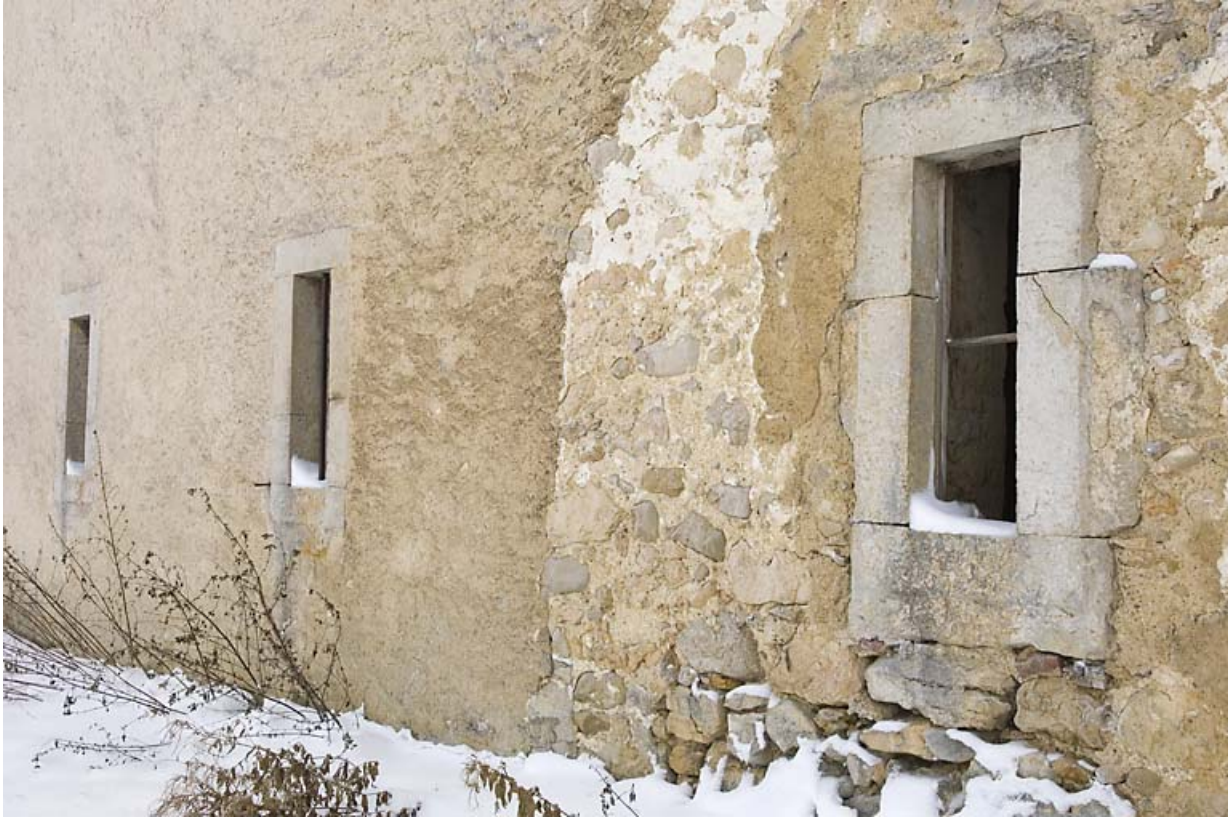
Façade latérale gauche : baies fromagères. 25, Jougne, lieudit : Palzard