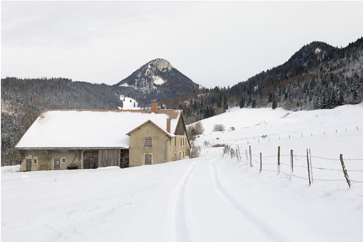
Vue d'ensemble rapprochée depuis le sud-ouest, en hiver.