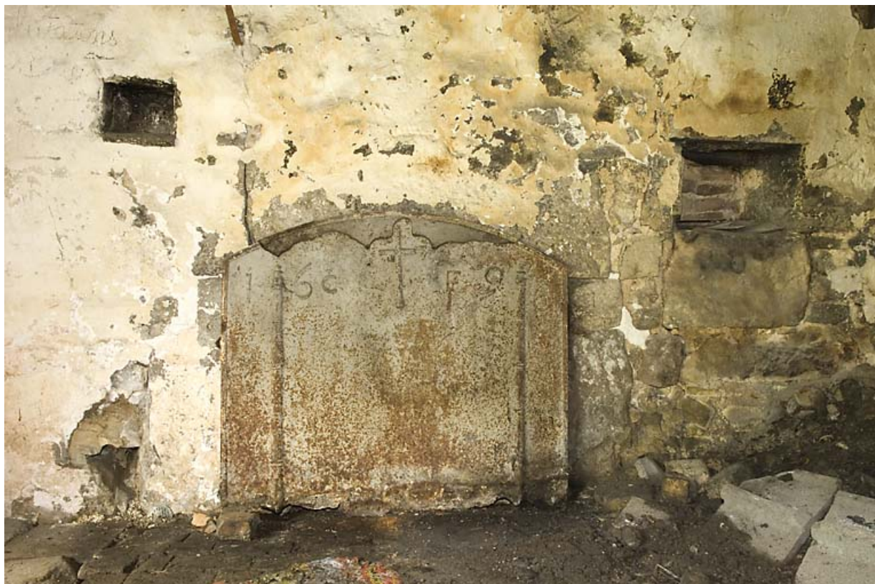
Foyer avec plaque de cheminée.