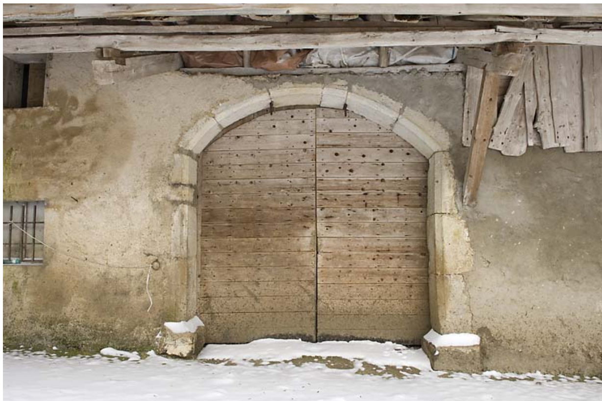
Façade postérieure : porte de grange.