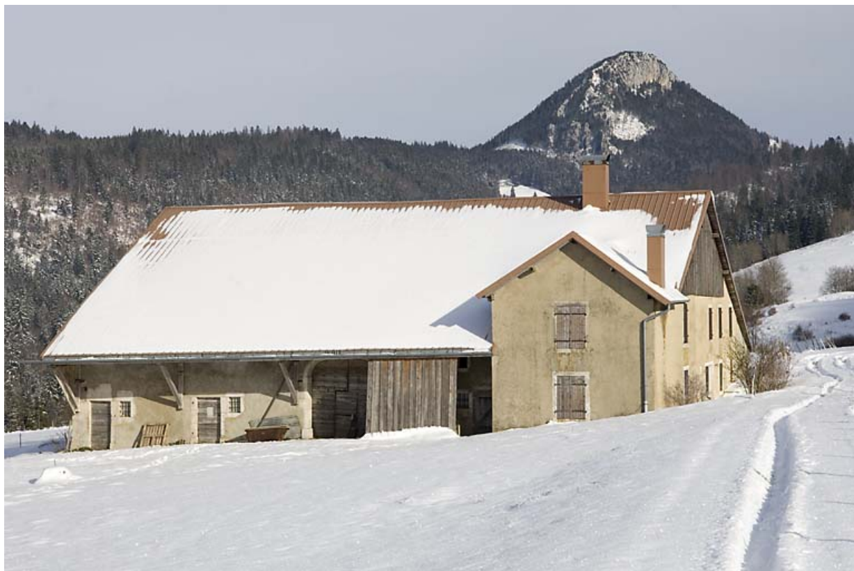
Façades antérieure et latérale droite, en hiver.