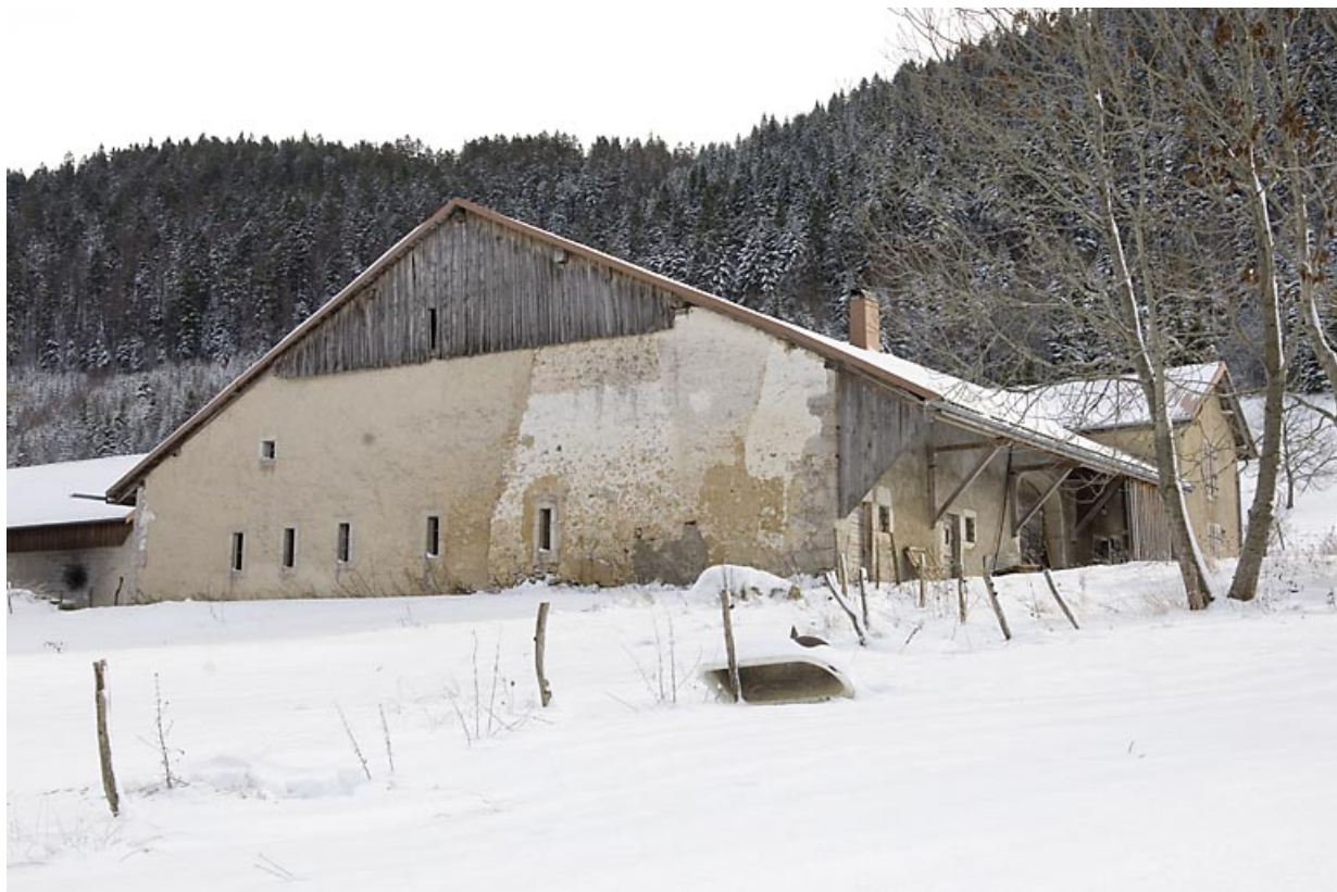
Façade latérale gauche, en hiver.