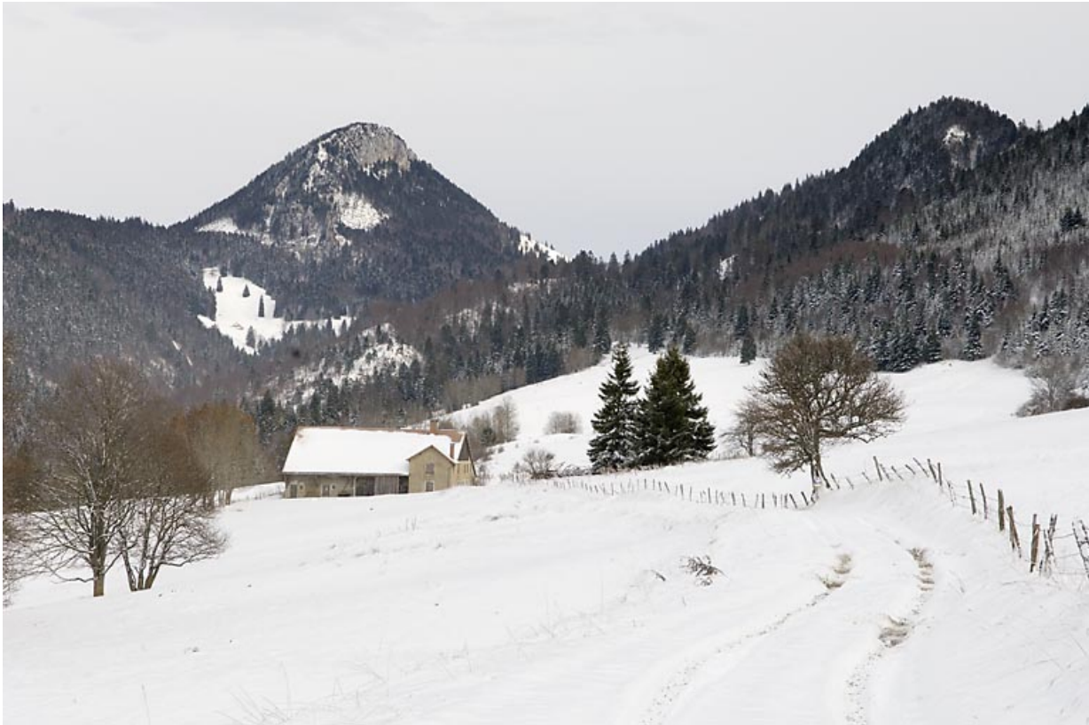
Vue d'ensemble depuis le sud-ouest, en hiver.