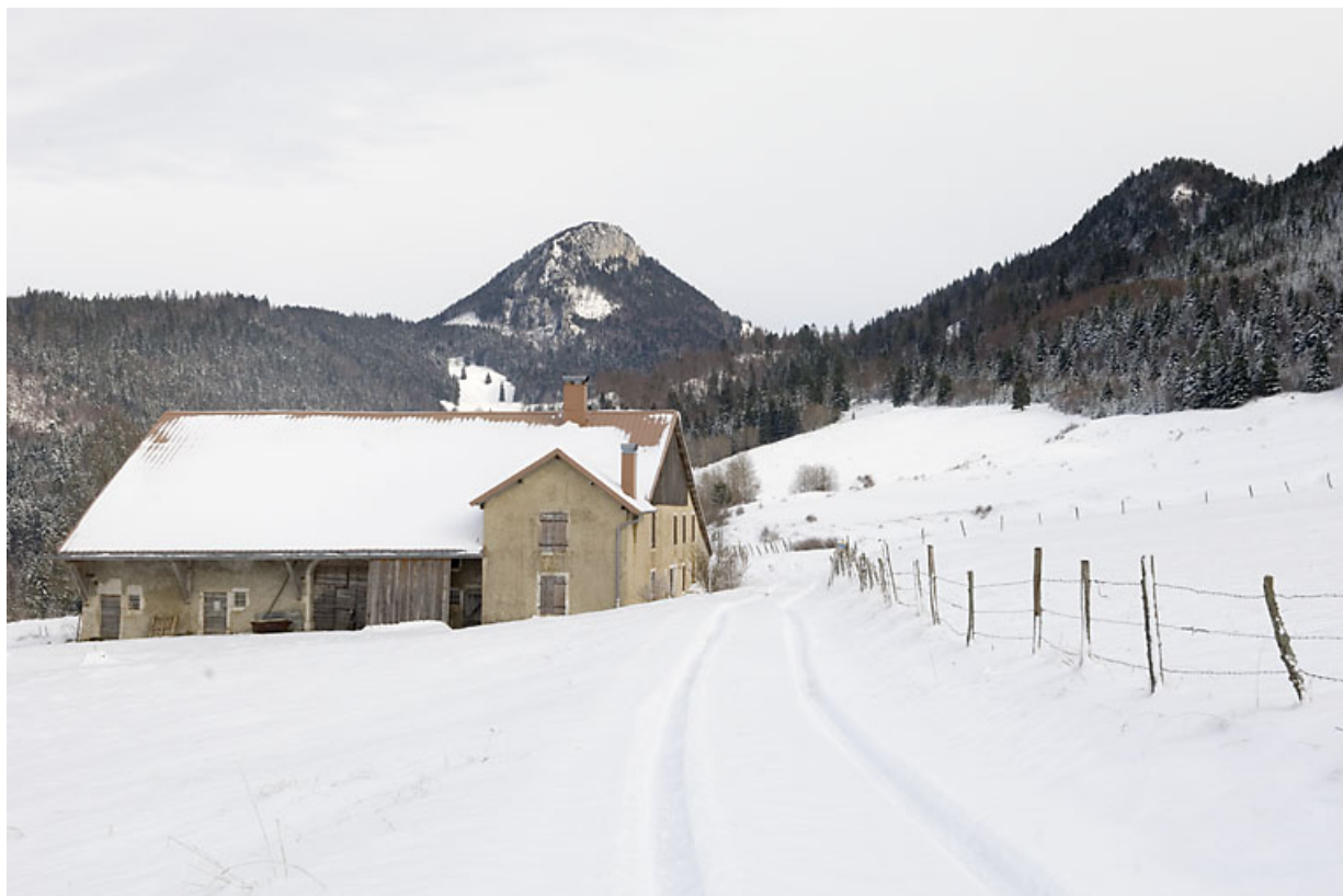
Vue d'ensemble rapprochée depuis le sud-ouest, en hiver.