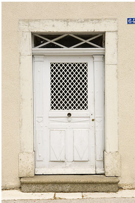
Bâtiment 62-64 rue des Forges : porte (64 rue des Forges). 25, Jougne