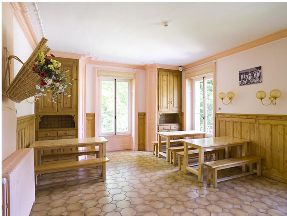
"Grand Château" : intérieur d'une salle. 25, Jougne