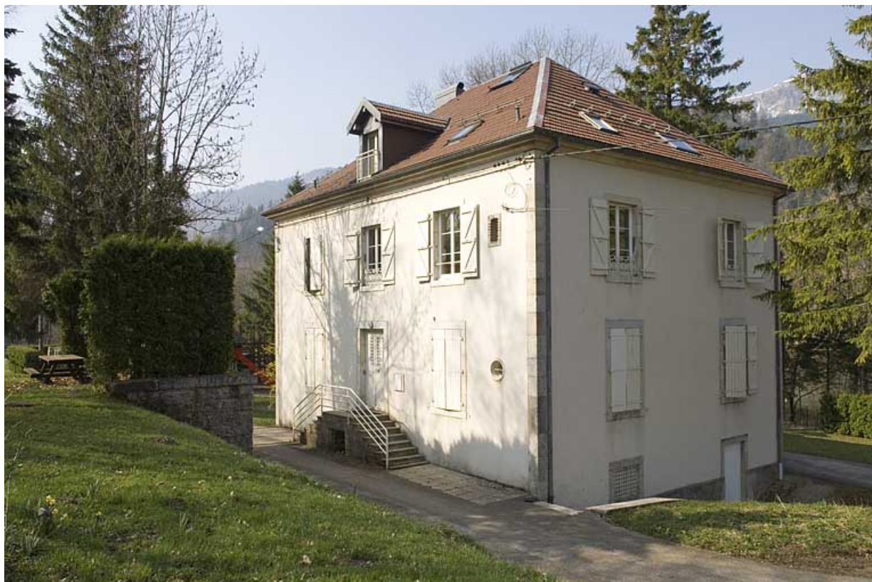
Logement patronal dit le "Petit Château" (21 rue des Forges, 2020 AI 44). 25, Jougne