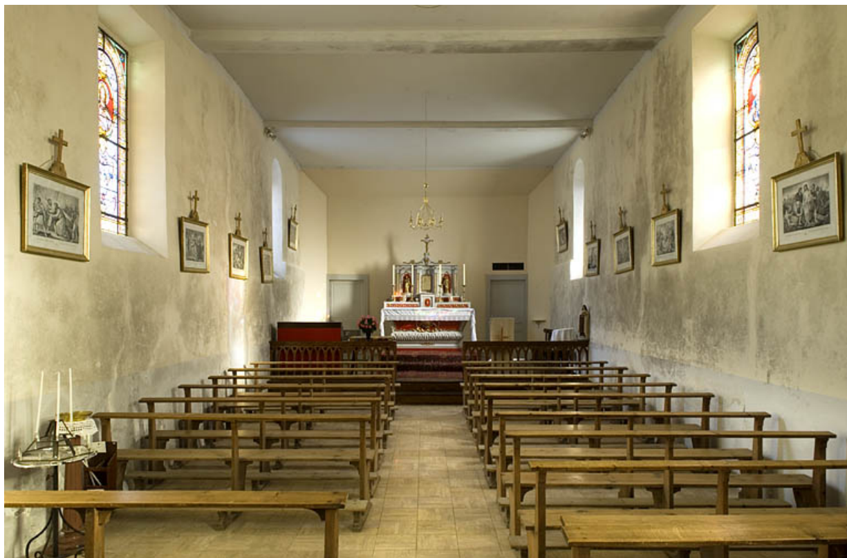
Intérieur de la chapelle.