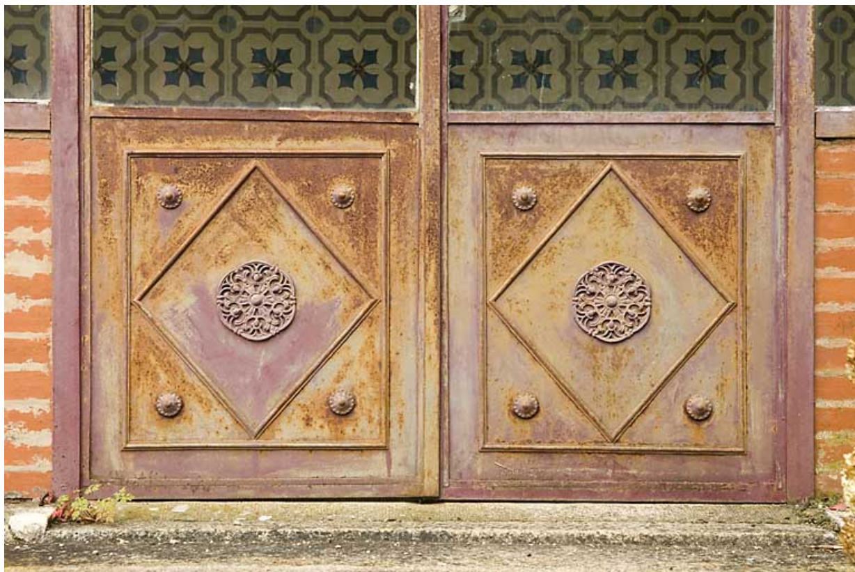
Serre : ferronnerie de la porte.