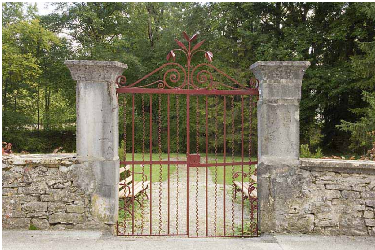
Grille du jardin, face au bâtiment 62-64 rue des Forges. 25, Jougne