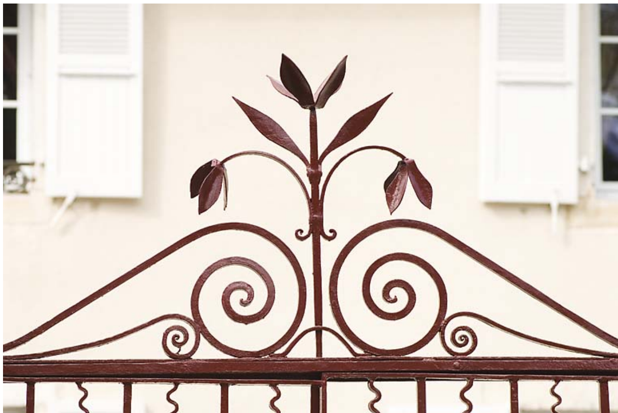
Décor de la grille. 25, Jougne