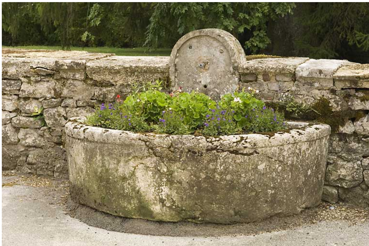
Fontaine contre le mur du jardin, face au bâtiment 62-64 rue des Forges. 25, Jougne