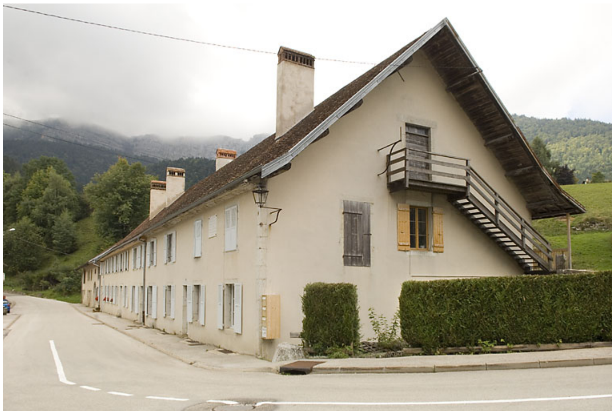
Ancien bâtiment des forges puis logement patronal (62-64 rue des Forges, 2020 Ai 94, 232). 25, Jougne