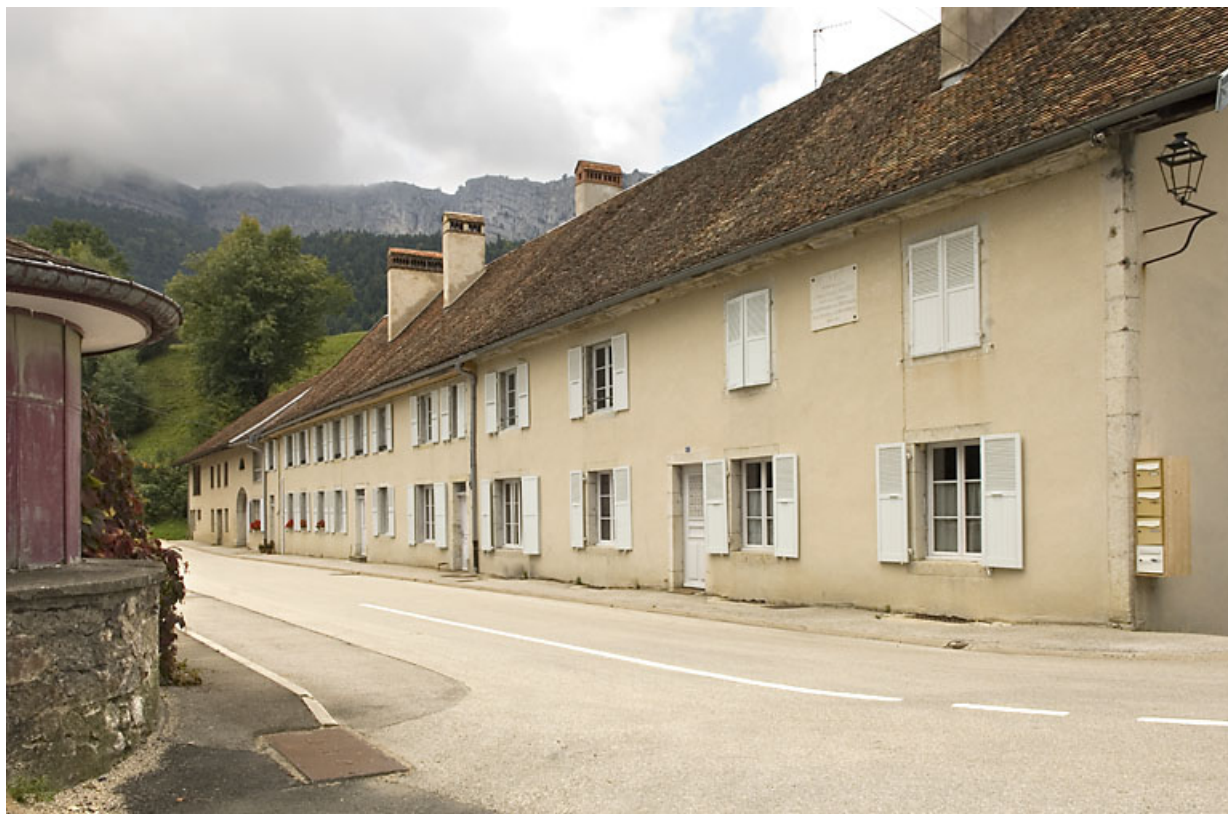
Bâtiment 62-64 rue des Forges, vu de trois quarts droite. 25, Jougne