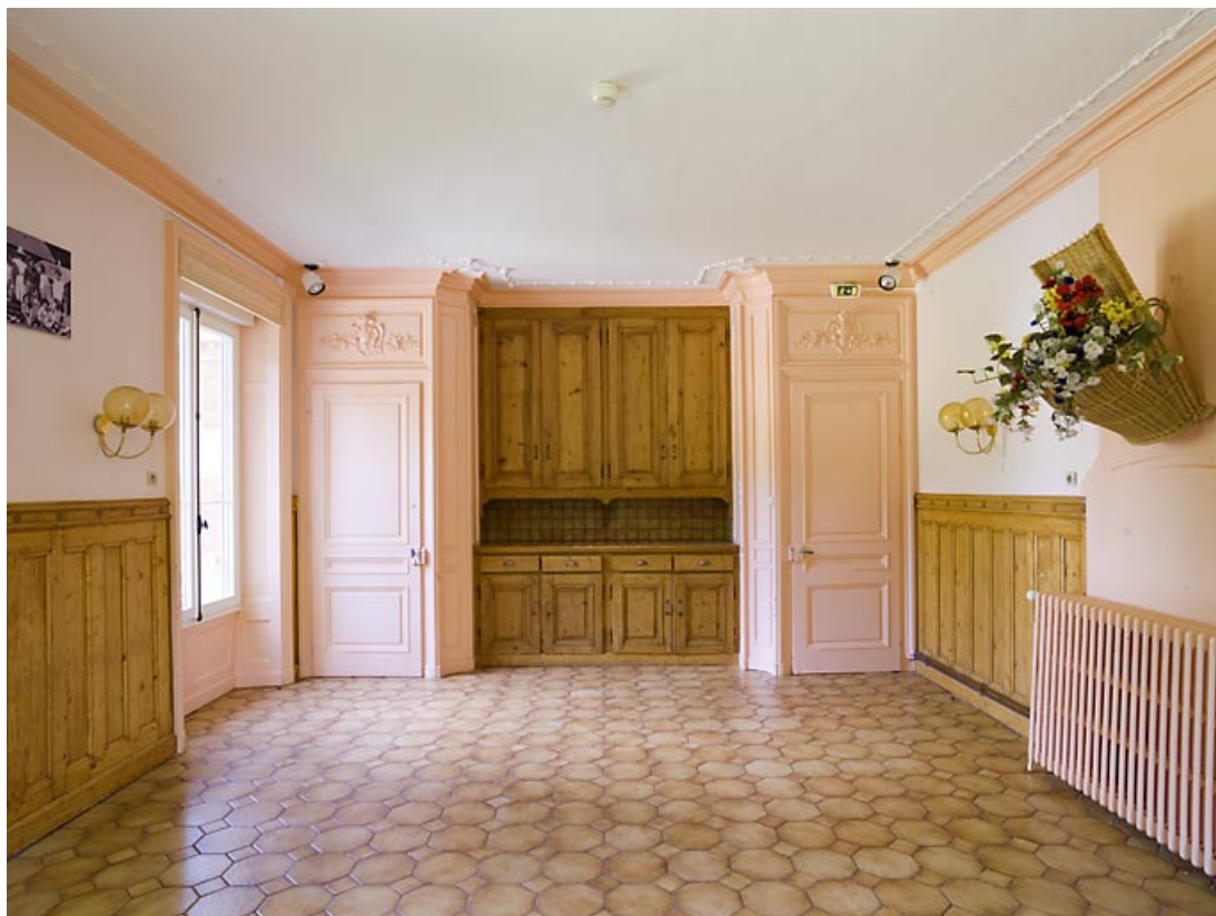
"Grand Château" : intérieur d'une salle. 25, Jougne