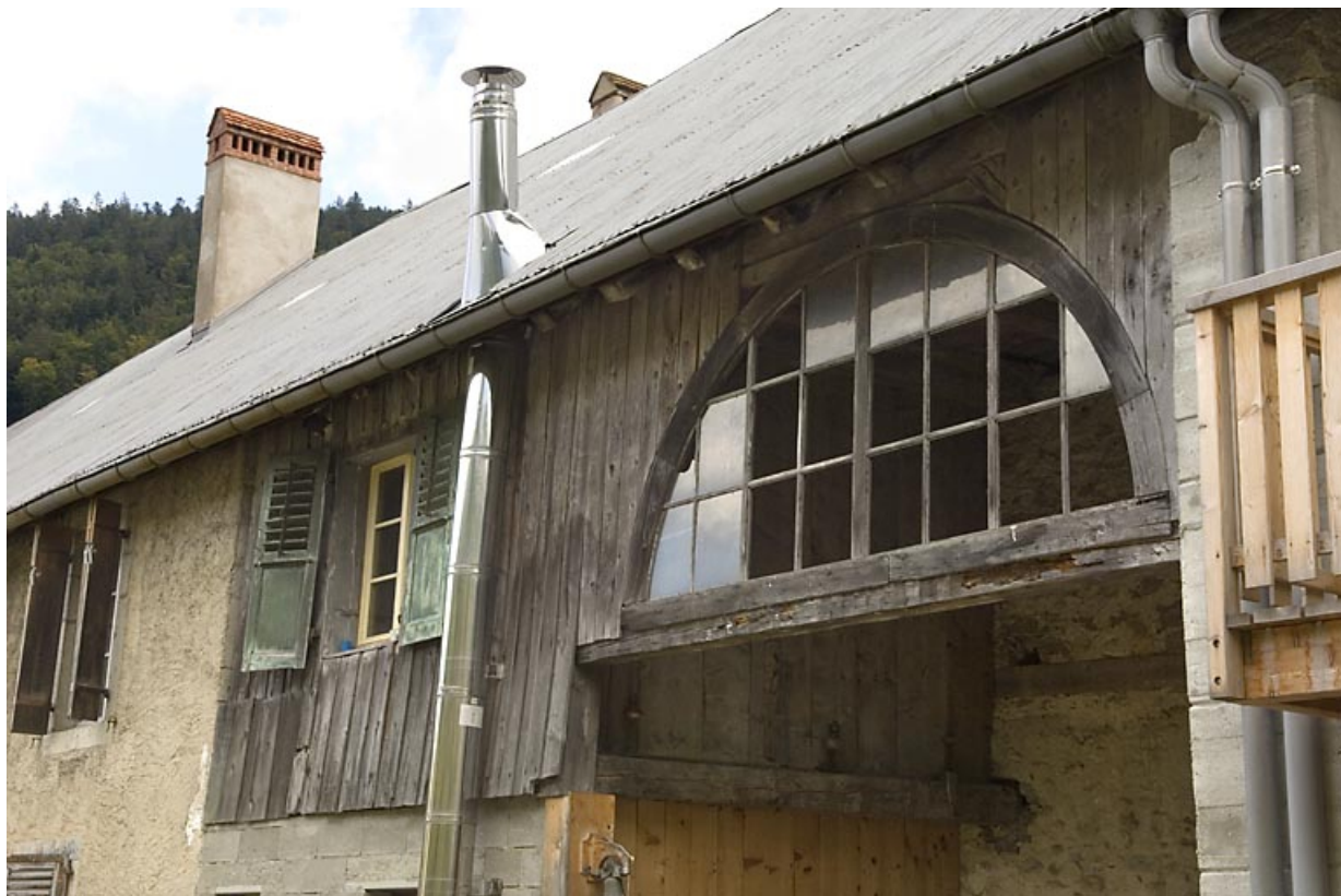
Bâtiment 62-64 rue des Forges : portail sur la façade postérieure. 25, Jougne