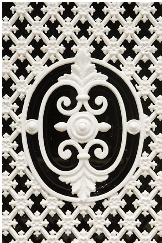
Bâtiment 62-64 rue des Forges : détail de la ferronnerie d'une porte (64 ter rue des Forges). 25, Jougue