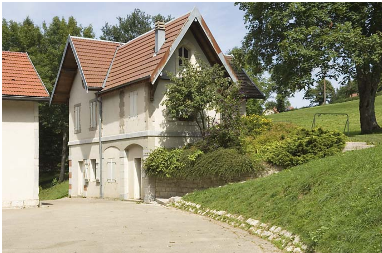
"Grand Château" : dépendance.