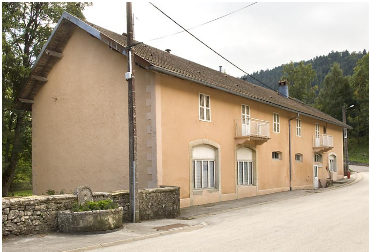
Bâtiment 25 rue des Forges : façade antérieure, de trois quarts gauche. 25, Jougne