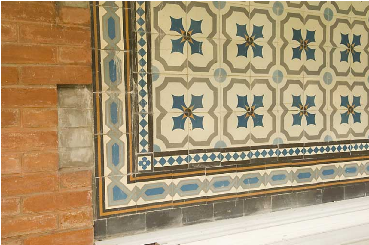
Serre : décor mural de carreaux. 25, Jougne