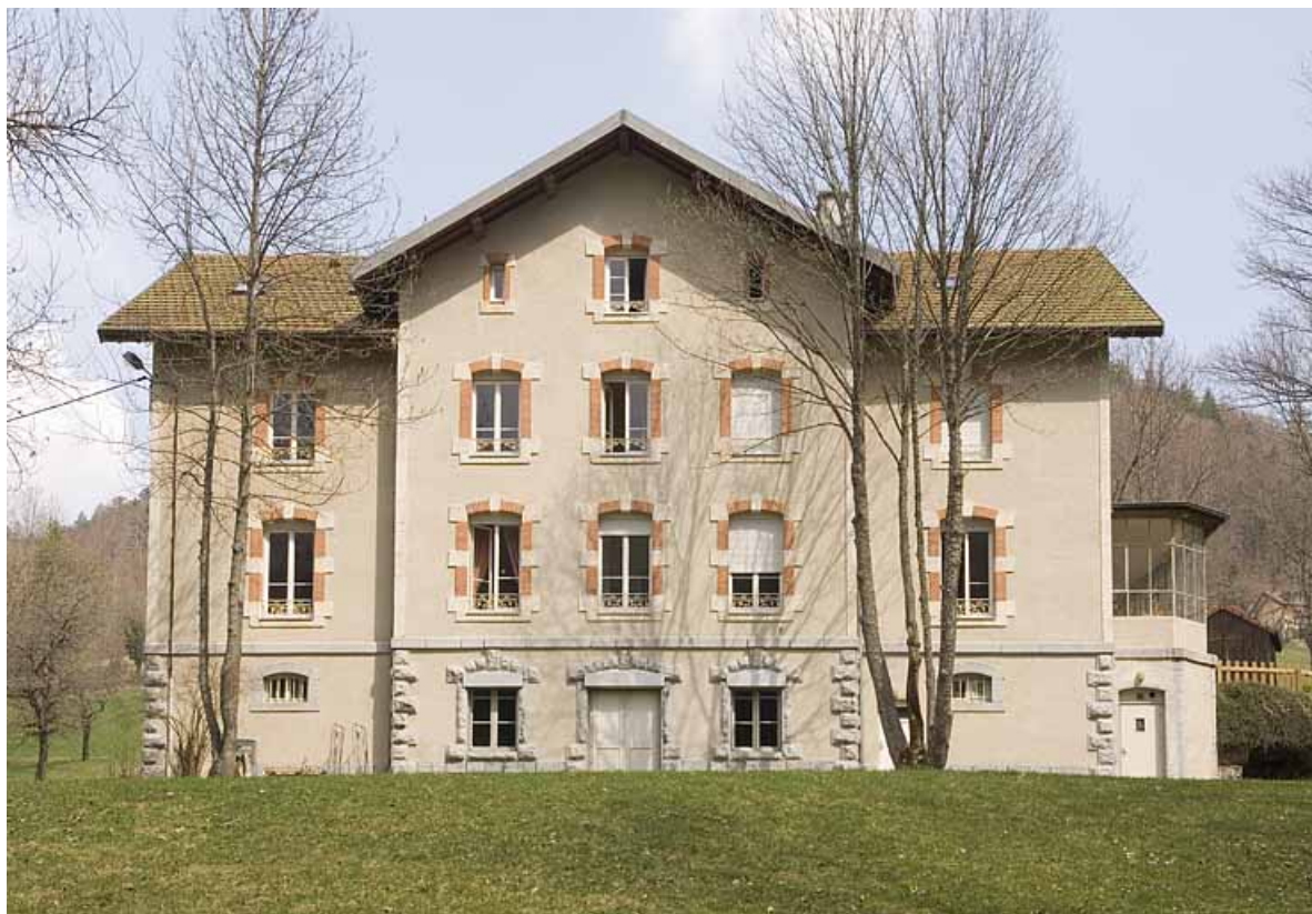
Logement patronal dit le "Grand Château" (2020 AI 47) : façade postérieure. 25, Jougne