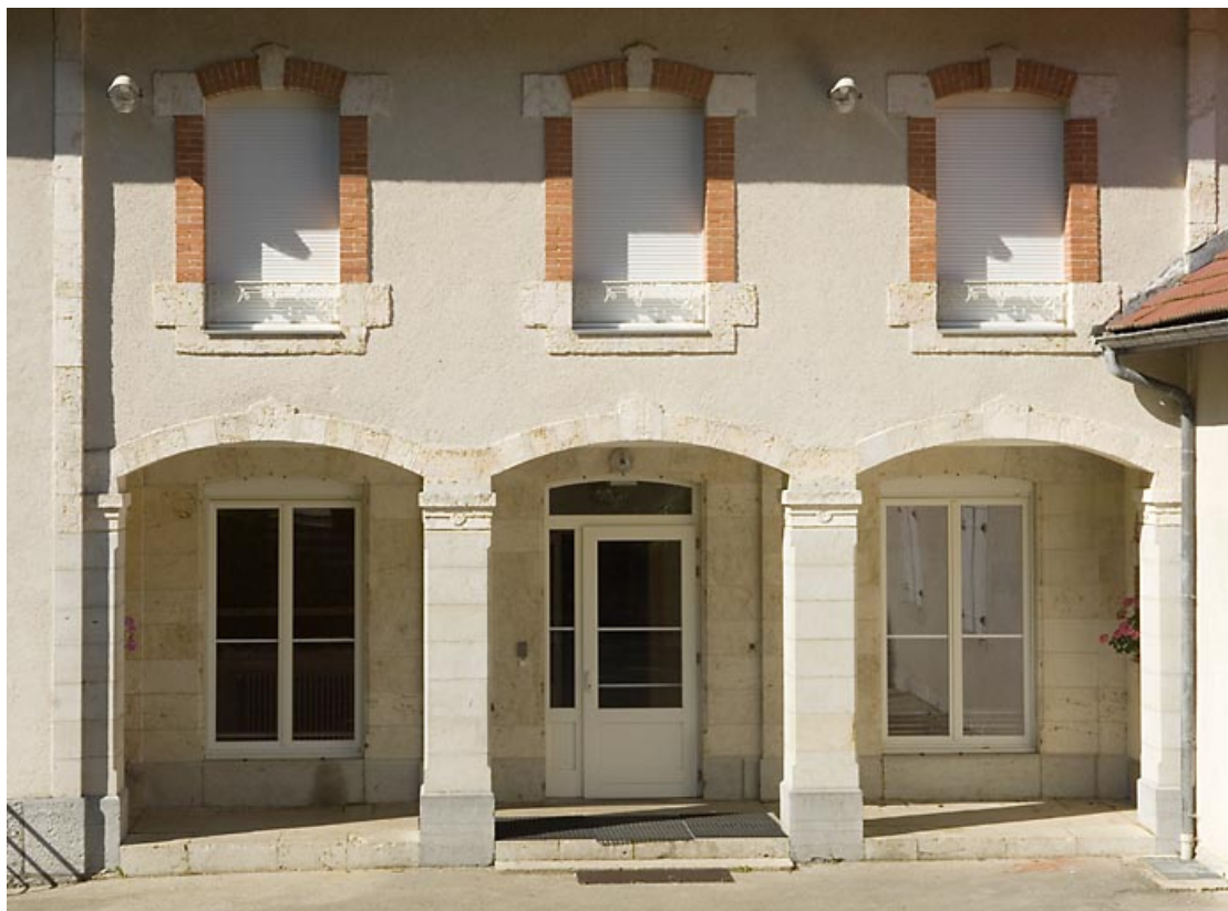
"Grand Château" : baies sur la façade antérieure. 25, Jougne