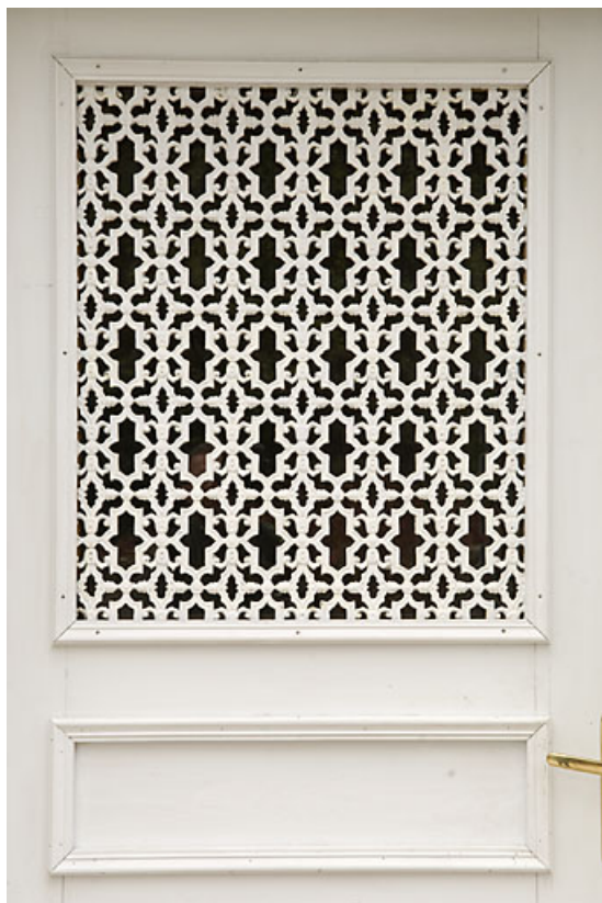
Bâtiment 62-64 rue des Forges : ferronnerie d'une porte (62 rue des Forges). 25, Jougne