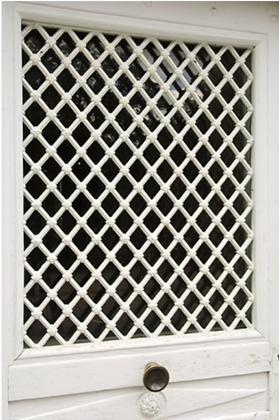
Bâtiment 62-64 rue des Forges : détail de la ferronnerie de la porte (64 rue des Forges). 25, Jougne