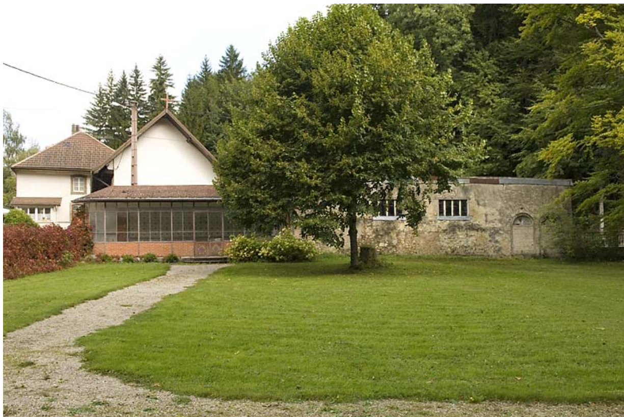
Serre et garage dans le jardin (2020 AI 324). 25, Jougne