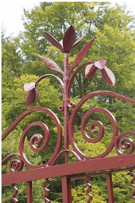
Décor de la grille.