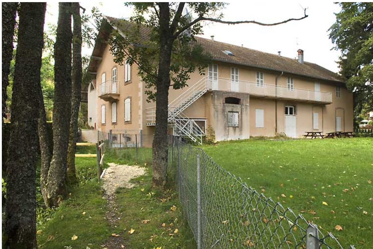
Bâtiment 25 rue des Forges : façade postérieure, de trois quarts gauche. 25, Jougne