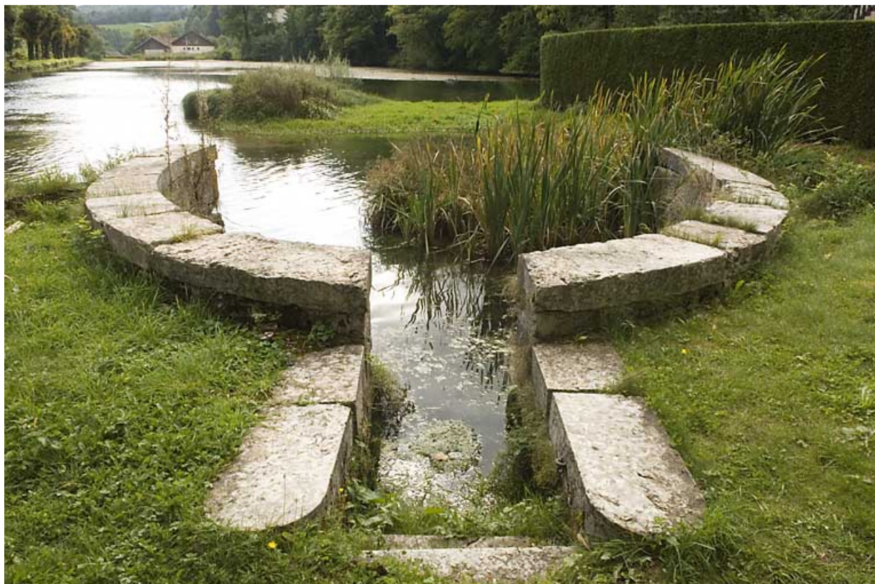
Embarcadère sur l'étang nord.