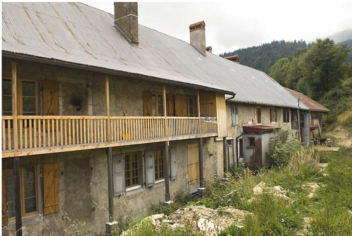
Bâtiment 62-64 rue des Forges : façade postérieure, de trois quarts gauche. 25, Jougne