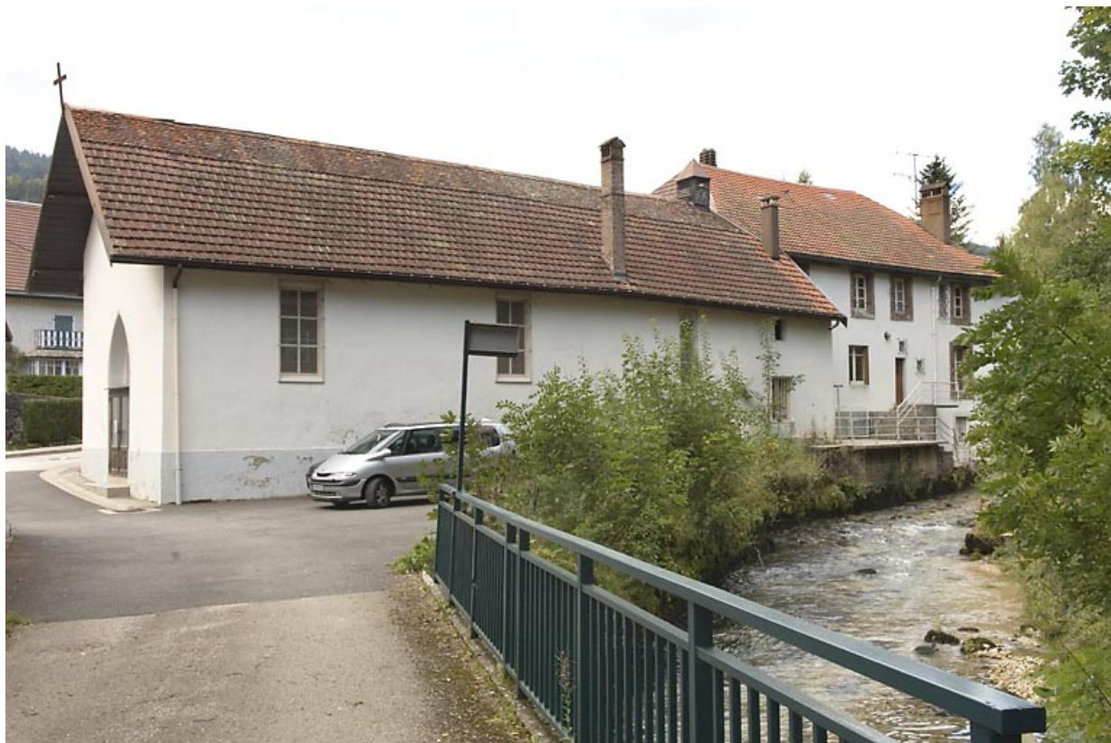
Chapelle rue des Forges : façade latérale droite. 25, Jougne