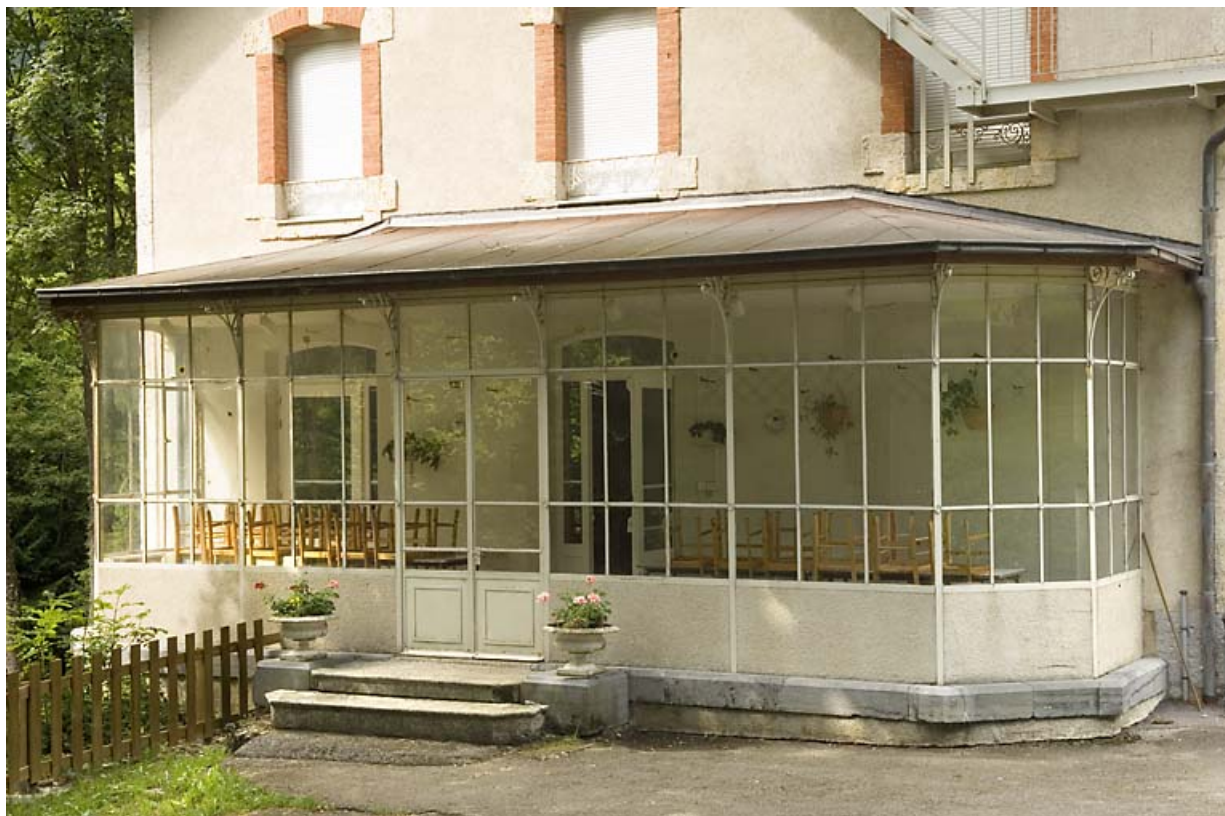
"Grand Château" : véranda.