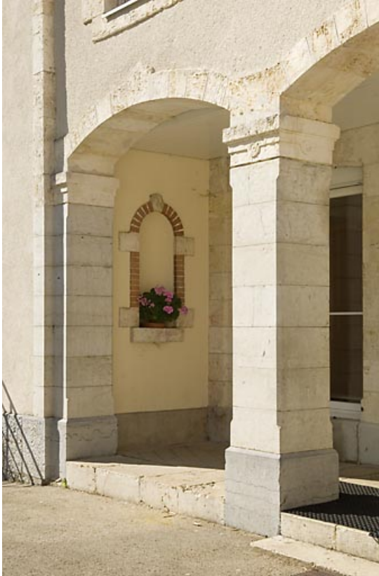
"Grand Château" : détail de la galerie. 25, Jougne