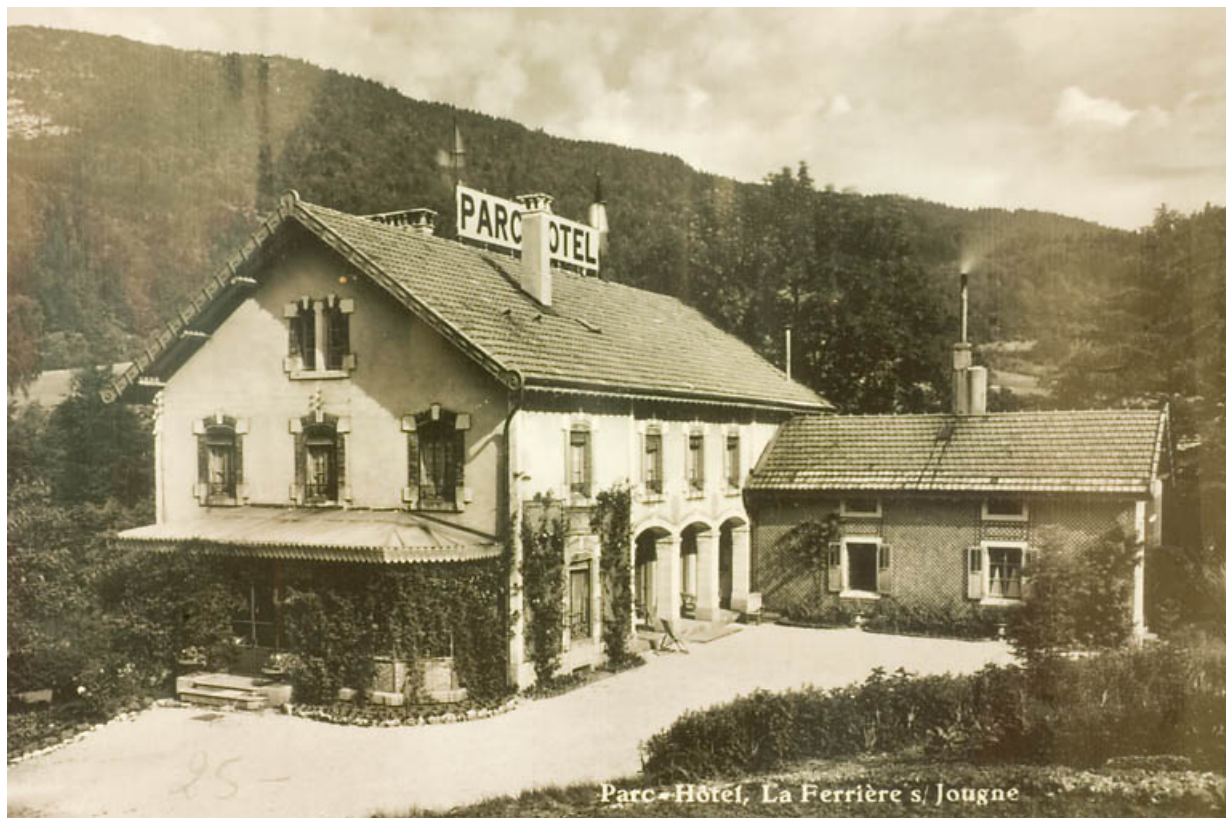
Parc-Hôtel, La Ferrière s/ Jougne [le "Grand Château"], [milieu 20e siècle]. 25, Jougne