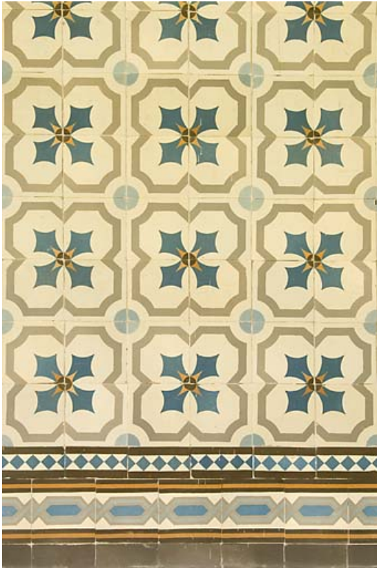
Serre : détail du décor mural de carreaux. 25, Jougne