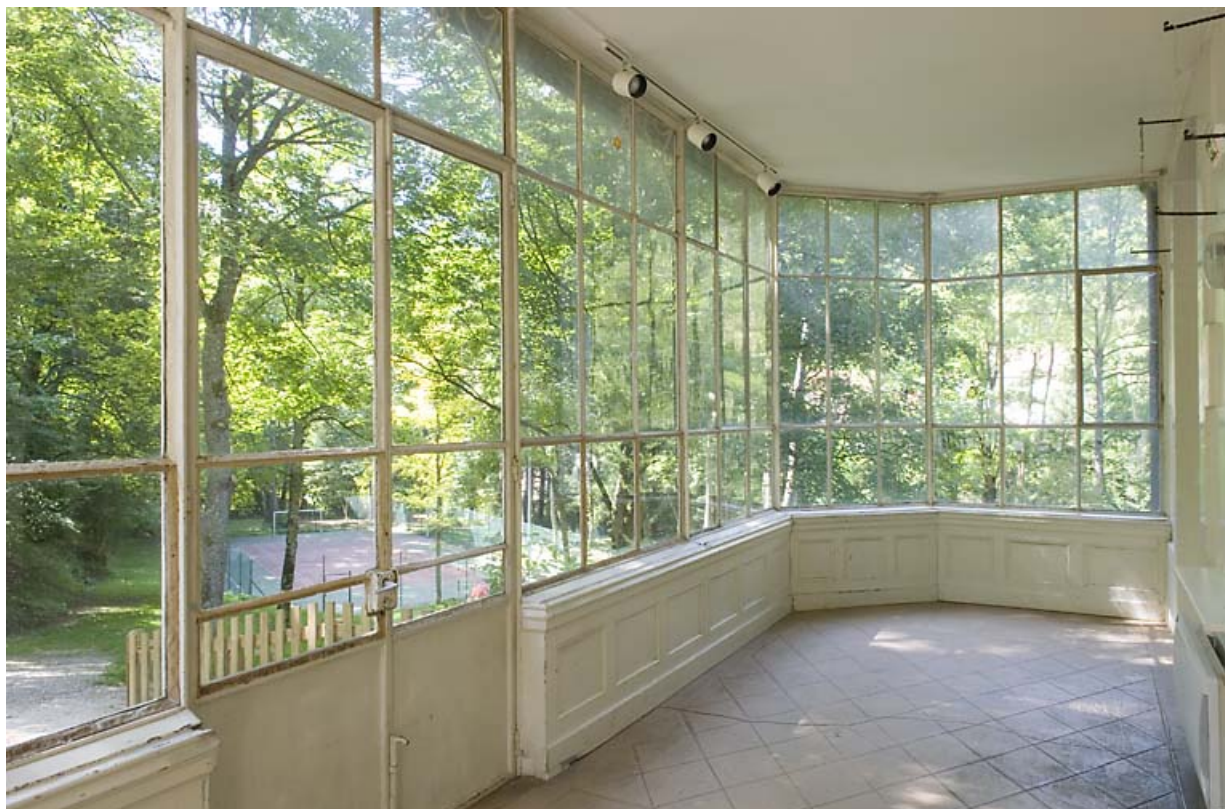
"Grand Château" : intérieur de la véranda.