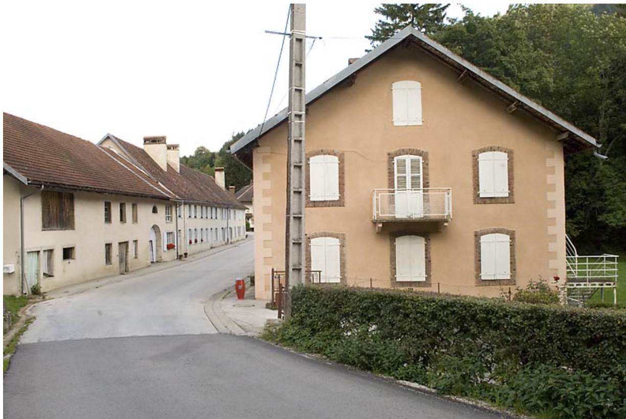
Bâtiment 25 rue des Forges (2020 AI 326) : façade latérale droite. 25, Jougne