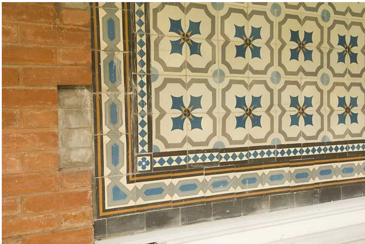
Serre : décor mural de carreaux.