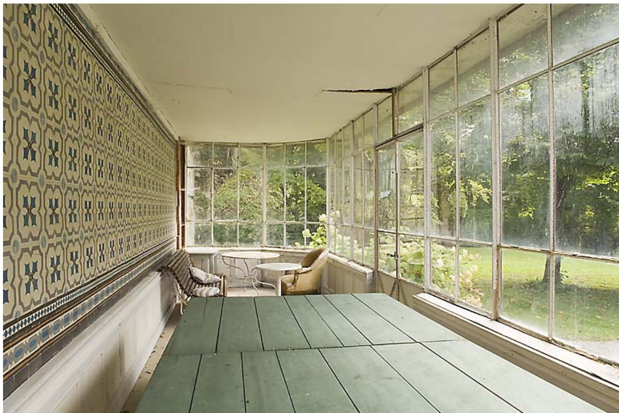
Serre : intérieur.