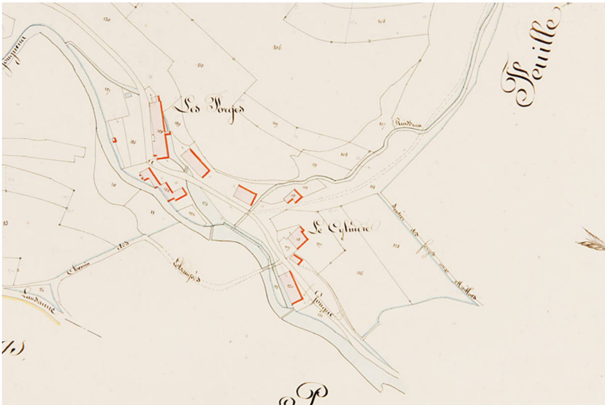
Section C de la Ferrière en trois feuilles, 2e feuille [plan cadastral : détail de la partie droite en bas, les Forges et le Cylindre], 1839. 25, Jougne