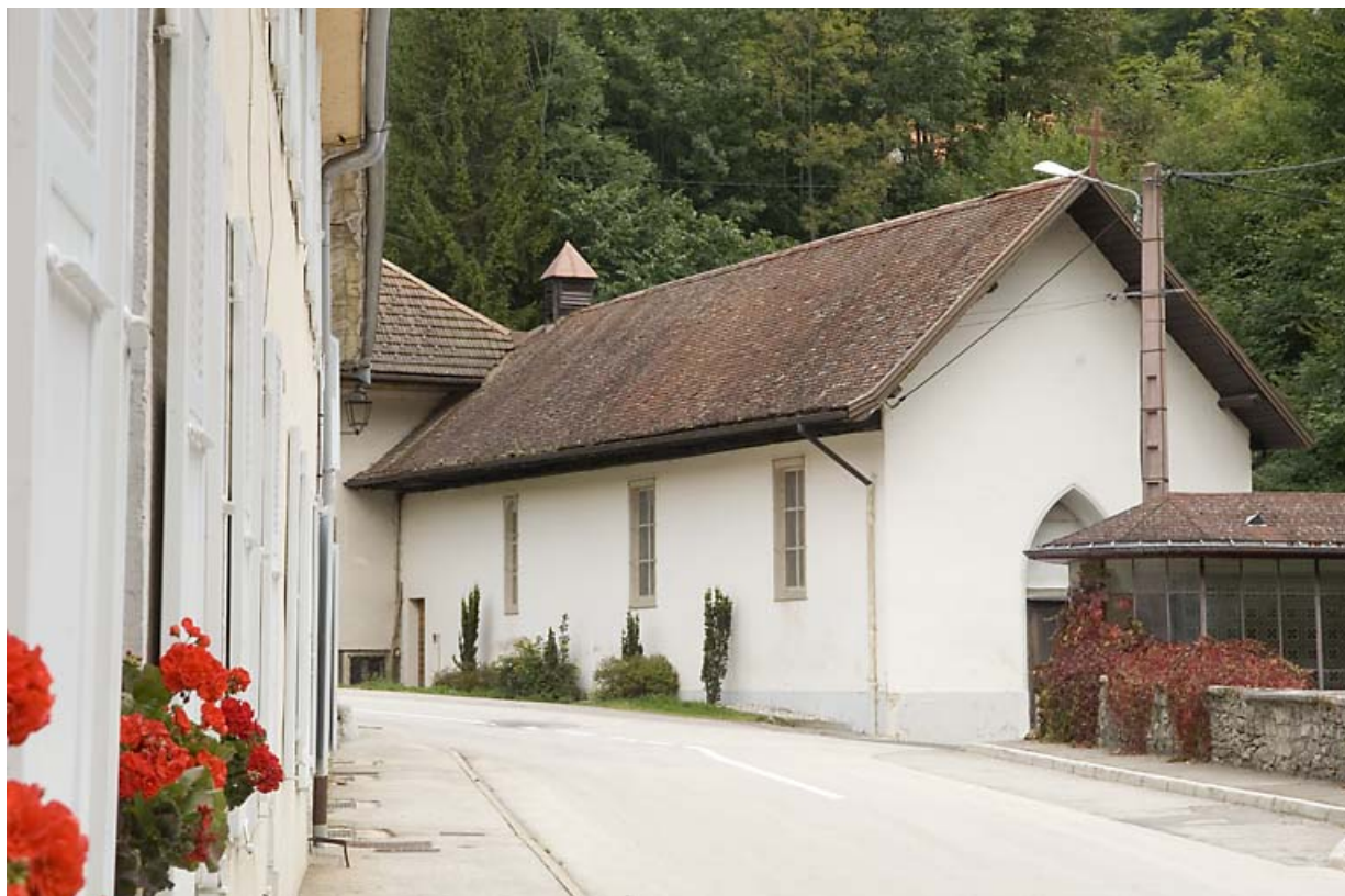
Chapelle rue des Forges (2020 AI 355) : façades antérieure et latérale gauche. 25, Jougne