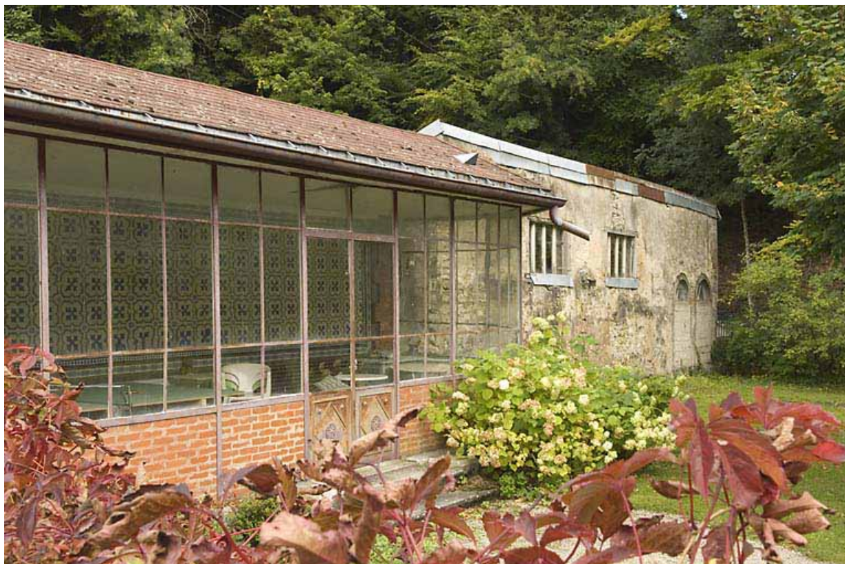
Serre et garage, vus de trois quarts.