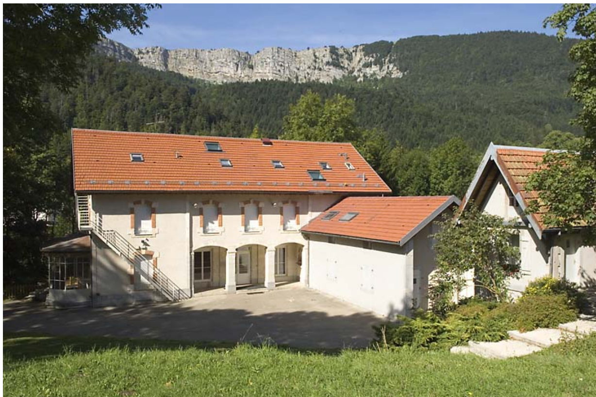
Logement patrimonial dit le "Grand Château" (2020 AI 47) : façade antérieure. 25, Jougne