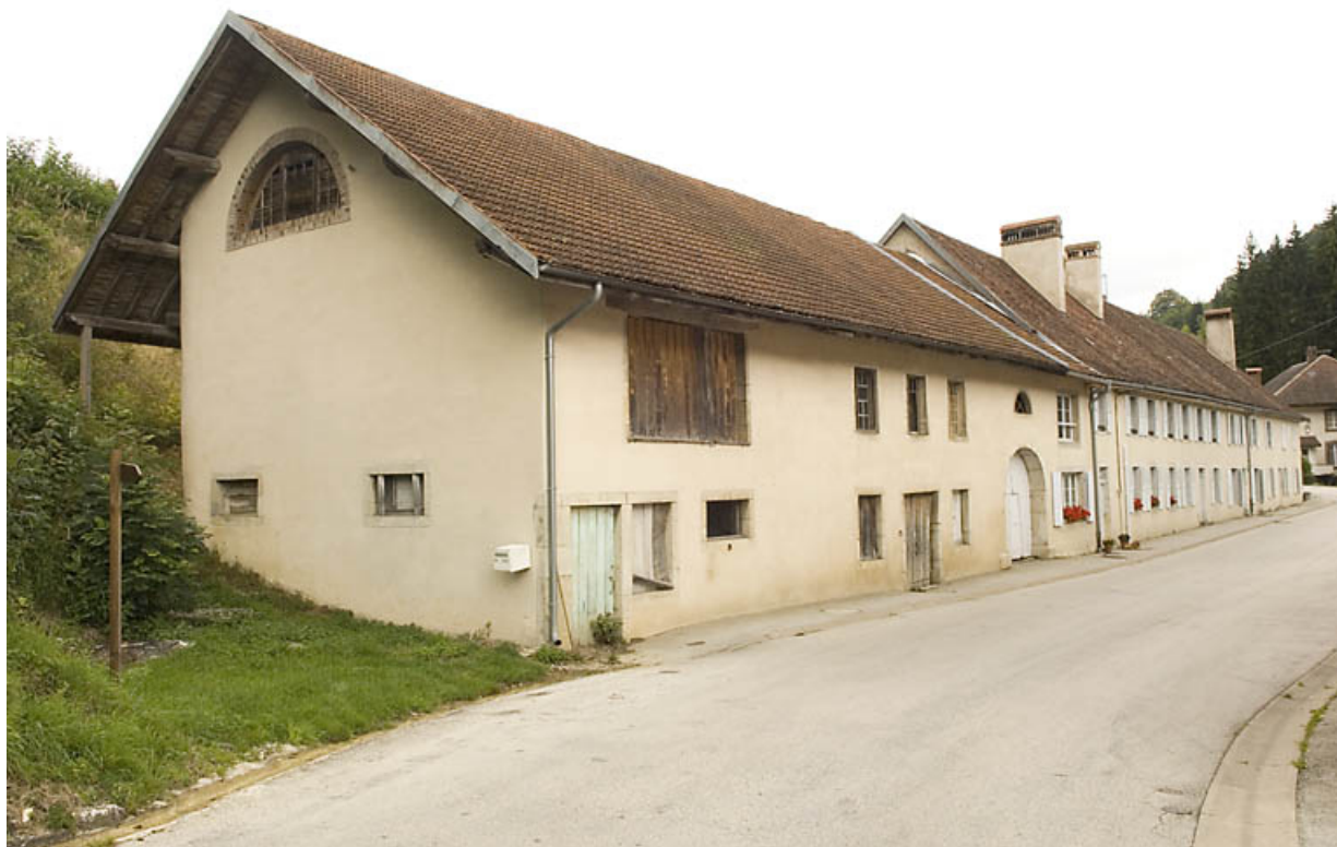
Bâtiment 62-64 rue des Forges, vu de trois quarts gauche. 25, Jougne