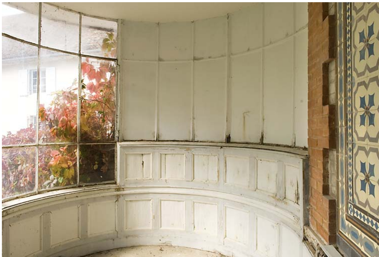
Serre : intérieur (extrémité nord-ouest). 25, Jougne