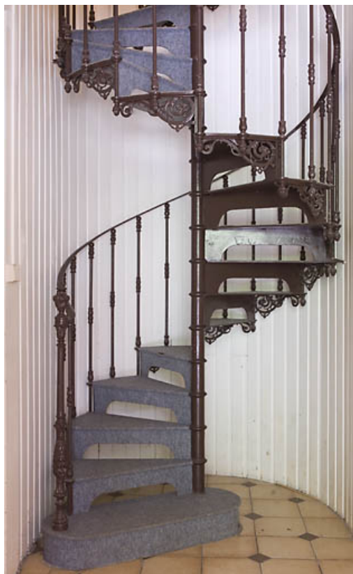
"Grand Château" : escalier métallique en vis. 25, Jougne