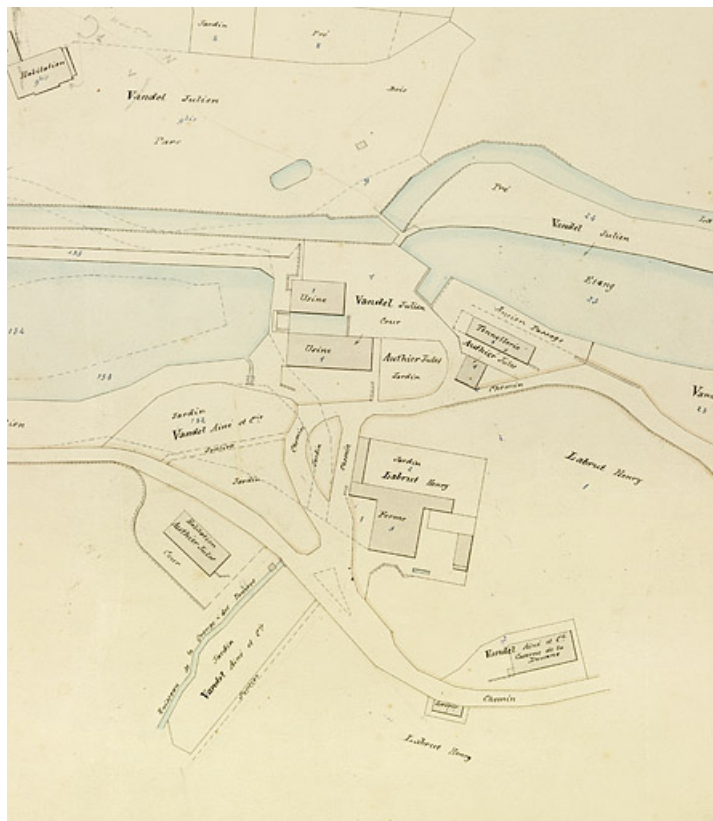
La Ferrière [2e feuille. Détail : partie centrale, droite], 1906-1907. 25, Jougue