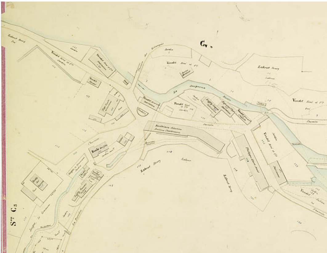
La Ferrière [2e feuille. Détail : partie gauche, haut], 1906-1907. 25, Jougne