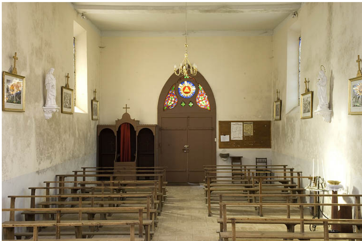
Chapelle rue des Forges : nef vue du chœur. 25, Jougne