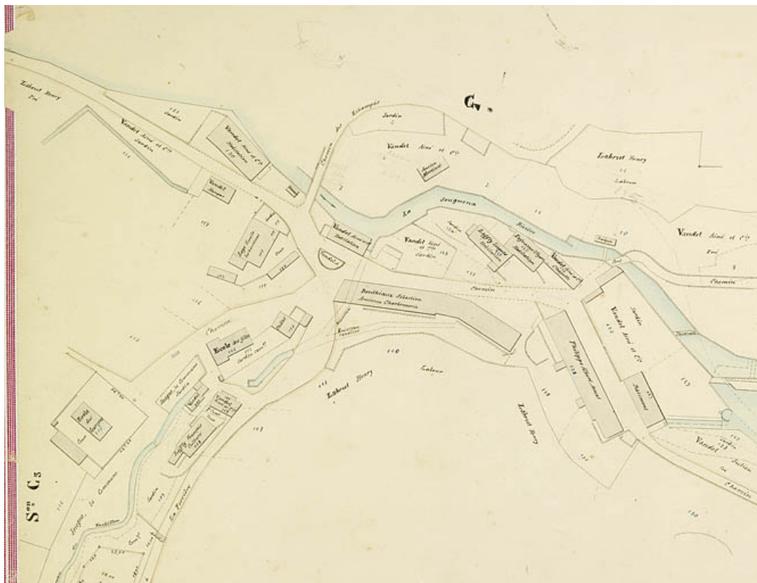
La Ferrière [2e feuille. Détail : partie gauche, haut], 1906-1907. 25, Jougne