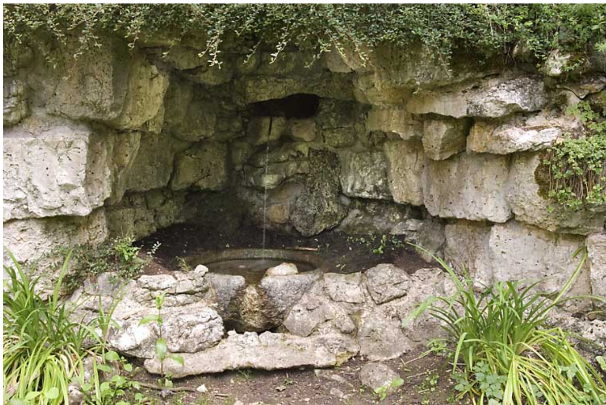
"Grand Château" : fontaine dans une grotte artificielle. 25, Jougne