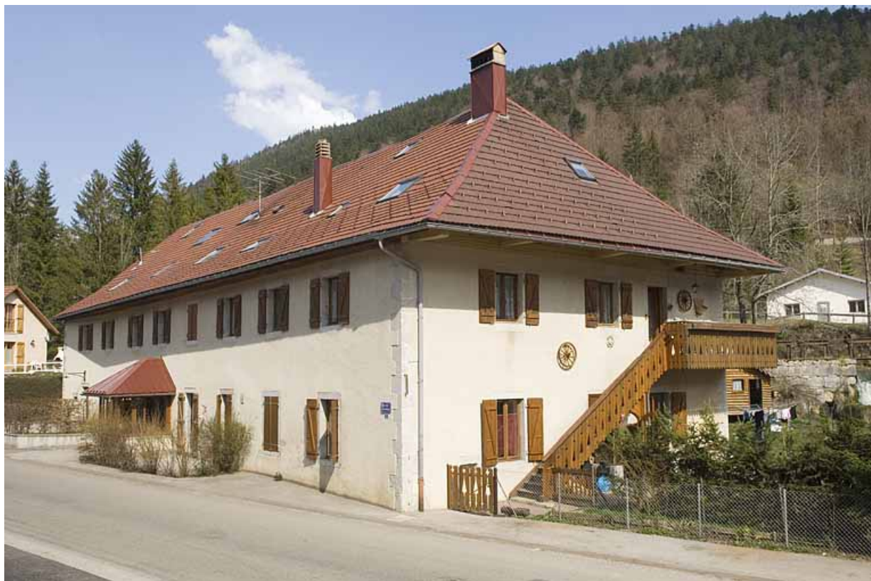
Ancien bâtiment du "Cylindre" puis logement d'ouvriers, 11 rue des Forges (2020 Ai 259). 25, Jougne