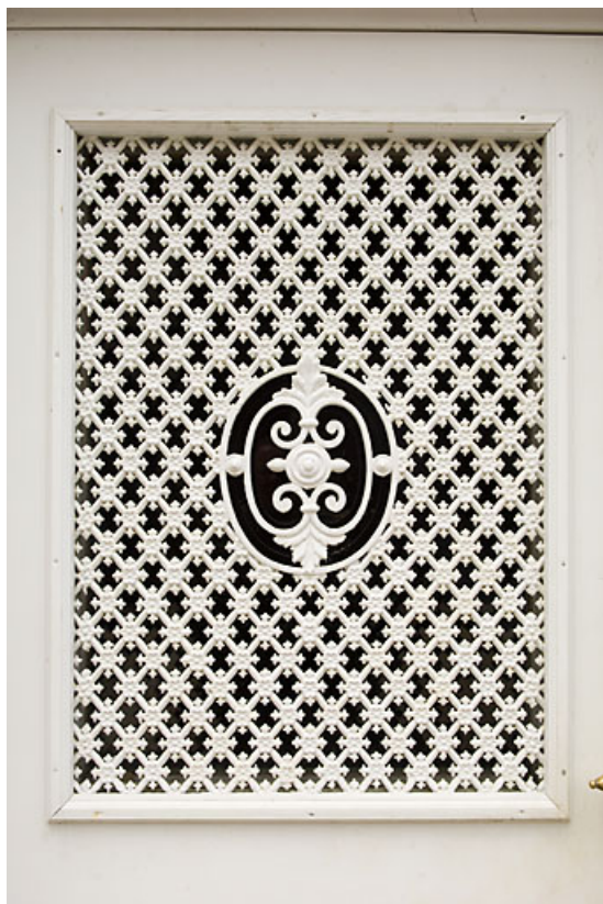
Bâtiment 62-64 rue des Forges : ferronnerie d'une porte (64 ter rue des Forges). 25, Jougue