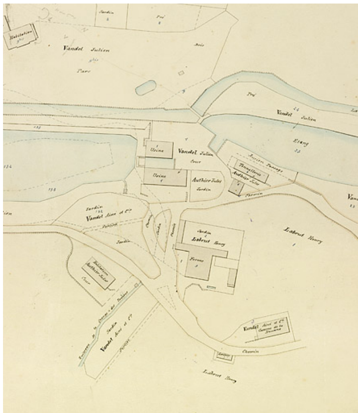
La Ferrière [2e feuille. Détail : partie centrale, droite], 1906-1907. 25, Jougue