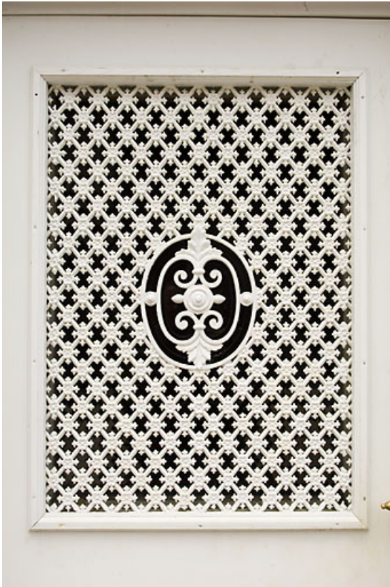
Bâtiment 62-64 rue des Forges : ferronnerie d'une porte (64 ter rue des Forges). 25, Jougue