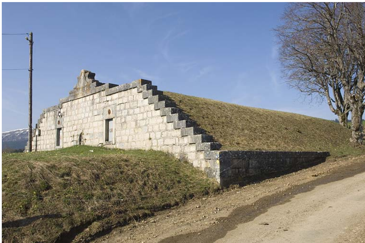
Vue rapprochée. 25, Jougne