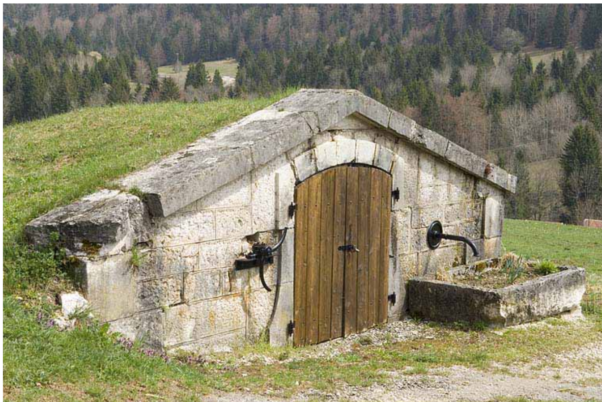
Réservoir des Maillots, de trois quarts gauche. 25, Jougne