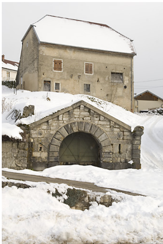
Réservoir des Portes, en hiver.