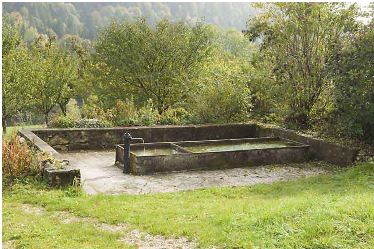
Fontaine-abreuvoir des Maillots.