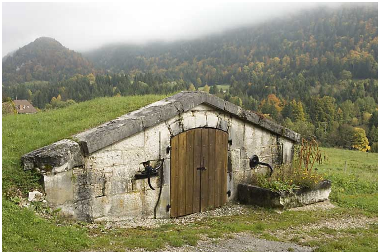
Réservoir des Maillots, de trois quarts gauche. 25, Jougne