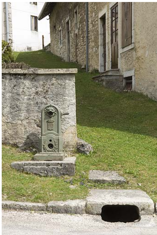
Borne fontaine rue de l'Eglise (près du n° 14). 25, Jougne