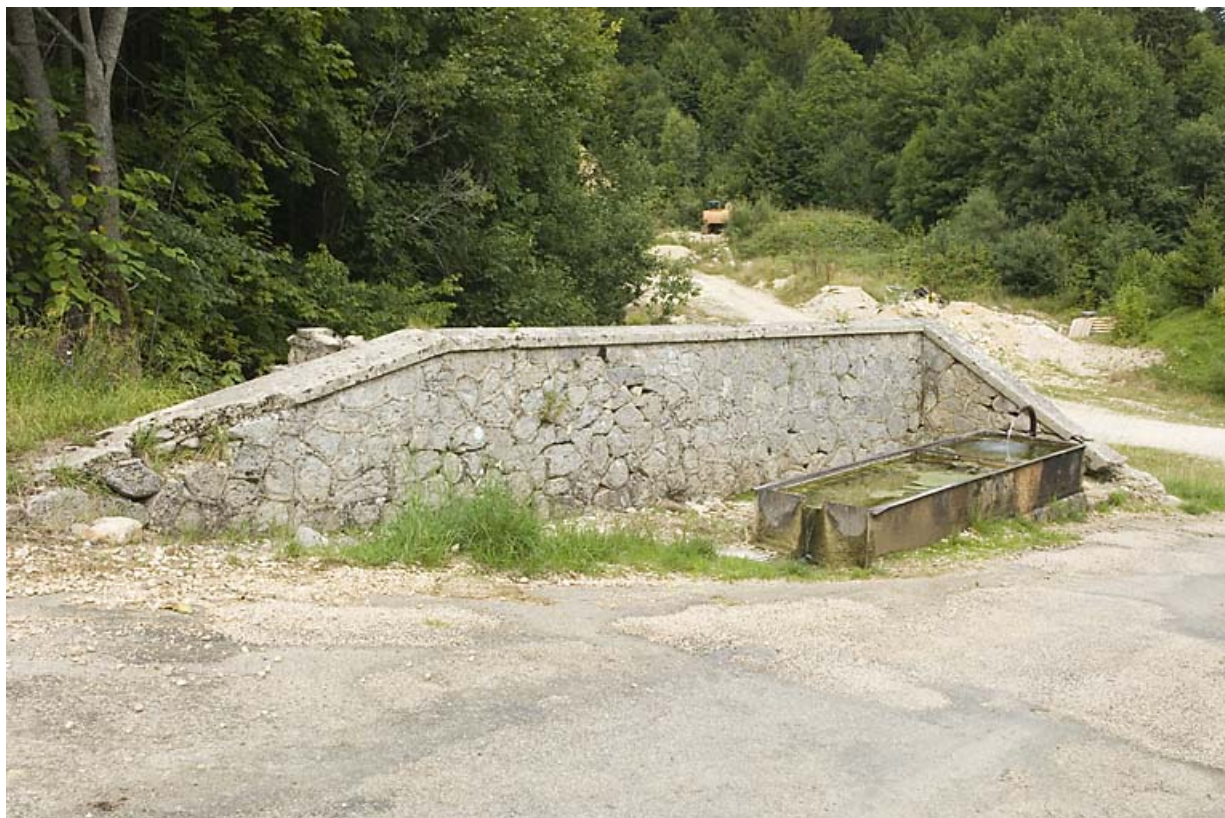
Fontaine-abreuvoir aux Tavins (rue de la Piquemiette). 25, Jougne