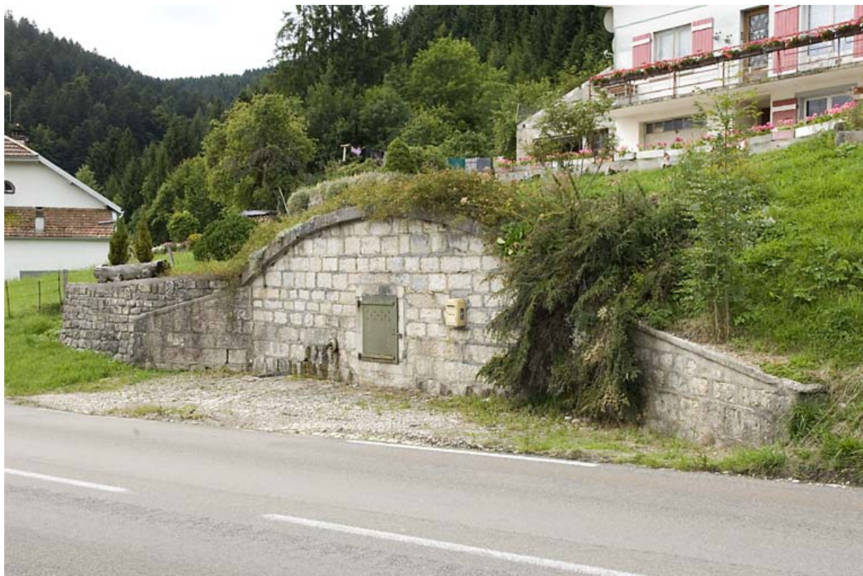
Réservoir des Tavins (route de Vallorbe, 2008 AH 16). 25, Jougne