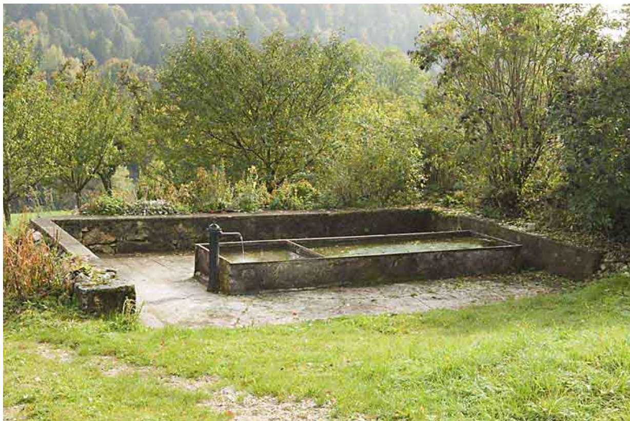
Fontaine-abreuvoir des Maillots.