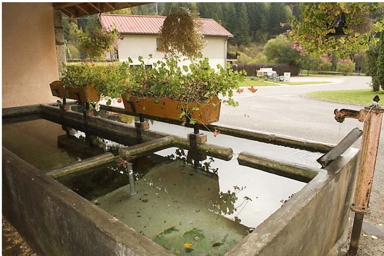
Fontaine-lavoir-abreuvoir du Moulin : les bassins. 25, Jougne