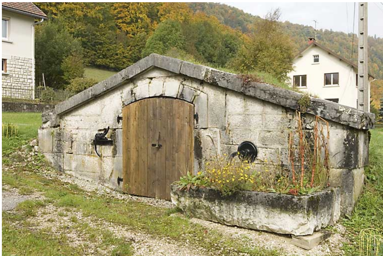
Réservoir des Maillots, de trois quarts droite (rue du Bois, 2008 AE 109). 25, Jougne