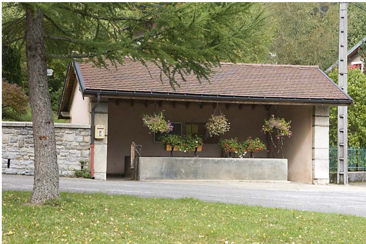
Fontaine-lavoir-abreuvoir du Moulin.