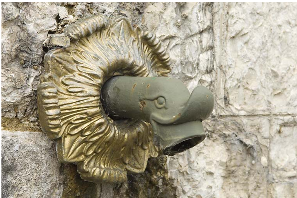
Réservoir des Tavins : sortie en forme de tête de canard. 25, Jougne