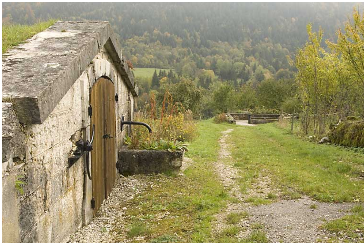
Réservoir des Maillots : façade vue en enfilade. 25, Jougne