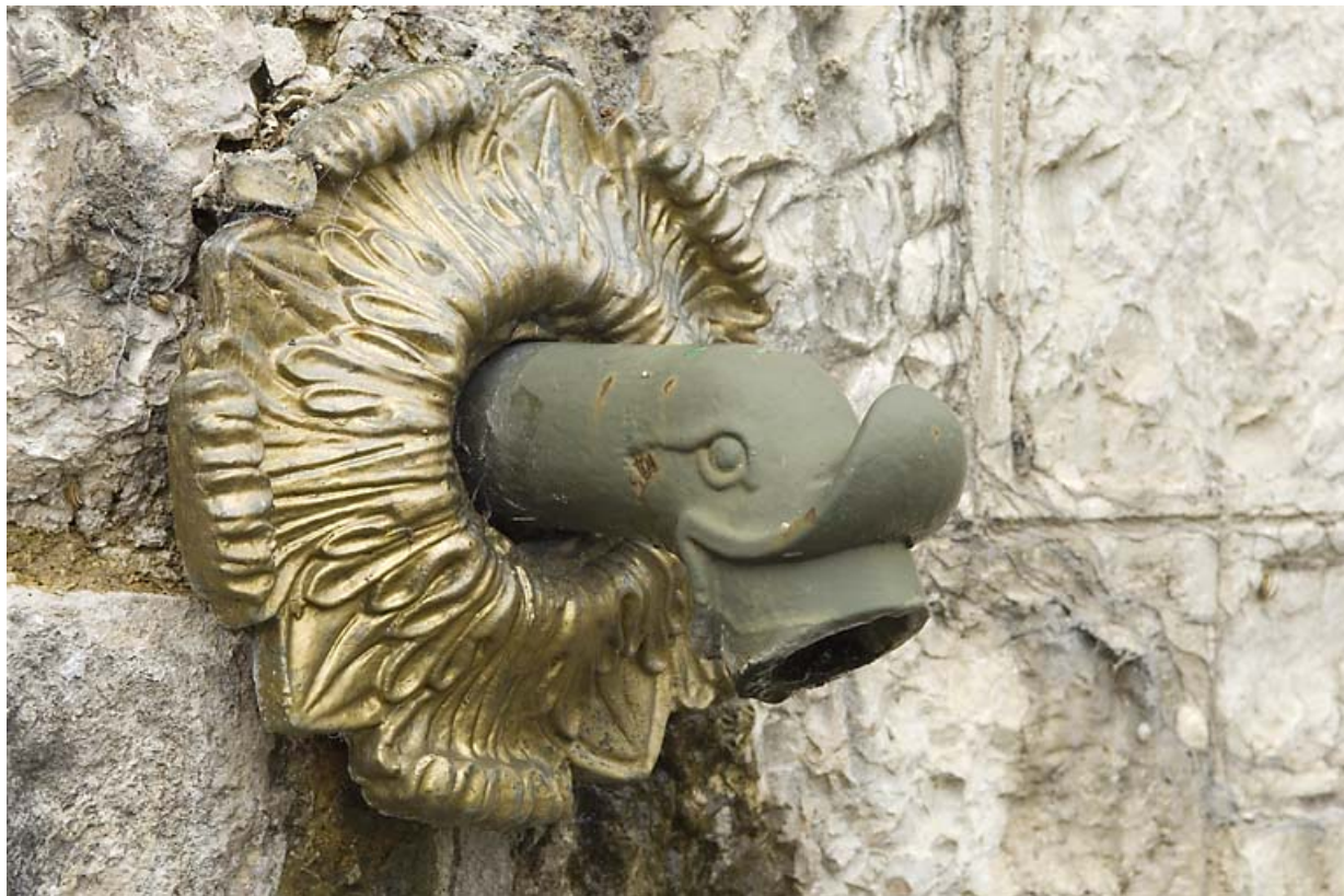
Réservoir des Tavins : sortie en forme de tête de canard. 25, Jougne