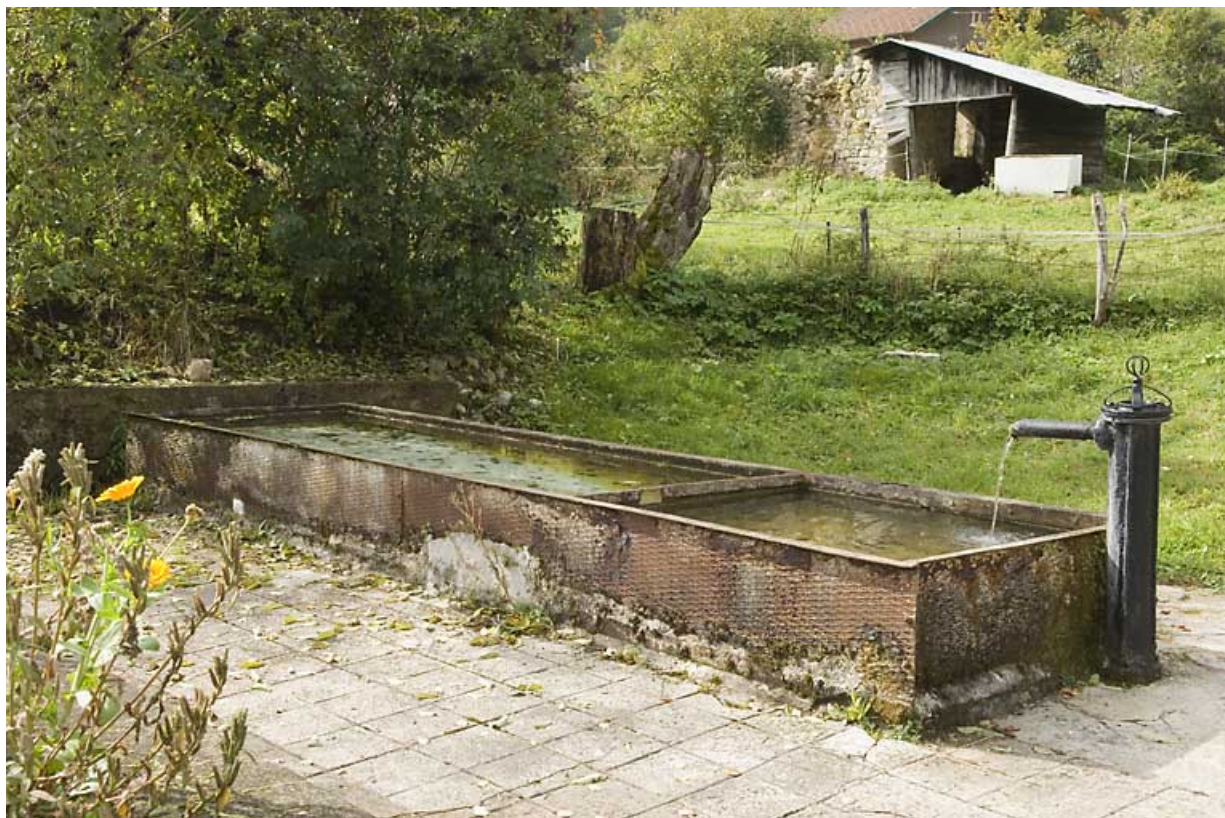
Fontaine-abreuvoir des Maillots.