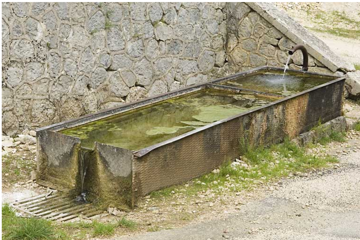
Fontaine-abreuvoir aux Tavins (rue de la Piquemiette) : vue rapprochée. 25, Jougne