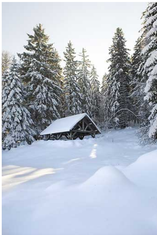
"Couvert" de la Cafaude, en hiver.