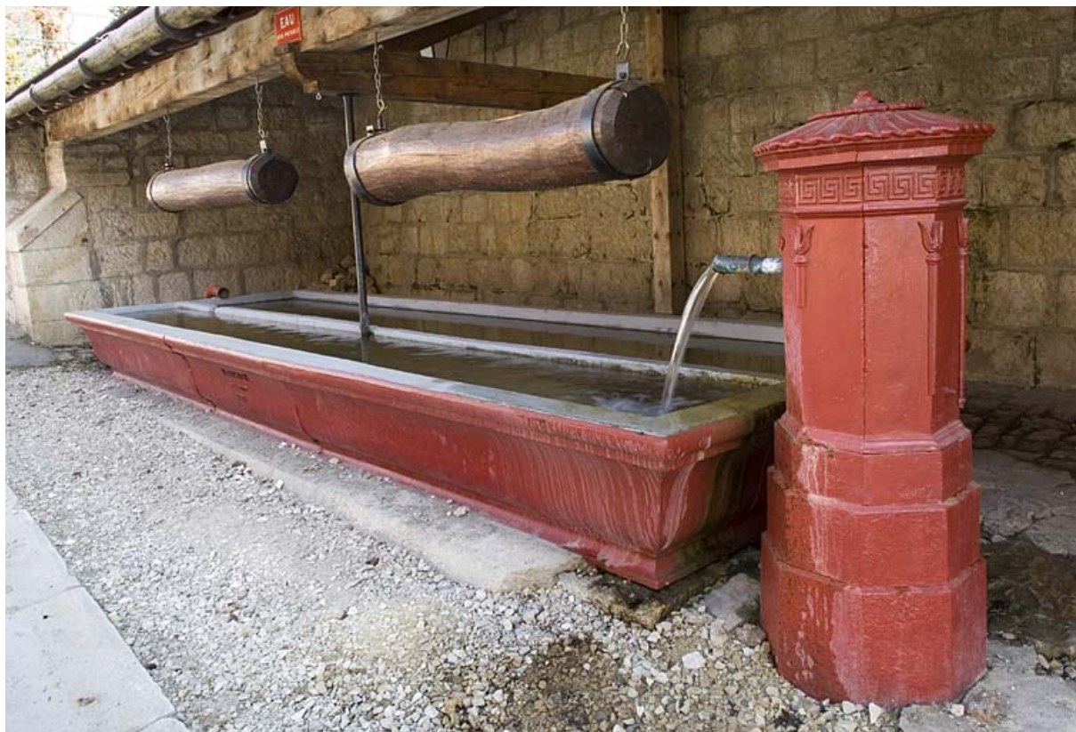
Fontaine-lavoir-abreuvoir du Chalet (Grande Rue, 2008 AC 35). 25, Jougne