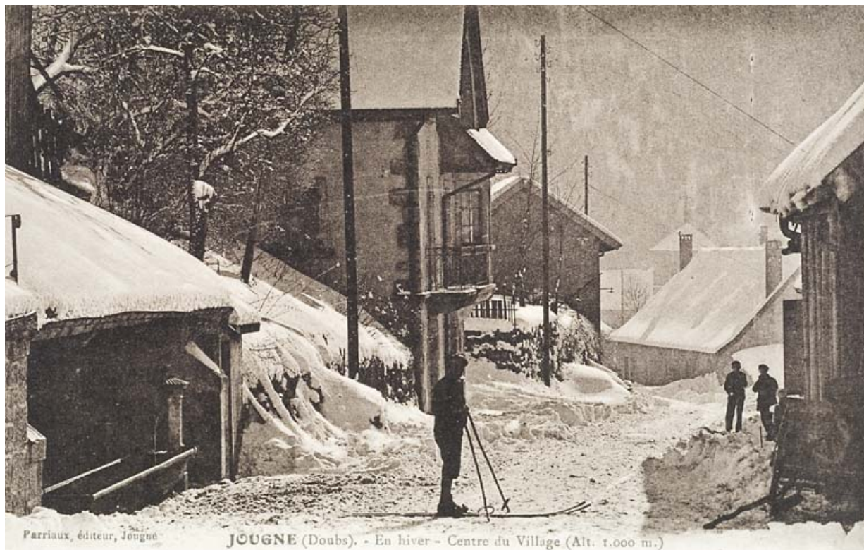
Jougne (Doubs). - En hiver - Centre du Village (Alt. 1.000 m.) [la fontaine du Chalet], [milieu 20e siècle]. 25, Jougue