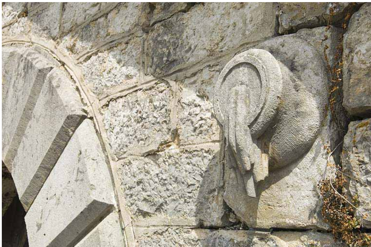
Réservoir des Portes : motif décoratif d'urne rappelant celles de la saline d'Arc-et-Senans. 25, Jougne