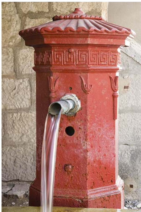
Fontaine-lavoir-abreuvoir du Chalet : la borne fontaine. 25, Jougue