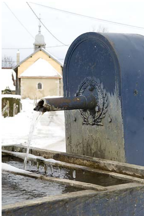
Fontaine-abreuvoir d'Entre-les-Fourgs, en hiver : la borne fontaine. 25, Jougue