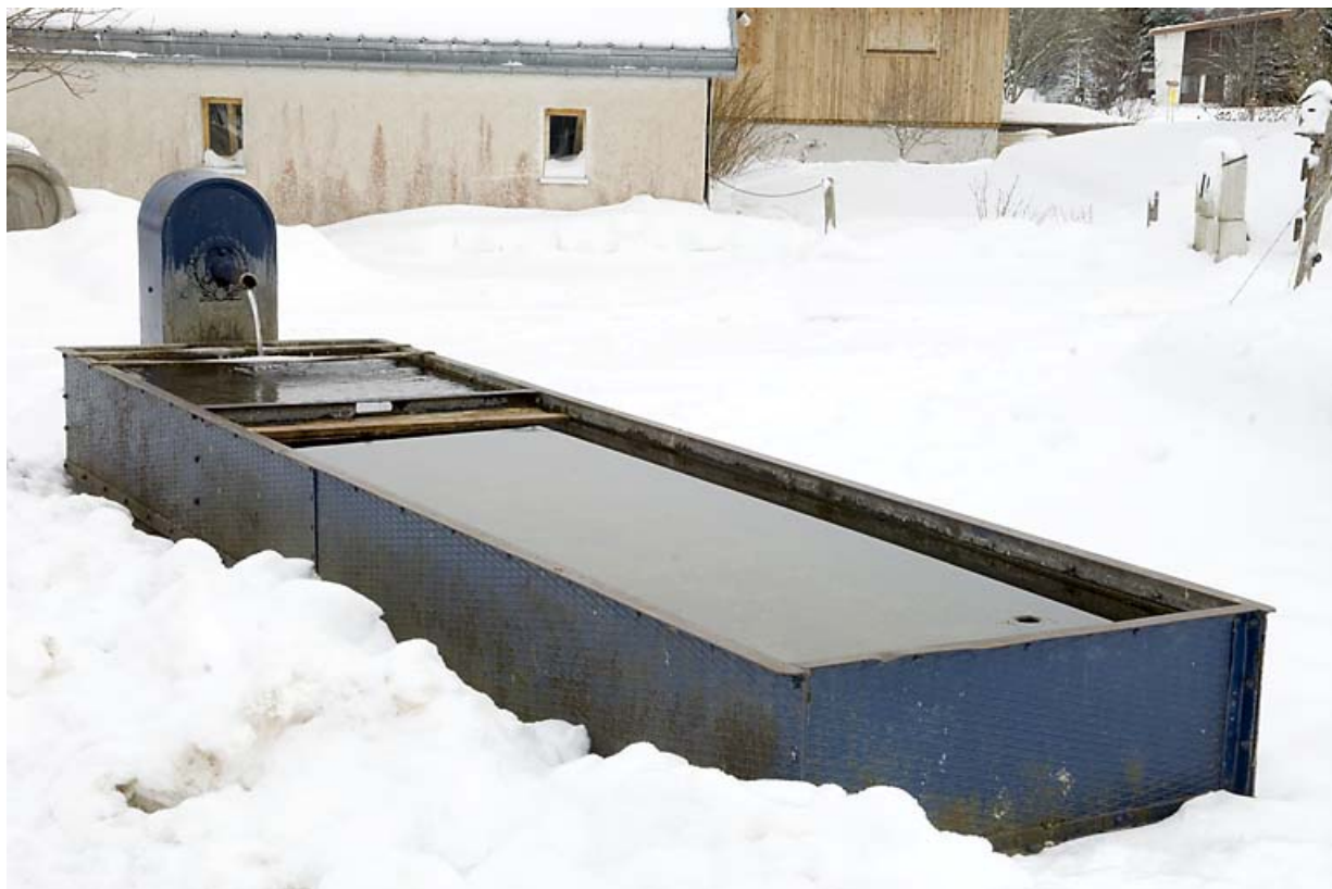
Fontaine-abreuvoir d'Entre-les-Fourgs, en hiver. 25, Jougne