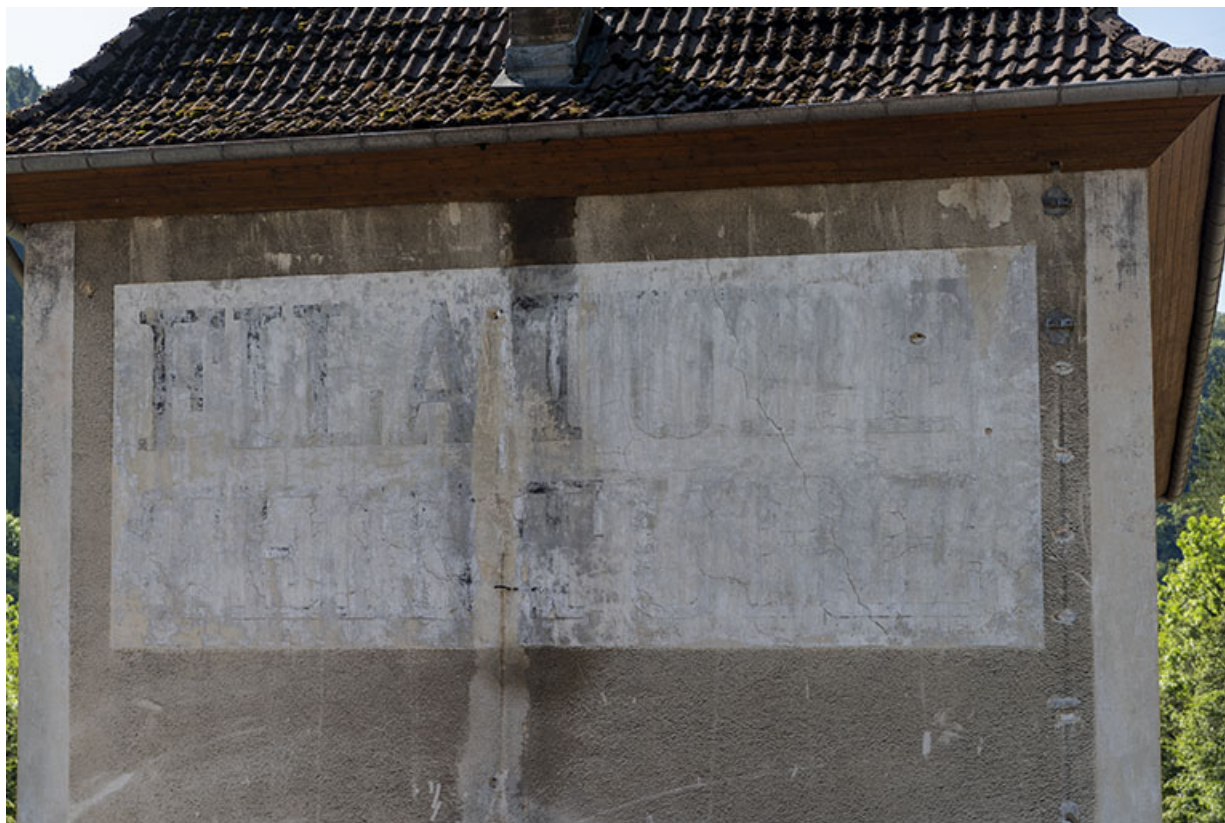
Logement, élévation latérale gauche : inscription peinte (filature teinturerie). 25, Saint-Hippolyte rue du Dessoubre