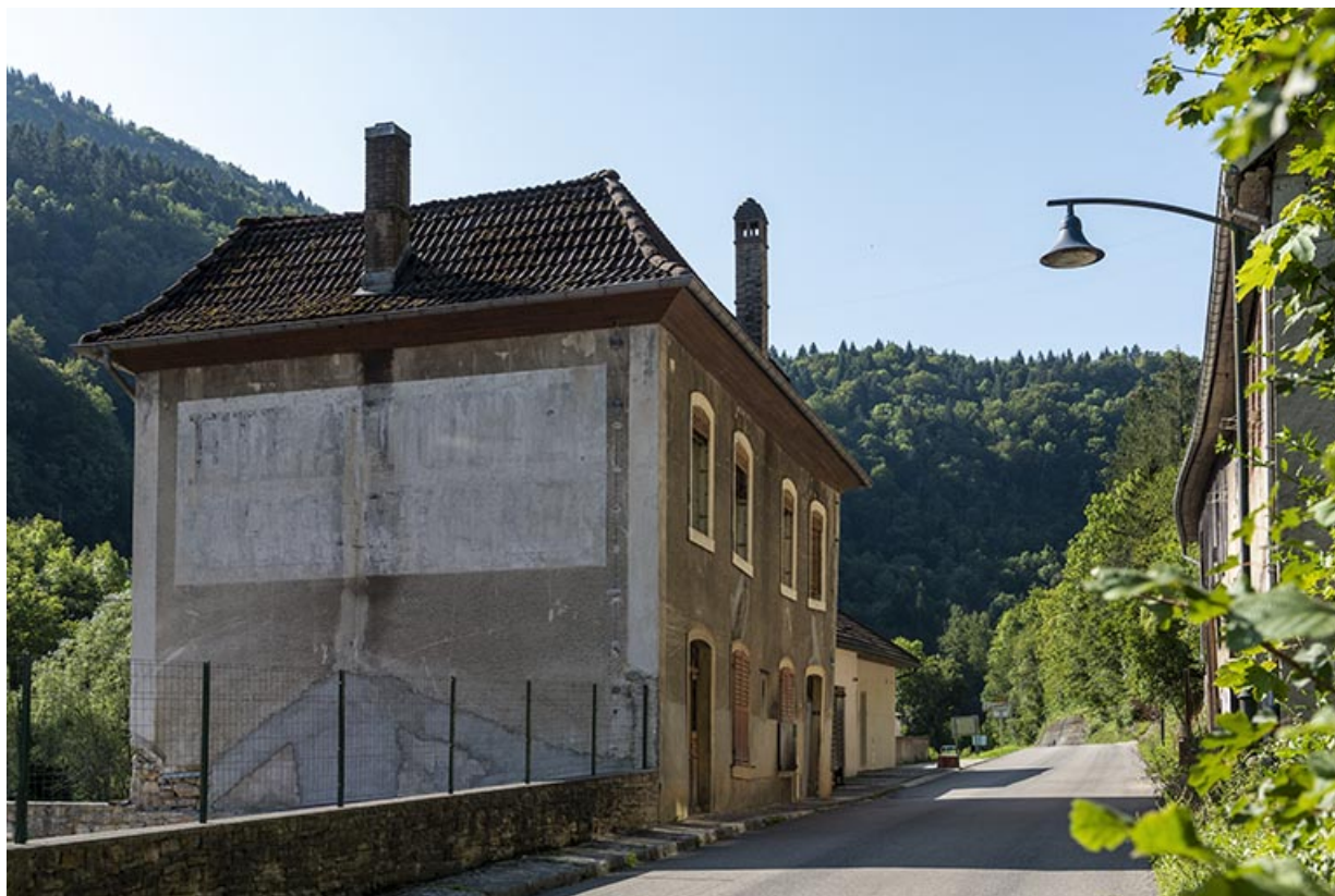
Logement, de trois quarts gauche (élévations antérieure et latérale gauche). 25, Saint-Hippolyte rue du Dessoubre