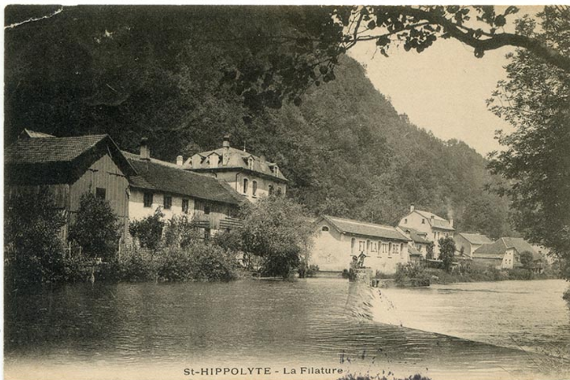
St-Hippolyte - La filature, fin 19e siècle-début 20e siècle [avant 1906].