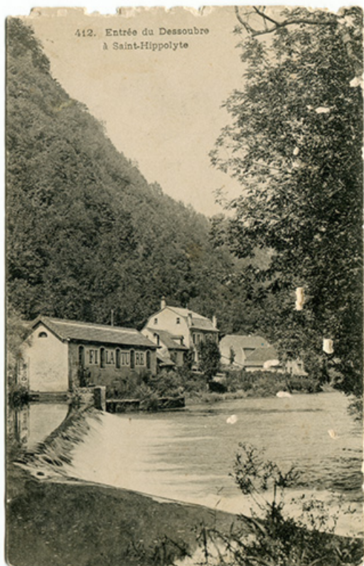
412. Entrée du Dessoubre à Saint-Hippolyte, fin 19e siècle-début 20e siècle [avant 1908]. 25, Saint-Hippolyte rue du Dessoubre