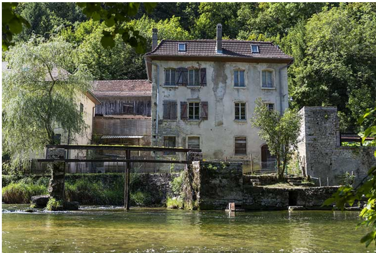
Vestiges de l'usine (avec vannage) et façade postérieure du logement. 25, Saint-Hippolyte rue du Dessoubre