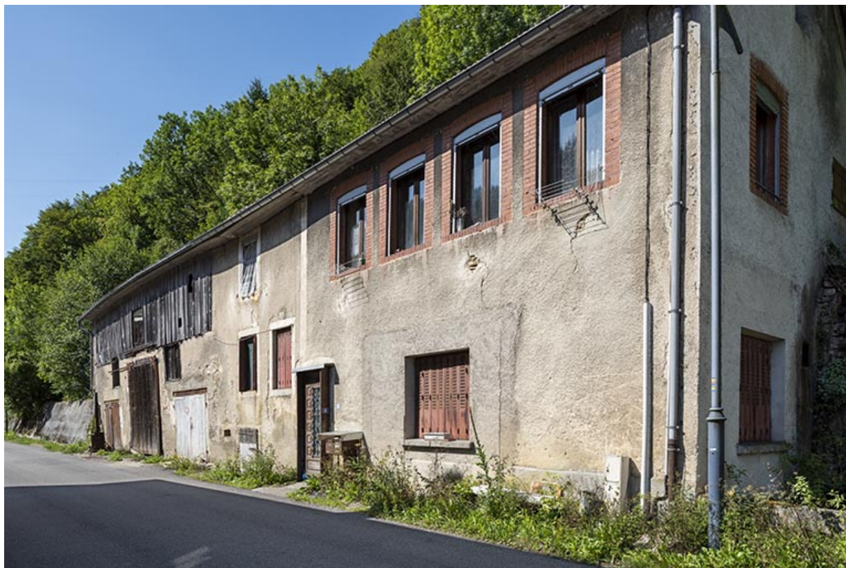
Logement occidental : façade antérieure, de trois quarts droite.