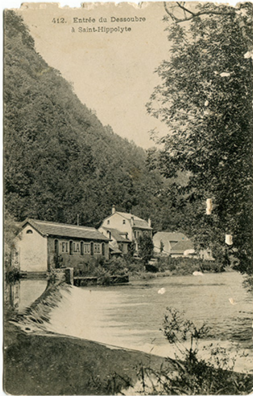
412. Entrée du Dessoubre à Saint-Hippolyte, fin 19e siècle-début 20e siècle [avant 1908]. 25, Saint-Hippolyte rue du Dessoubre