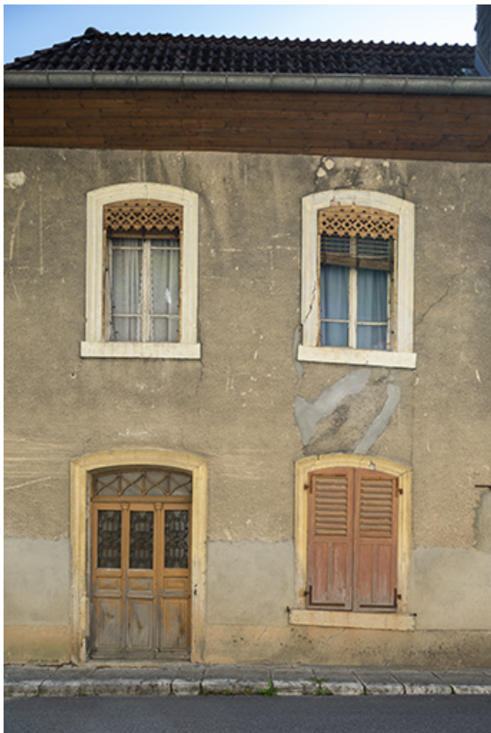
Logement, élévation antérieure : deux travées de gauche. 25, Saint-Hippolyte rue du Dessoubre