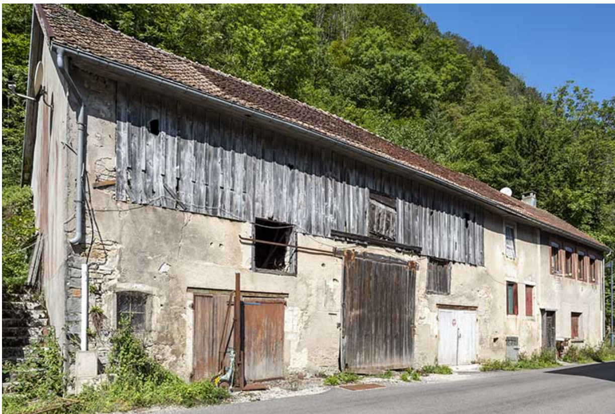
Logement occidental : façade antérieure, de trois quarts gauche. 25, Saint-Hippolyte rue du Dessoubre