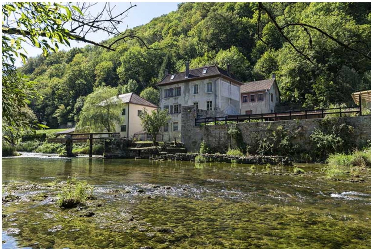
Vue d'ensemble, depuis la rive droite du Dessoubre (au nord-est). 25, Saint-Hippolyte rue du Dessoubre