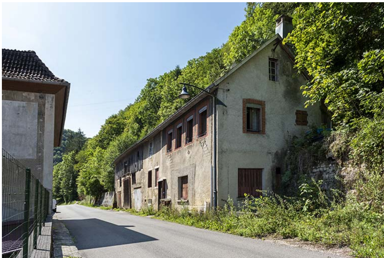
Logement occidental : vue d'ensemble, depuis le nord. 25, Saint-Hippolyte rue du Dessoubre