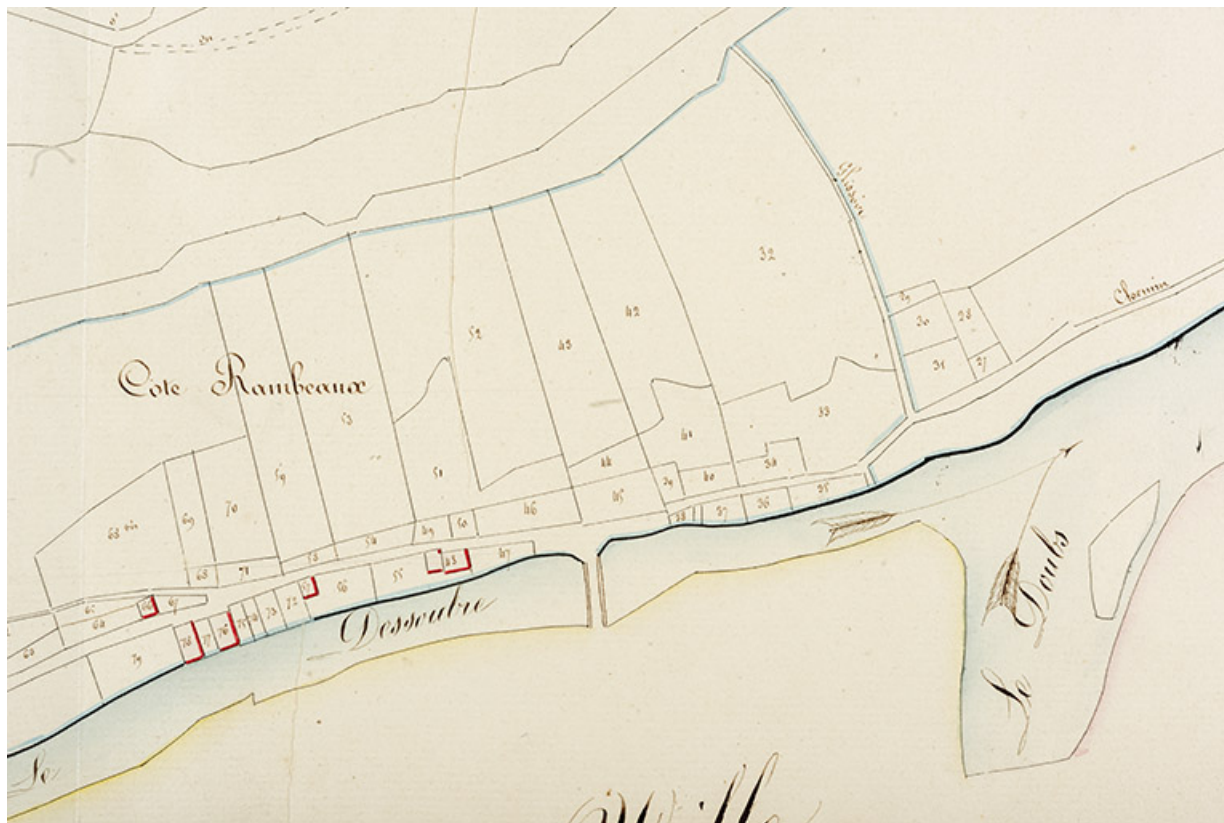
Cadastre de la commune de Saint-Hippolyte, 1830. Section G du Recet, 1re feuille [détail : rive gauche du Dessoubre], échelle 1/2 500.

25, Saint-Hippolyte, 2-4 impasse de la Tannerie