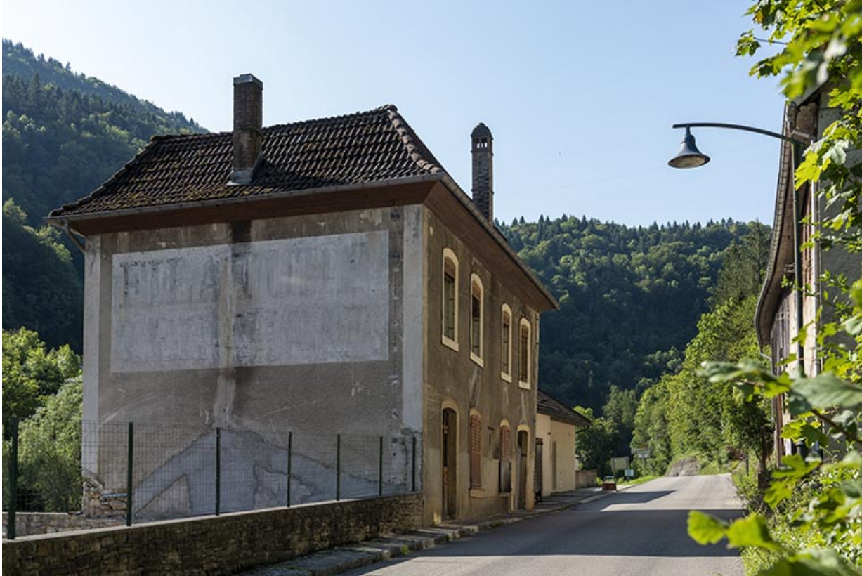
Logement, de trois quarts gauche (élévations antérieure et latérale gauche).