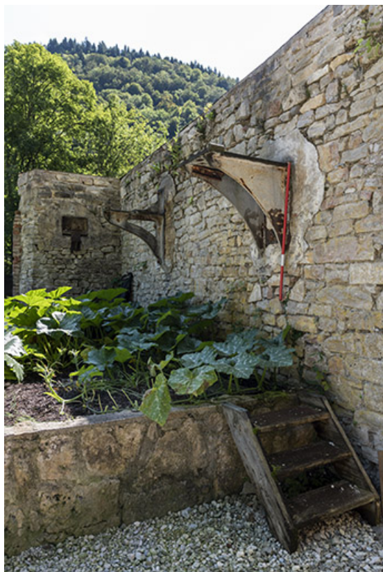
Vestiges de l'usine : supports de transmission.