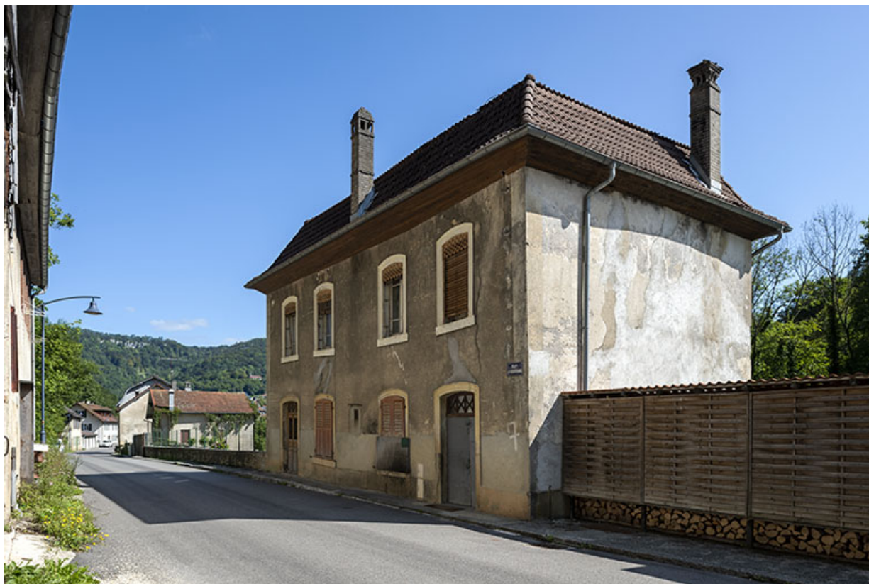
Logement, de trois quarts droite (élevations antérieure et latérale droite). 25, Saint-Hippolyte rue du Dessoubre