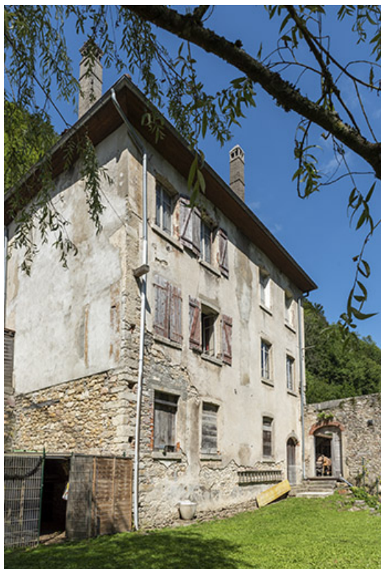
Logement : élévations postérieure et latérale droite. 25, Saint-Hippolyte rue du Dessoubre