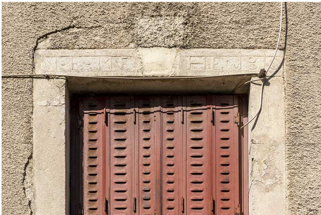
Logement occidental, façade antérieure : linteau daté.