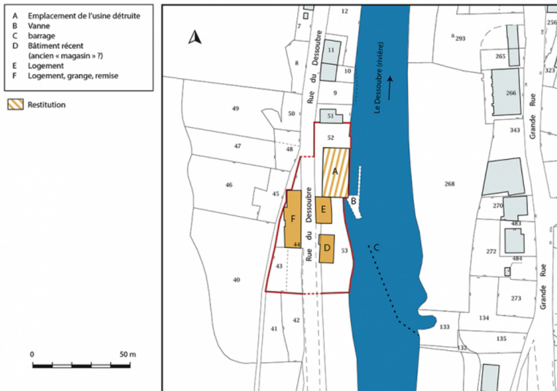
Plan-masse et de situation. Extrait du plan cadastral, 2019, section AI. 25, Saint-Hippolyte rue du Dessoubre