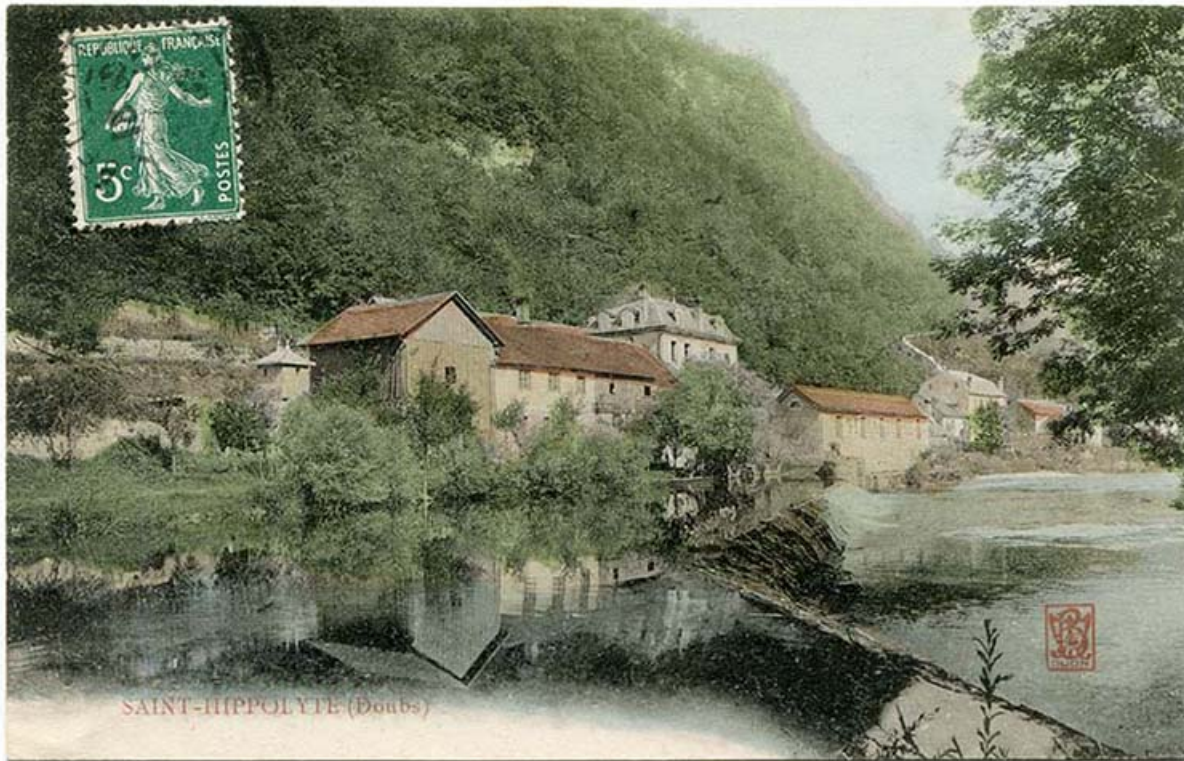
Saint-Hippolyte (Doubs), 1er quart 20e siècle [entre 1904 et 1909]. 25, Saint-Hippolyte rue du Dessoubre