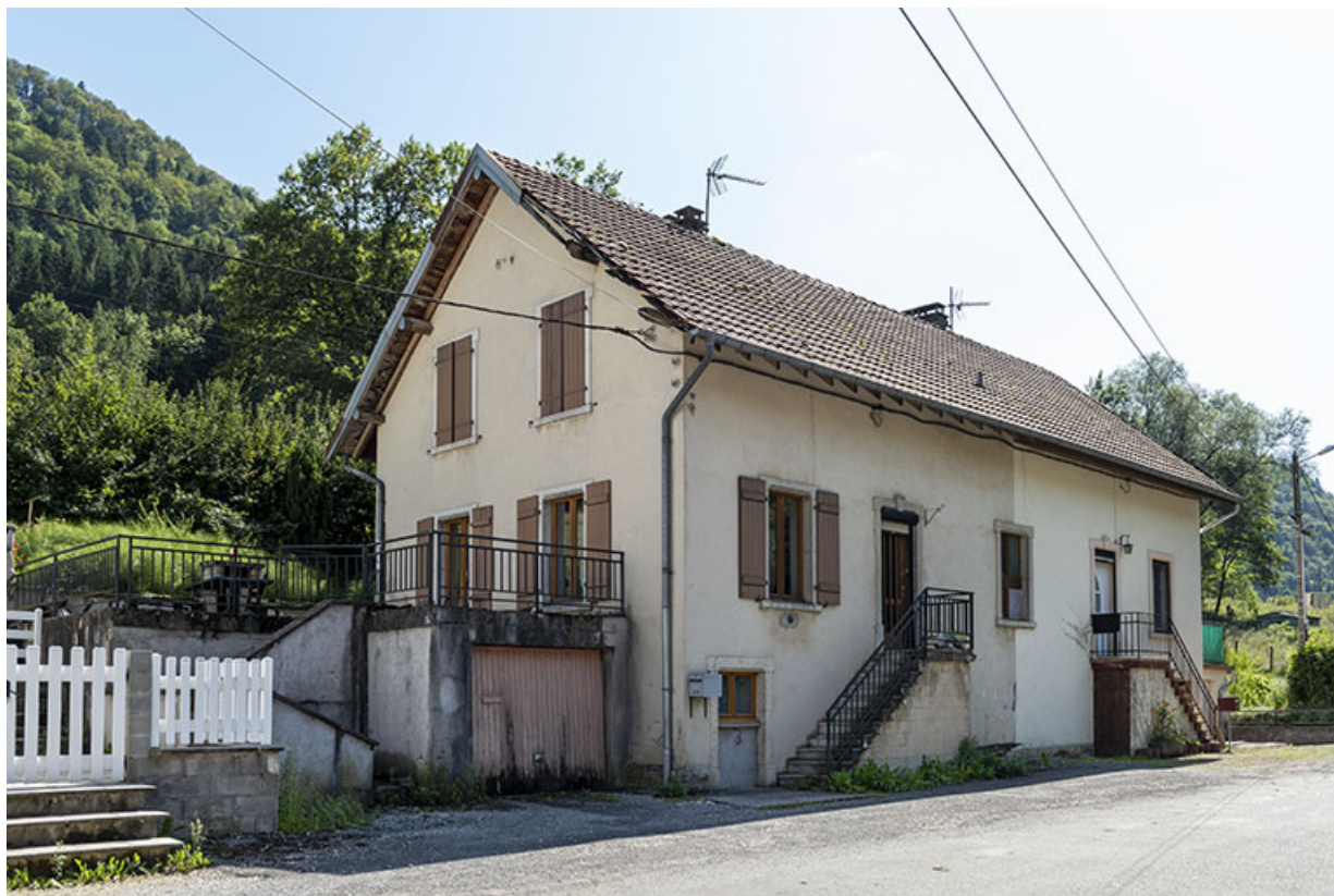
Maison aux n° 109 et 110 (cadastrée AD 157, 158, 172 et 173) : façade antérieure, de trois quarts gauche. 25, Saint-Hippolyte, 109-128 Cité Vauchamp, lieudit : Vauchamp