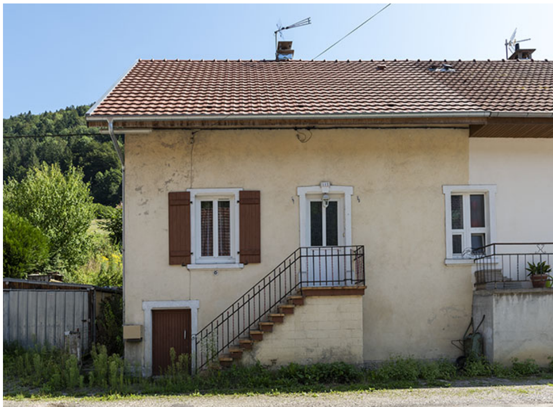
Maison aux n° 111 et 112 (cadastrée AD 155, 156, 169 et 170) : façade antérieure du n° 112. 25, Saint-Hippolyte, 109-128 Cité Vauchamp, lieudit : Vauchamp