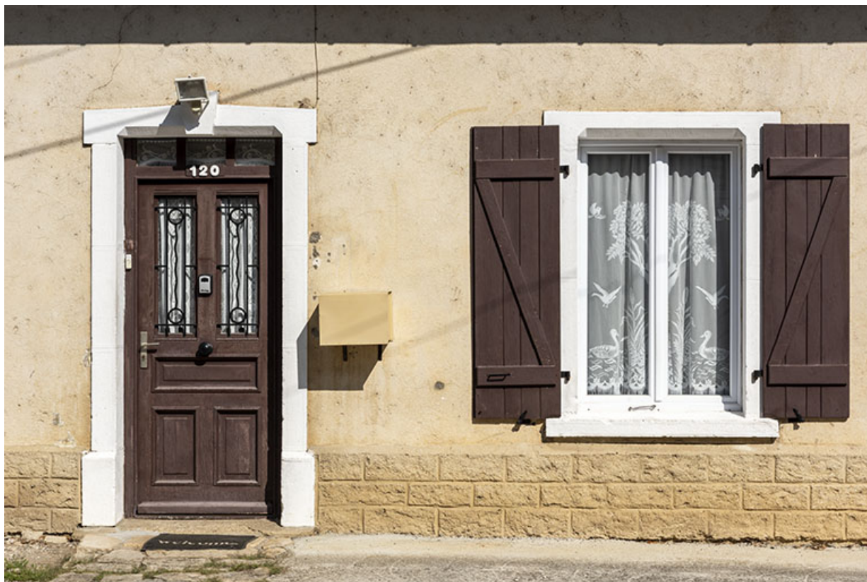
Maison aux n° 119 et 120 (cadastrée AD 113, 119 et 120), façade antérieure : porte et fenêtre. 25, Saint-Hippolyte, 109-128 Cité Vauchamp, lieudit : Vauchamp