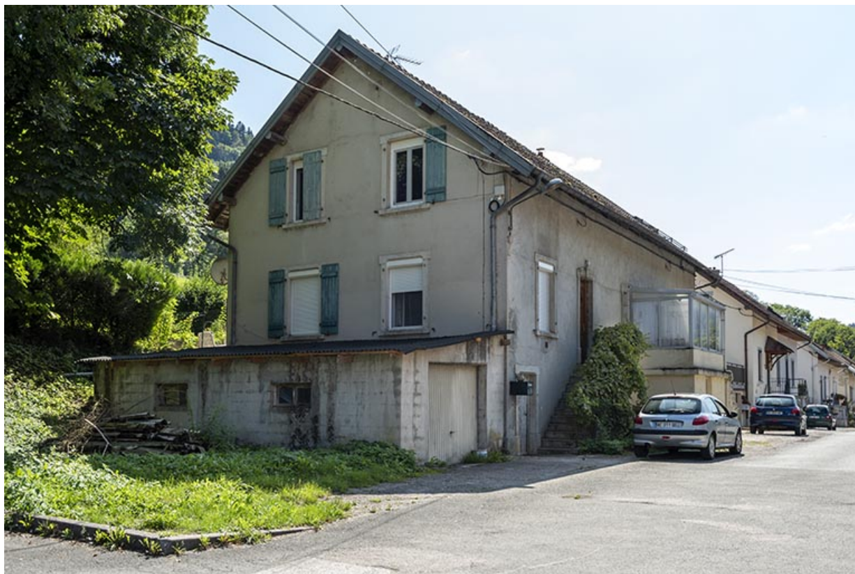
Côté droit de la rue, depuis son extrémité orientale. Au premier plan maison aux n° 117 et 118 (cadastrée AD 160 et 161). 25, Saint-Hippolyte, 109-128 Cité Vauchamp, lieudit : Vauchamp