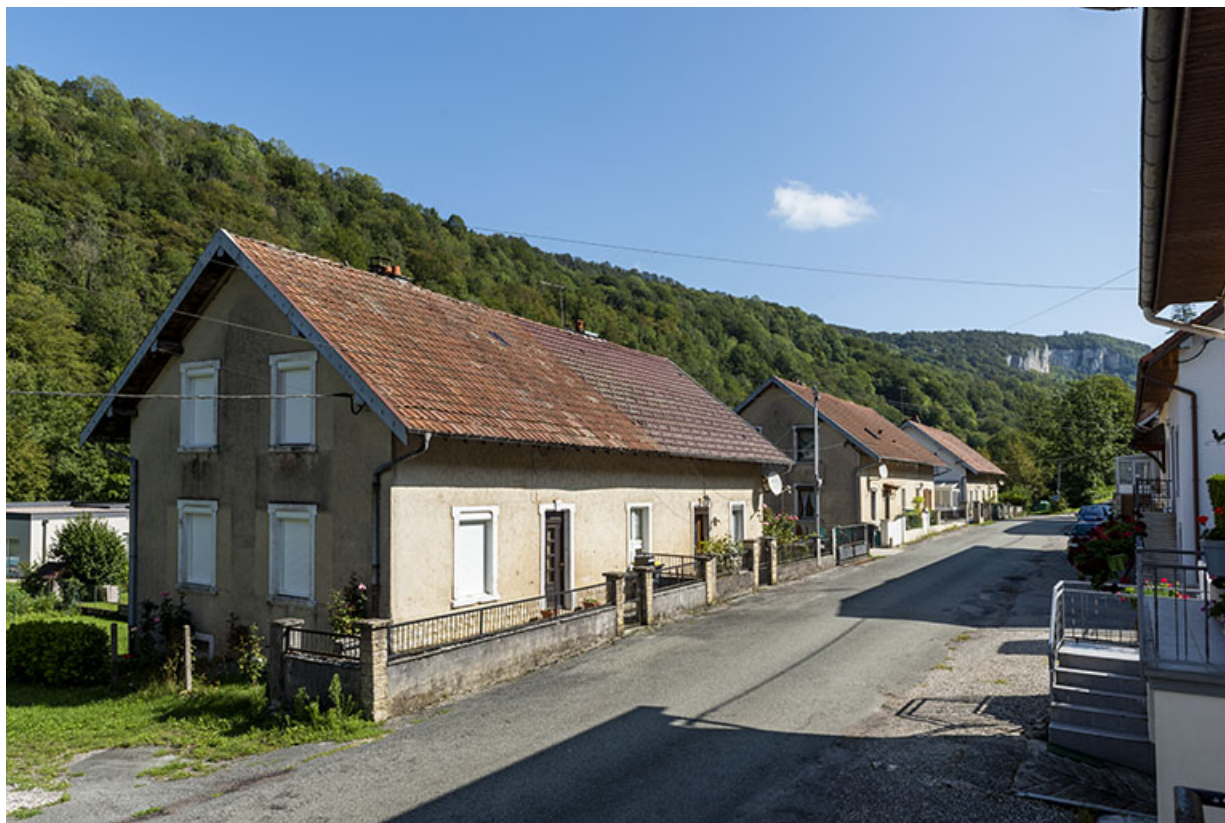
Côté gauche de la rue, avec au premier plan la maison aux n° 123 et 124 (cadastrée AD 126 et 127).

25, Saint-Hippolyte, 109-128 Cité Vauchamp, lieudit : Vauchamp