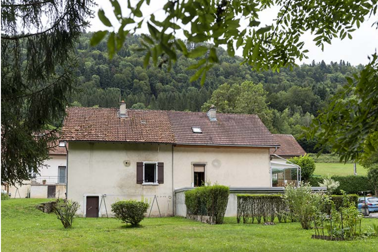
Maison aux n° 119 et 120 (cadastrée AD 113, 119 et 120) : façade postérieure.

25, Saint-Hippolyte, 109-128 Cité Vauchamp, lieudit : Vauchamp