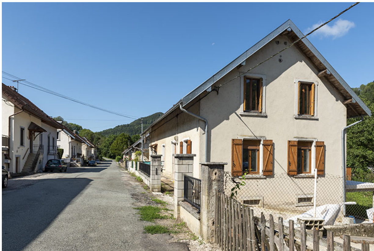
Côté gauche de la rue, depuis son extrémité orientale. Au premier plan maison aux n° 125 et 126 (cadastrée AD 130 et 131). 25, Saint-Hippolyte, 109-128 Cité Vauchamp, lieudit : Vauchamp