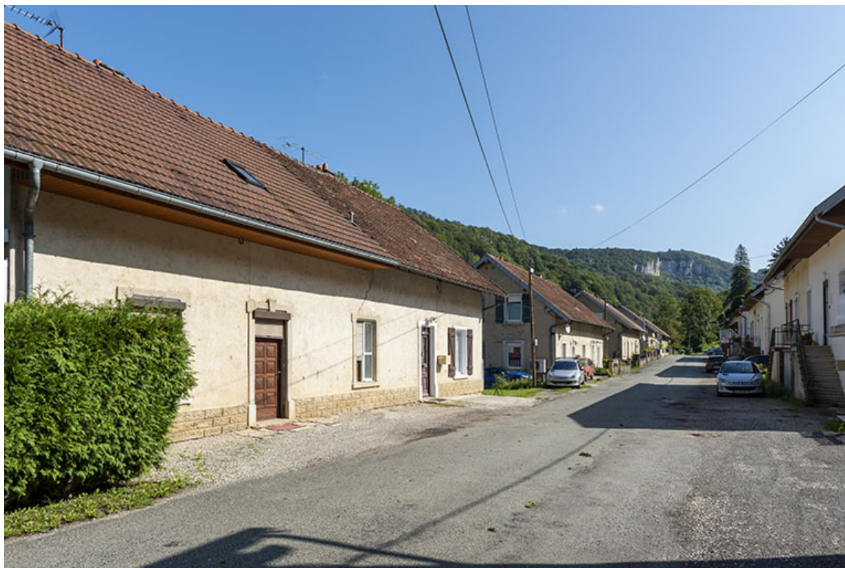
Côté gauche de la rue, depuis son extrémité occidentale. Au premier plan maison aux n° 119 et 120 (cadastrée AD 113, 119 et 120). 25, Saint-Hippolyte, 109-128 Cité Vauchamp, lieudit : Vauchamp