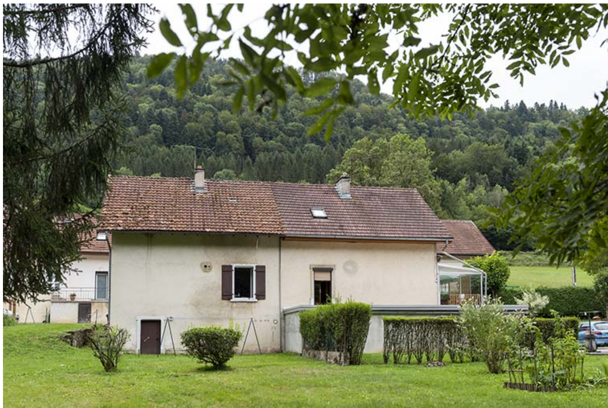
Maison aux n° 119 et 120 (cadastrée AD 113, 119 et 120) : façade postérieure. 25, Saint-Hippolyte, 109-128 Cité Vauchamp, lieudit : Vauchamp