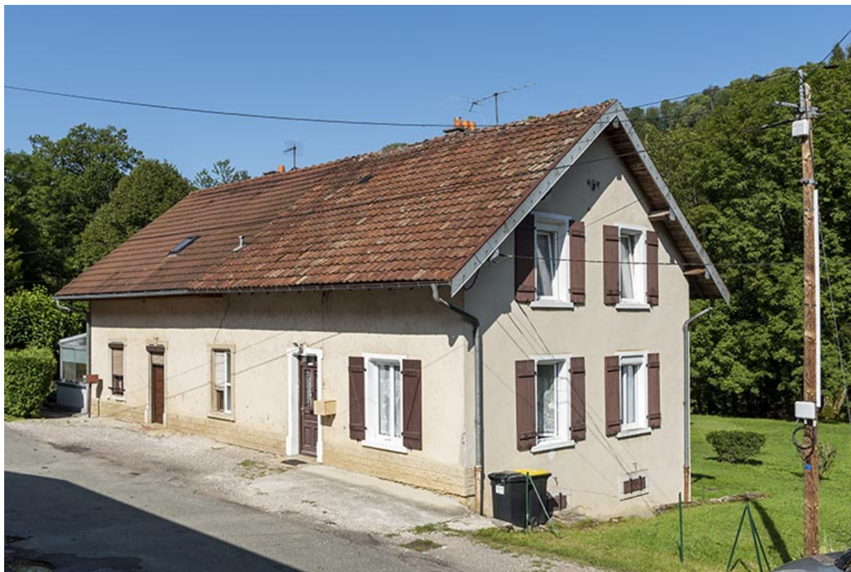
Maison aux n° 119 et 120 (cadastrée AD 113, 119 et 120) : façade antérieure, de trois quarts droite.

25, Saint-Hippolyte, 109-128 Cité Vauchamp, lieudit : Vauchamp