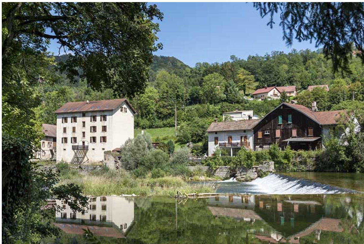
Vue d'ensemble, depuis la rive gauche du Doubs (façade postérieure).

25, Saint-Hippolyte, 5 rue du Moulin Neuf