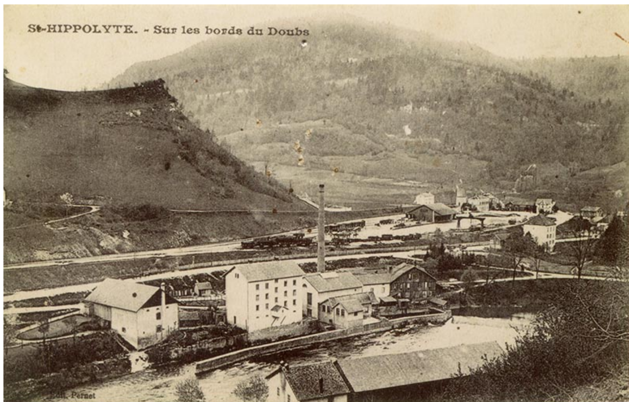
St-Hippolyte. - Sur les bords du Doubs, [1er quart 20e siècle].

25, Saint-Hippolyte, 5 rue du Moulin Neuf