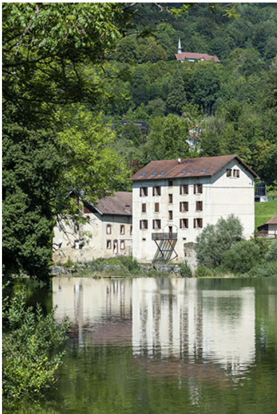
Façades postérieure et latérale gauche. 25, Saint-Hippolyte, 5 rue du Moulin Neuf