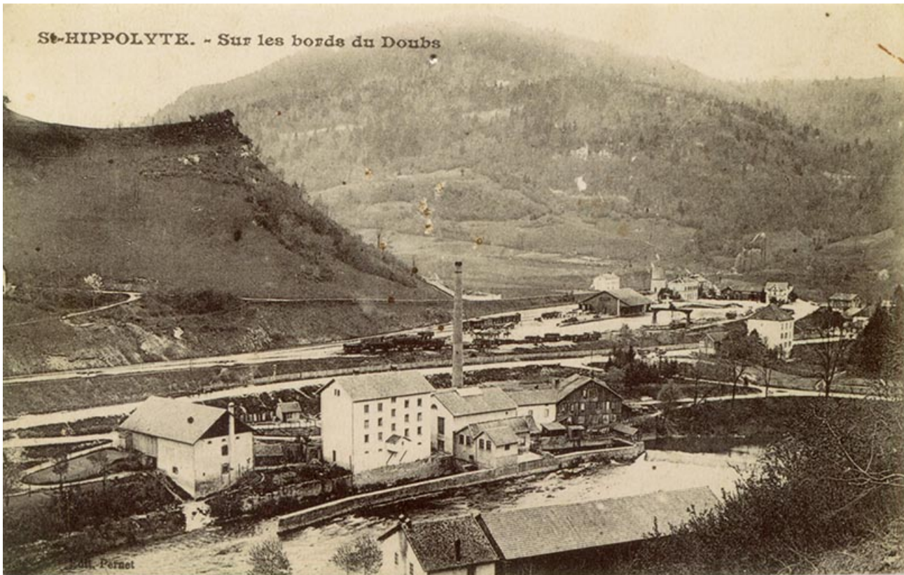
St-Hippolyte. - Sur les bords du Doubs, [1er quart 20e siècle].

25, Saint-Hippolyte, 5 rue du Moulin Neuf