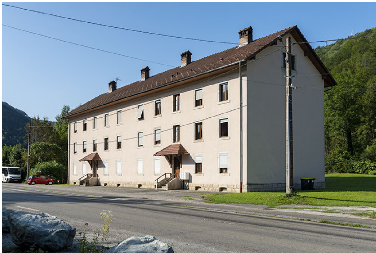
Immeuble d'ouvriers dit Cité du Congo, 21-23 rue de Montbéliard à Saint-Hippolyte. 25, Saint-Hippolyte, 21-23 rue de Montbéliard