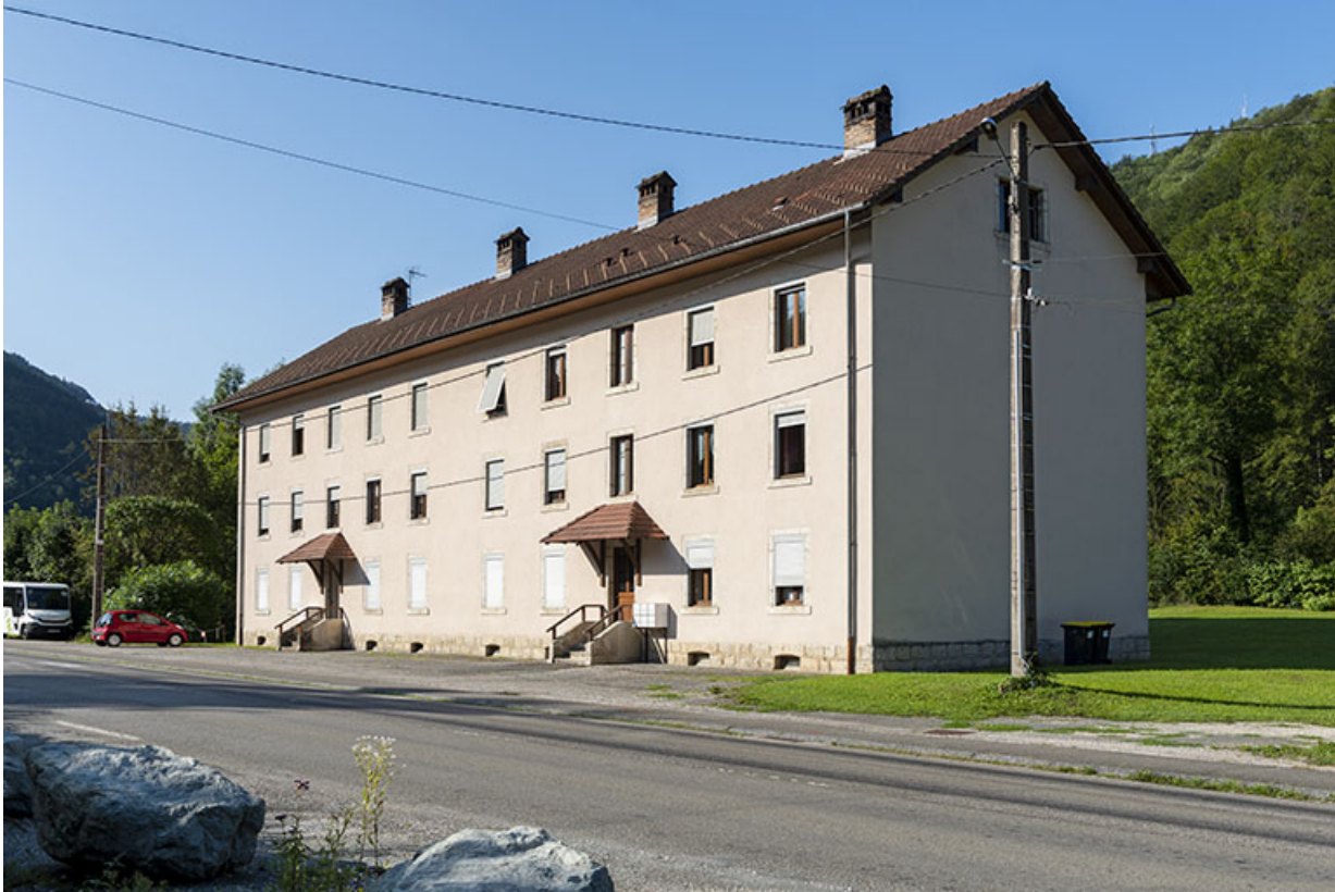
Immeuble d'ouvriers dit Cité du Congo, 21-23 rue de Montbéliard à Saint-Hippolyte. 25, Saint-Hippolyte, 21-23 rue de Montbéliard