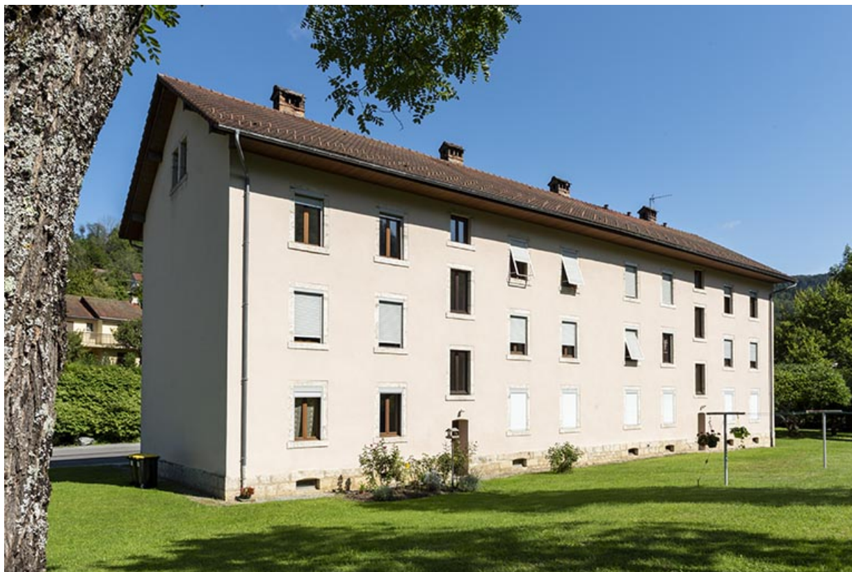
Façade postérieure, de trois quarts gauche. 25, Saint-Hippolyte, 21-23 rue de Montbéliard