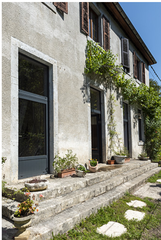
Façade antérieure et perron, vus en enfilade.

25, Liebvillers, lieudit : le Gouffre du Lods