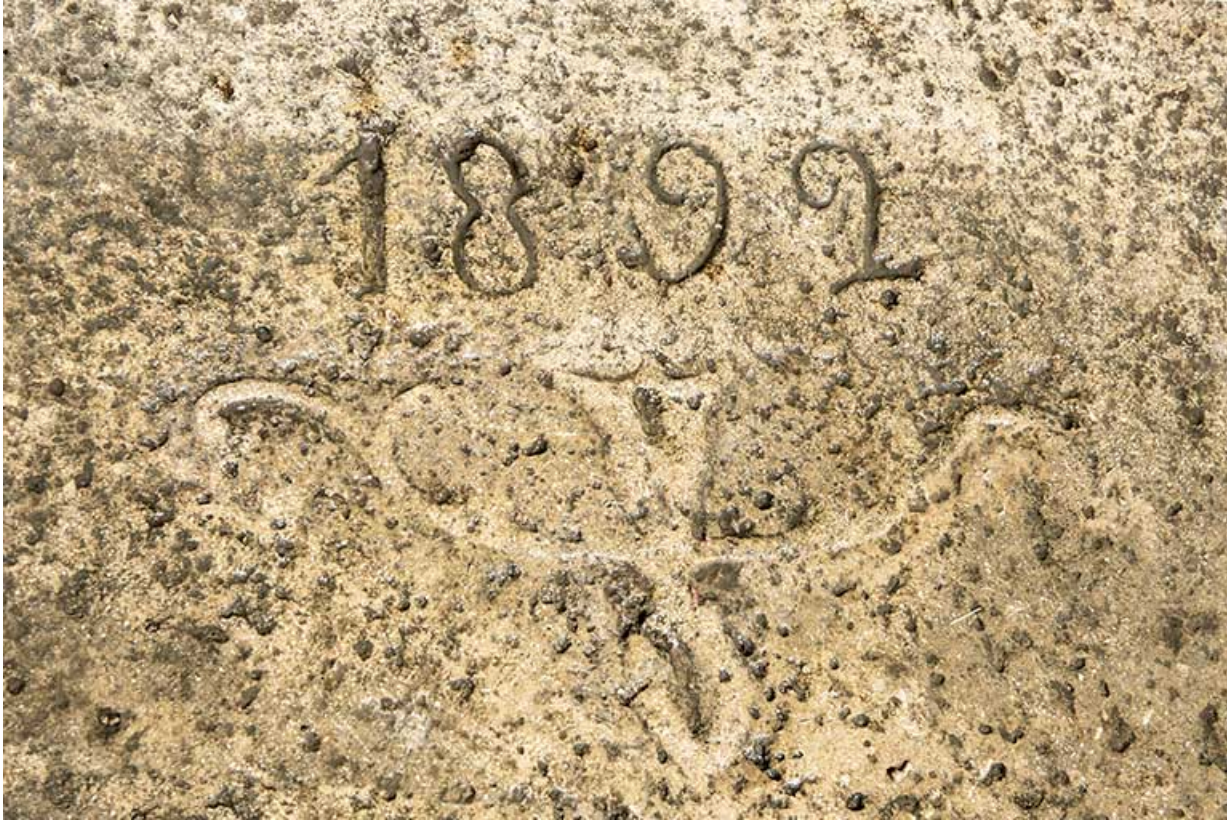
Date 1892 gravée sur le perron.

25, Liebvillers, lieudit : le Gouffre du Lods