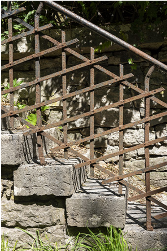
Garde-corps de l'escalier indépendant.

25, Liebvillers, lieudit : le Gouffre du Lods