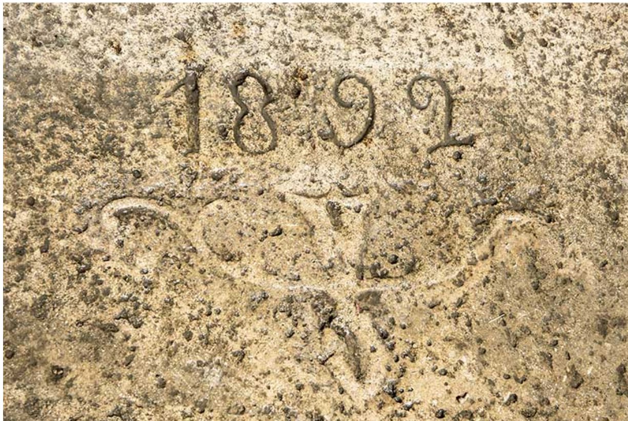
Date 1892 gravée sur le perron.

25, Liebvillers, lieudit : le Gouffre du Lods