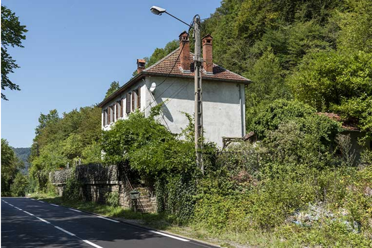
Ecole des forges au Gouffre du Lods, Liebvillers : vue d'ensemble, depuis l'est.

25, Liebvillers, lieudit : le Gouffre du Lods