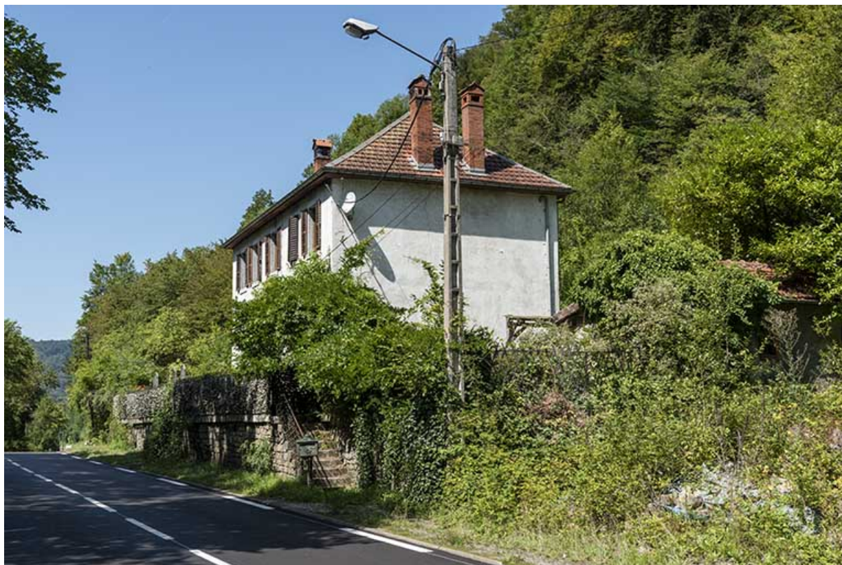
Ecole des forges au Gouffre du Lods, Liebvillers : vue d'ensemble, depuis l'est. 25, Liebvillers, lieudit : le Gouffre du Lods