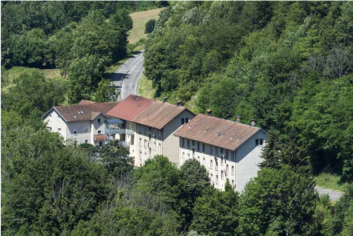
Vue d'ensemble plongeante rapprochée, depuis le sud-est.

25, Liebvillers, lieudit : le Gouffre du Lods