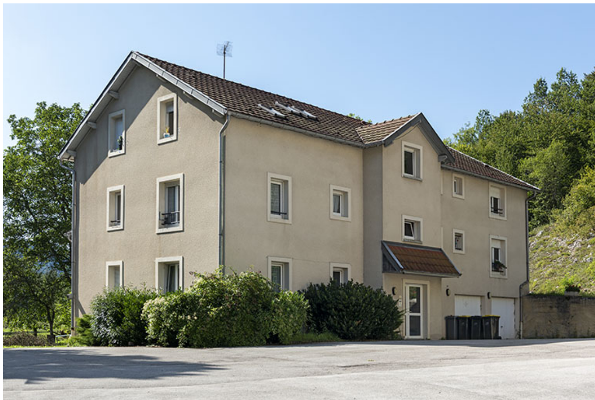
Maison : façades antérieure et latérale gauche.

25, Liebvillers, 2-10 Cité du Maroc, lieudit : Cité du Maroc