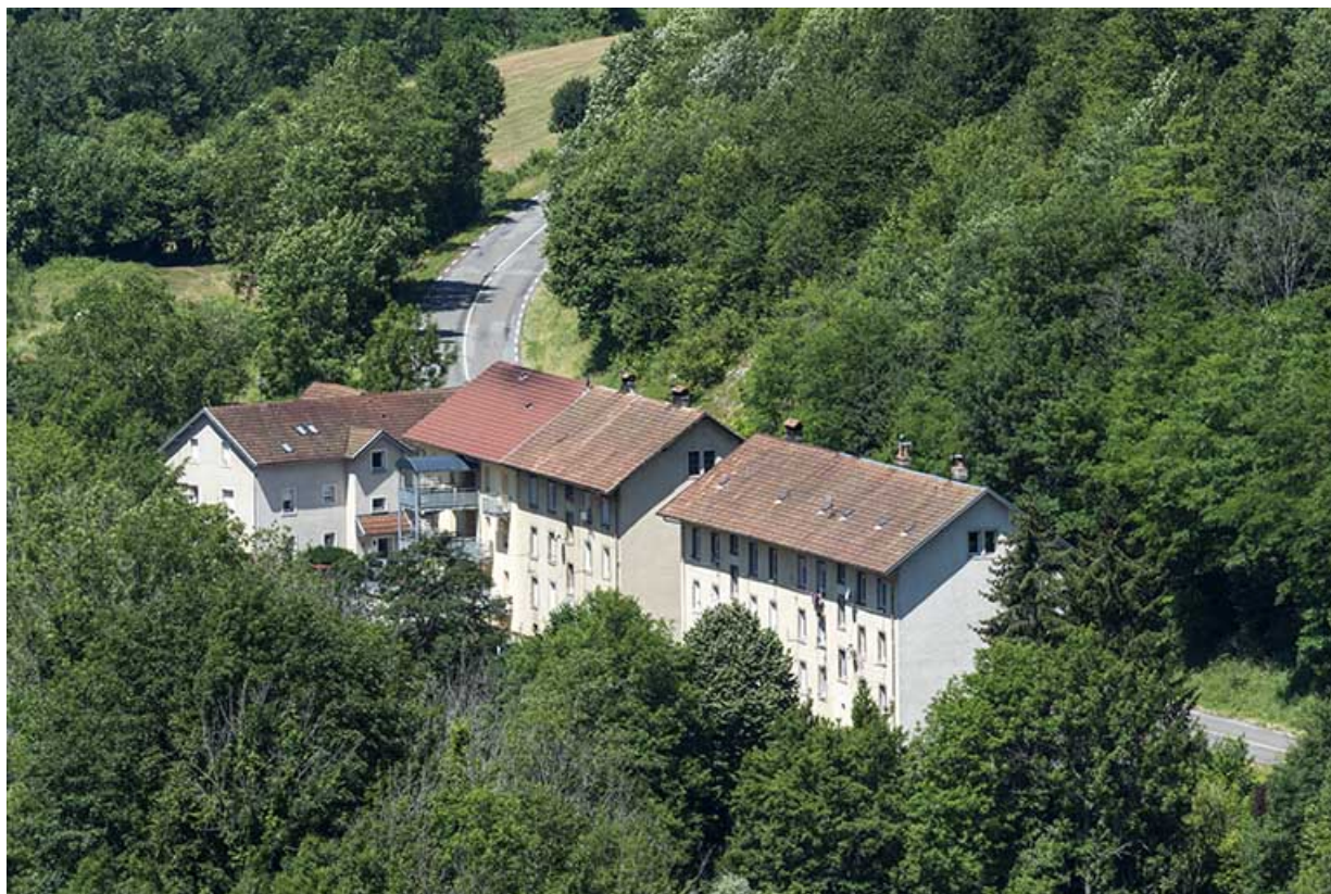
Vue d'ensemble plongeante rapprochée, depuis le sud-est.

25, Liebvillers, lieudit : le Gouffre du Lods