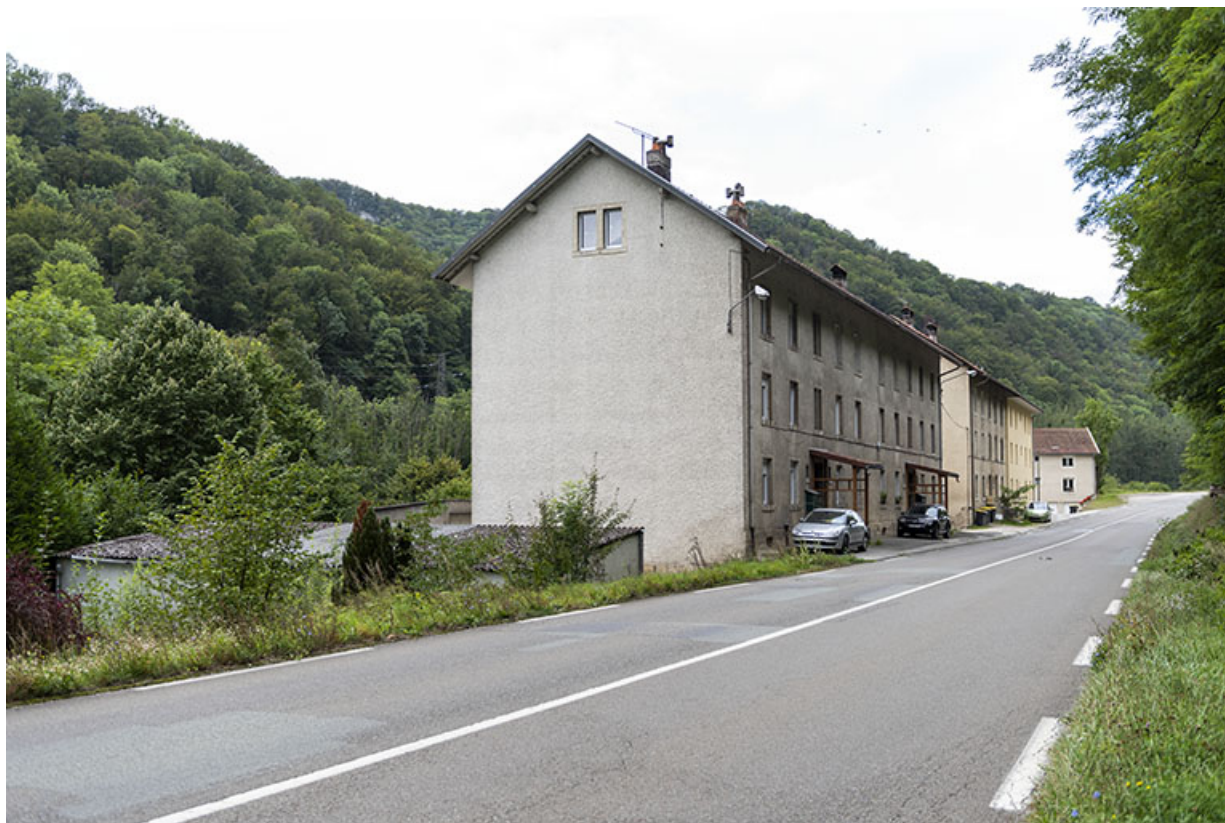
Vue d'ensemble, depuis la route à l'est.

25, Liebvillers, 2-10 Cité du Maroc, lieudit : Cité du Maroc