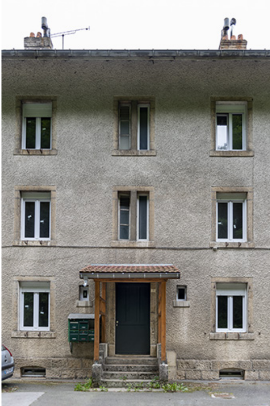
Immeuble, façade antérieure : entrée du n° 10.

25, Liebvillers, 2-10 Cité du Maroc, lieudit : Cité du Maroc