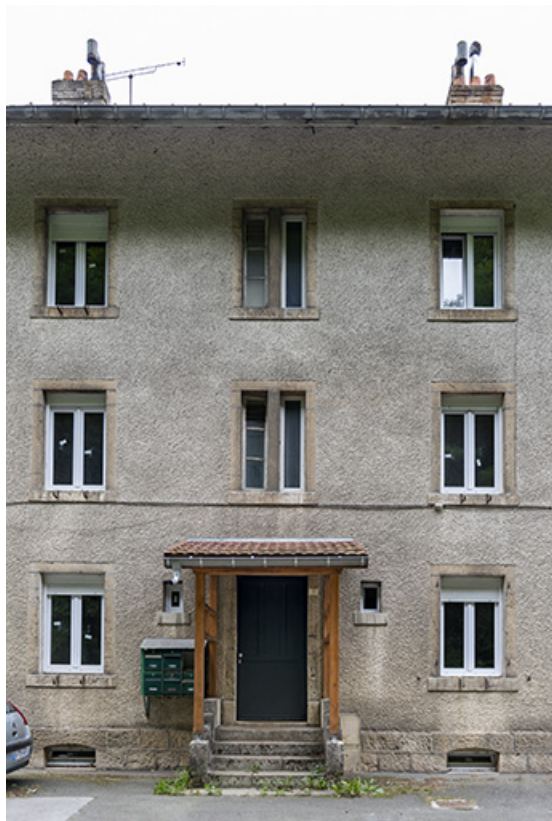
Immeuble, façade antérieure : entrée du n° 10.

25, Liebvillers, 2-10 Cité du Maroc, lieudit : Cité du Maroc