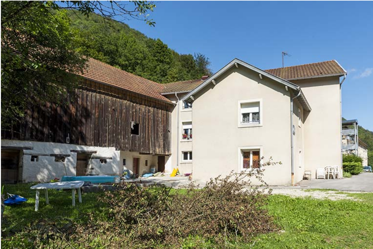
Façade postérieure de l'écurie et la grange à gauche, de la maison à droite.

25, Liebvillers, 2-10 Cité du Maroc, lieudit : Cité du Maroc