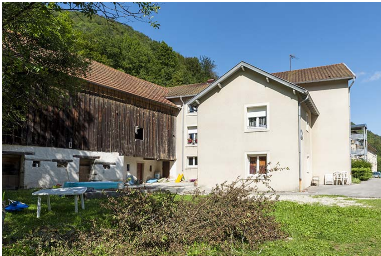
Façade postérieure de l'écurie et la grange à gauche, de la maison à droite.

25, Liebvillers, 2-10 Cité du Maroc, lieudit : Cité du Maroc