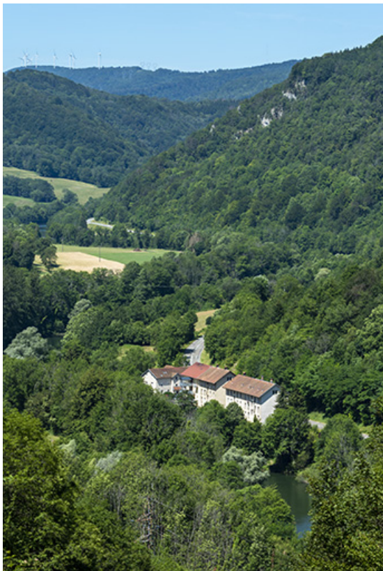
Vue d'ensemble plongeante, depuis le sud-est.

25, Liebvillers, 2-10 Cité du Maroc, lieudit : Cité du Maroc