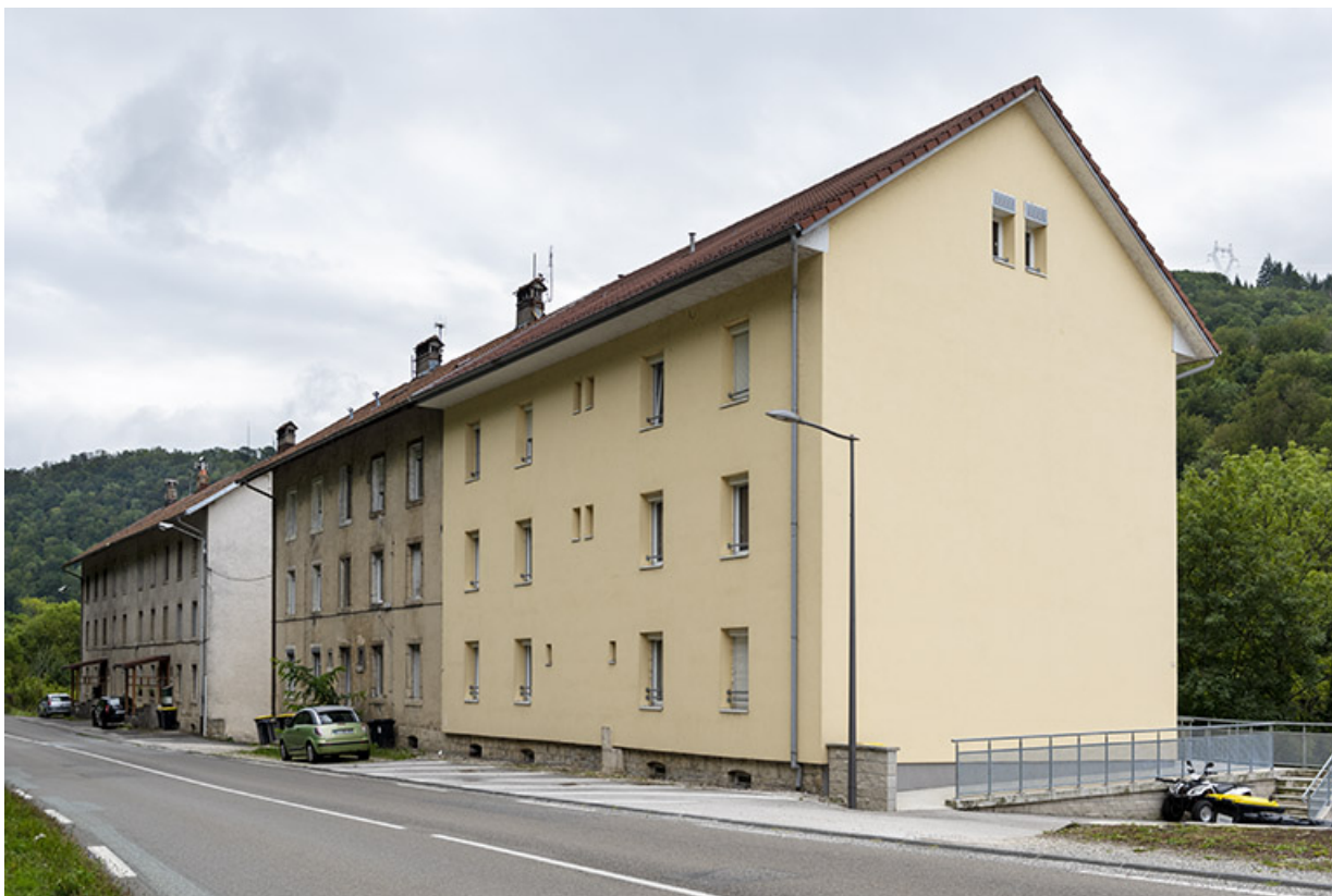
Immeubles : façade antérieure, de trois quarts droite.

25, Liebvillers, 2-10 Cité du Maroc, lieudit : Cité du Maroc