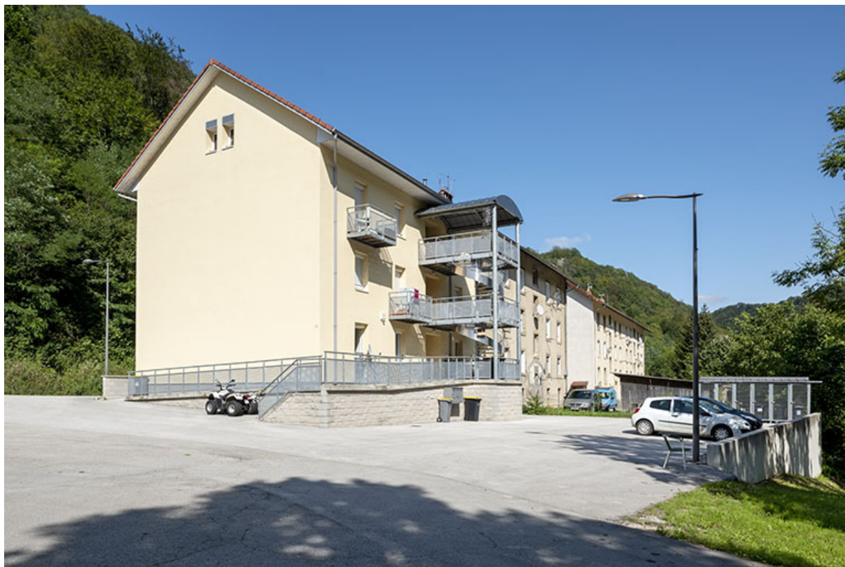
Immeubles : façade postérieure, de trois quarts gauche.

25, Liebvillers, 2-10 Cité du Maroc, lieudit : Cité du Maroc