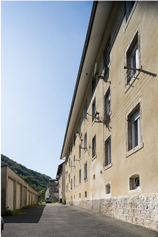
Immeubles : façade postérieure de trois quarts droite, vue en enfilade.

25, Liebvillers, 2-10 Cité du Maroc, lieudit : Cité du Maroc