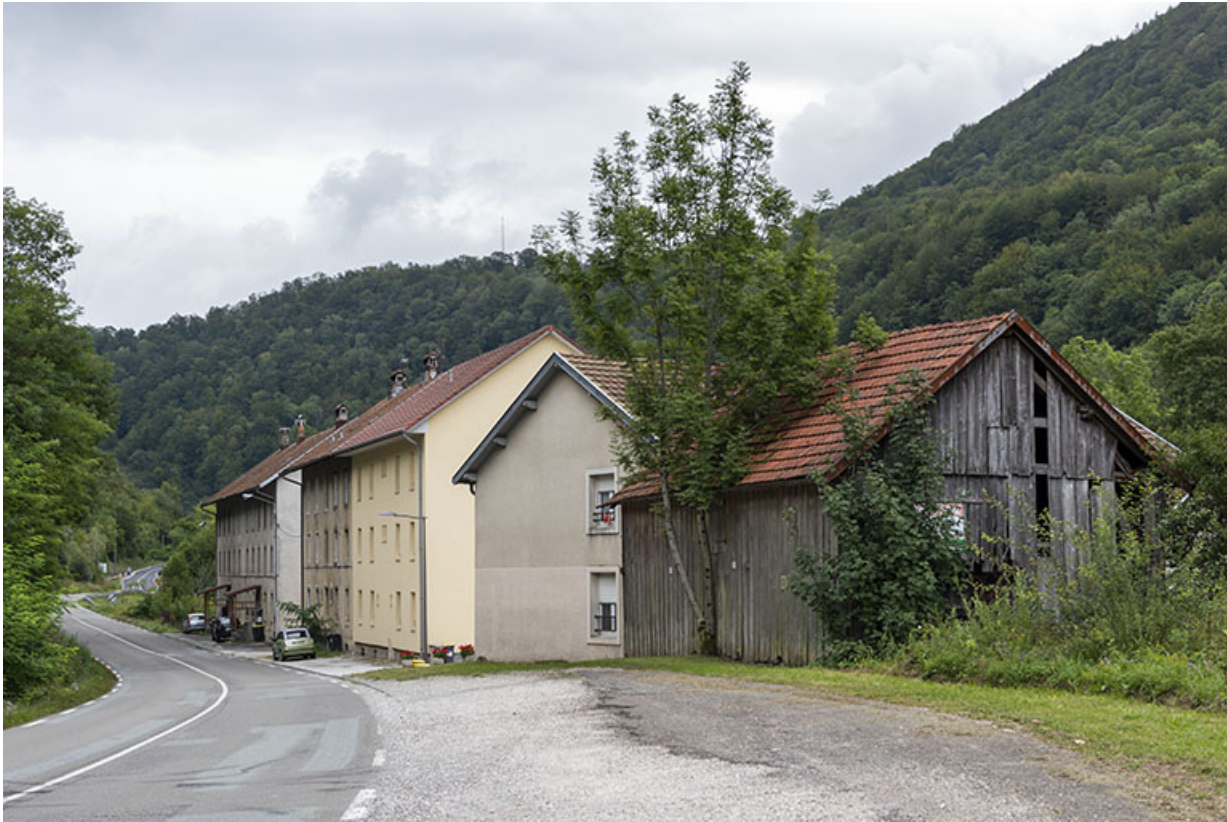
Vue d'ensemble, depuis la route à l'ouest. 25, Liebvillers, lieudit : le Gouffre du Lods