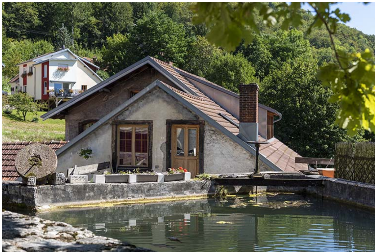
Usine : 1er corps de bâtiment, vu du nord-ouest.