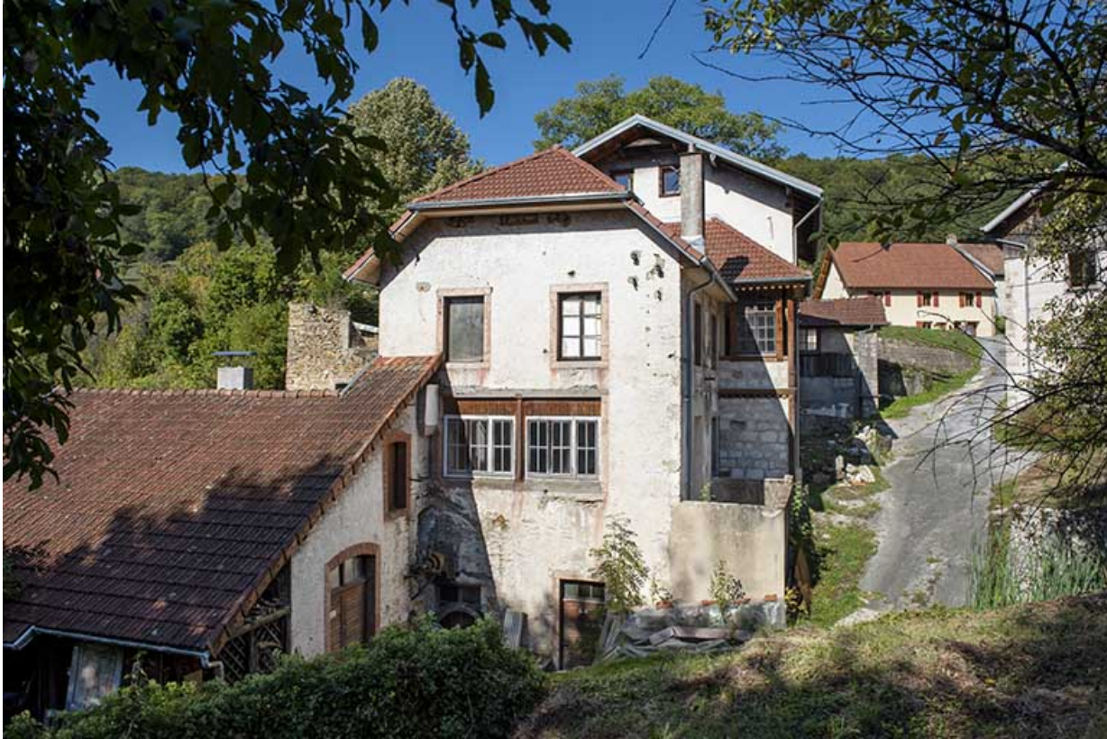
Usine (3e corps de bâtiment) et bâtiment d'eau, vu du sud-est.