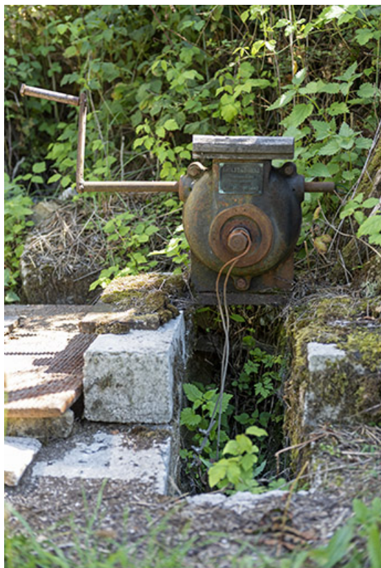
Commande de vanne près du hangar oriental.