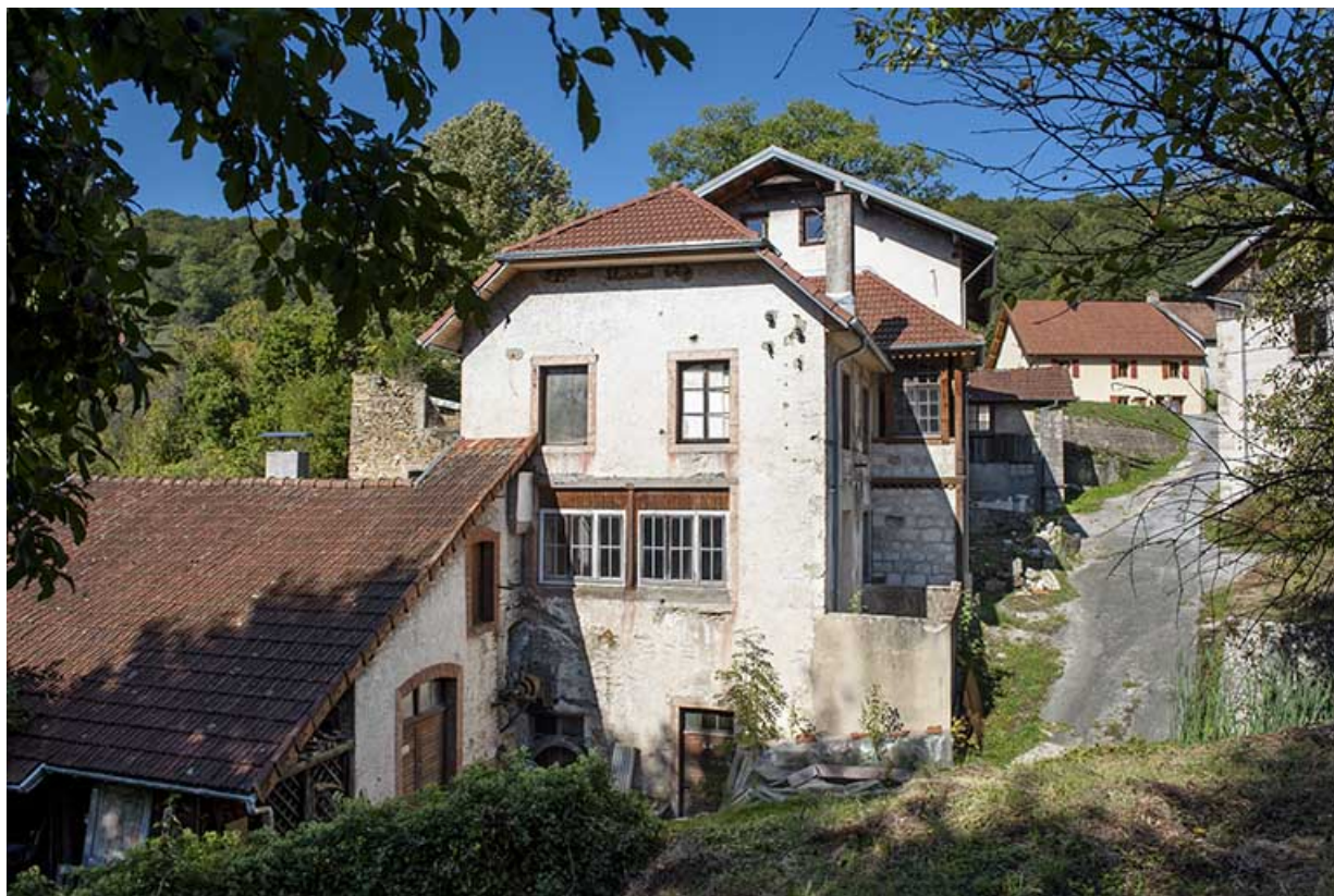
Usine (3e corps de bâtiment) et bâtiment d'eau, vu du sud-est. 25, Liebvillers, 2-4 impasse du Moulin