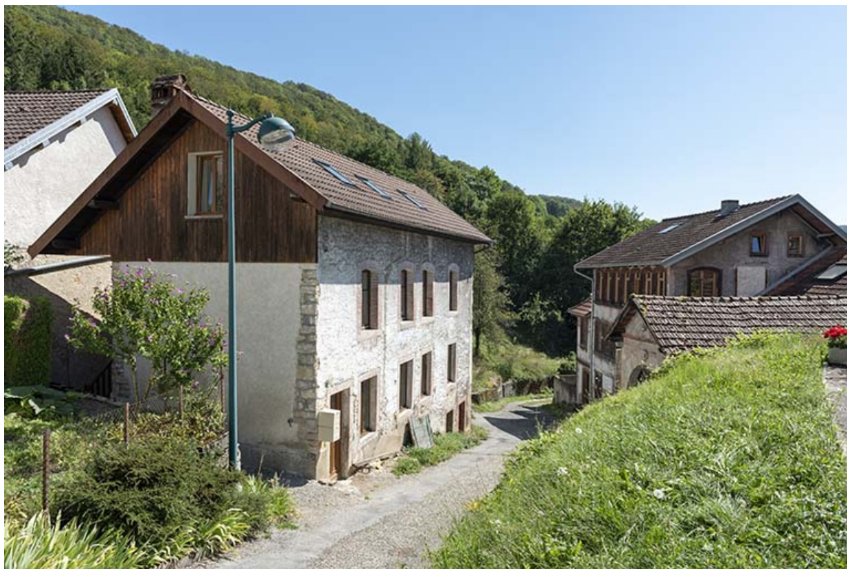
Bâtiment au n° 3 (1815), vu du nord-ouest. 25, Liebvillers, 2-4 impasse du Moulin