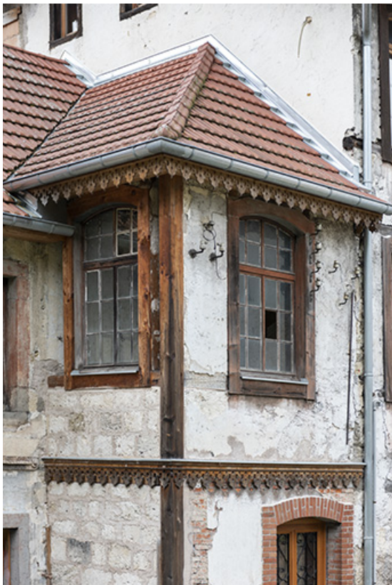
Usine (3e corps de bâtiment) : bureau du contremaître. 25, Liebvillers, 2-4 impasse du Moulin