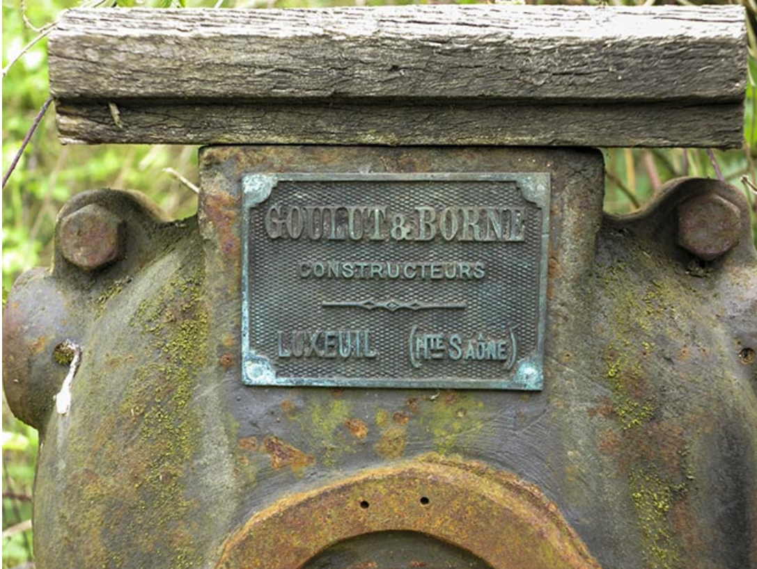
Commande de vanne : plaque du constructeur Goulut & Borne.