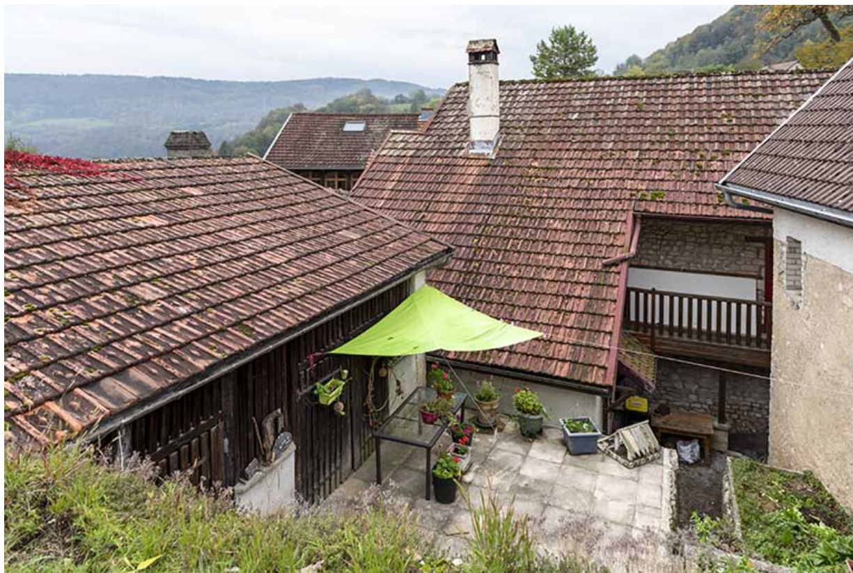
Bâtiment au n° 3 et bûcher, vus de l'est.