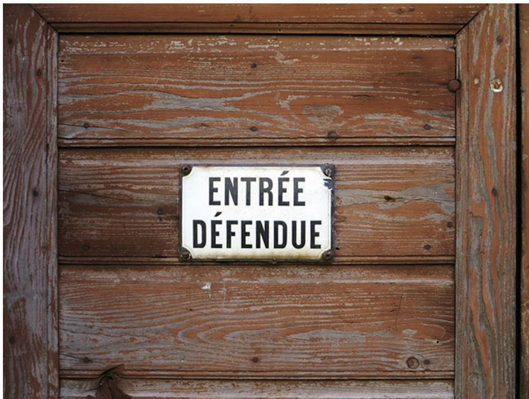
Bâtiment d'eau, façade antérieure : plaque émaillée sur la porte. 25, Liebvillers, 2-4 impasse du Moulin