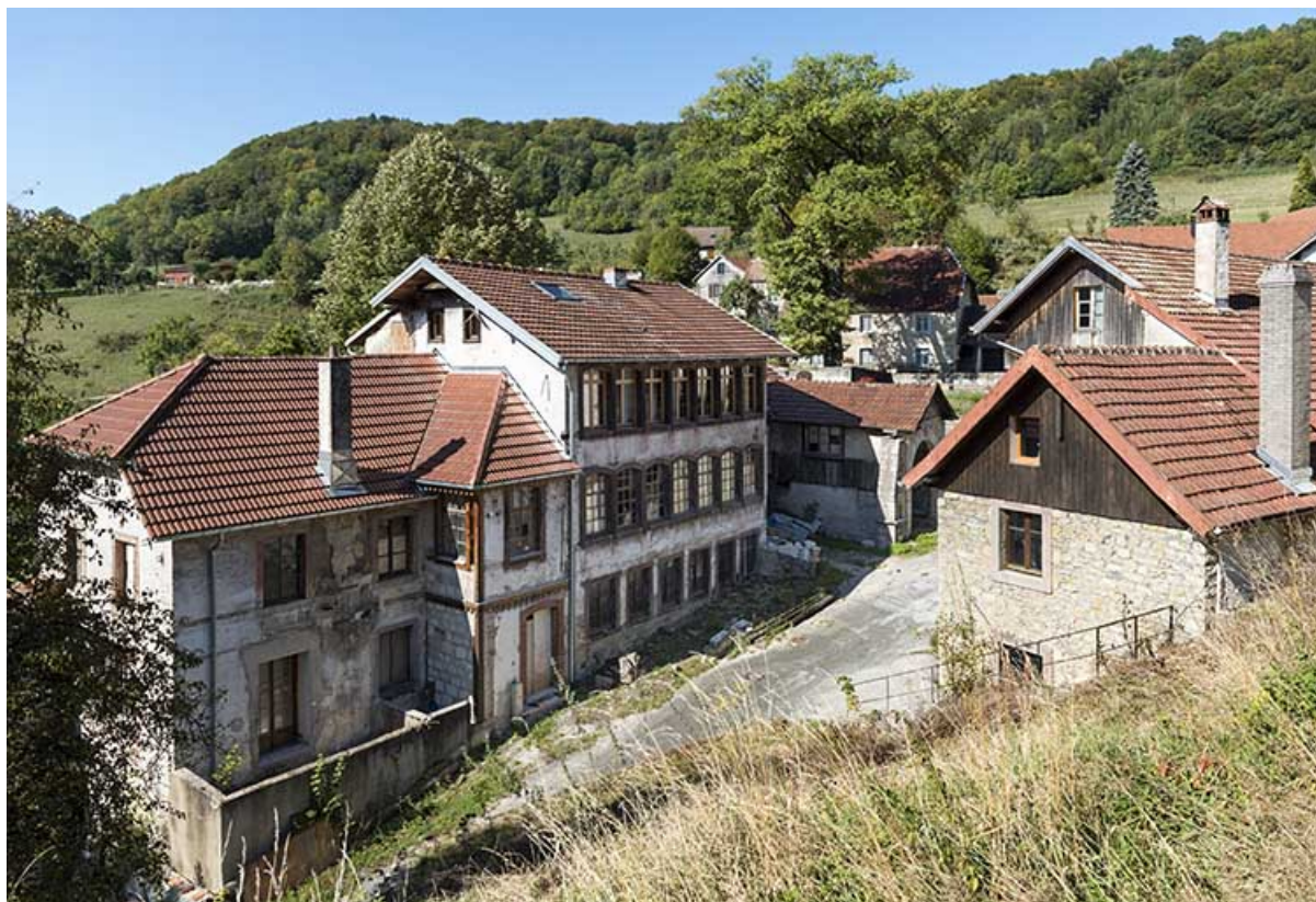
Usine : 2e et 3e corps de bâtiment, vus de l'est (façade antérieure). 25, Liebvillers, 2-4 impasse du Moulin