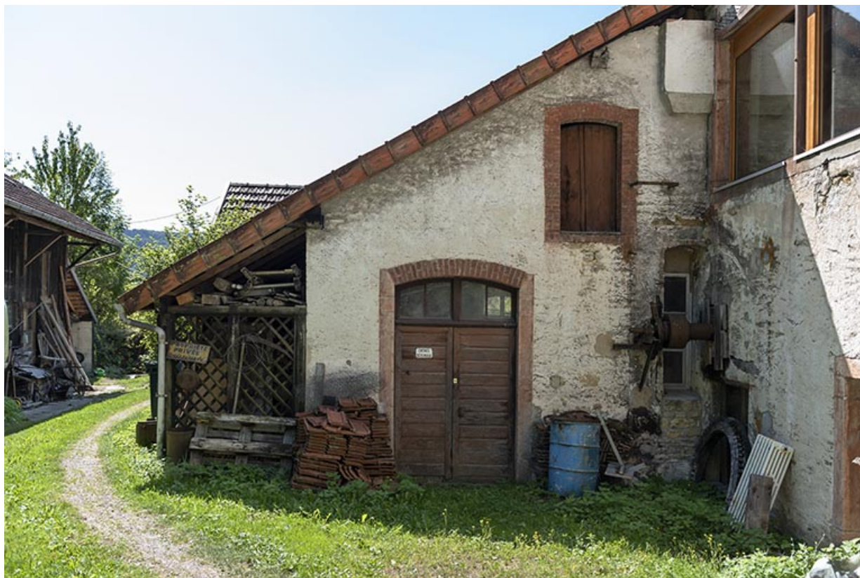
Bâtiment d'eau : façade antérieure.