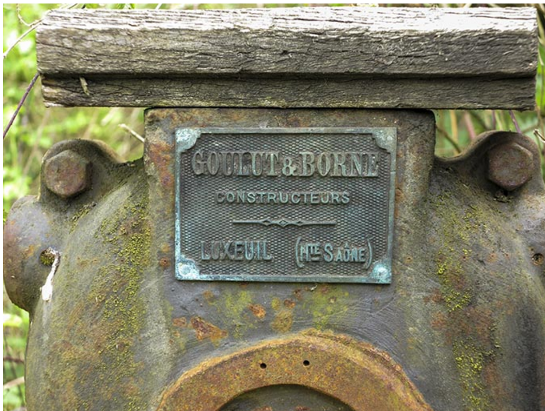
Commande de vanne : plaque du constructeur Goulut & Borne.