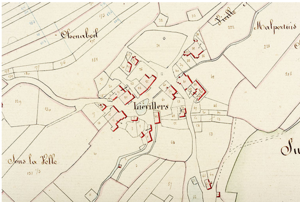
Cadastre de la commune de Liebvillers. Atlas parcellaire, 1830. Section A du village en une feuille [détail], 1/2 500. 25, Liebvillers, 2-4 impasse du Moulin