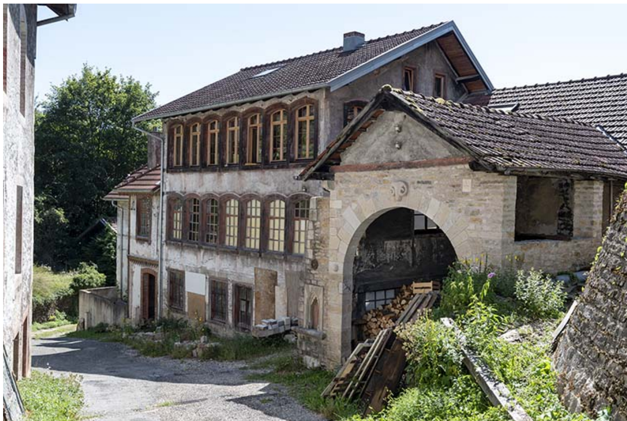
Usine (2e corps de bâtiment) et hangar, vus du nord (façade antérieure). 25, Liebvillers, 2-4 impasse du Moulin