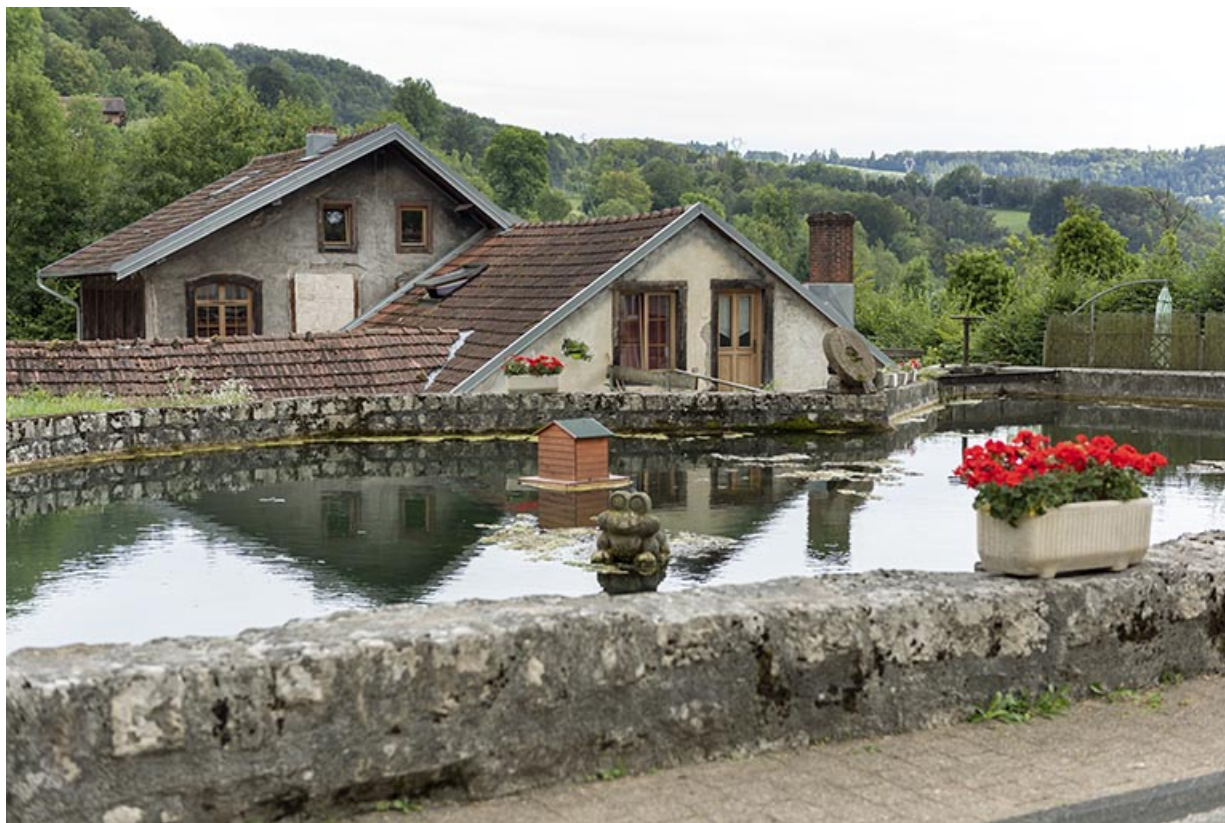
Usine et bassin de retenue, vus du nord.