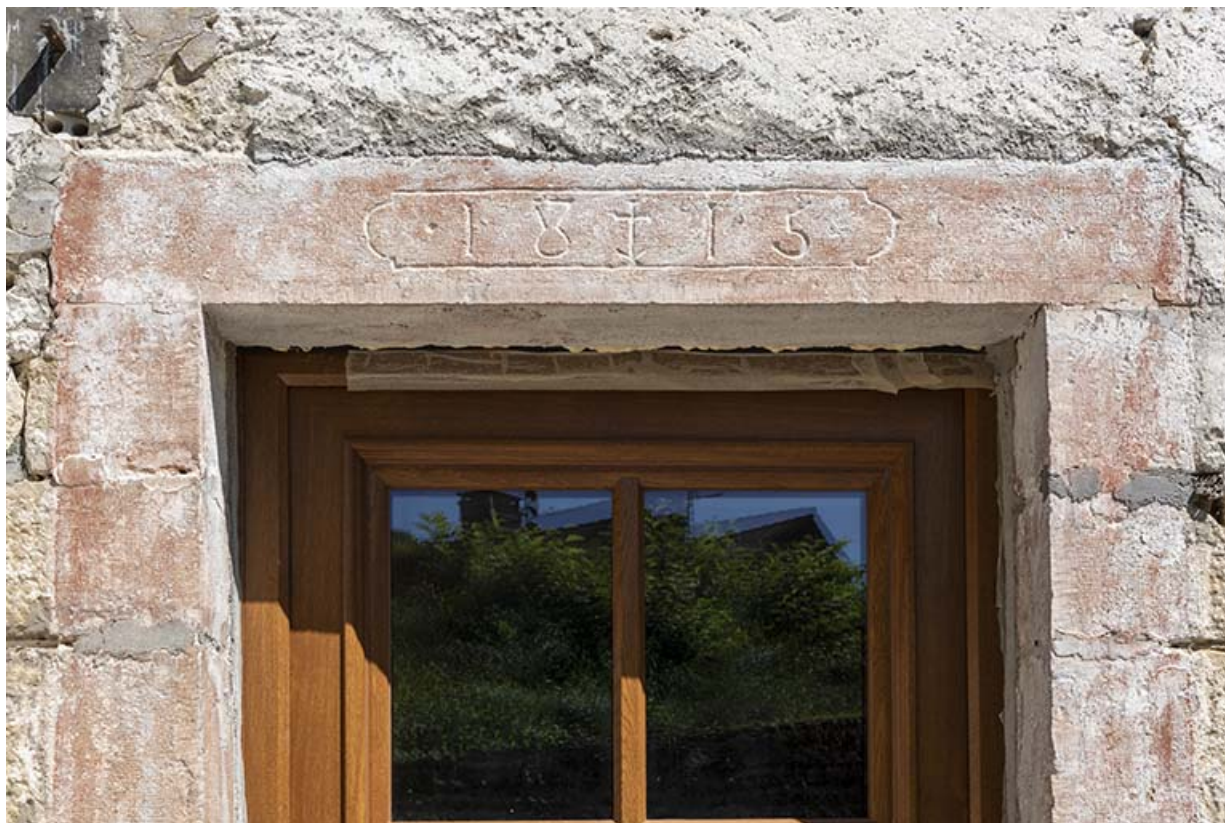
Bâtiment au n° 3 : linteau daté 1815.