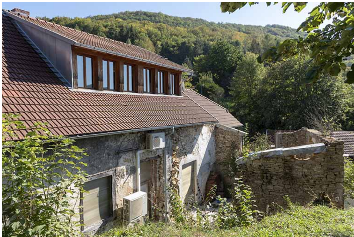
Usine : 2e corps de bâtiment, vu de l'ouest (façade postérieure). 25, Liebvillers, 2-4 impasse du Moulin