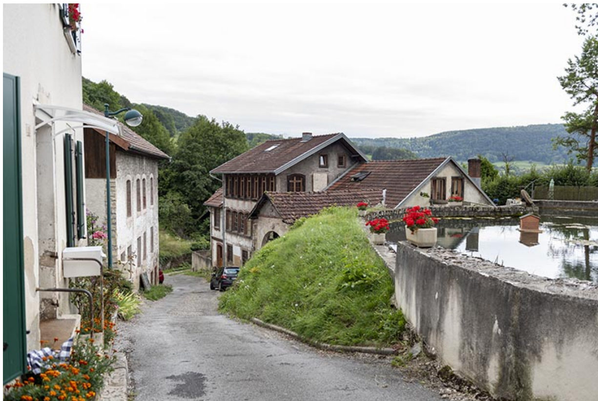
Bâtiment de 1815 (au 2e plan), usine et bassin de retenue, depuis le nord. 25, Liebvillers, 2-4 impasse du Moulin