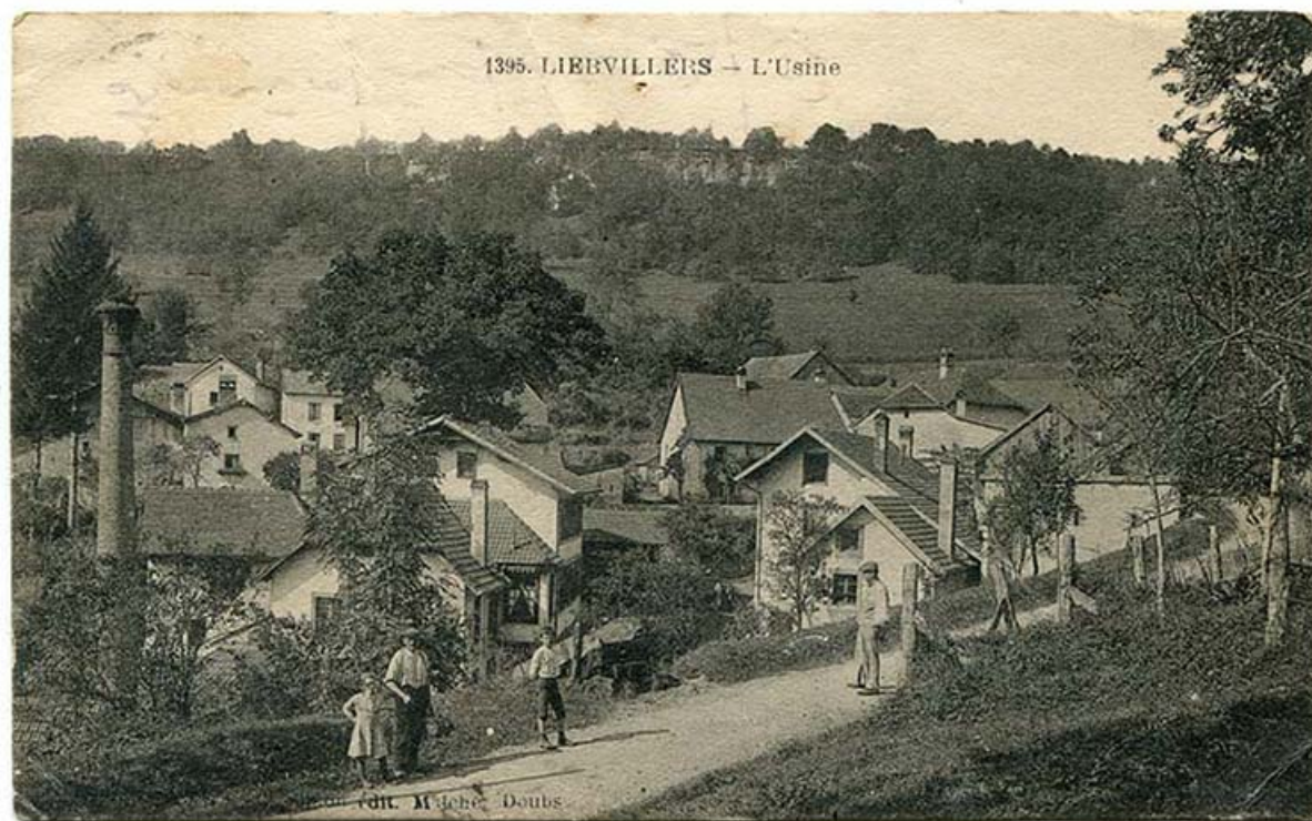
1395. Liebvillers - L'usine, 1ère moitié 20e siècle [avant 1932].