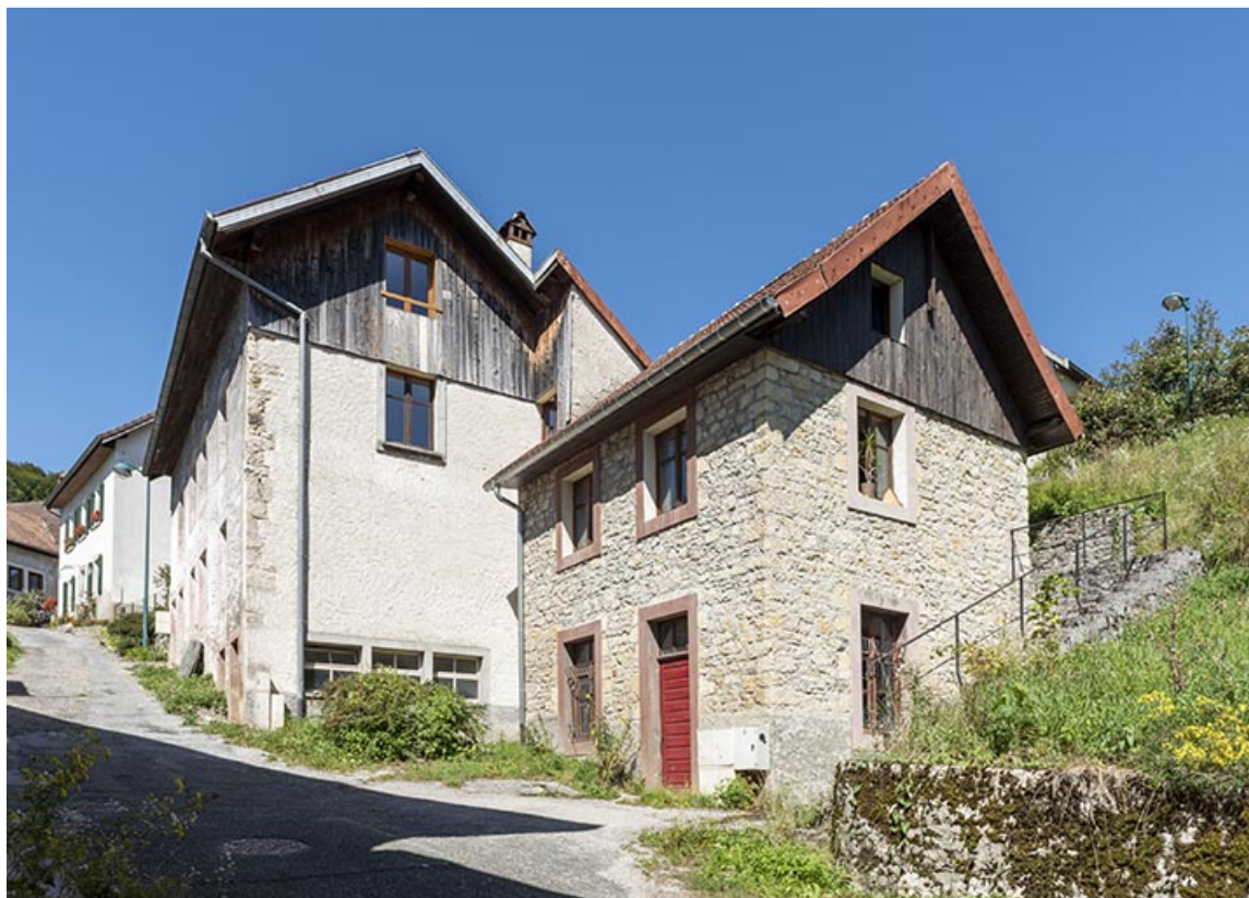
Bâtiment au n° 3 et atelier, vus du sud-est. 25, Liebvillers, 2-4 impasse du Moulin