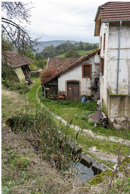
Bâtiment d'eau, vu de l'est.