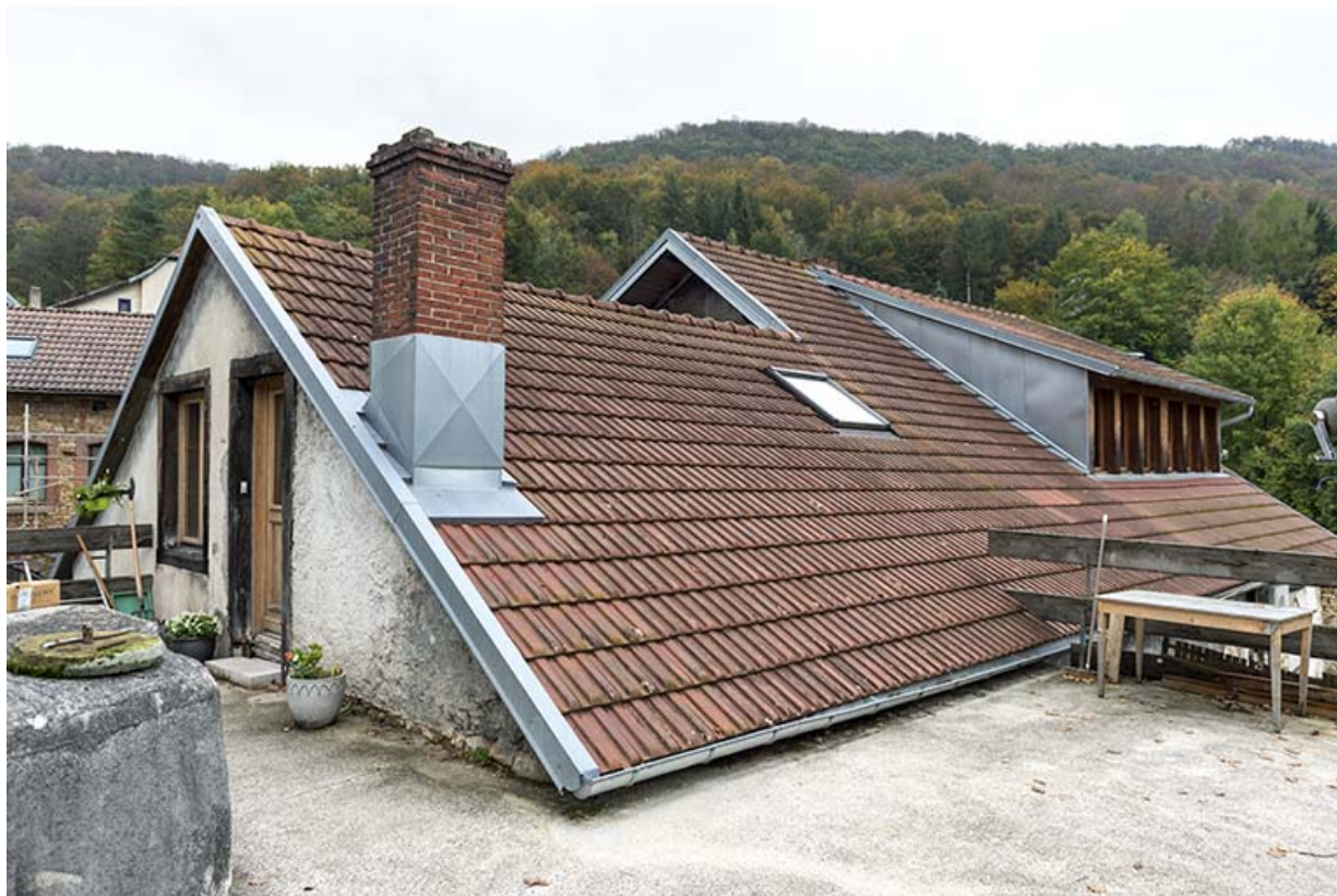
Usine : 1er corps de bâtiment, vu de l'ouest. 25, Liebvillers, 2-4 impasse du Moulin