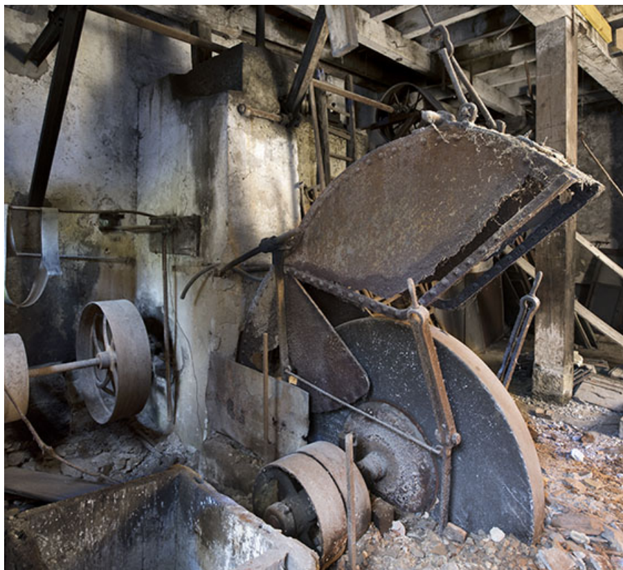
Usine : meule à l'étage de soubassement du 3e corps de bâtiment. 25, Liebvillers, 2-4 impasse du Moulin