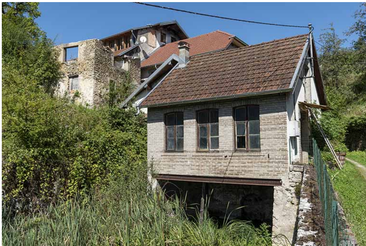
Bâtiment d'eau, vu du sud. A gauche, le bâtiment en ruine vu en contre-plongée.