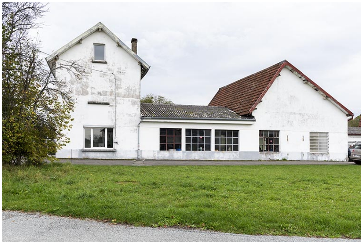
Bâtiments nord : façade latérale droite.