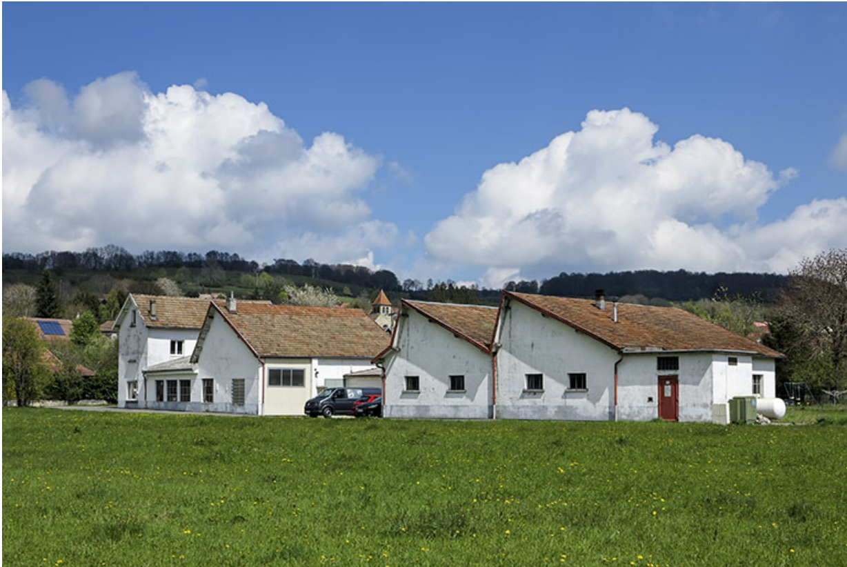
Vue d'ensemble, depuis le sud-ouest (façade latérale droite).