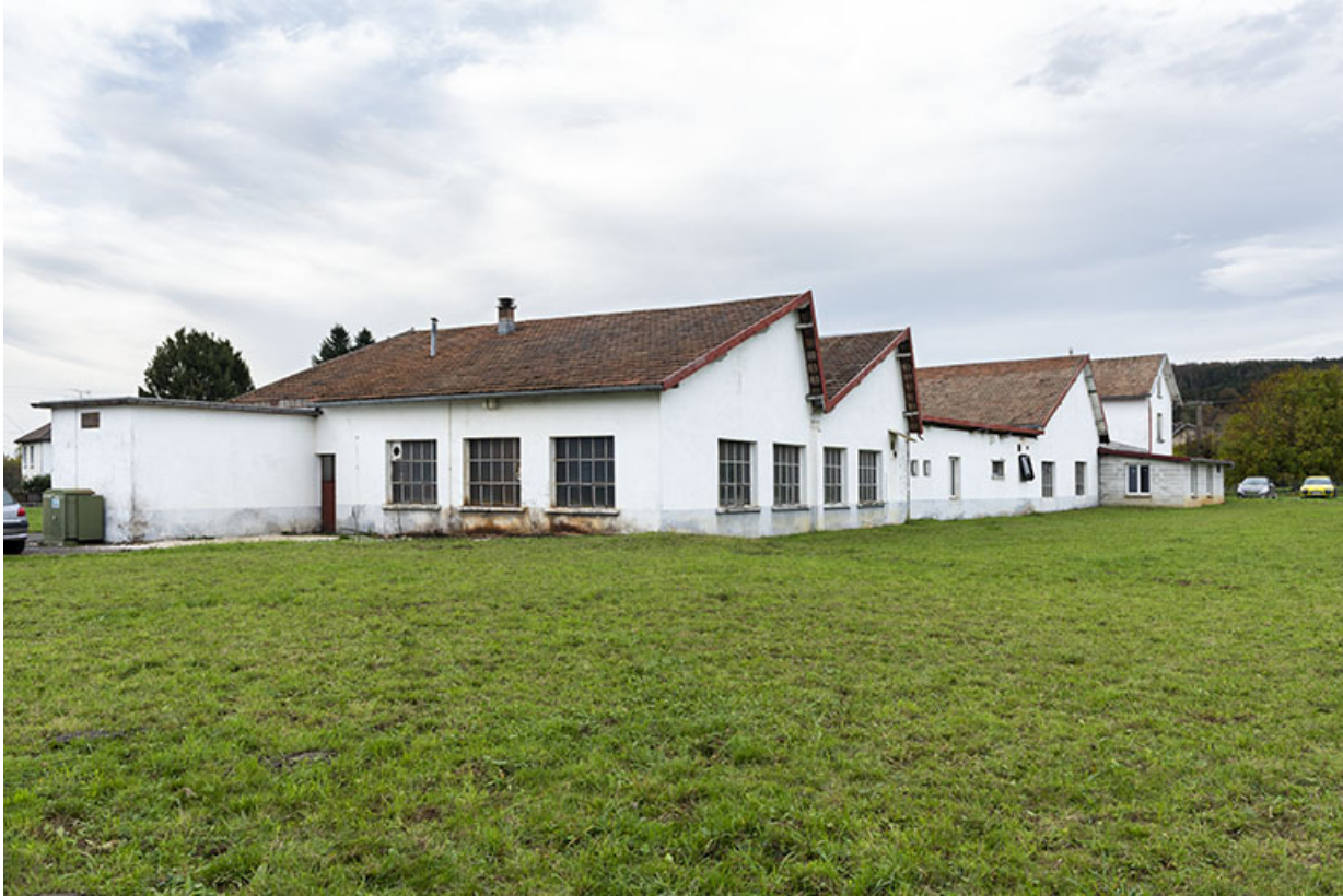
Vue d'ensemble, depuis le sud-est (façade latérale gauche).