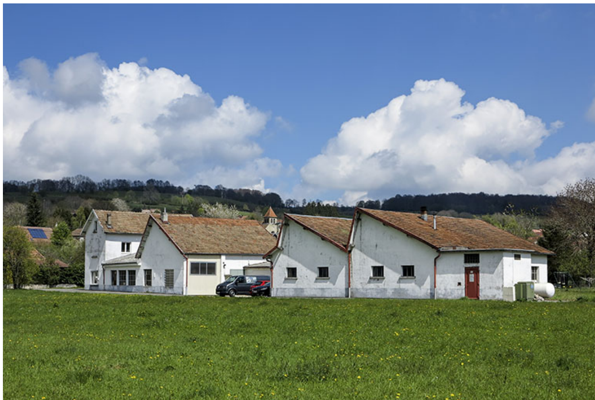
Vue d'ensemble, depuis le sud-ouest (façade latérale droite).