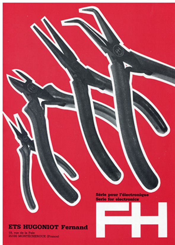
FH. Série pour l'électronique. Serie for electronics. Ets Hugoniot Fernand [dépliant publicitaire : p. 1], [1983 ?]. 25, Montécheroux, 18 rue de la Pâle