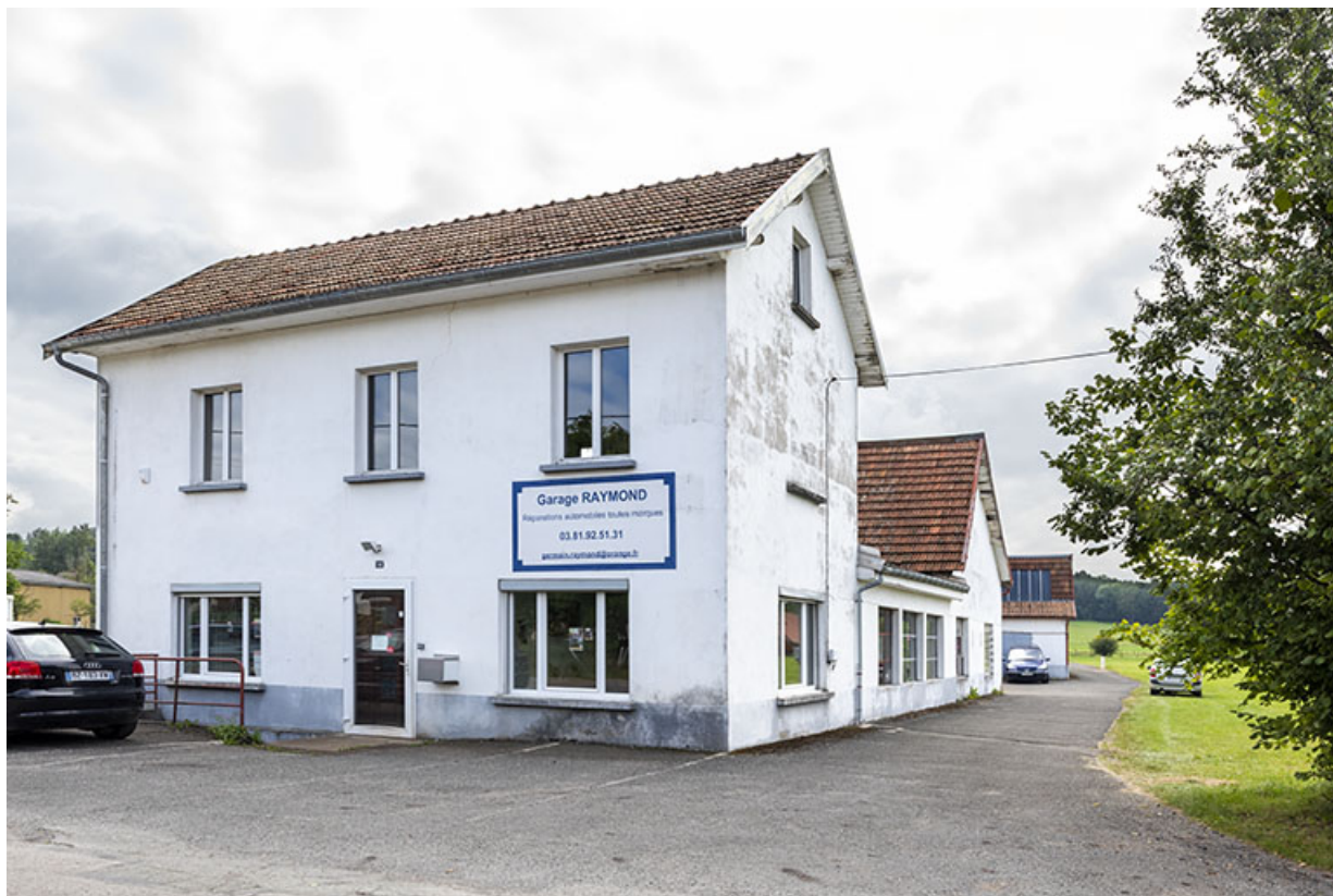
Bâtiments nord : façade antérieure, de trois quarts droite. 25, Montécheroux, 18 rue de la Pâle