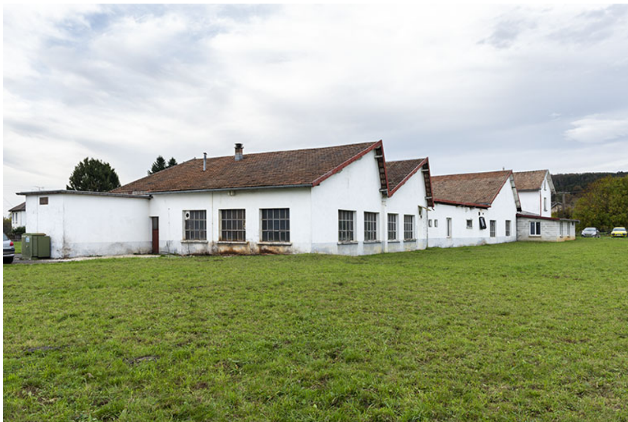
Vue d'ensemble, depuis le sud-est (façade latérale gauche). 25, Montécheroux, 18 rue de la Pâle