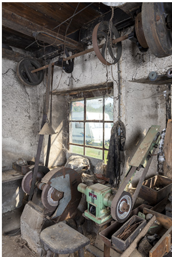
Forge : transmissions et machines contre le mur sud. 25, Montécheroux, 11 Grande Rue