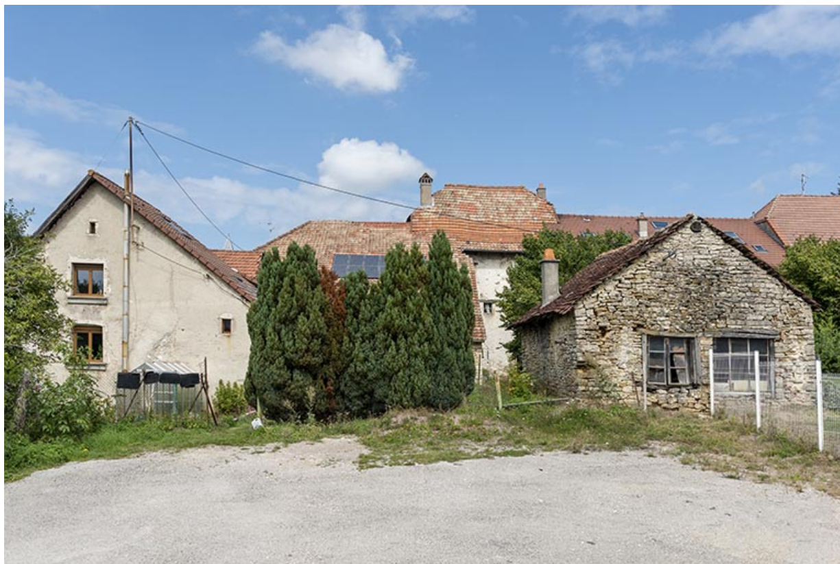
Vue d'ensemble, depuis le sud. La grange et la maison sont partiellement masquées ; la forge est visible à droite. 25, Montécheroux, 11 Grande Rue