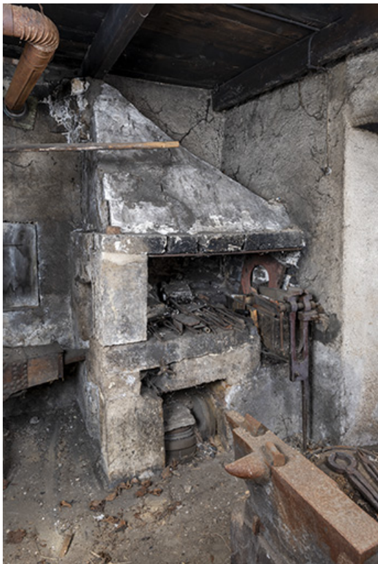
Forge : foyer, de trois quarts.