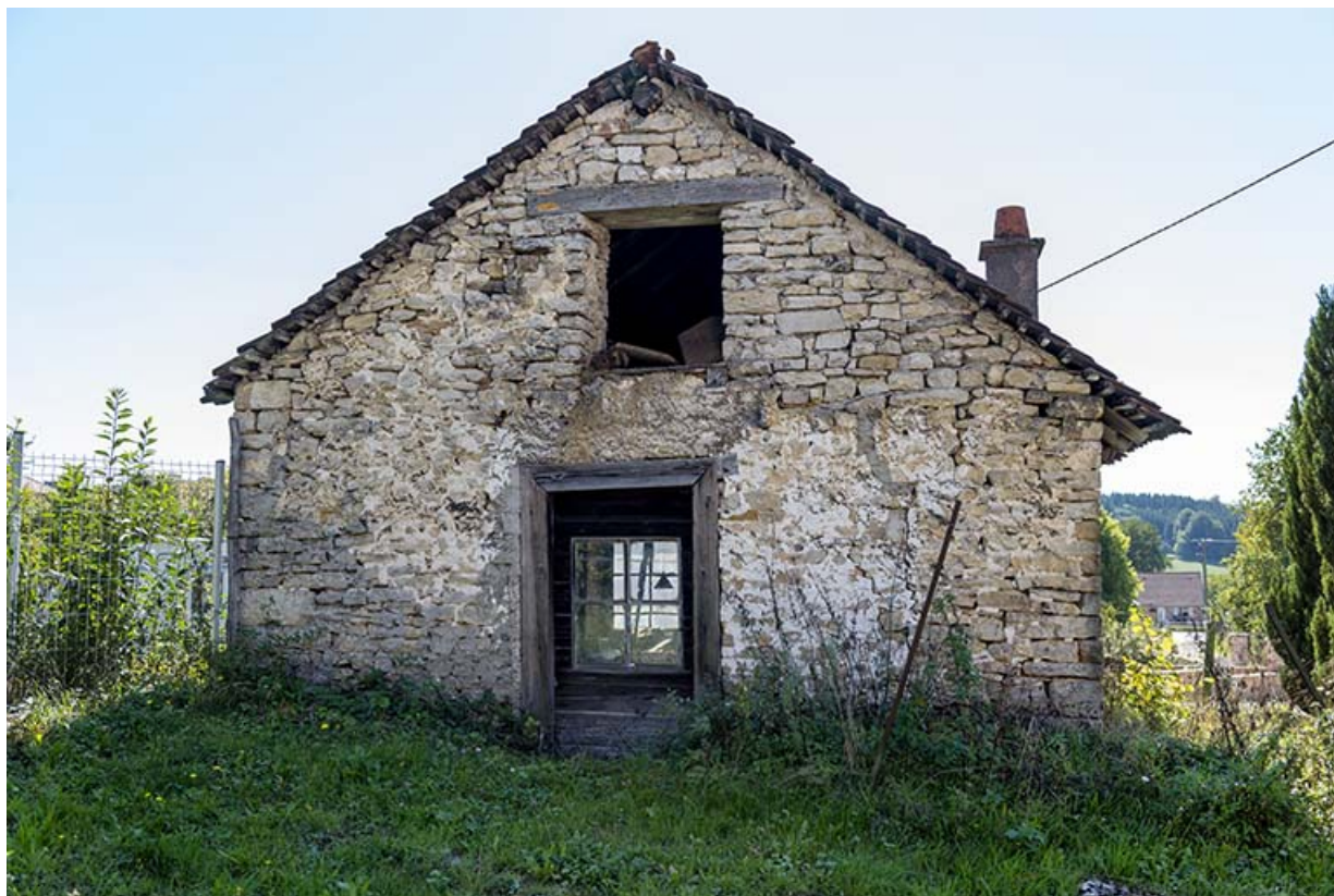
Forge : façade antérieure.