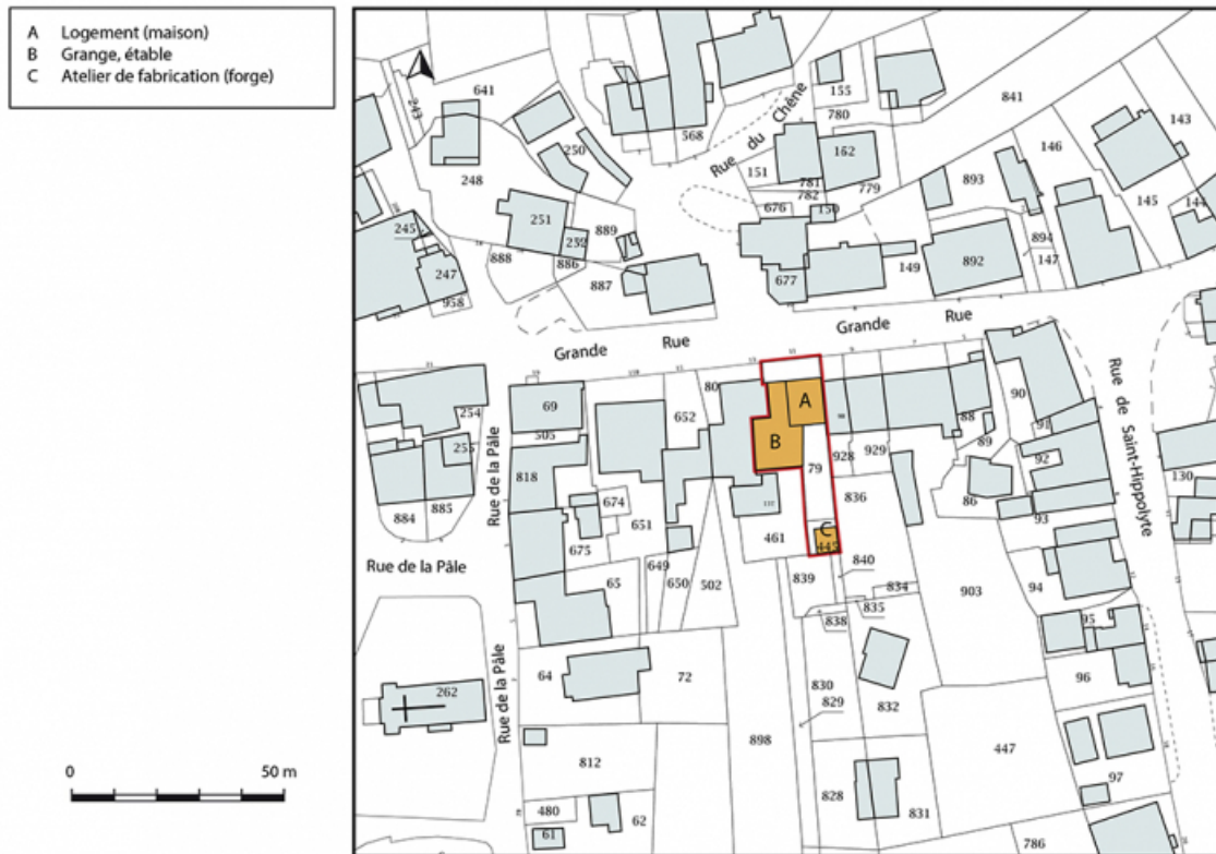
Plan-masse et de situation. Extrait du plan cadastral, 2018, section D. 25, Montécheroux, 11 Grande Rue