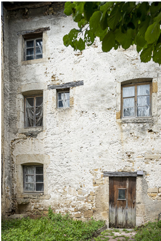
Maison : façade postérieure, de trois quarts.