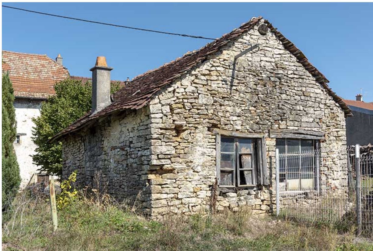
Forge : façade postérieure, de trois quarts gauche.