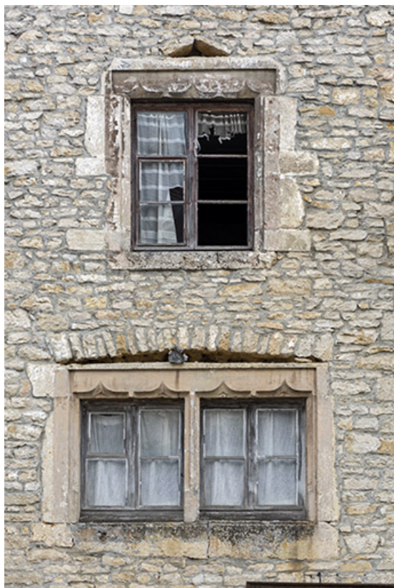
Maison, façade antérieure : fenêtres à meneau et arcs en accolade. 25, Montécheroux, 11 Grande Rue