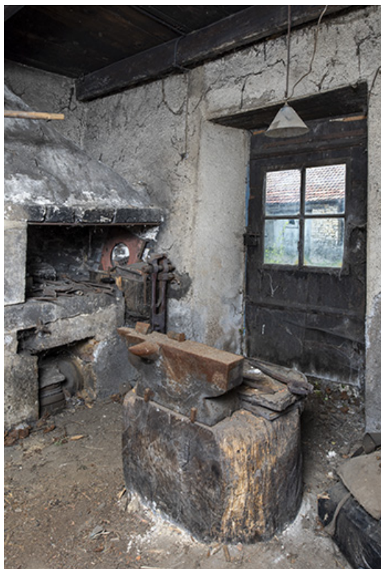
Forge : entrée, foyer et enclume. 25, Montécheroux, 11 Grande Rue