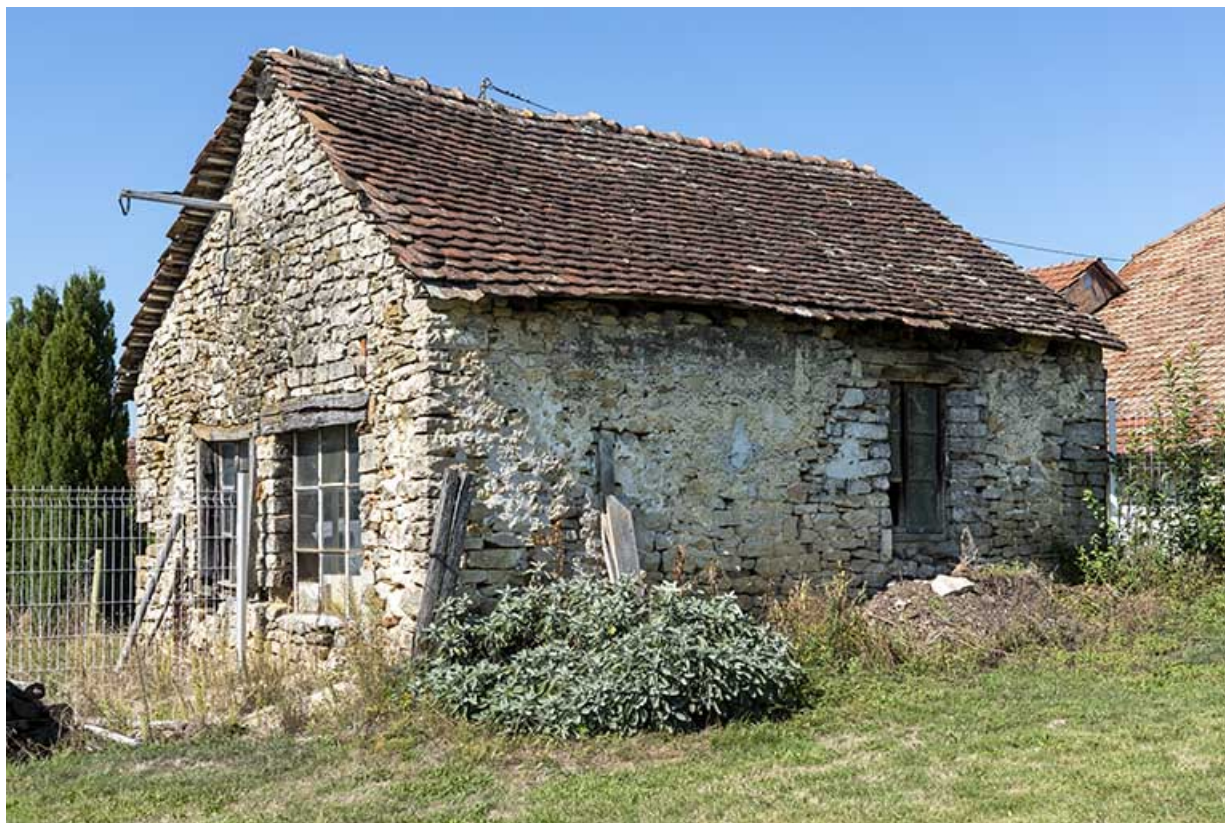
Forge : façades postérieure et latérale gauche. 25, Montécheroux