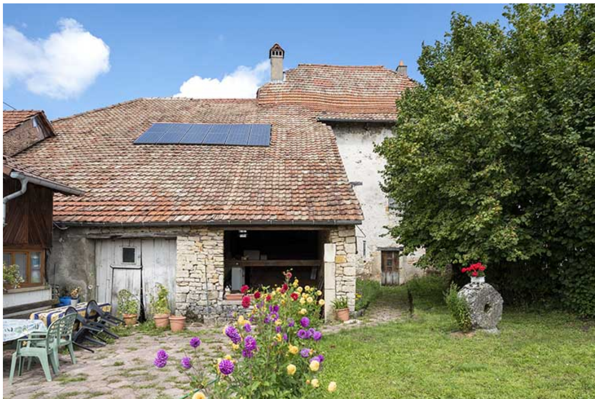
Maison et grange : façade postérieure.