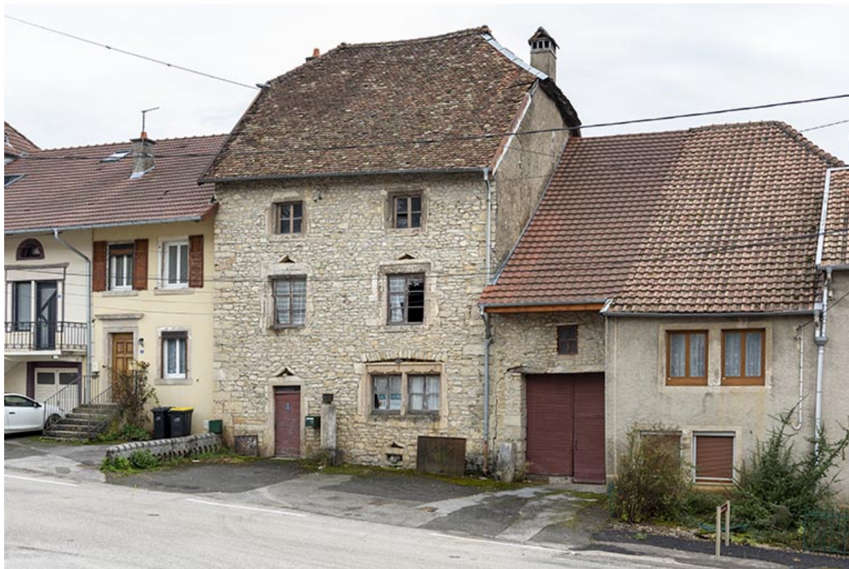
Maison et grange : façade antérieure, de trois quarts droite.