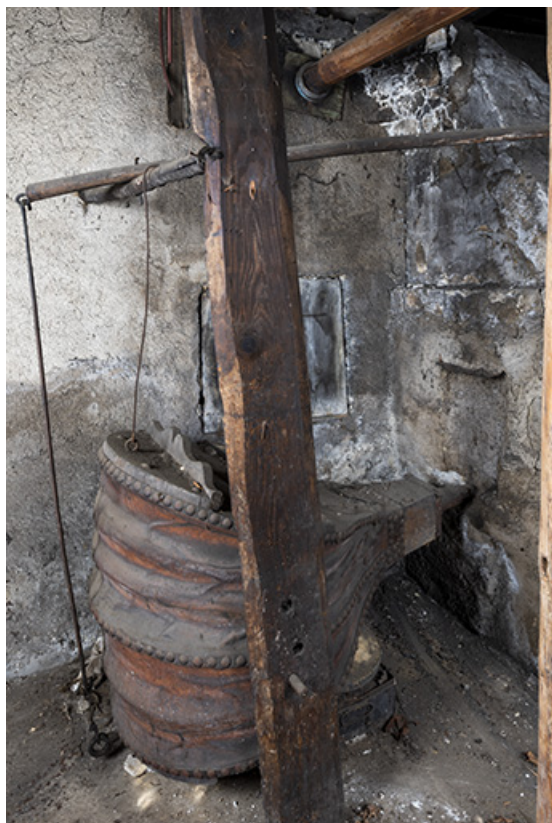
Forge : soufflet.