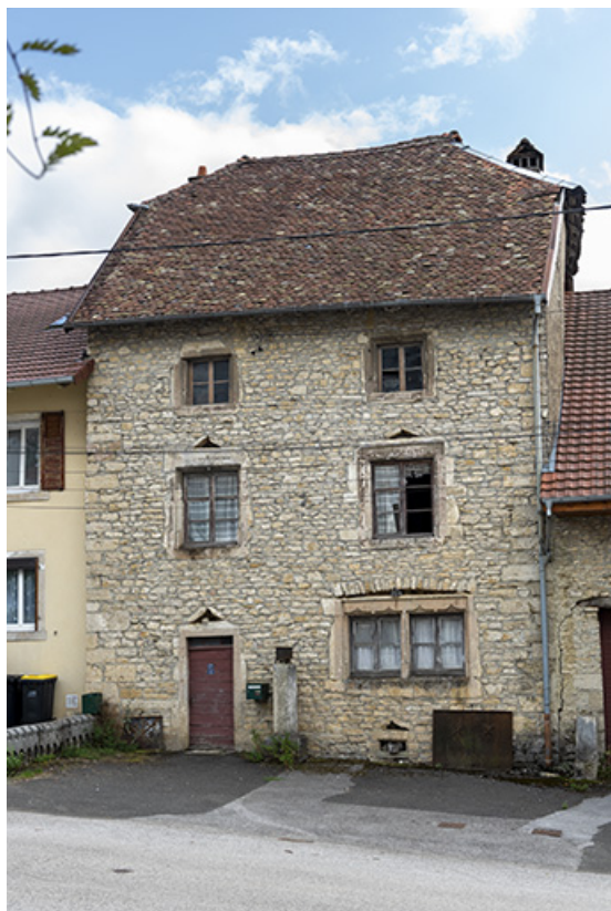
Maison : façade antérieure, de trois quarts droite.