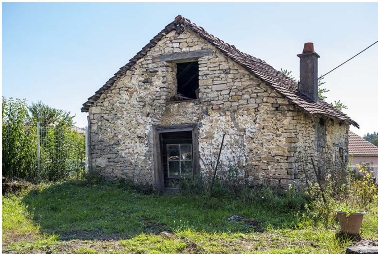
Forge : façade antérieure, de trois quarts droite. 25, Montécheroux, 11 Grande Rue