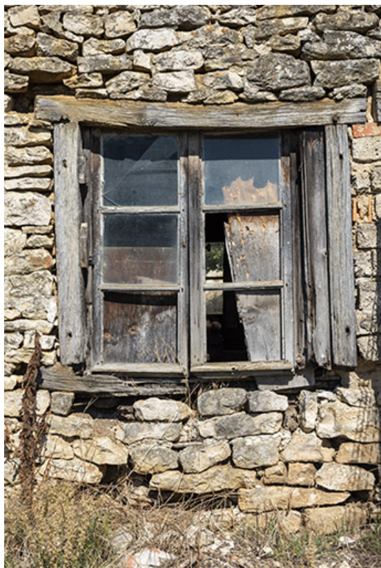
Forge, façade postérieure : fenêtre.