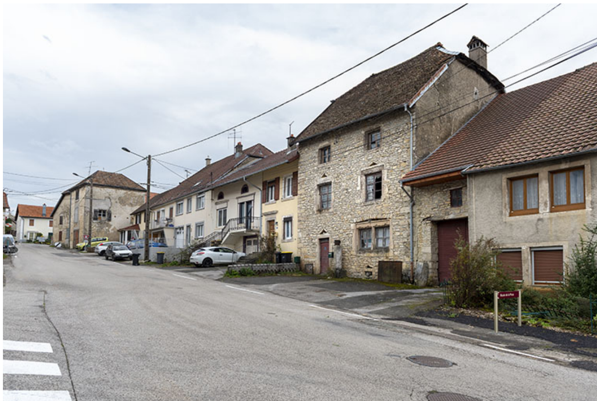
Vue d'ensemble, depuis le nord-ouest (Grande Rue). La maison et la grange sont visibles à droite. 25, Montécheroux, 11 Grande Rue