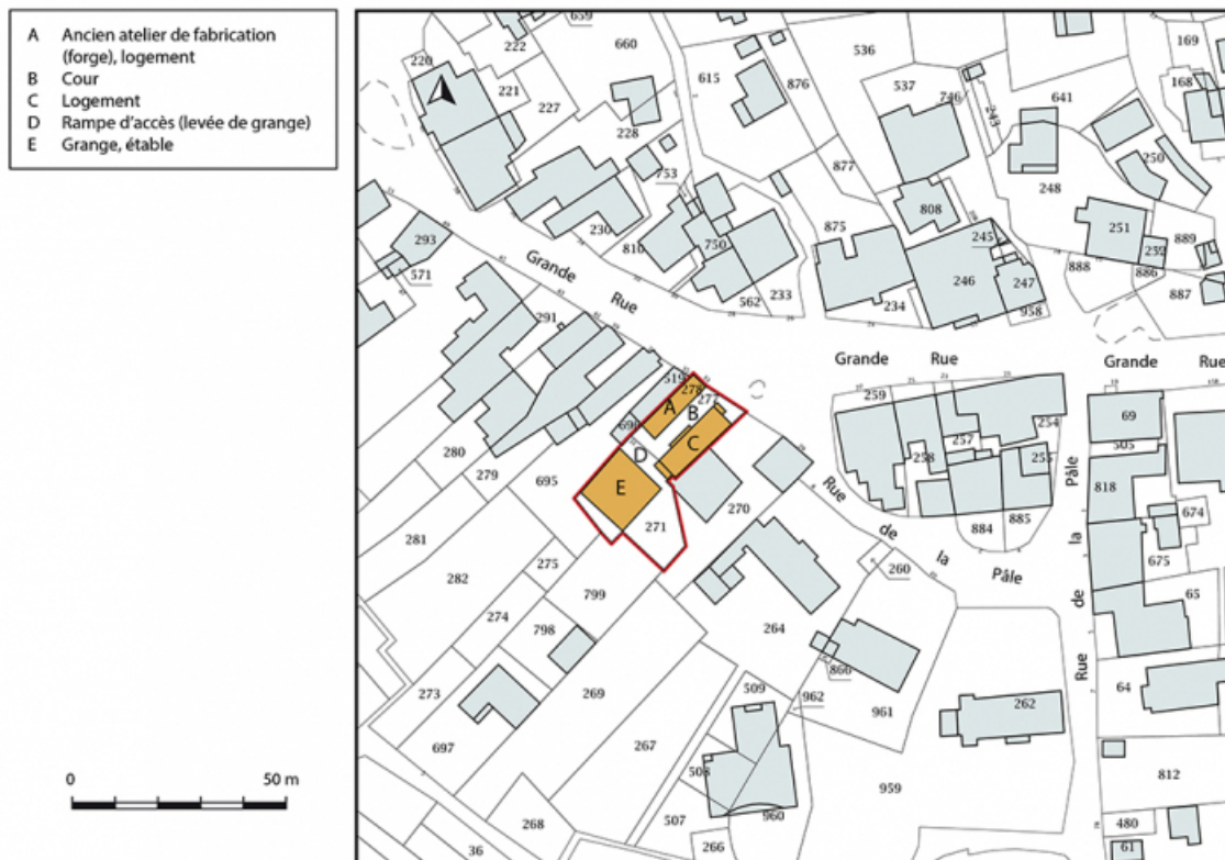
Plan-masse et de situation. Extrait du plan cadastral, 2019, section D. 25, Montécheroux, 31-33 Grande Rue