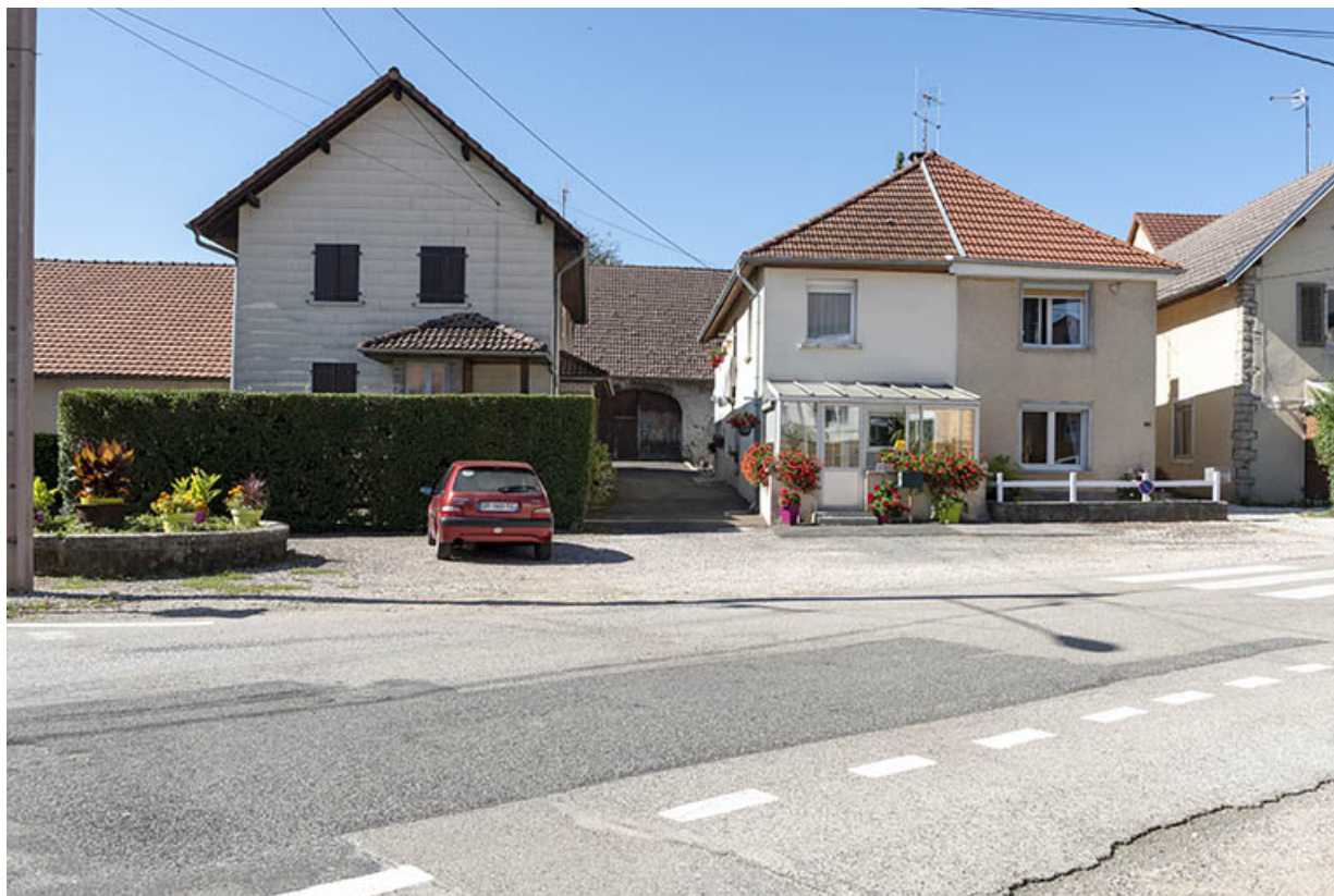
Vue d'ensemble, depuis la rue (au nord). 25, Montécheroux, 31-33 Grande Rue