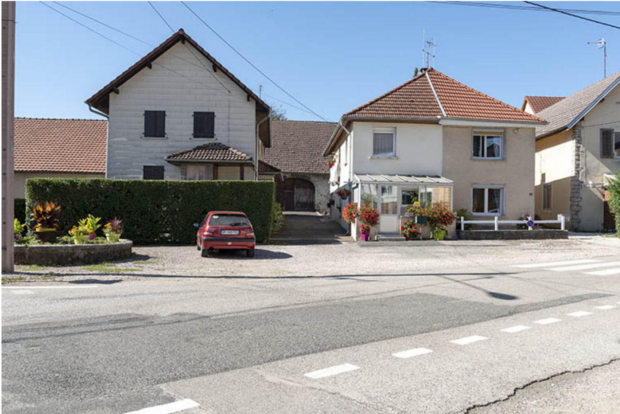
Vue d'ensemble, depuis la rue (au nord).