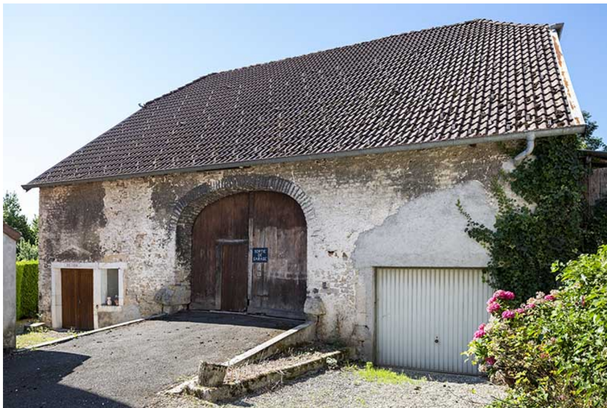
Grange et étable : façade antérieure, de trois quarts.