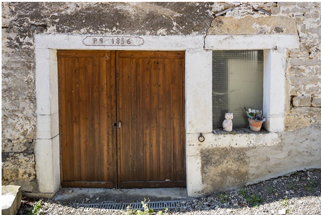
Grange et étable : linteau daté (sur la façade antérieure).