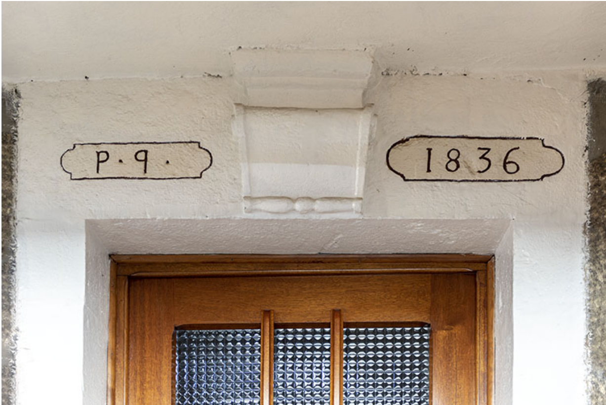
Maison de 1836 : linteau daté (sur la façade latérale droite).