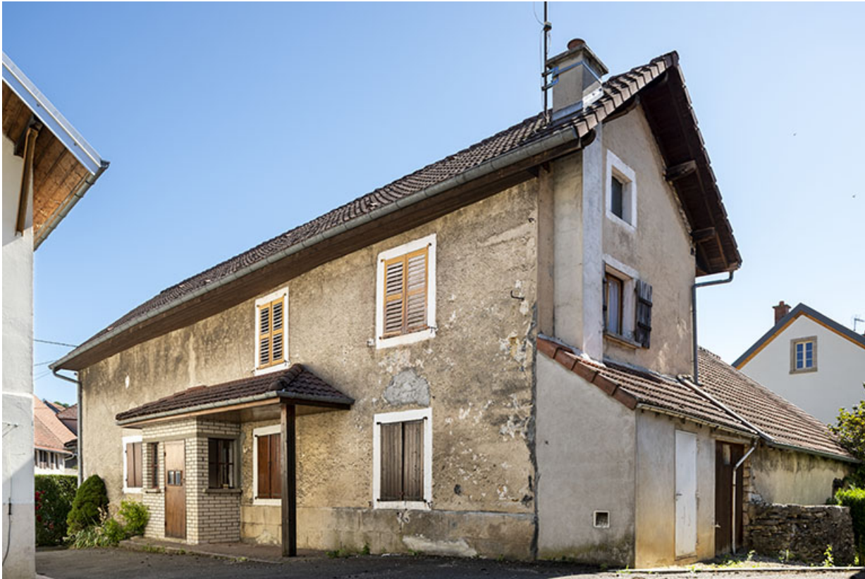
Maison de 1836 ayant abrité le café-restaurant : façades postérieure et latérale droite.