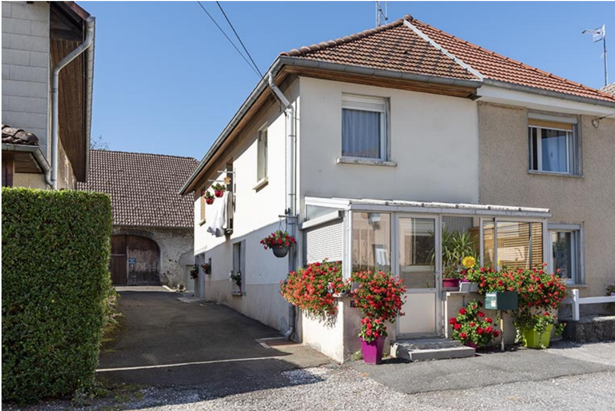
Bâtiment ayant abrité forge et logement.