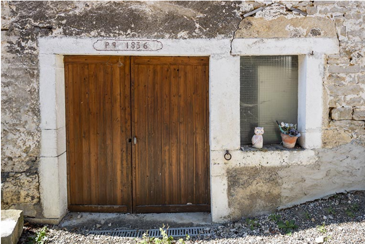
Grange et étable : linteau daté (sur la façade antérieure).