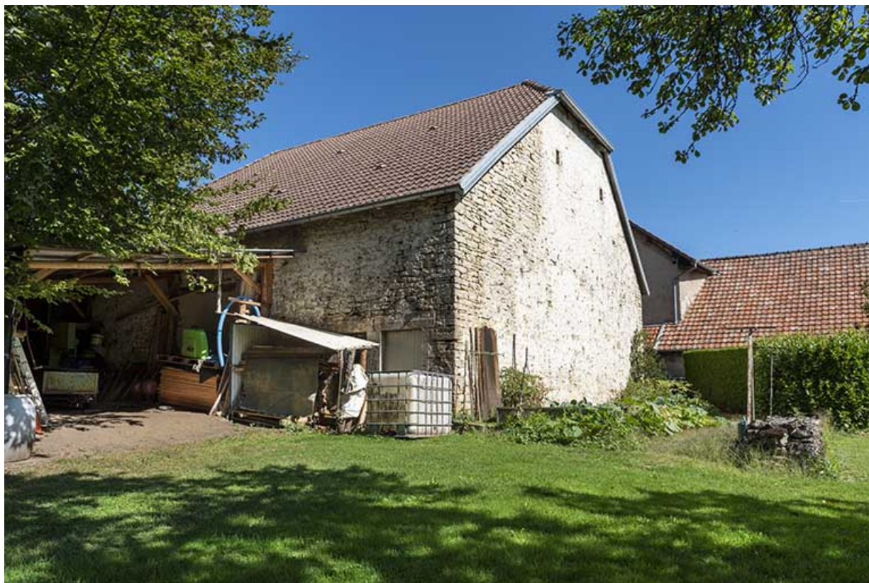
Grange et étable : façades postérieure et latérale gauche.