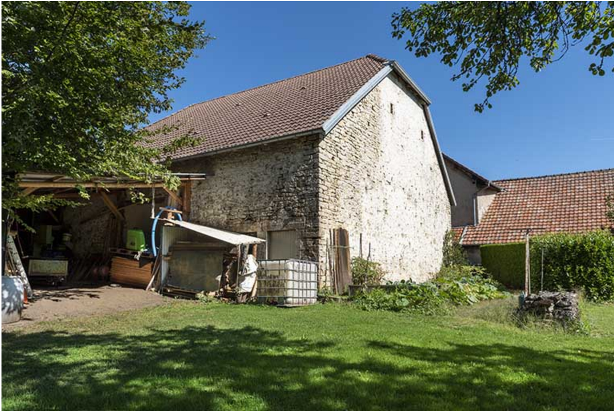
Grange et étable : façades postérieure et latérale gauche.