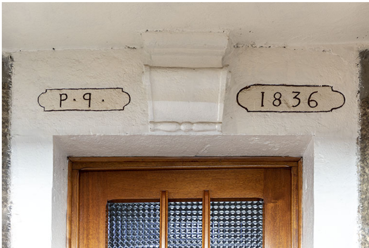
Maison de 1836 : linteau daté (sur la façade latérale droite).