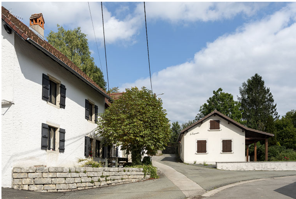
Vue d'ensemble, depuis l'ouest : ferme à gauche, nouvelle forge à droite. 25, Montécheroux, 13-15 rue de la Pommeraie