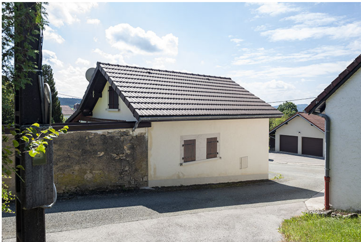
Nouvelle forge : façades postérieure et latérale gauche.

25, Montécheroux, 13-15 rue de la Pommeraie