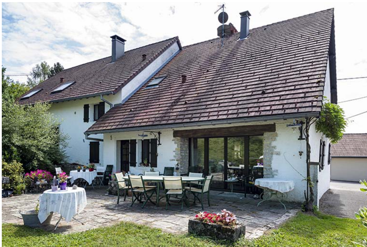
Ferme : façade postérieure, de trois quarts. 25, Montécheroux, 13-15 rue de la Pommeraie