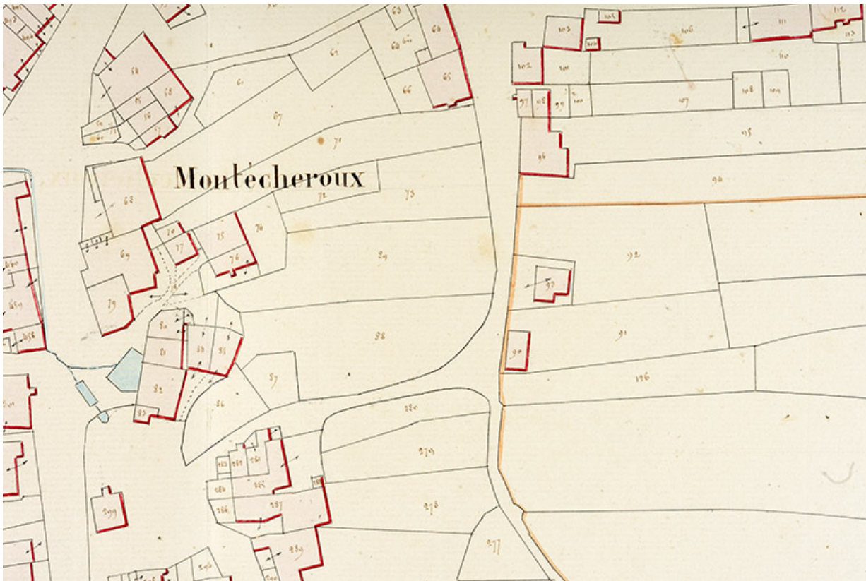
Cadastre de la commune de Montécheroux. Atlas parcellaire, 1830, section D en une feuille [détail : quartier de la rue de la Pommeraiie], 1/1 250.