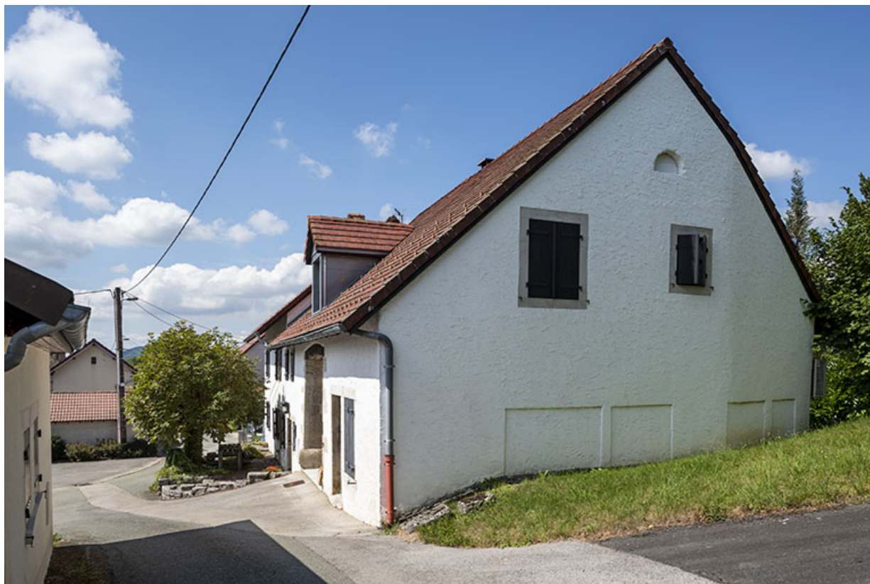
Ferme : façade latérale droite, montrant les fenêtres de l'ancienne forge (bouchées). 25, Montécheroux, 13-15 rue de la Pommeraie