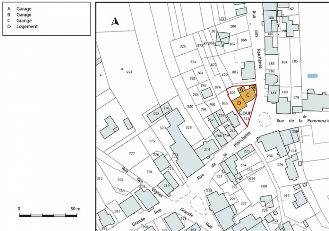
Plan-masse et de situation. Extrait du plan cadastral, 2019, section D. 25, Montécheroux, 1 rue des Raichênes