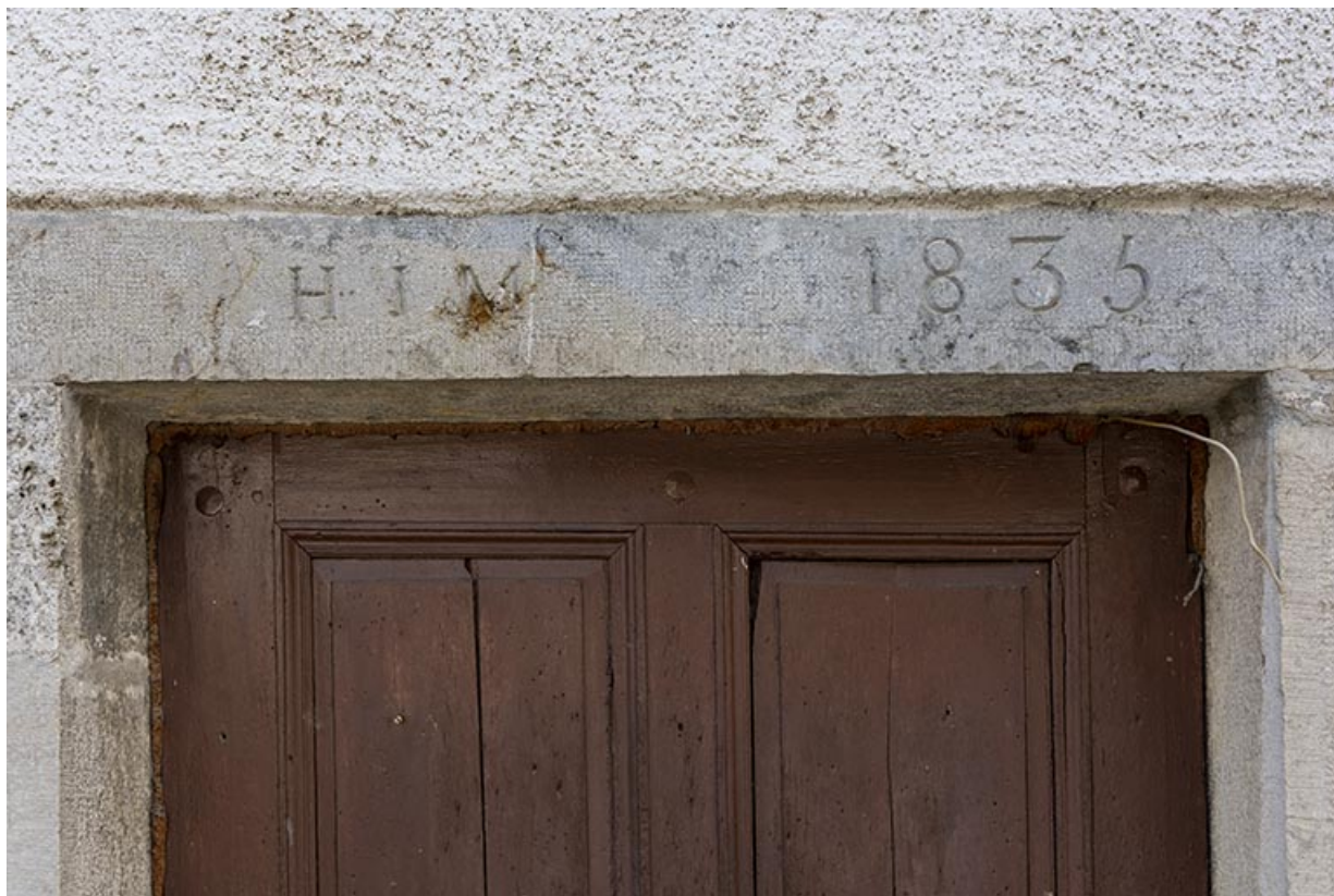
Cave d'affinage : linteau daté 1835, avec initiales.