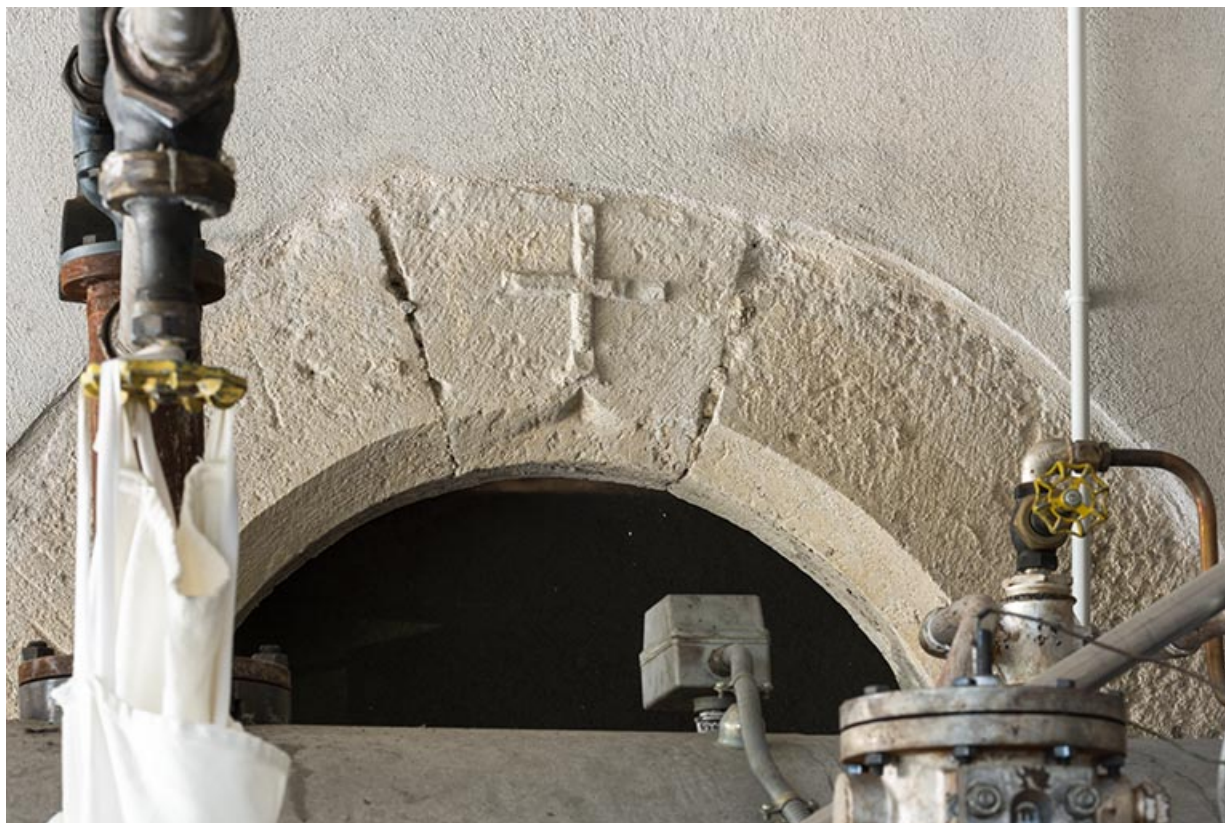
Ancienne maison : porte en plein cintre ornée d'une croix (au rez-de-chaussée). 25, Valoreille, 2 rue de l' Eglise