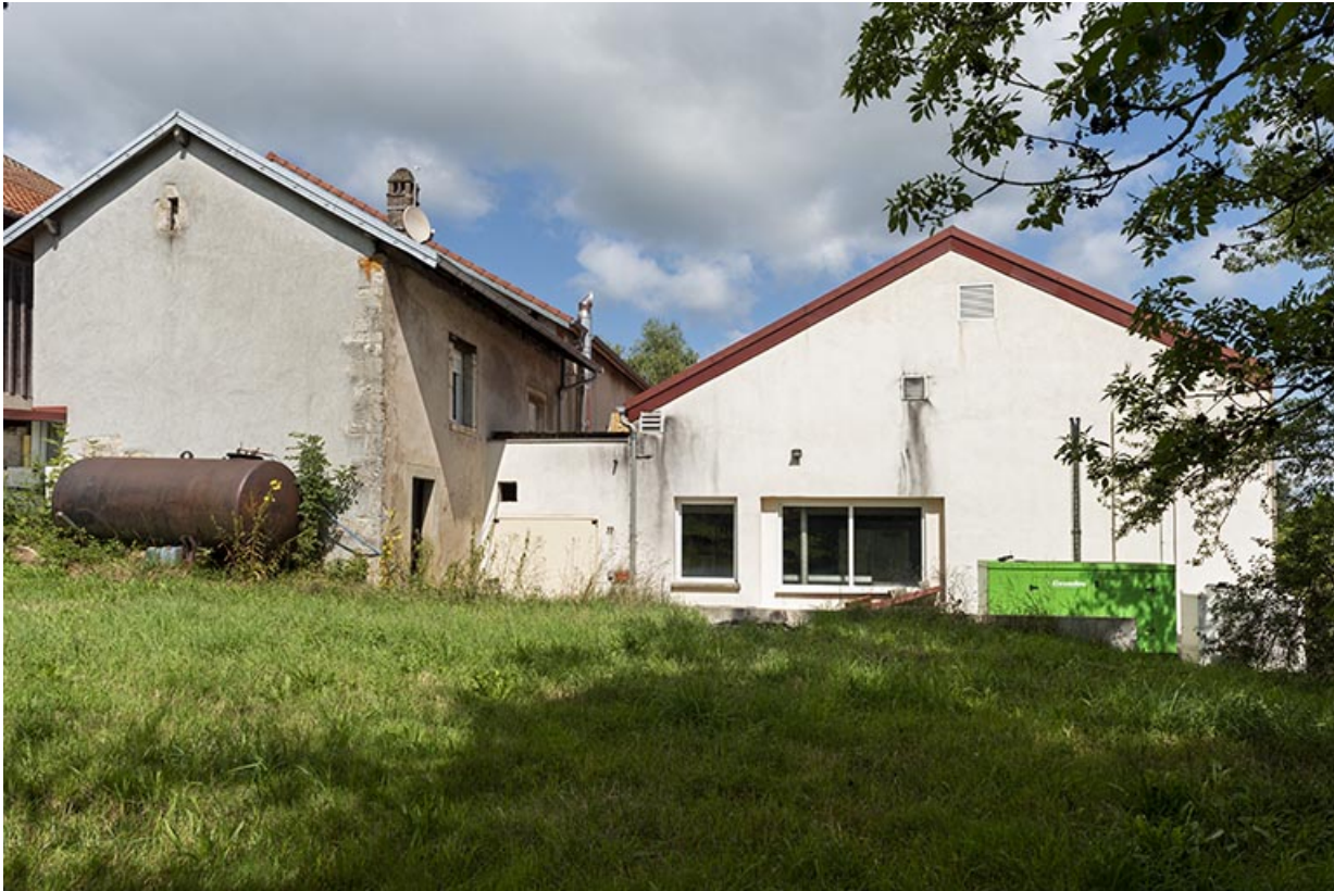
Ancienne maison, chaufferie et atelier de 2012 : façade postérieure, de trois quarts droite.