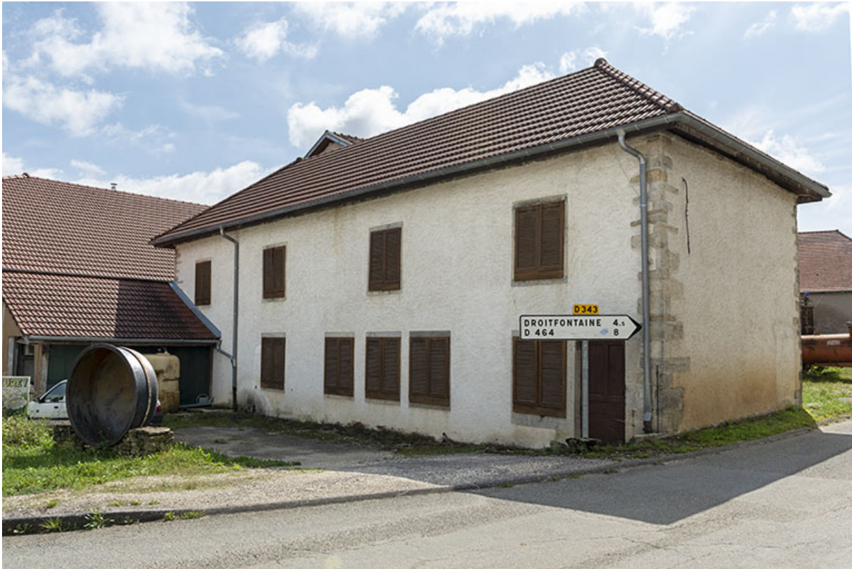
Cave d'affinage (ancienne école).