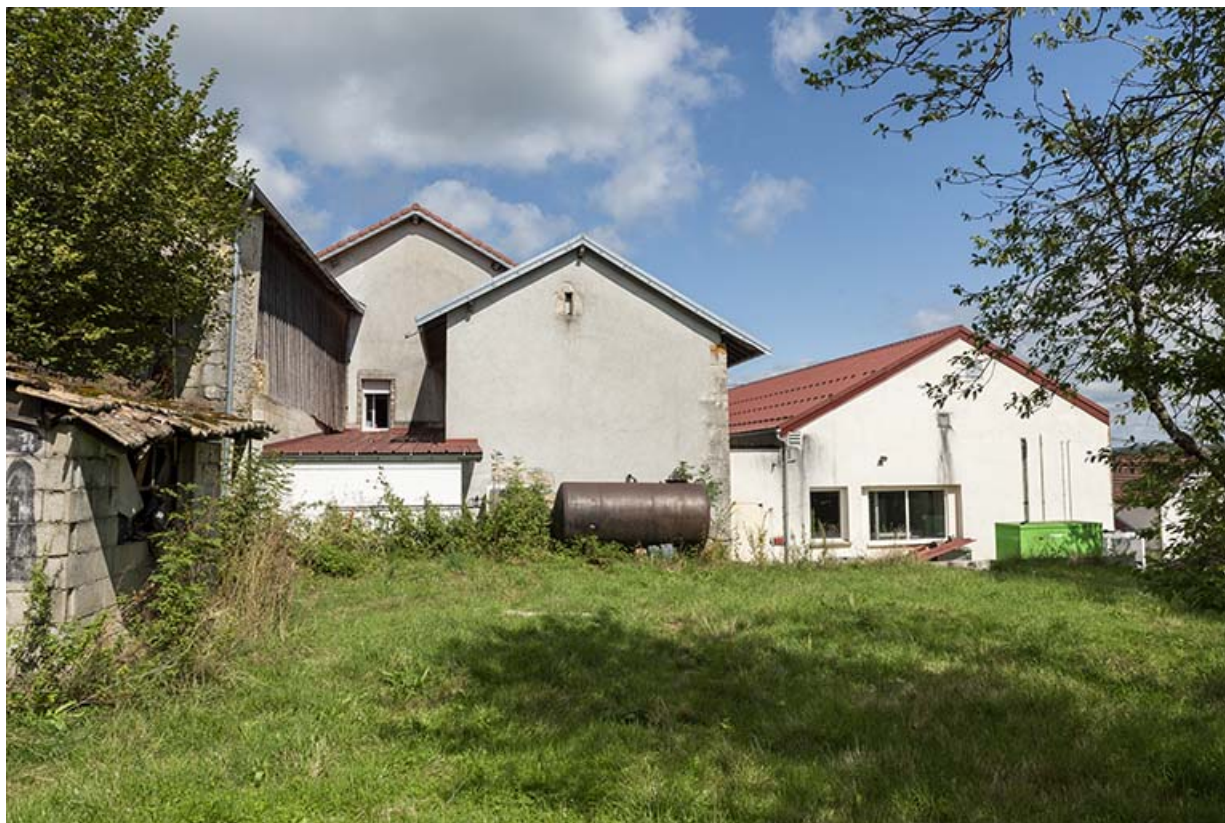
Ancienne maison, chaufferie et atelier de 2012 : façade postérieure.