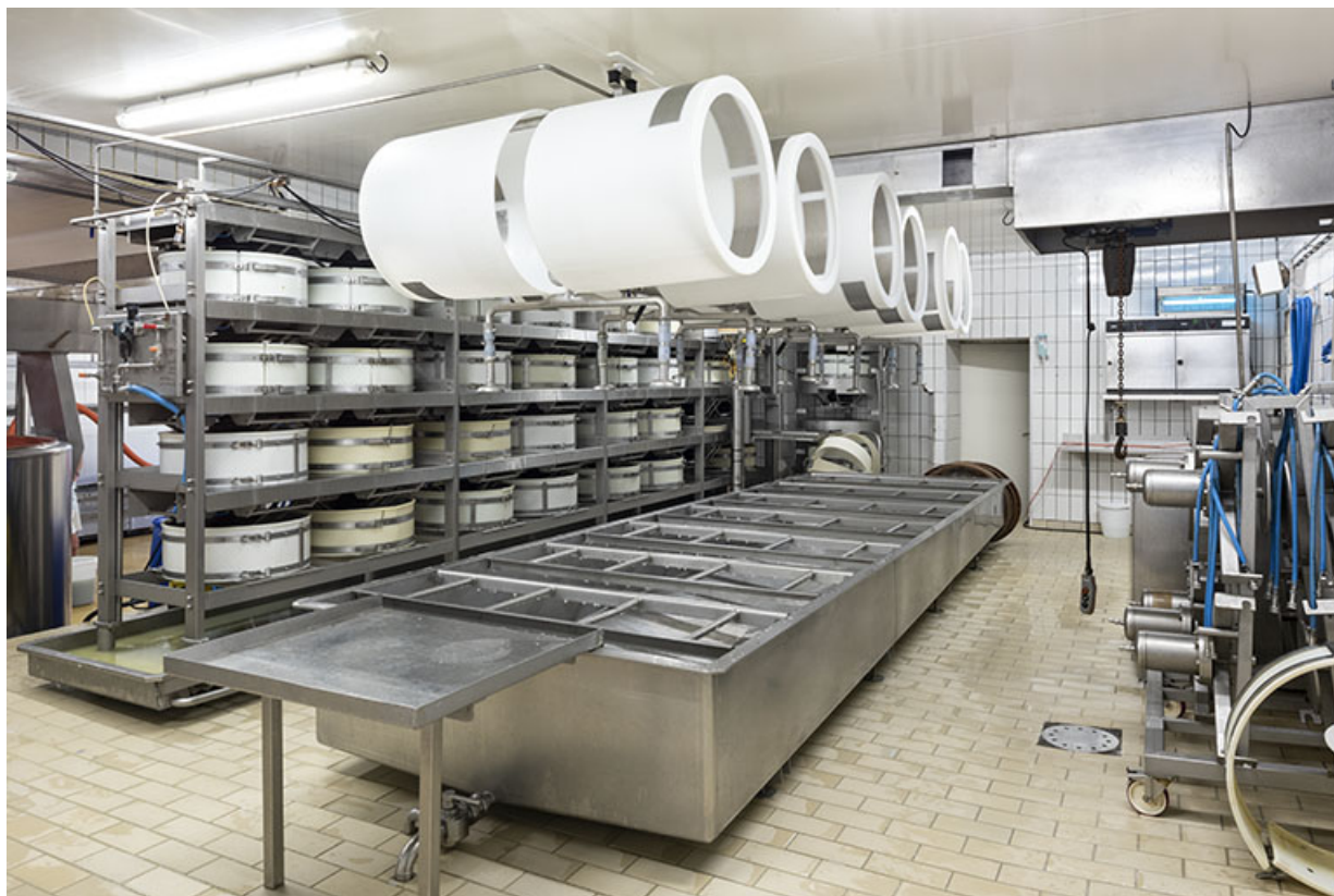
Intérieur de l'atelier de fabrication, avec l'installation de pressage à gauche. 25, Valoreille, 2 rue de l' Eglise