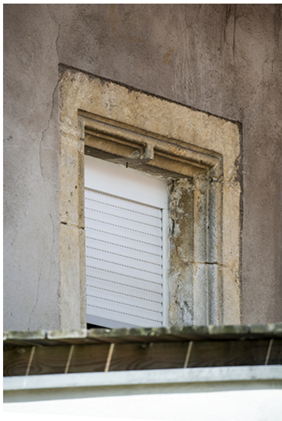
Ancienne maison : fenêtre à meneau (à l'étage). 25, Valoreille, 2 rue de l' Eglise