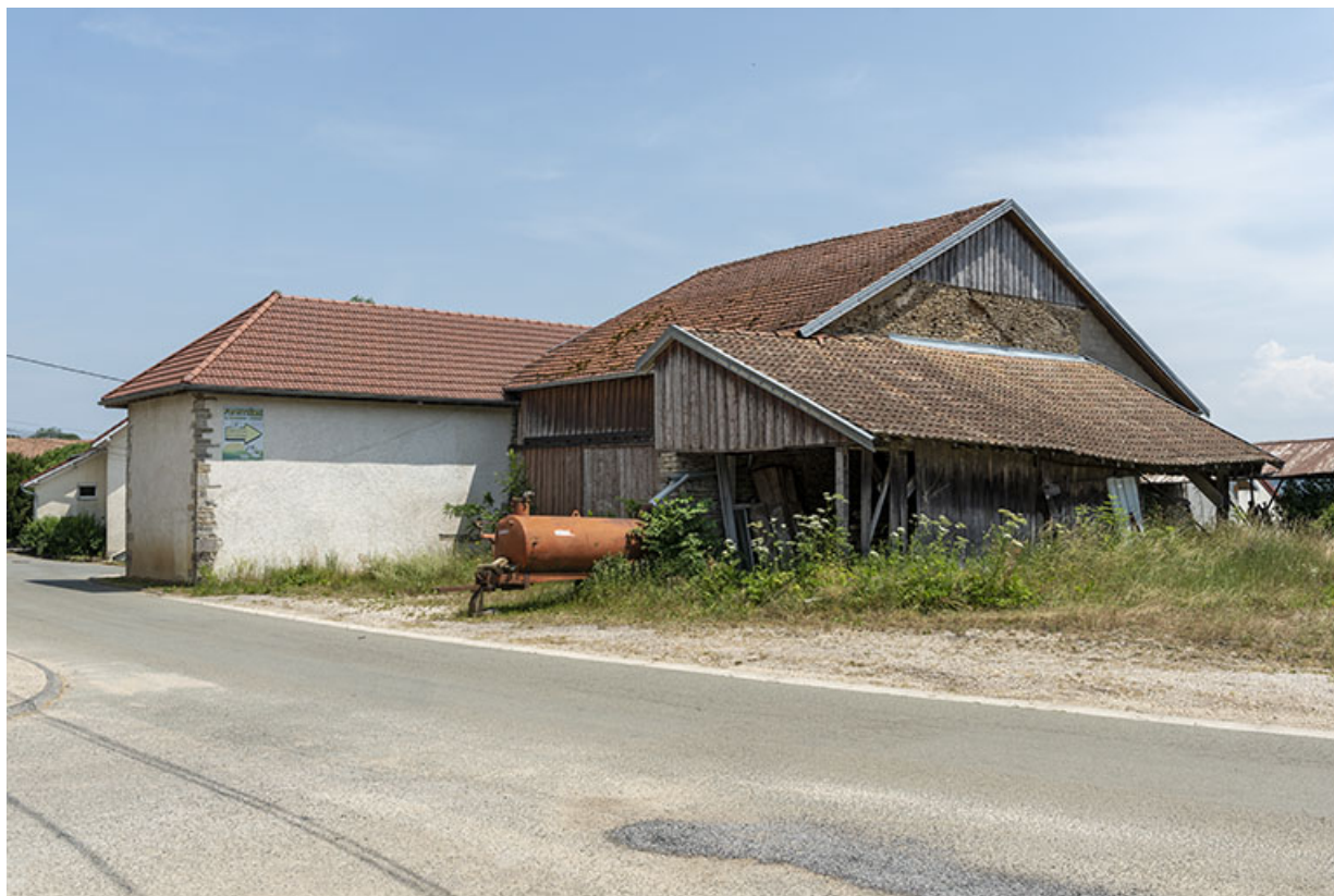
Cave d'affinage (façade postérieure), grange et hangar.