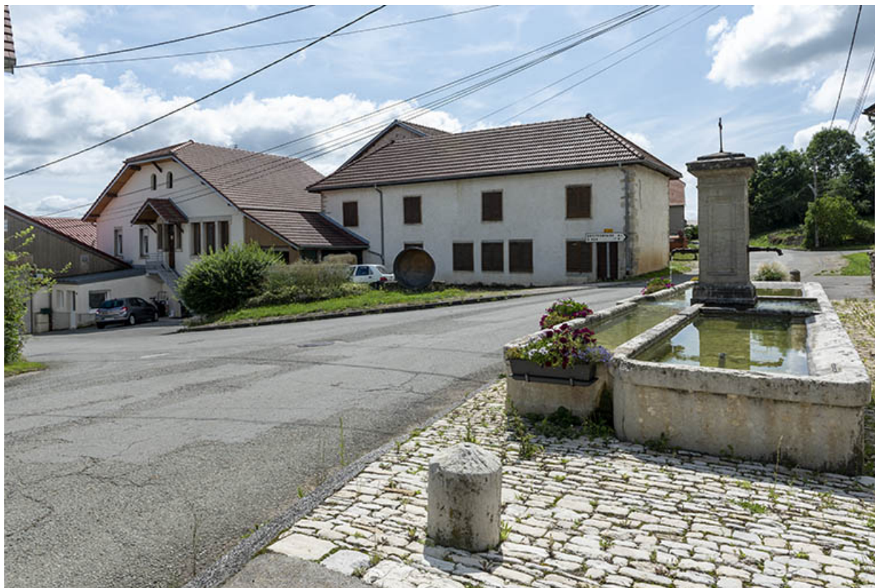
Vue d'ensemble, depuis le nord.