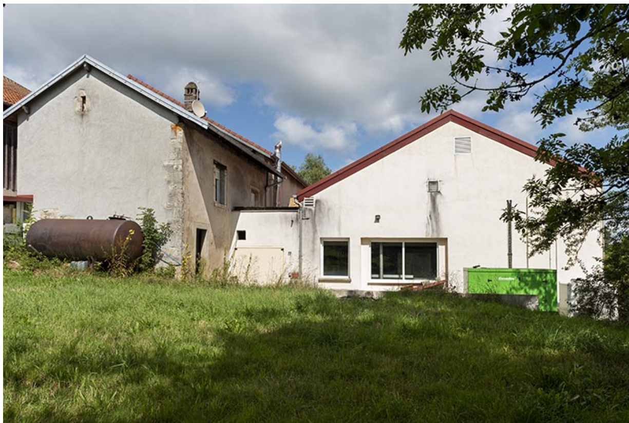
Ancienne maison, chaufferie et atelier de 2012 : façade postérieure, de trois quarts droite. 25, Valoreille, 2 rue de l' Eglise