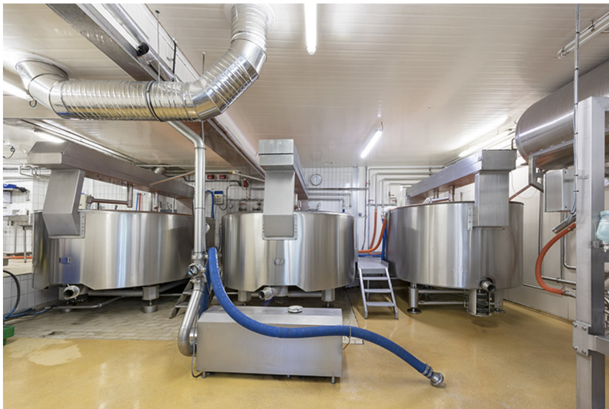
Intérieur de l'atelier de fabrication : les cuves.