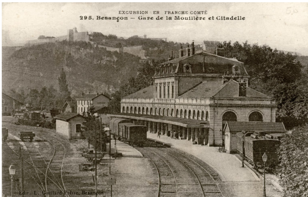
Vue ancienne, façade côté quais. 25, Besançon