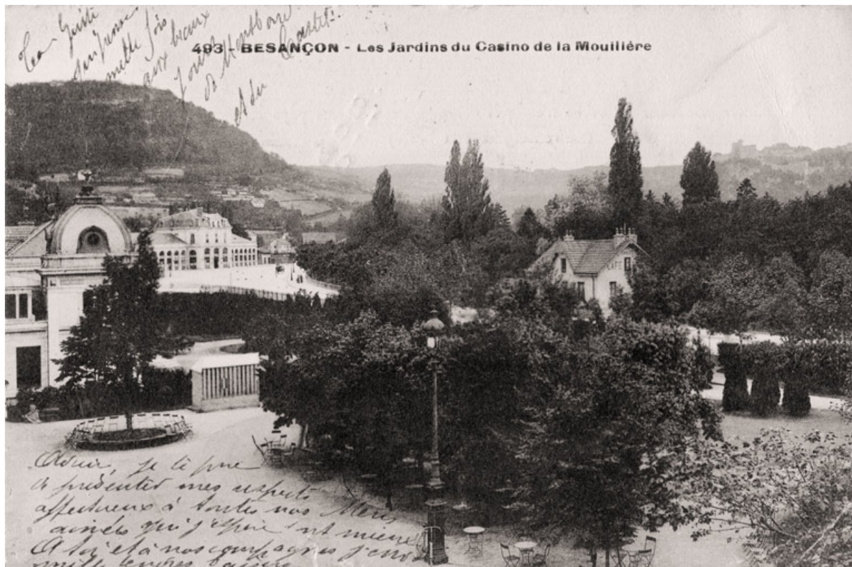
Vue ancienne, depuis le casino.