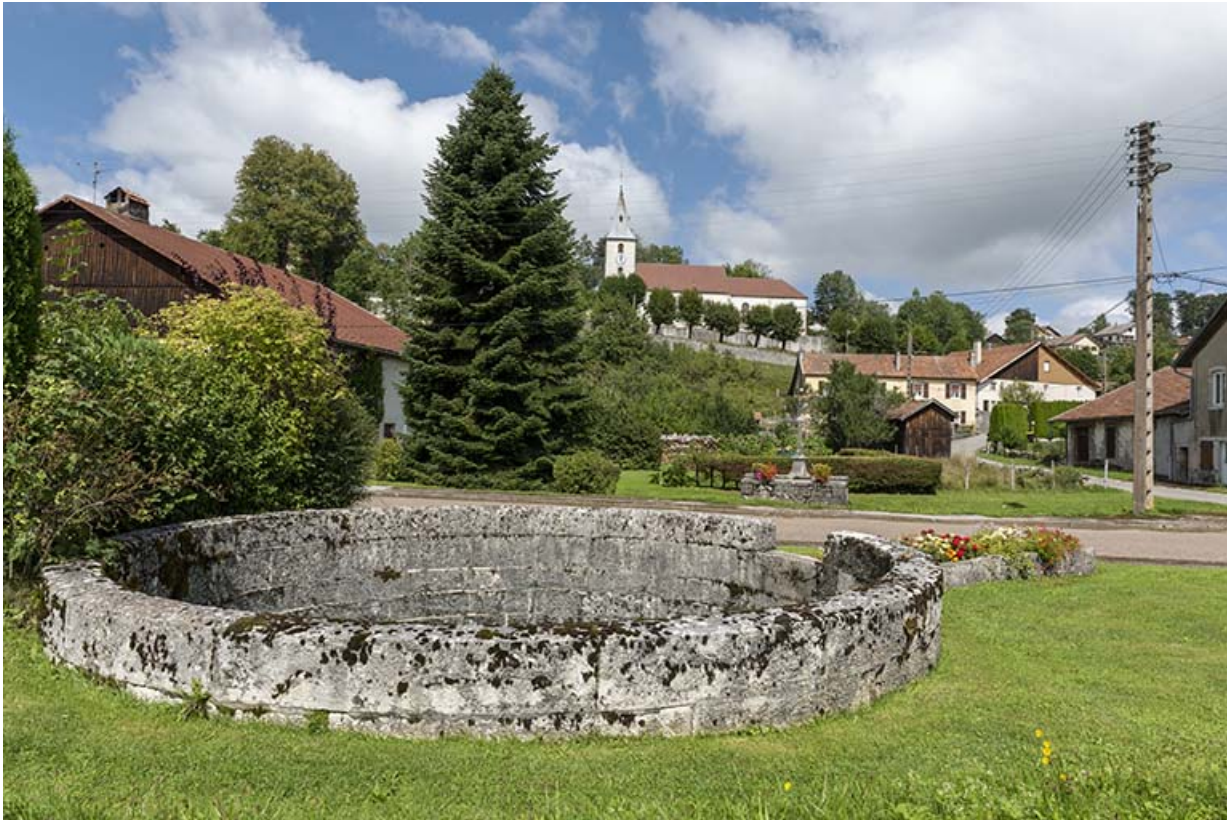
Fontaine du type de celle ayant alimenté la fromagerie.