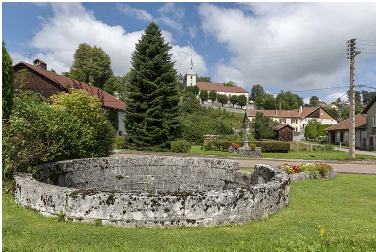
Fontaine du type de celle ayant alimenté la fromagerie.