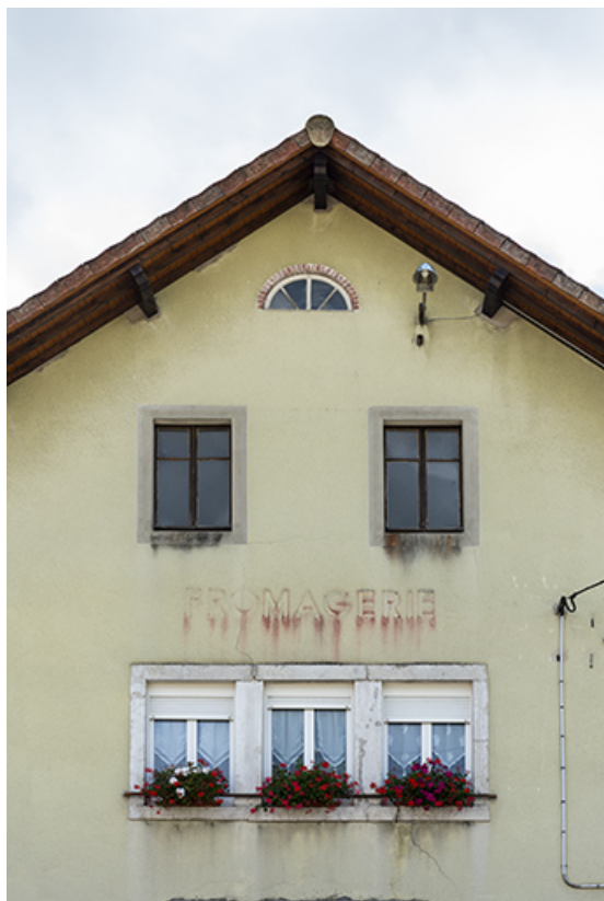
Façade antérieure : travées centrales.