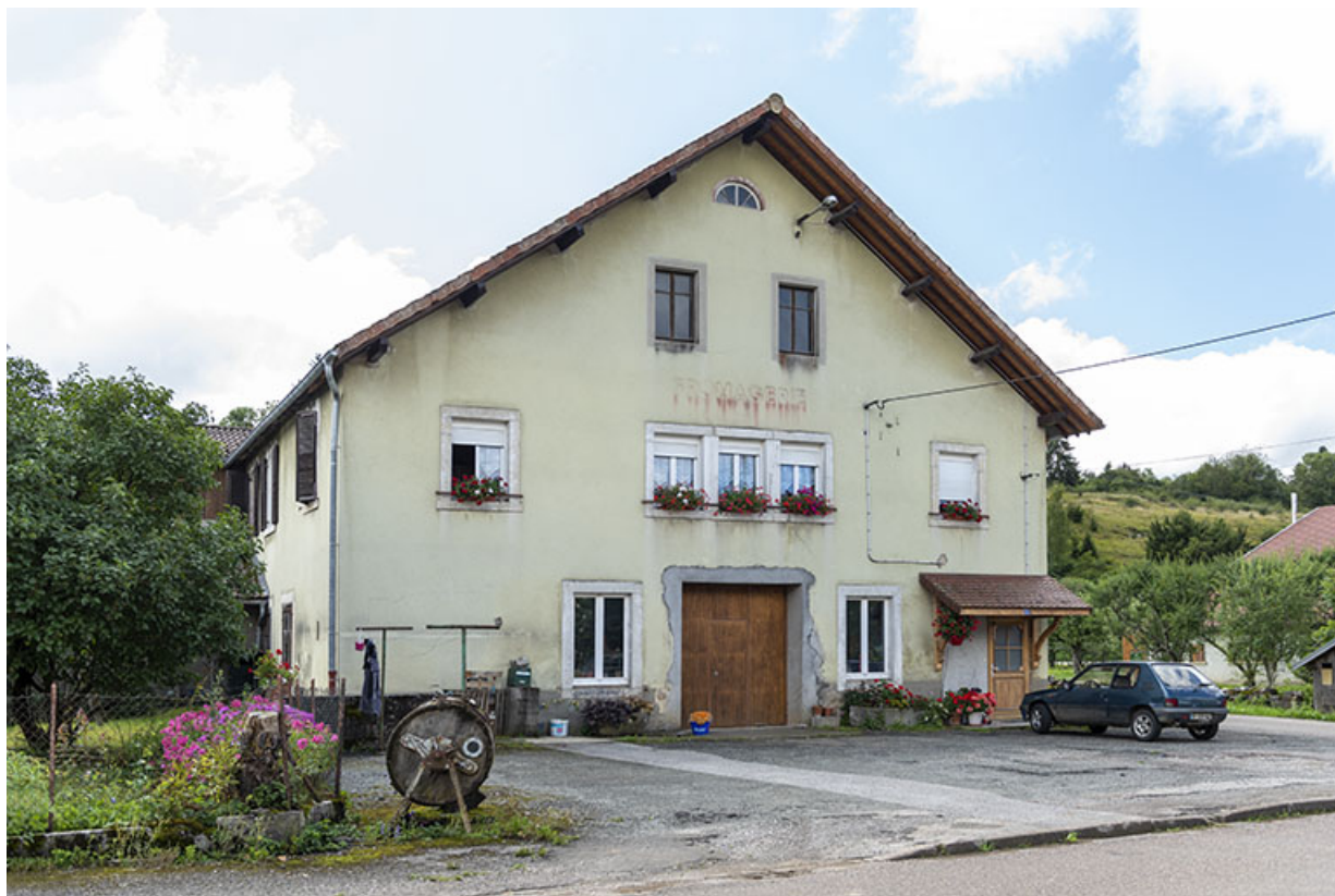
Façade antérieure, de trois quarts gauche.