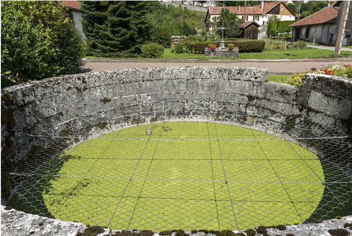
Fontaine du type de celle ayant alimenté la fromagerie : le bassin.