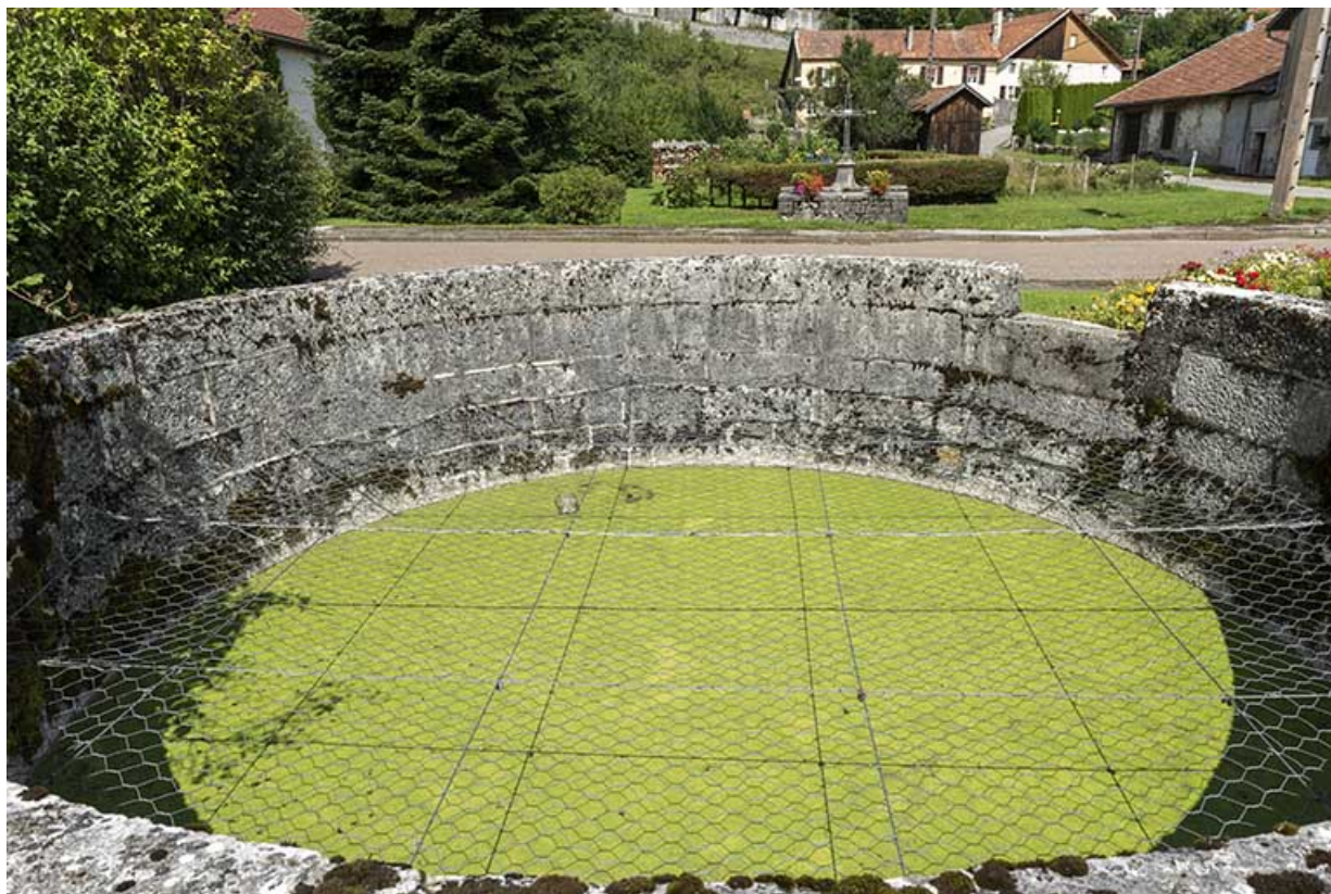
Fontaine du type de celle ayant alimenté la fromagerie : le bassin.