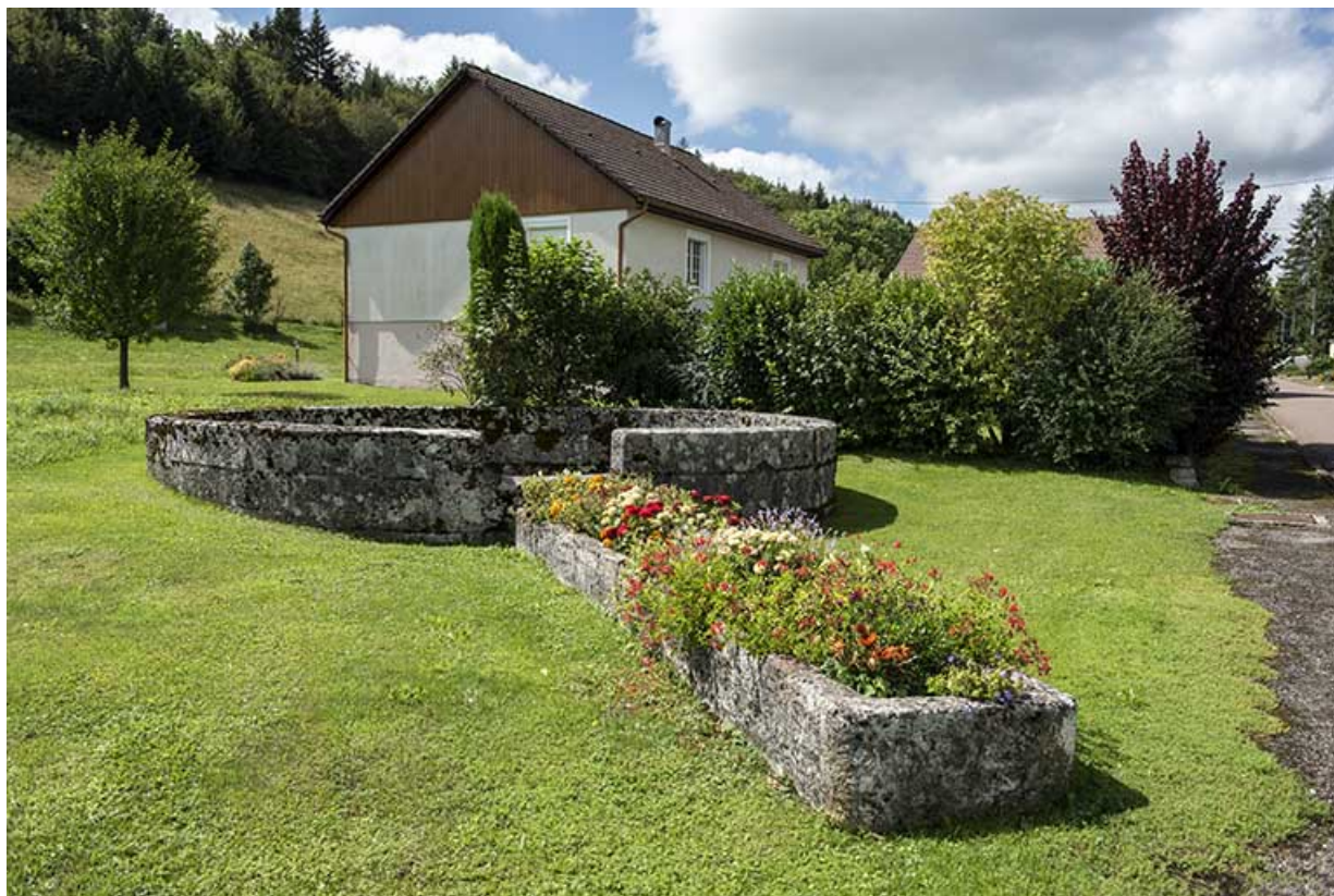
Fontaine du type de celle ayant alimenté la fromagerie.