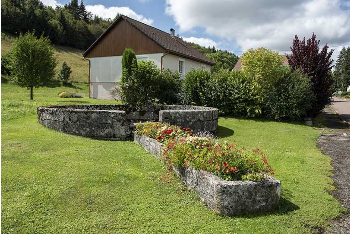
Fontaine du type de celle ayant alimenté la fromagerie.