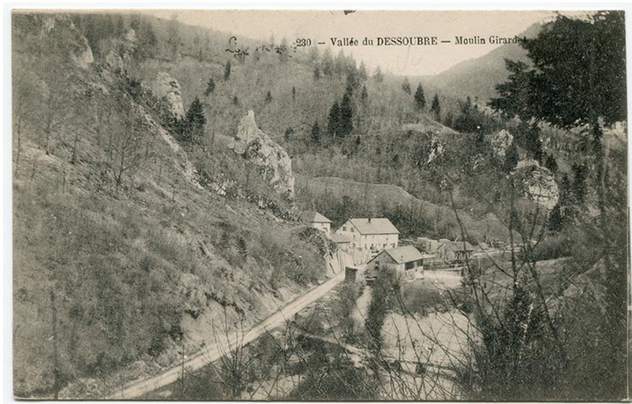
230 - Vallée du Dessoubre - Moulin Girardot, limite 19e siècle 20e siècle.

25, Plaimbois-du-Miroir, lieudit : le Moulin Girardot