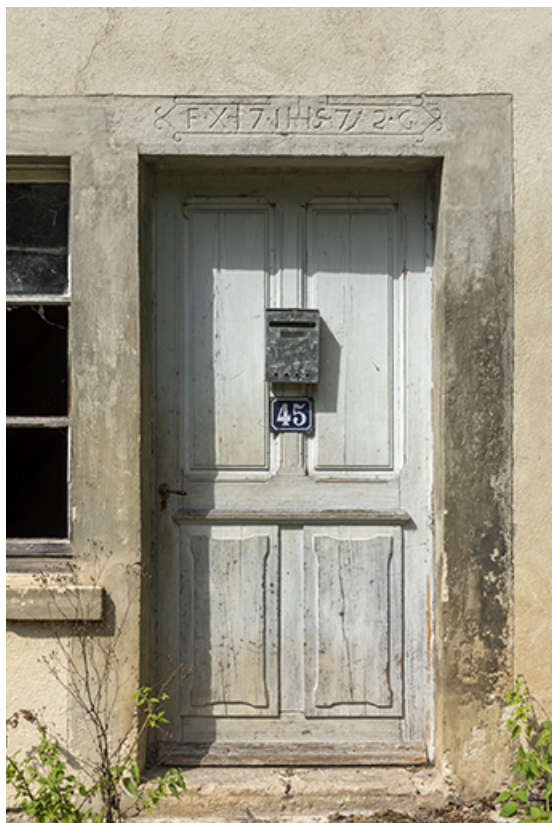
Porte avec linteau daté 1772.

25, Plaimbois-du-Miroir, lieudit : le Moulin Girardot