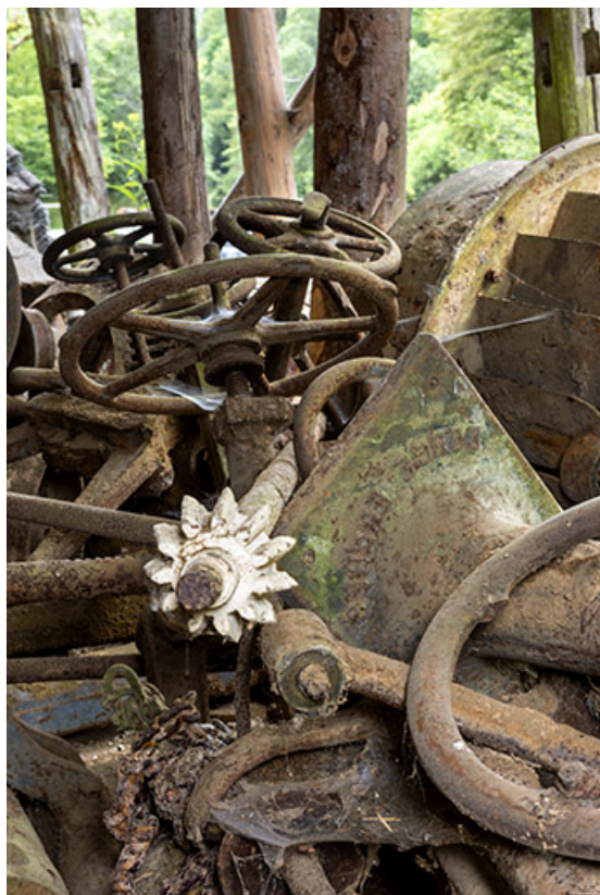
Éléments de l'installation de la scierie démontés.

25, Plaimbois-du-Miroir, lieudit : le Moulin Girardot