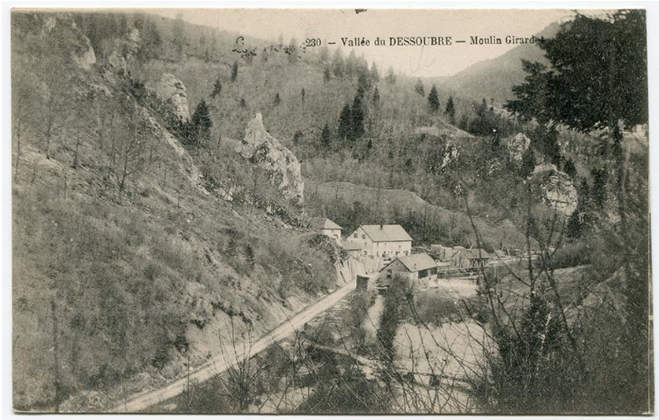
230 - Vallée du Dessoubre - Moulin Girardot, limite 19e siècle 20e siècle.

25, Plaimbois-du-Miroir, lieudit : le Moulin Girardot