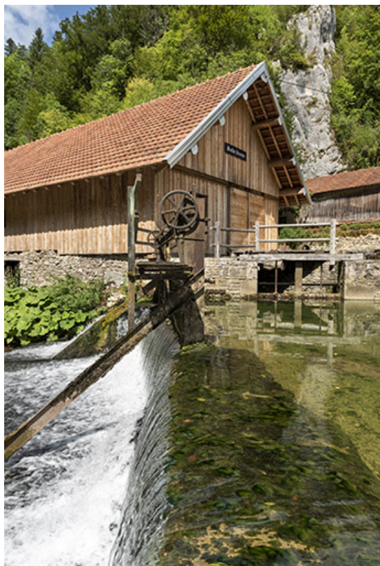
Barrage et vannes, depuis la rive gauche.

25, Plaimbois-du-Miroir, lieudit : le Moulin Girardot