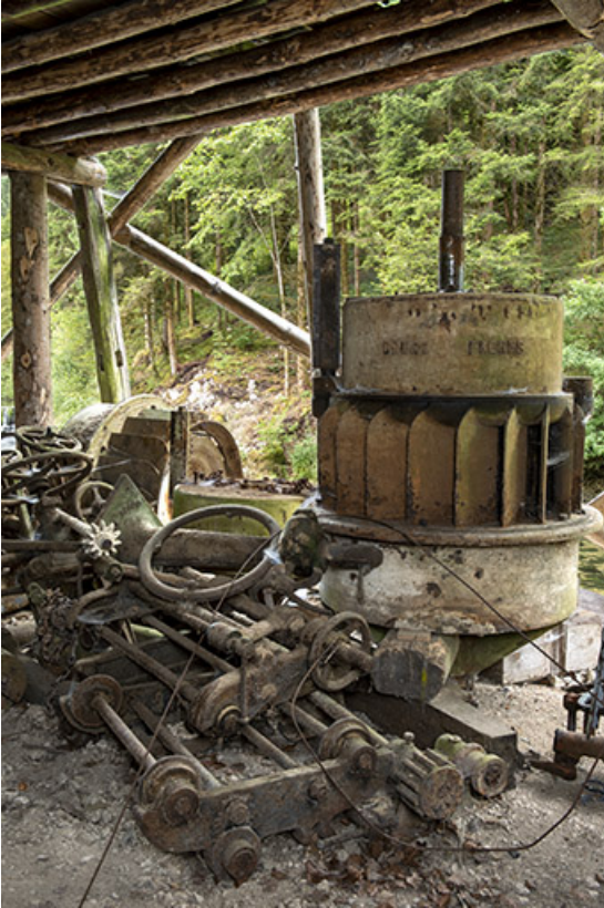
Turbine Douge et transmission démontées.

25, Plaimbois-du-Miroir, lieudit : le Moulin Girardot