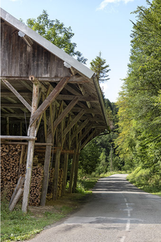
Hangar, depuis le sud.

25, Plaimbois-du-Miroir, lieudit : le Moulin Girardot