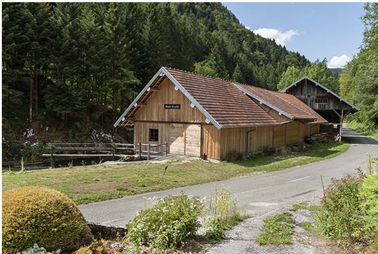
Hangar et scierie, depuis le sud-est.

25, Plaimbois-du-Miroir, lieudit : le Moulin Girardot