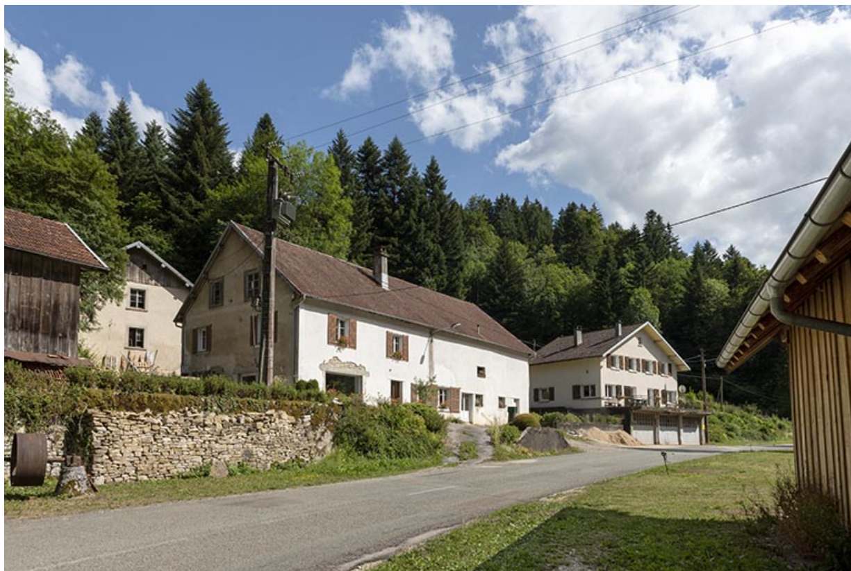
Logements, vus du nord.

25, Plaimbois-du-Miroir, lieudit : le Moulin Girardot