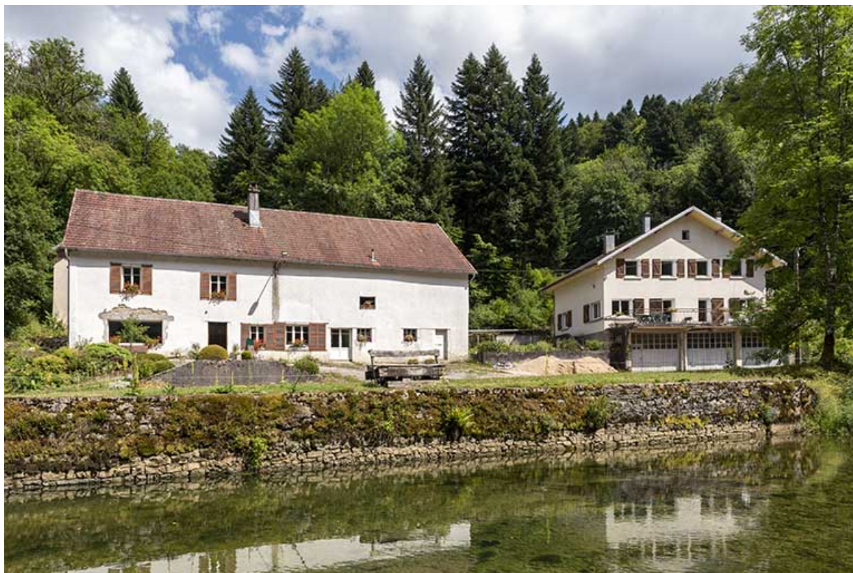
Logements, vus de l'ouest (à droite celui des années 1950).

25, Plaimbois-du-Miroir, lieudit : le Moulin Girardot