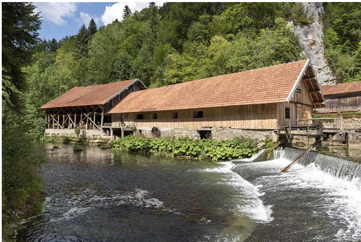
Hangar et scierie, depuis l'ouest (rive gauche).