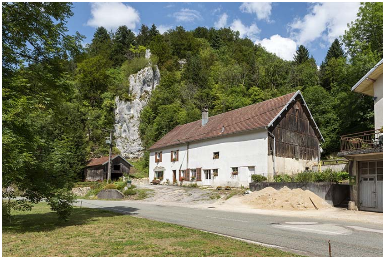
Logement (avec les anciennes grange et étable).

25, Plaimbois-du-Miroir, lieudit : le Moulin Girardot