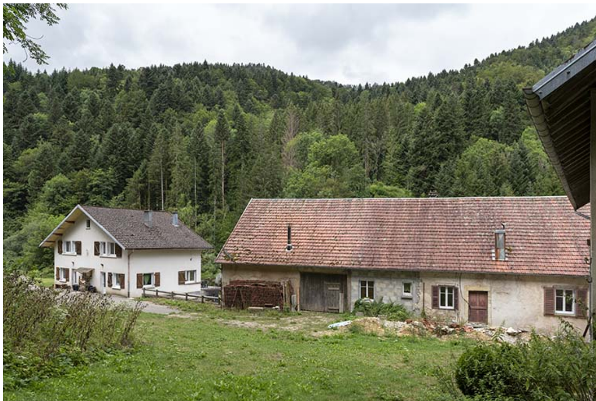
Logements, vus de l'est (à gauche celui des années 1950).

25, Plaimbois-du-Miroir, lieudit : le Moulin Girardot