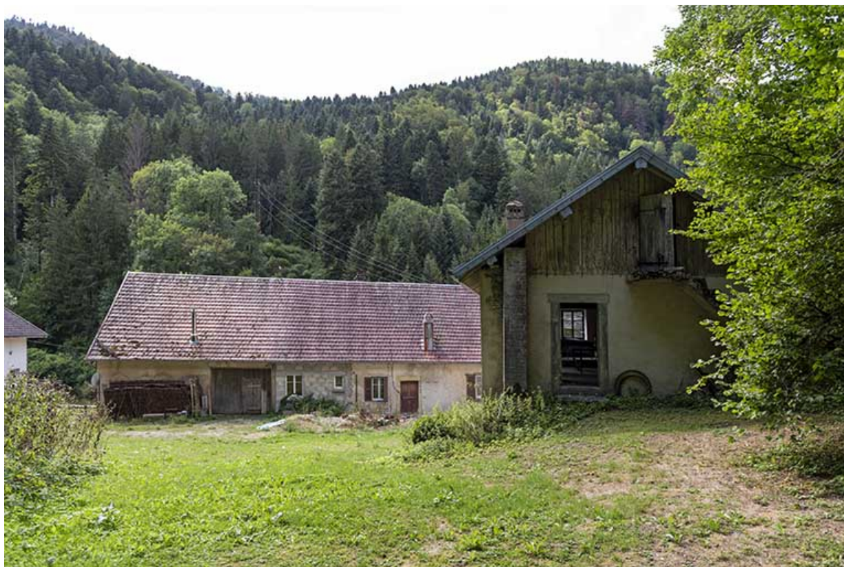
Logements, vus de l'est (à droite celui de 1772).

25, Plaimbois-du-Miroir, lieudit : le Moulin Girardot