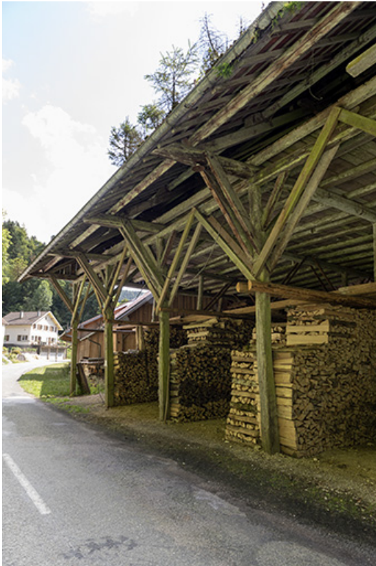
Hangar, depuis le nord.

25, Plaimbois-du-Miroir, lieudit : le Moulin Girardot