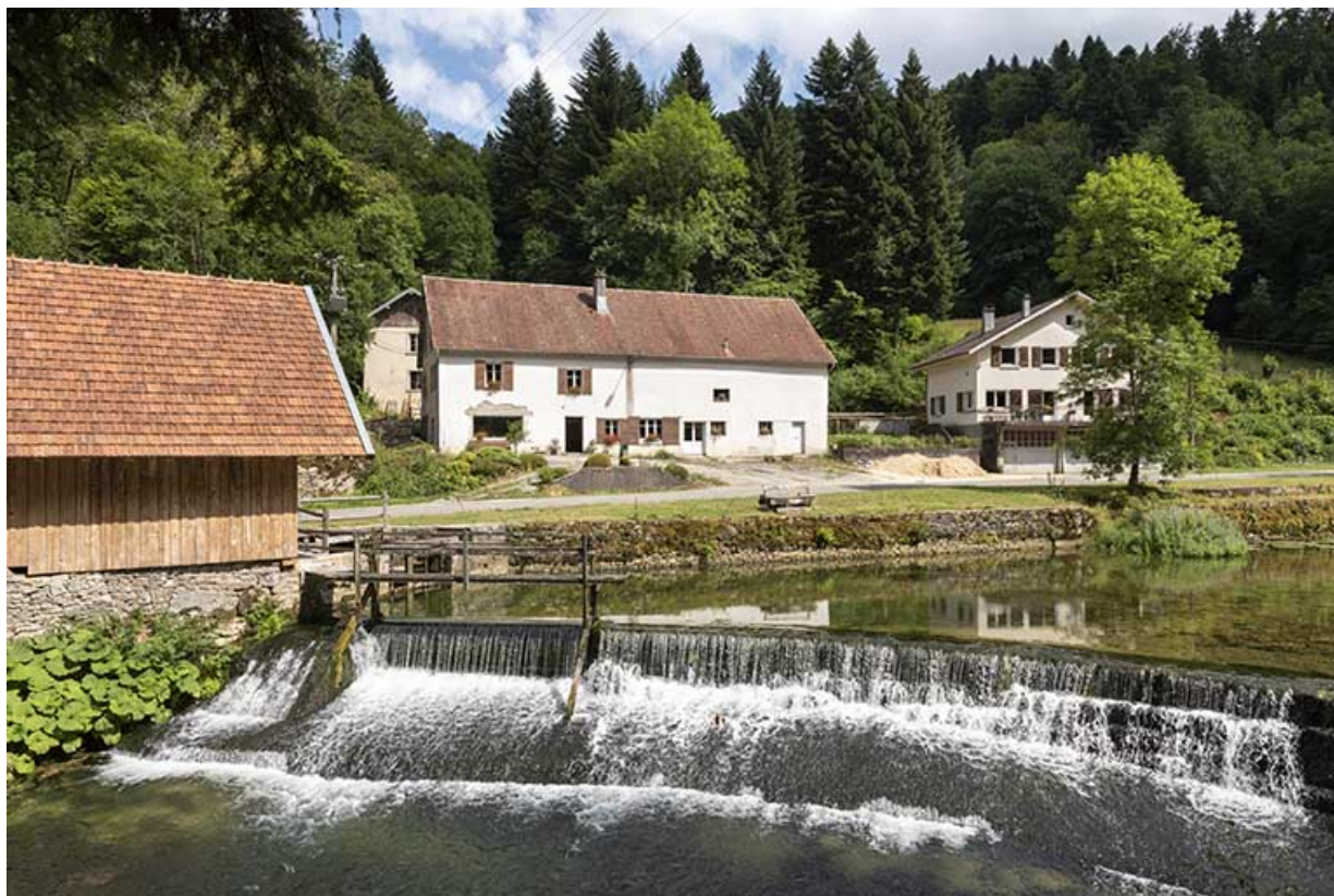
Vue d'ensemble depuis l'ouest (rive gauche). 25, Plaimbois-du-Miroir, lieudit : le Moulin Girardot