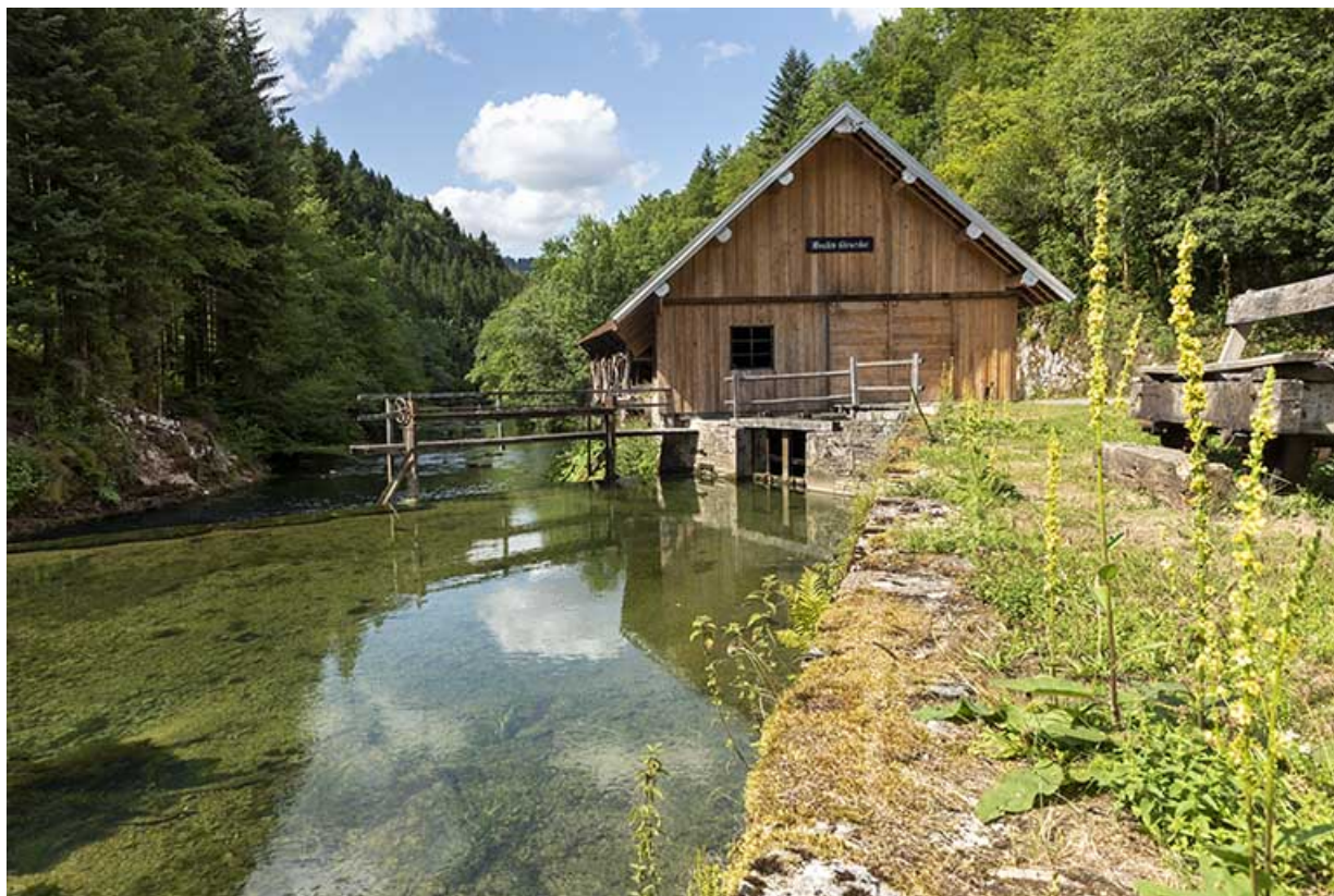
Scierie, depuis l'amont (sud) : vue rapprochée. 25, Plaimbois-du-Miroir, lieudit : le Moulin Girardot