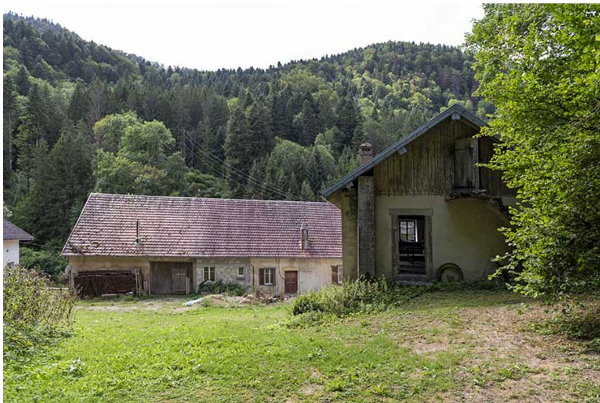
Logements, vus de l'est (à droite celui de 1772). 25, Plaimbois-du-Miroir, lieudit : le Moulin Girardot