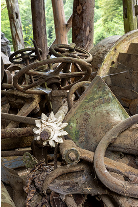
Éléments de l'installation de la scierie démontés.

25, Plaimbois-du-Miroir, lieudit : le Moulin Girardot