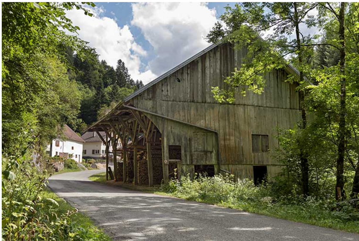
Vue d'ensemble depuis le nord, avec le hangar au premier plan.

25, Plaimbois-du-Miroir, lieudit : le Moulin Girardot