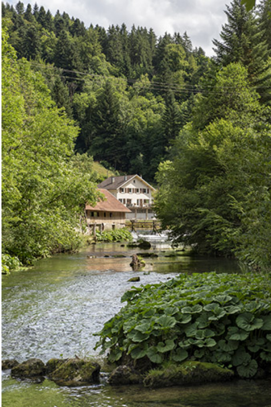
Vue d'ensemble depuis le Dessoubre, en aval. 25, Plaimbois-du-Miroir, lieudit : le Moulin Girardot