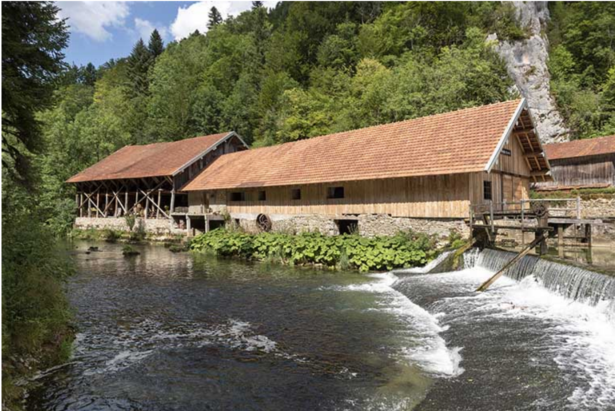
Hangar et scierie, depuis l'ouest (rive gauche).