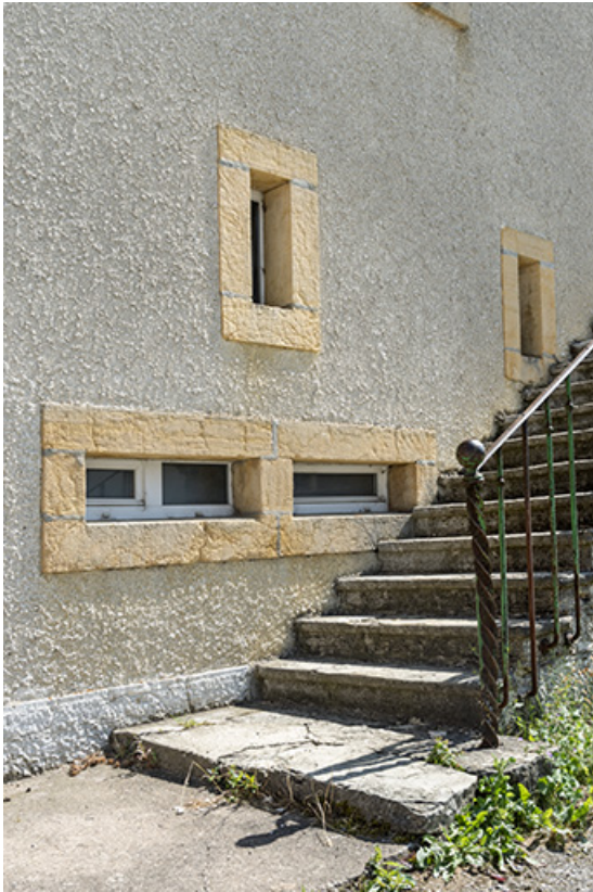
Baies fromagères horizontales sur la façade nord. 25, Noël-Cerneux, 4 rue Ignace Tournier