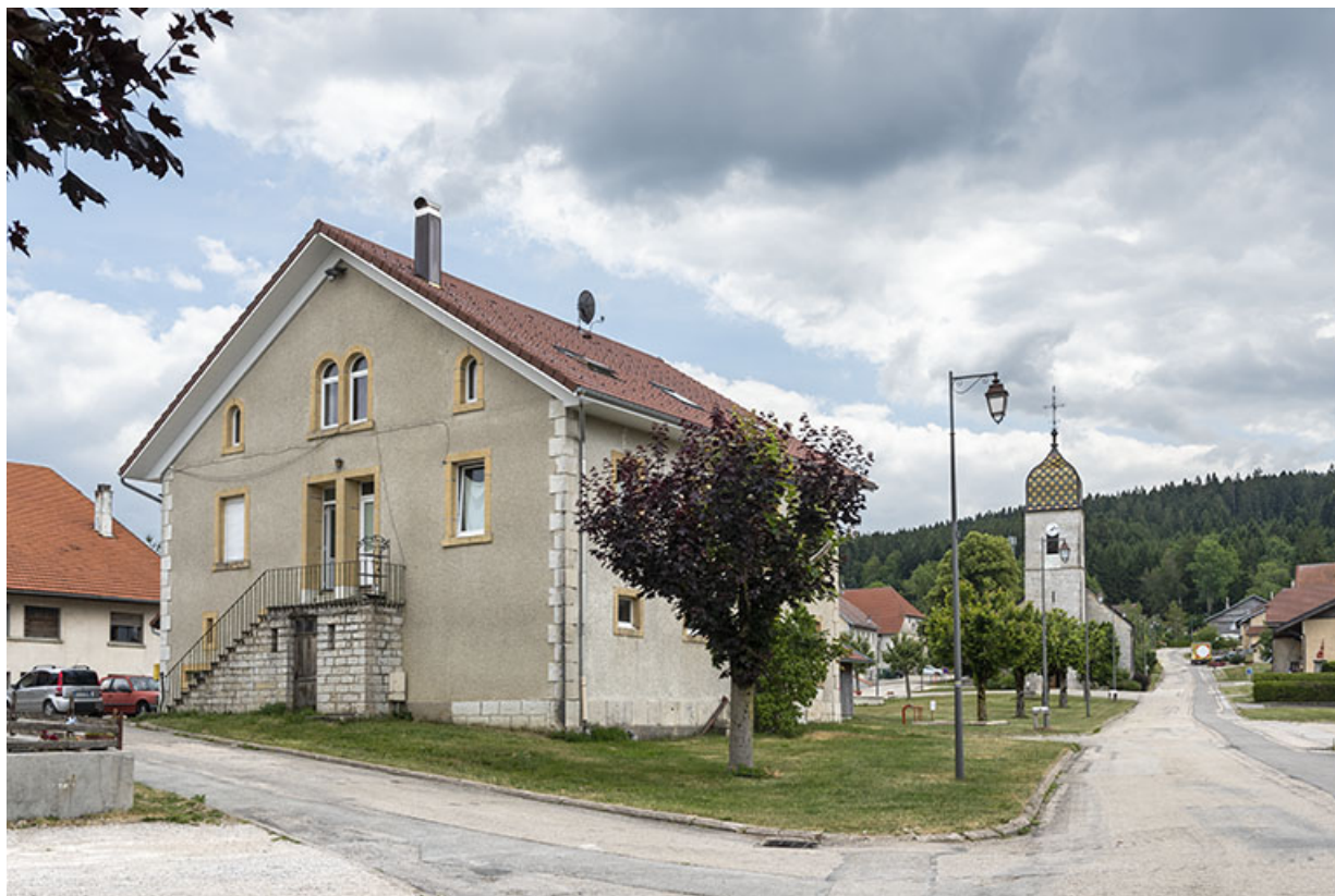
Vue d'ensemble, depuis le nord-ouest. 25, Noël-Cerneux, 4 rue Ignace Tournier