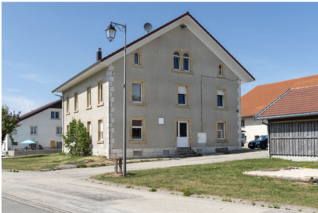
Façades sud et ouest.