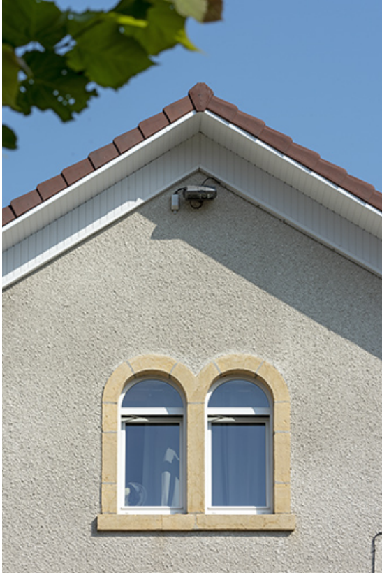
Façade sud : baie géminée dans le pignon.