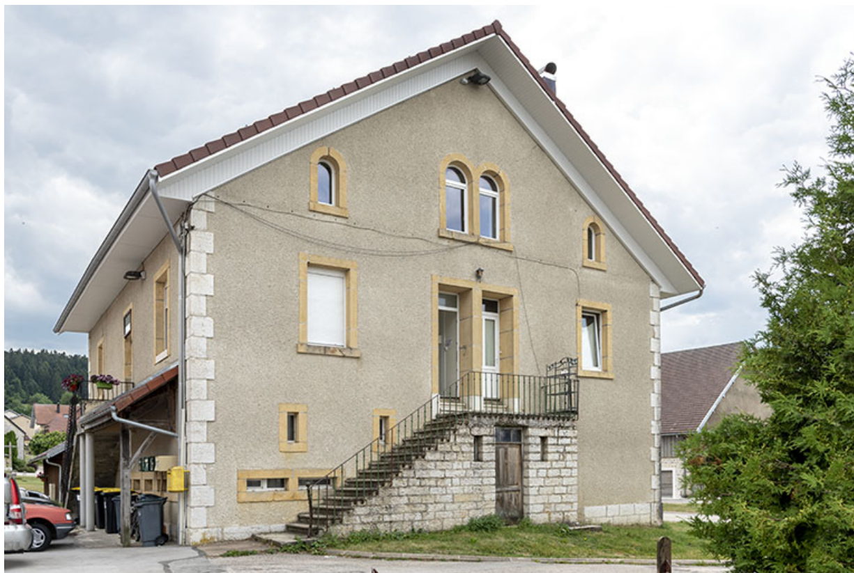
Façade nord, de trois quarts gauche.