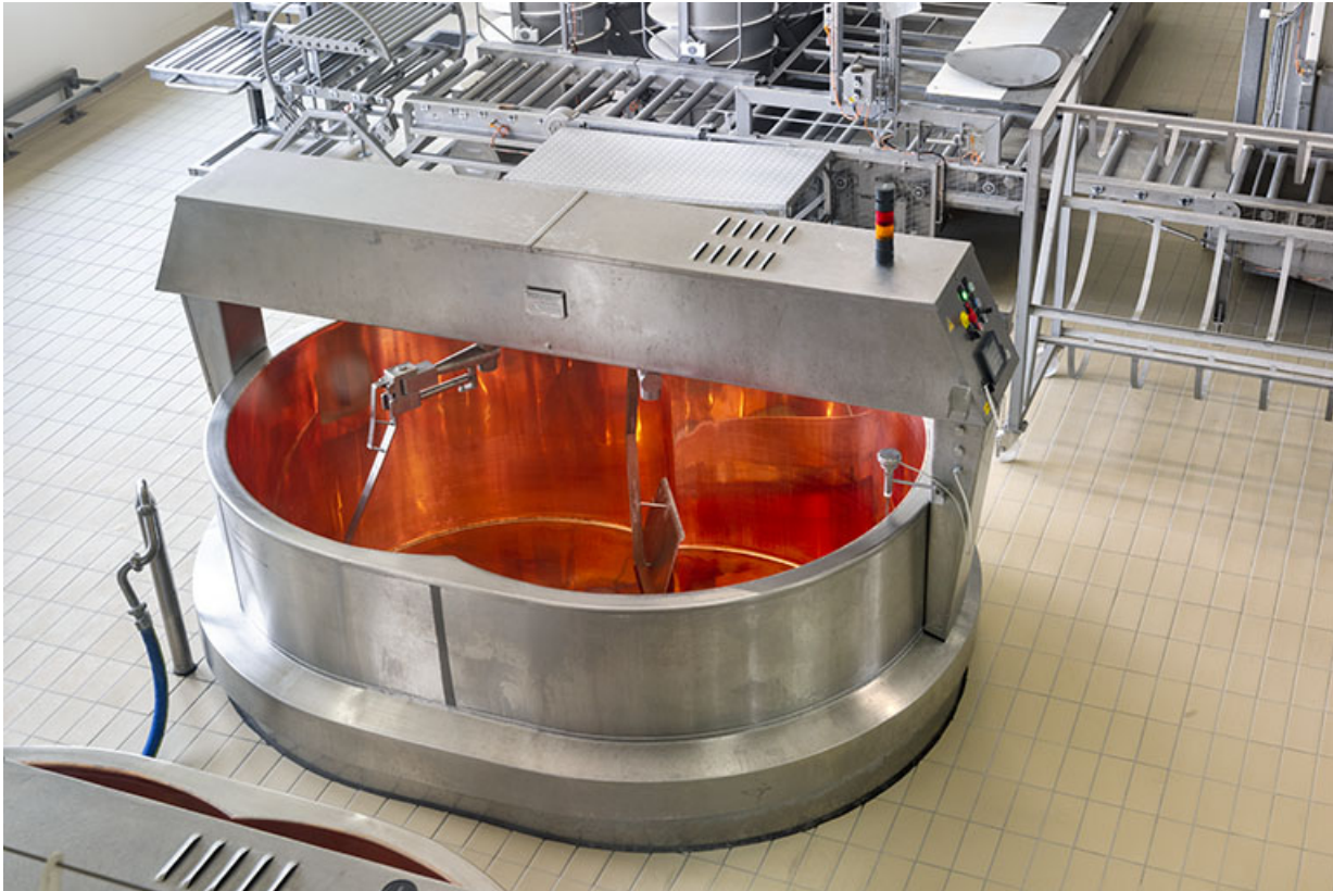
Vue plongeante sur une cuve.