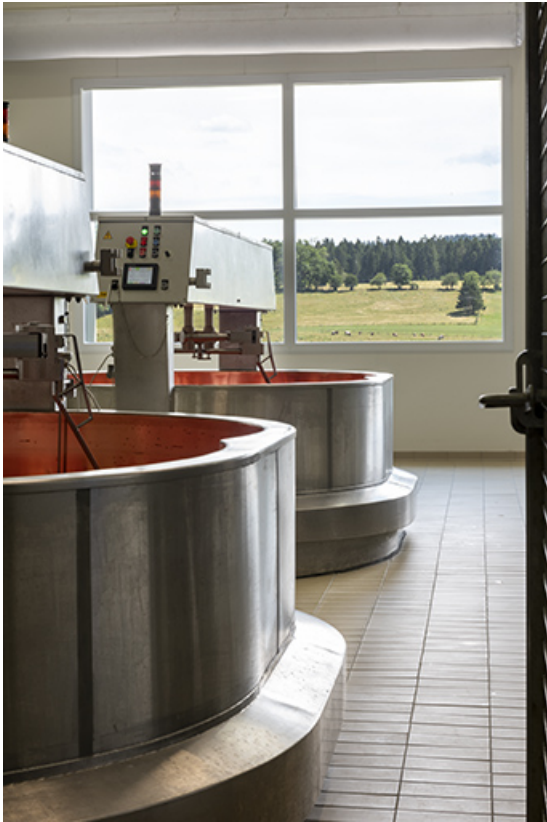
Cuves vues en enfilade.