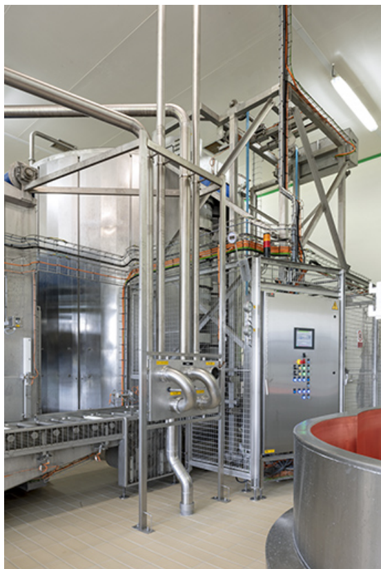
Installation de pressage (tour à l'arrière-plan).