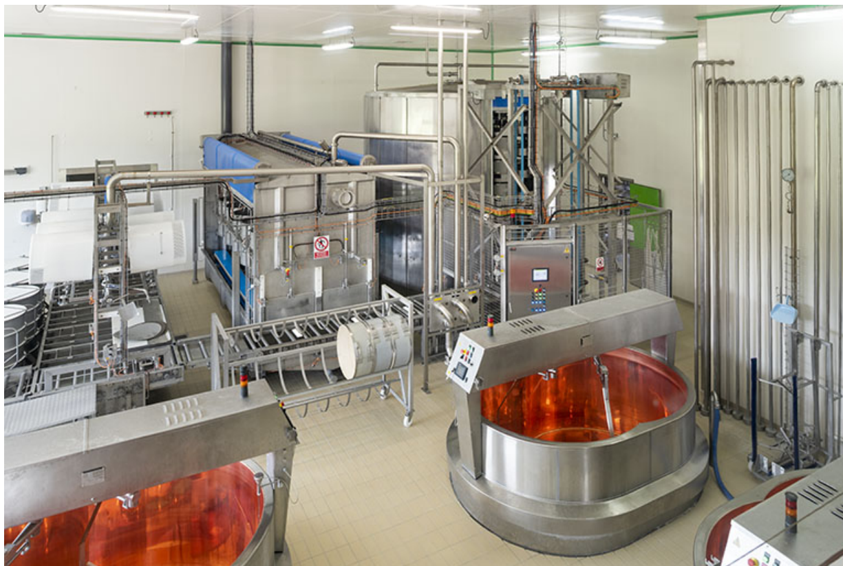
Vue plongeante sur l'atelier de fabrication (avec les installations de moulage et de pressage à l'arrière-plan). 25, Narbief, 15 rue de la Fruitière