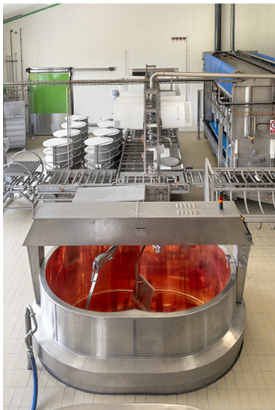
Vue plongeante sur une cuve.