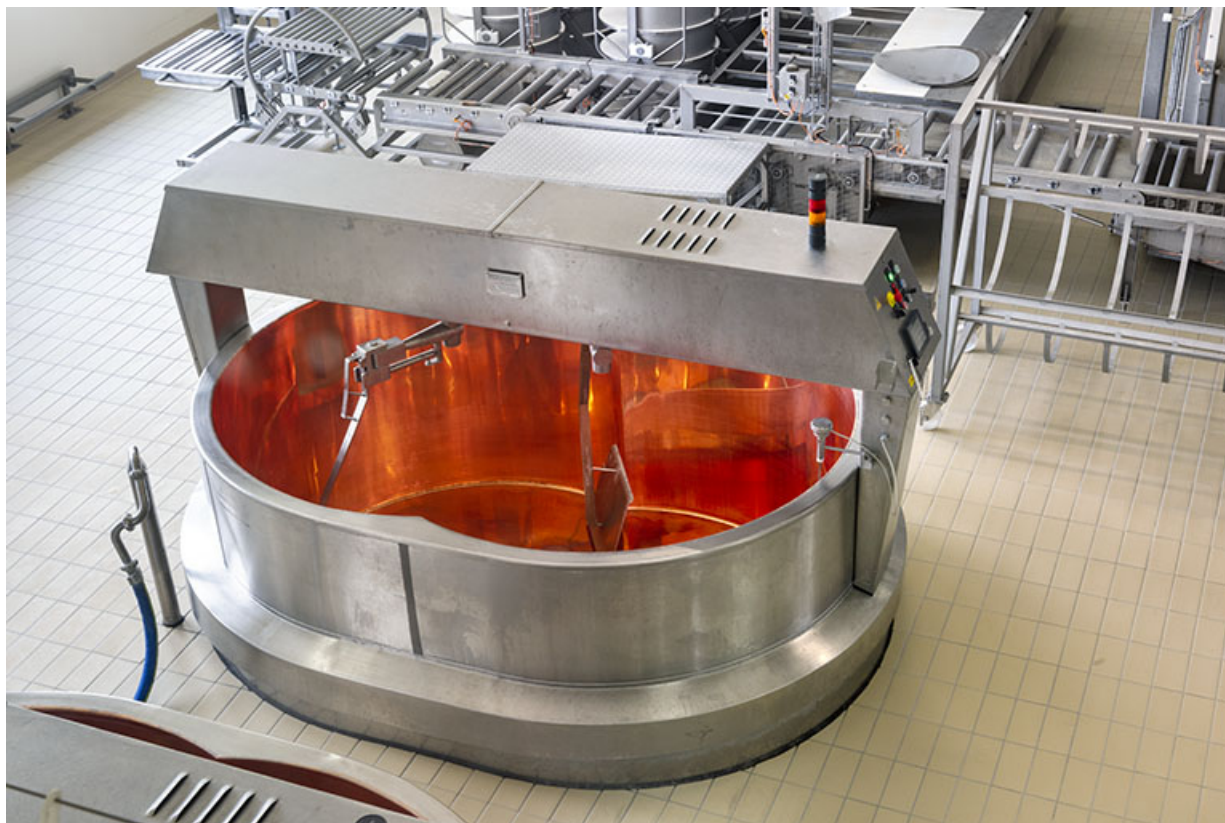
Vue plongeante sur une cuve.