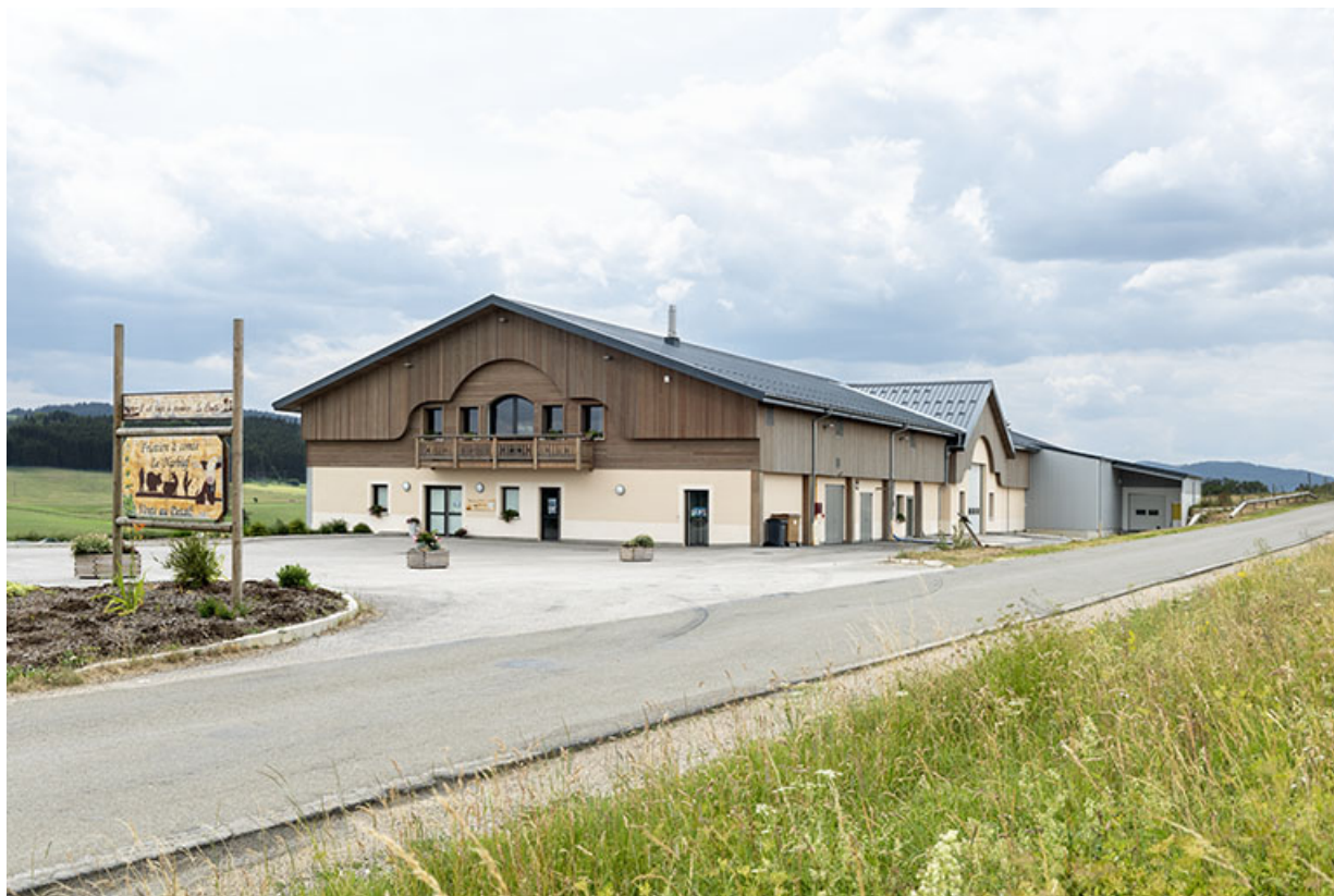
Fromagerie de Narbief-Le Bizot. 25, Narbief, 15 rue de la Fruitière