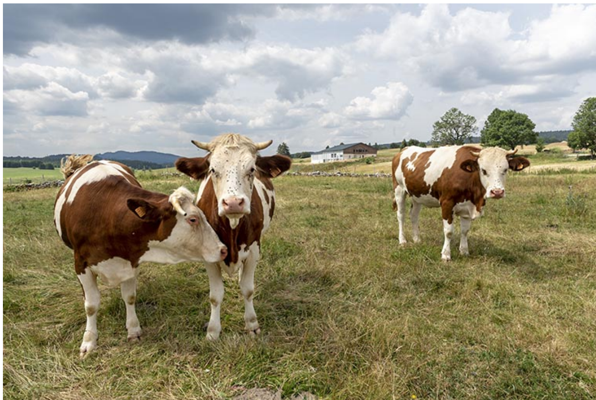
Vue d'ensemble éloignée, avec vaches au premier plan.