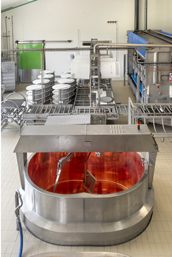
Vue plongeante sur une cuve.