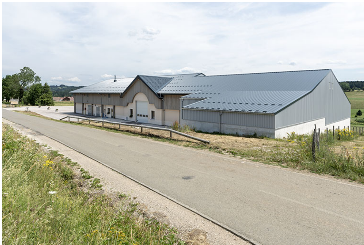
Façades postérieure et latérale droite.