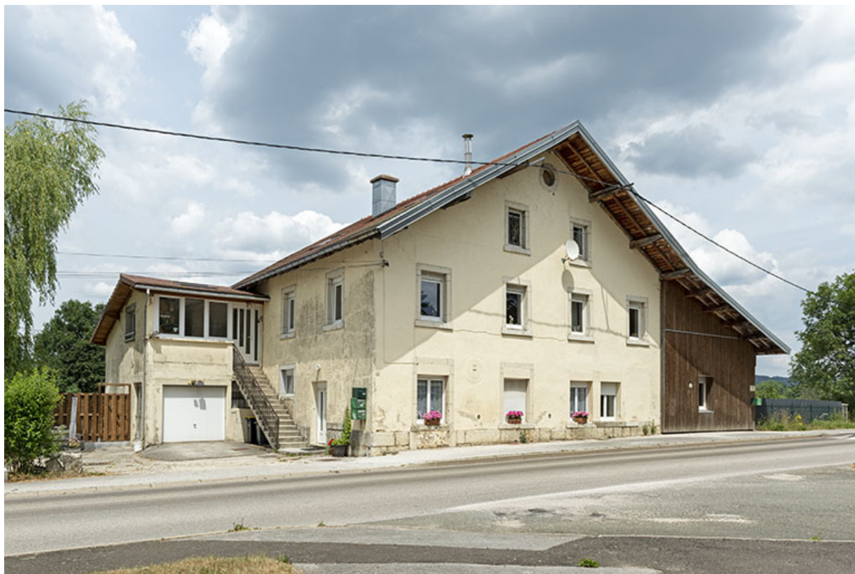
Façade antérieure, de trois quarts gauche.