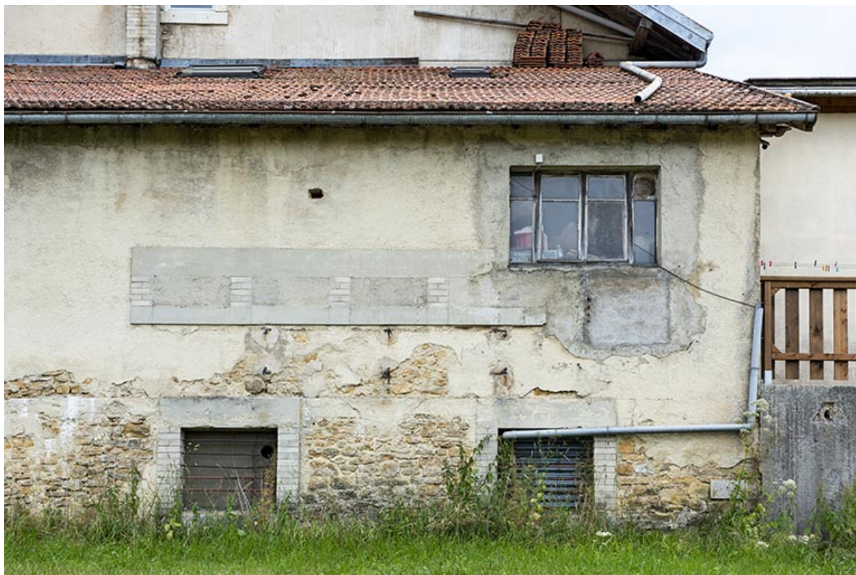
Pièce d'affinage : anciennes baies fromagères horizontales.