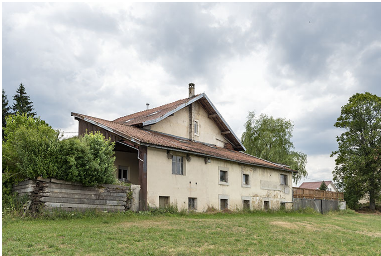
Pièce d'affinage sur la façade postérieure, de trois quarts gauche. 25, Le Luhier, 27 Grande Rue