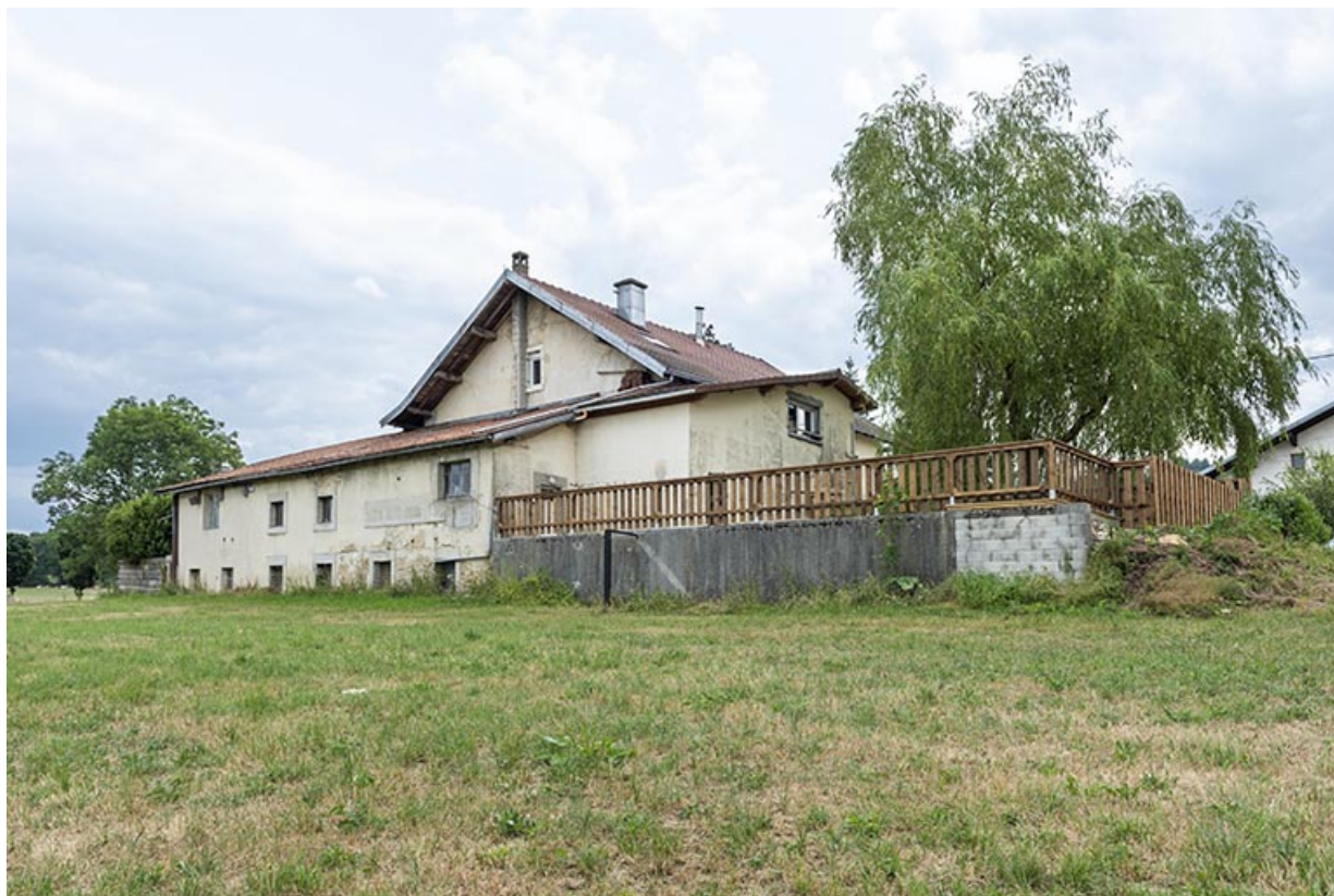
Pièce d'affinage sur la façade postérieure, de trois quarts droite.