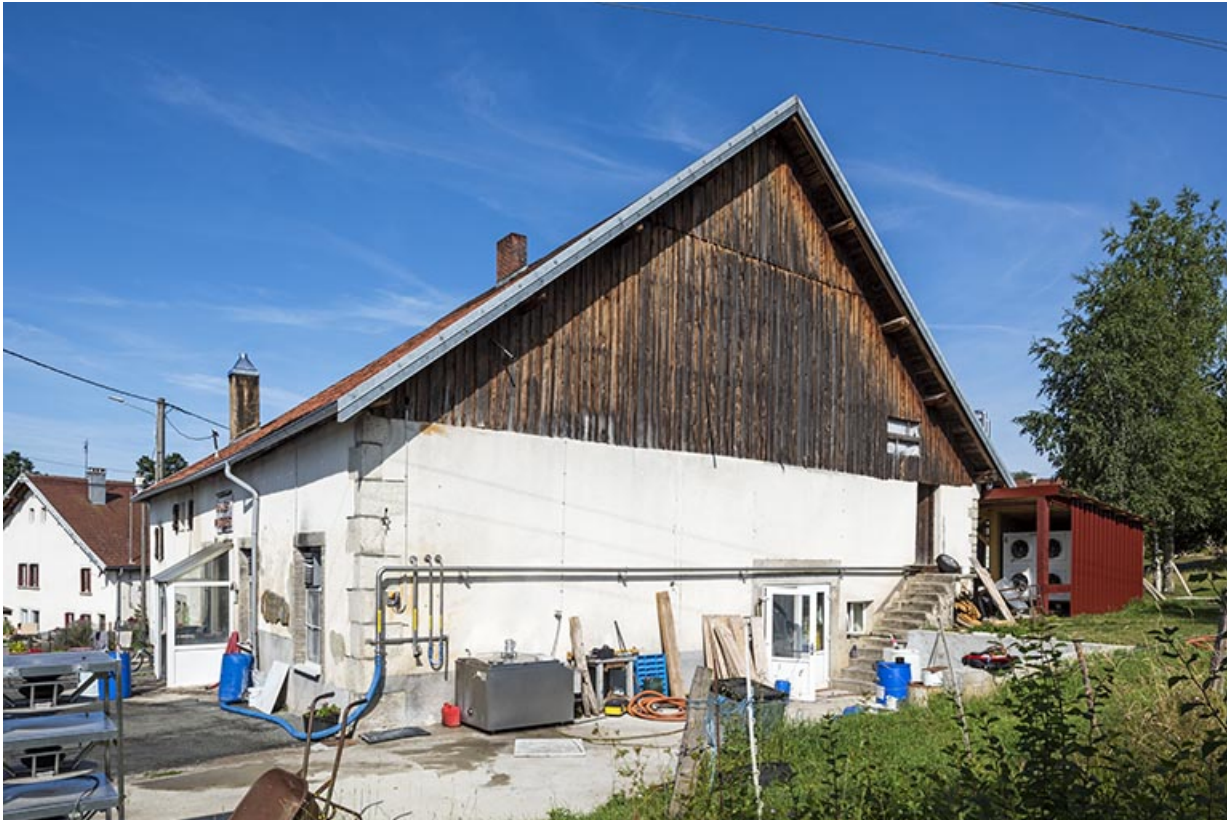
Façade latérale droite, de trois quarts.

25, Longeville-lès-Russey, 10 rue du Chalet