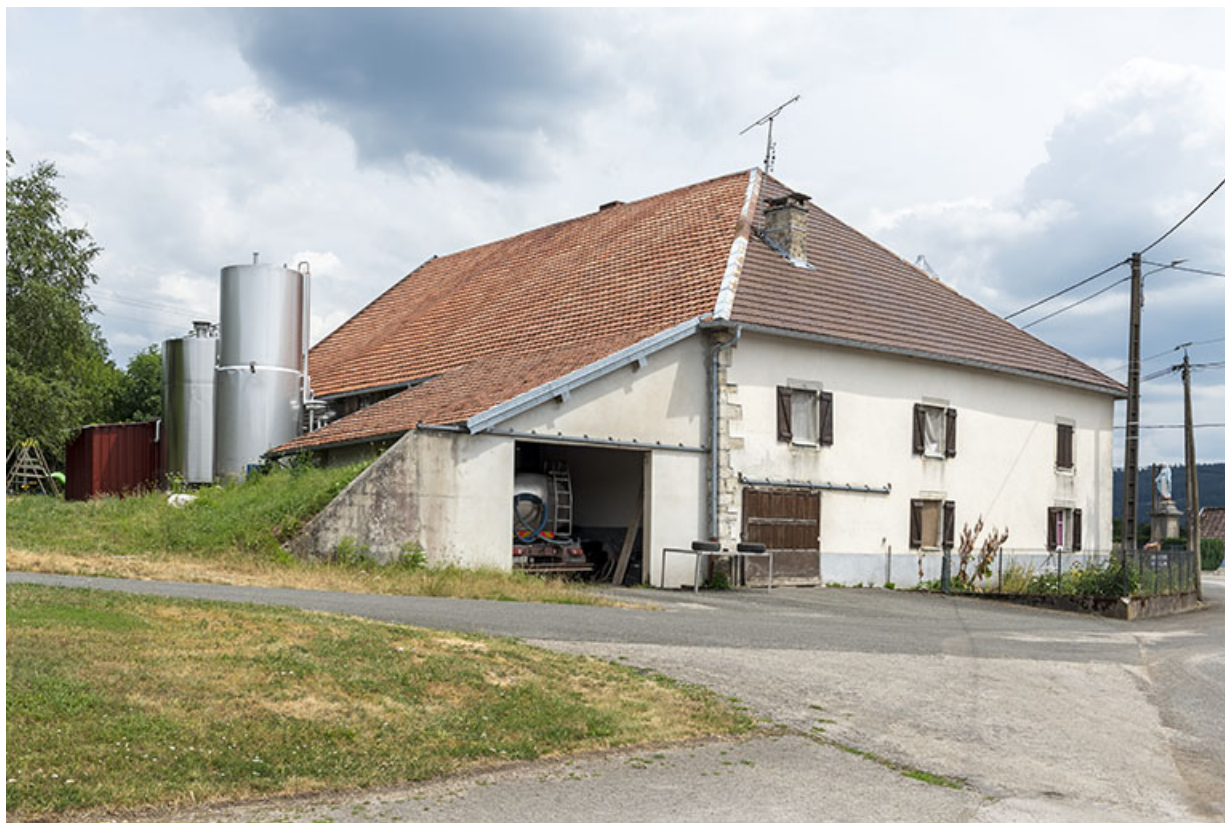
Façade latérale gauche, de trois quarts.

25, Longeville-lès-Russey, 10 rue du Chalet